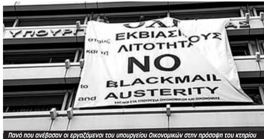
Πανό που ανέβασαν οι εργαζόμενοι του υπουργείου Οικονομικών στην πρόσοψη του κτηρίου

“Αν βγει το ΟΧΙ, από Δευτέρα να μην ξαναπατήσετε στη δουλειά”, ήταν οι απειλές των εργολάβων στους εργαζόμε-