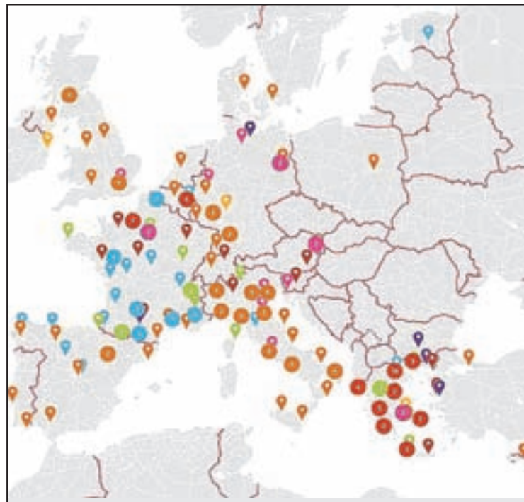
Πάνω: Το πρωτοφανές κίνημα συμπαράστασης απλώθηκε με εκατοντάδες συγκεντρώσεις σε όλη την Ευρώπη. Αριστερά: Η αφίσσα-πρωταγωνίστς του ΣΕΚ και της Εργατικής Αλληλεγγυής μεταφράστηκε και τυπώθηκε στη Σκωτία!