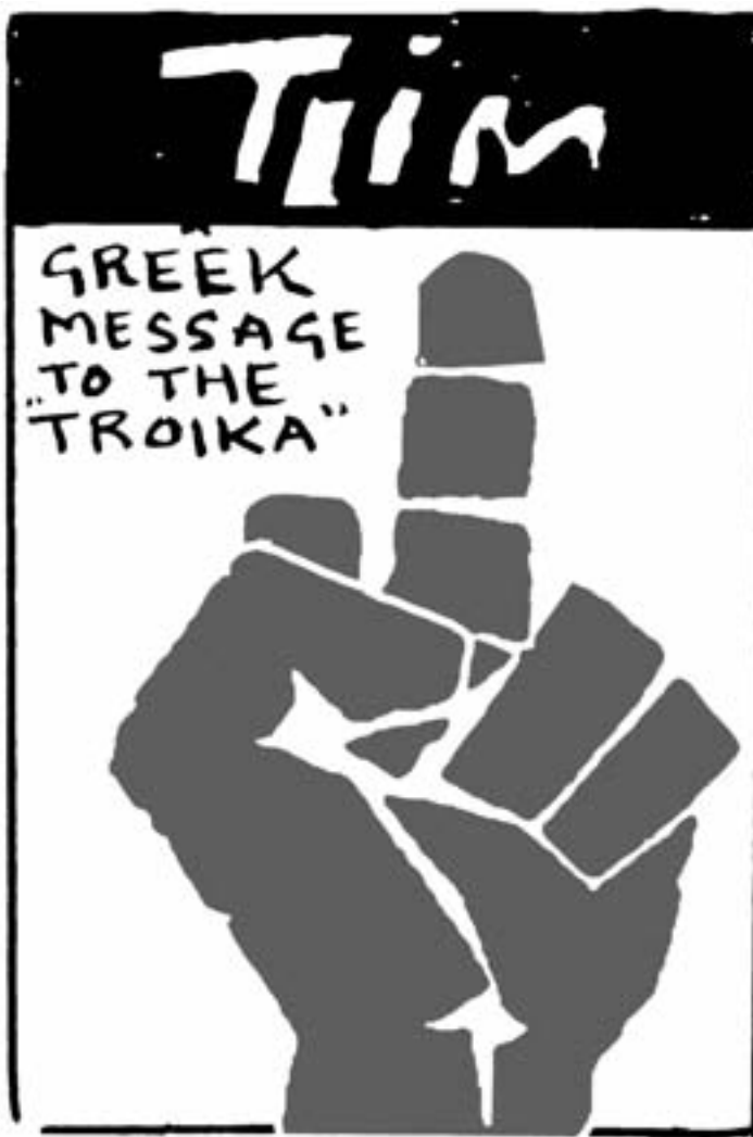
«Το ελληνικό μήνυμα στην τρόικα» γράφει το σκίτσο που ανέβασε στην εφημερίδα Socialist Worker της Αγγλίας, ο σκιτσογράφος Τιμ Βέβαια, ο πρώην υπουργός Οικονομικών Βαρουφάκης που είχε κατηγορηθεί ότι σήκωσε το μεσαίο δάκτυλο ενάντια στην τρόικα στην διάρκεια μιας ομιλίας του το 2013, βρίσκεται πλέον εκτός κυβέρνησης προκειμένου να «διευκολυνθεί» μια νέα συμφωνία. Όμως ο κόσμος που είπε το μεγάλο ΟΧΙ, ούτε να παραιτηθεί πρόκειται, ούτε να διευκολύνει ένα νέο μνημόνιο.

Ας αναρωτηθούμε πόσο αλήθεια ανέβαζε την υποστήριξη στο ΟΧΙ η δήλωση του Βαρουφάκη την Παρασκευή 3 Ιούλη: «Μια συμφωνία θα βρεθεί είτε ένα 'ναι' είτε ένα 'όχι' βγει από την κάλπη. Αν είναι 'ναι', τότε θα είναι μια κακή συμφωνία, οι τράπεζες θα ανοίξουν με μια κακή συμφωνία. Αν επικρατήσει το 'όχι', θα έχουμε μια άλλη