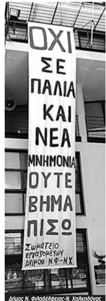
Δήμος Ν. Φιλαδέλφειας-Ν. Χαλκηδόνας