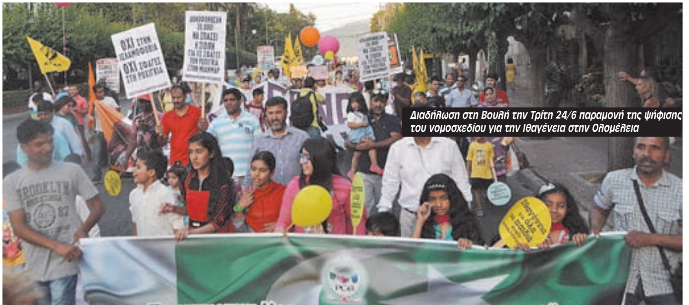
Διαδήλωση στη Βουλή την Τρίτη 24/6 παραμονή της ψήφισης του νομοσχεδίου για την Ιθαγένεια στην Ολομέλεια