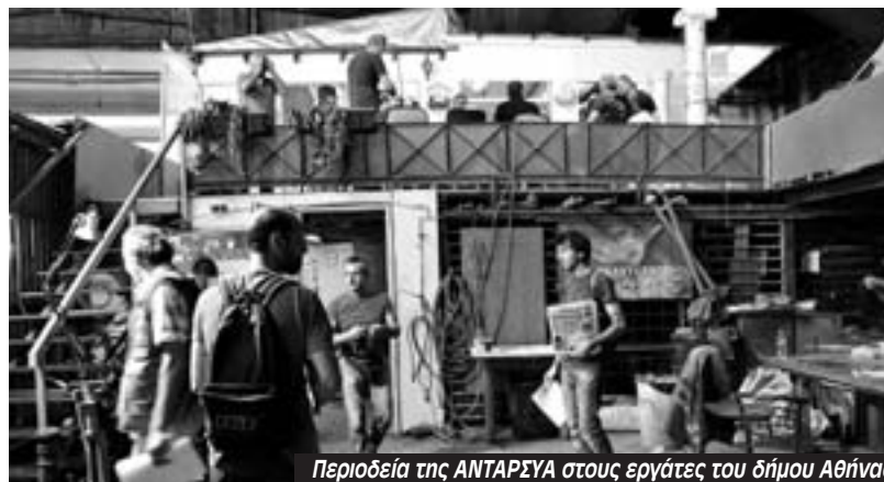
Περιοδεία της ANTAΡΣΥΑ στους εργαζόμενους του δήμου Αθήνας