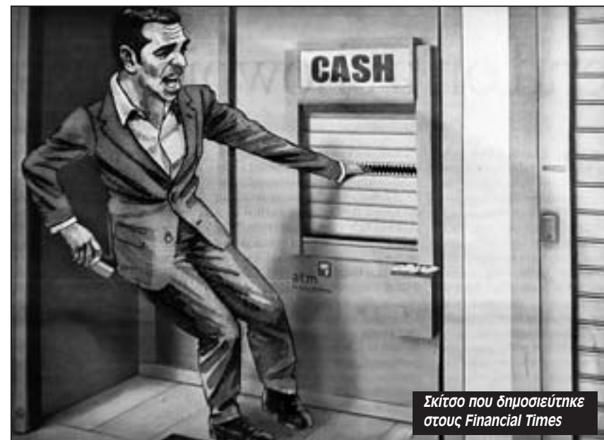
Σκίτσο που δημοσιεύτηκε στους Financial Times