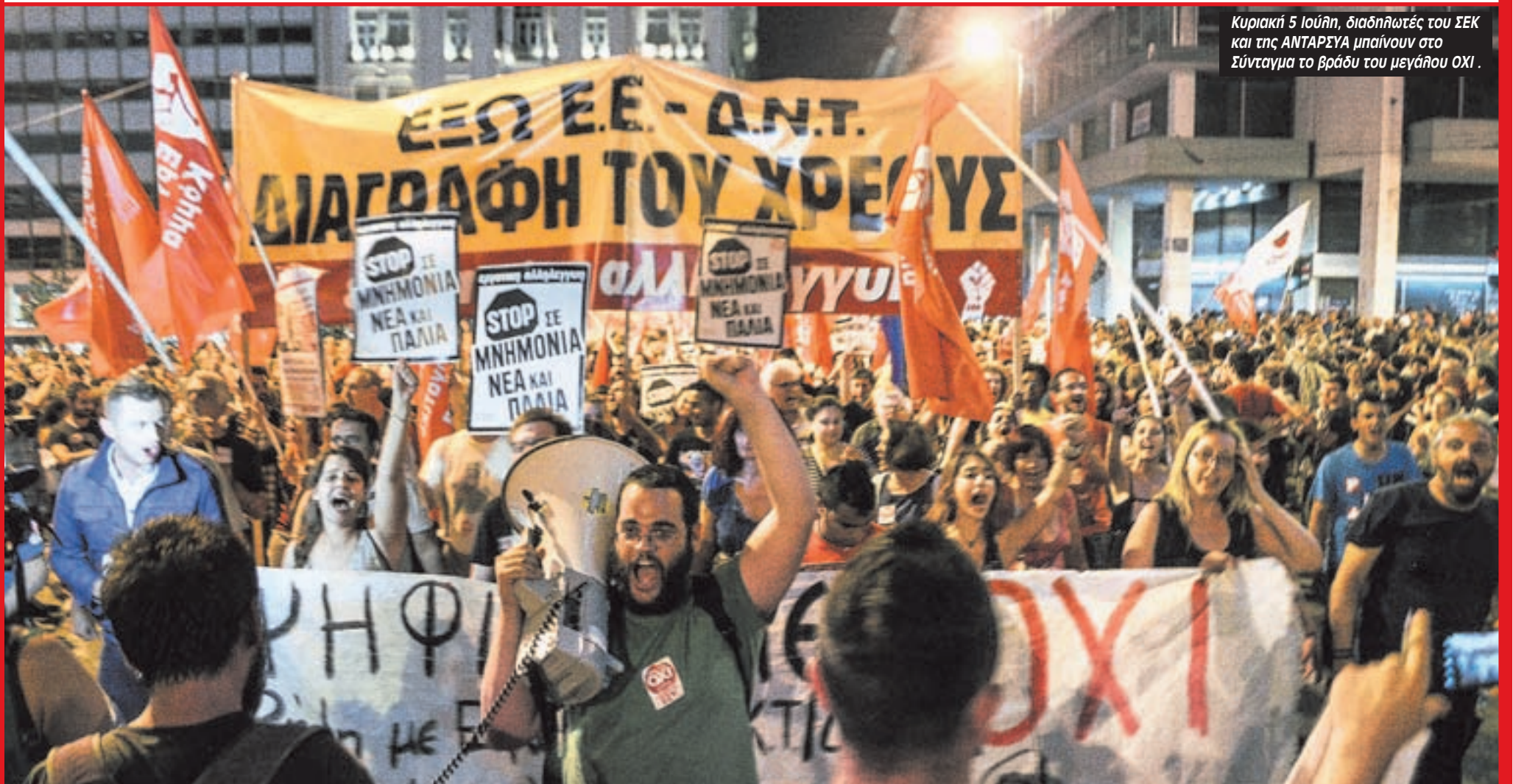
Κυριακή 5 Ιούλη, διαδηλωτές του ΣΕΚ και της ΑΝΤΑΡΣΥΑ μπαίνουν στο Σύνταγμα το βράδυ του μεγάλου ΟΧΙ.

Η μάχη του ΟΧΙ • στους χώρους • στους δρόμους • στην Αριστερά • σε όλο τον κόσμο