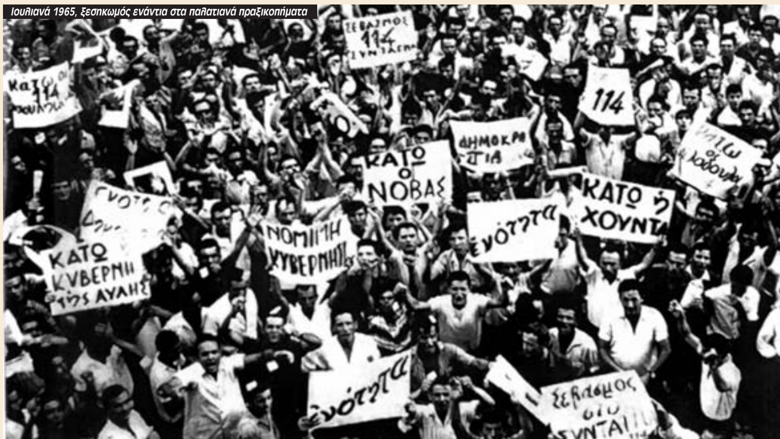
Ιουλιανιά 1965, ξεσηκωμός ενάντια στα παλατιανά πραξικοπήματα