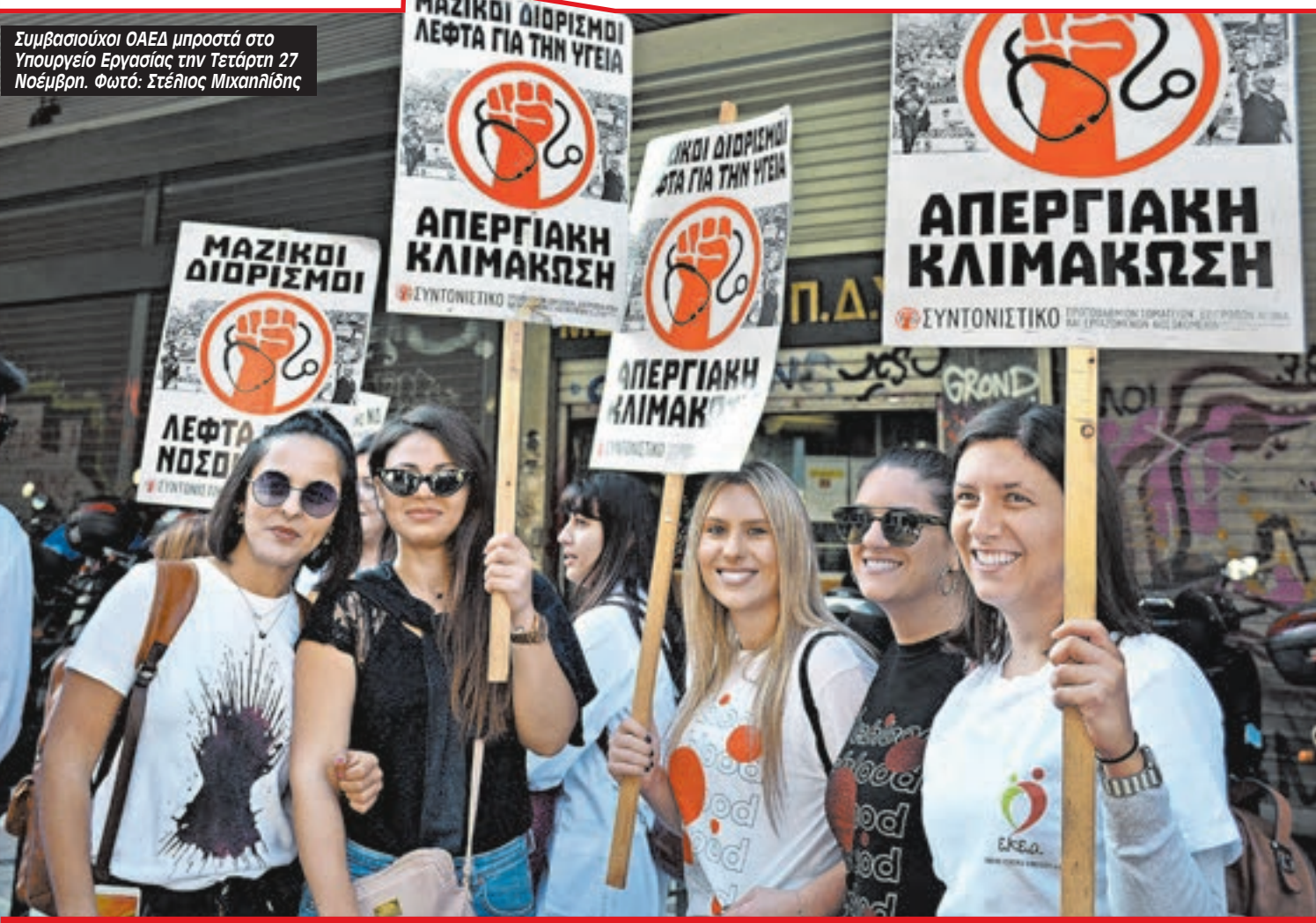
Συμβασιούχοι ΟΑΕΔ μπροστά στο Υπουργείο Εργασίας την Τετάρτη 27 Νοέμβρη.