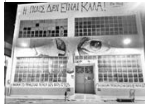
Γκράφιτι αλληλεγγύης στην εξέγερση της Χιλής.