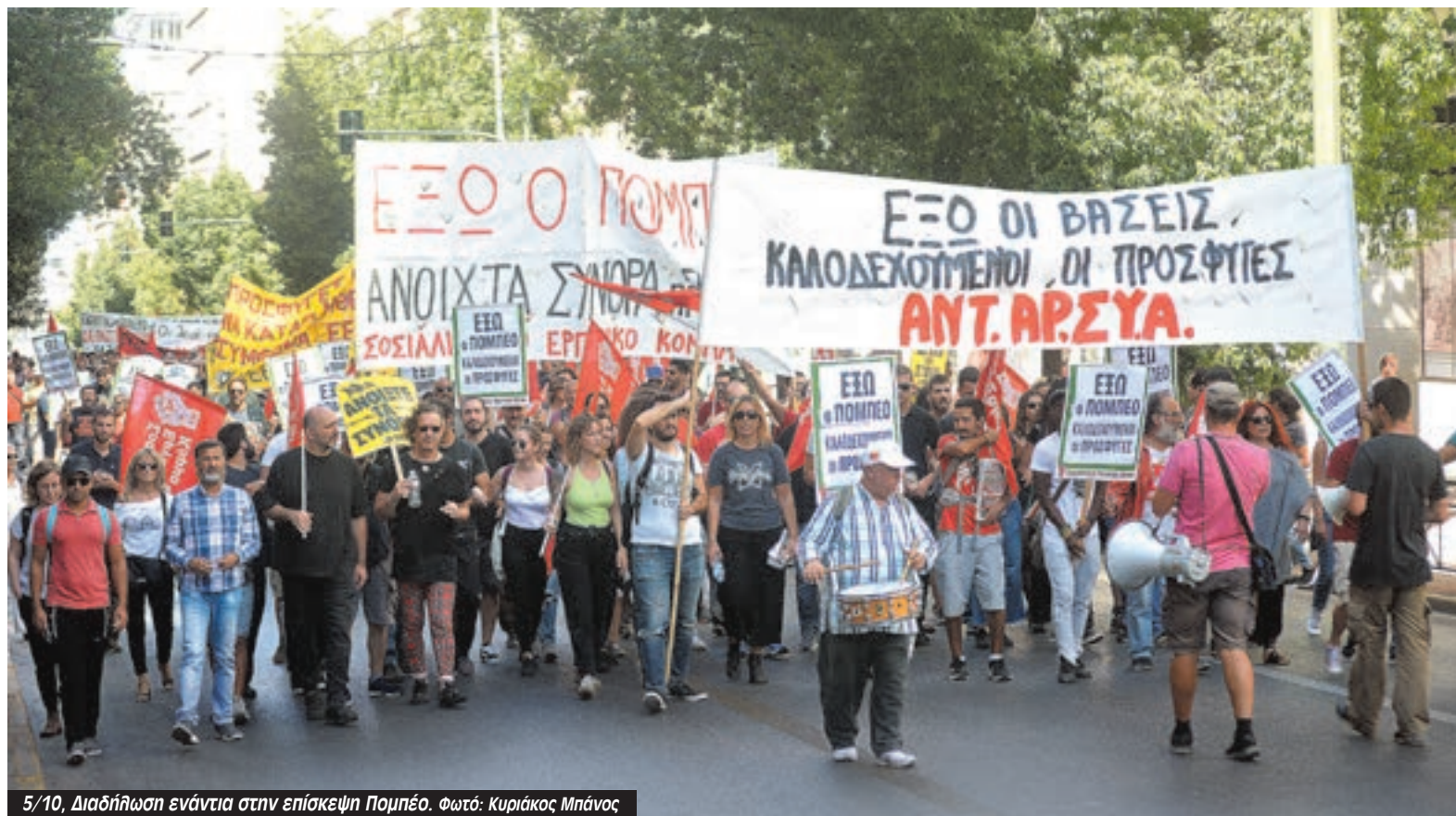
5/10, Διαδήλωση ενάντια στην επίσκεψη Πομπέο.