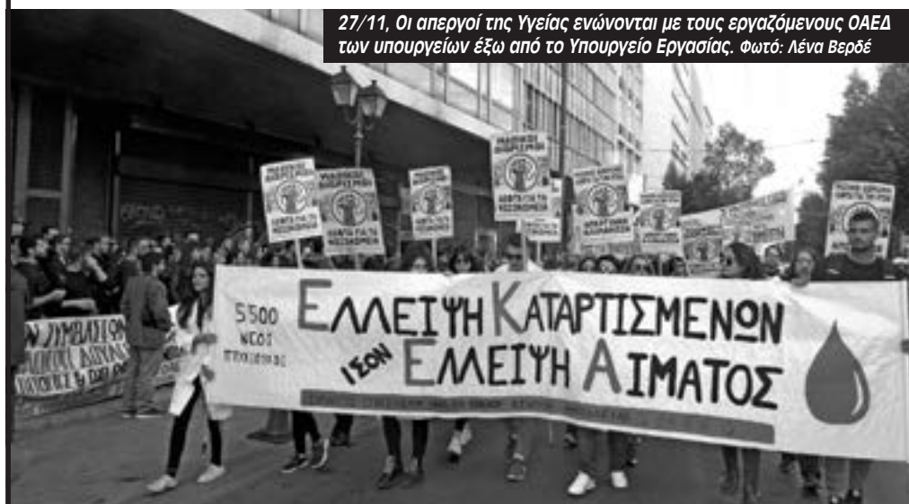
27/11, Οι απεργοί της Υγείας ενώνονται με τους εργαζόμενους ΟΑΕΔ των υπουργείων έξω από το Υπουργείο Εργασίας.

υπηρεσίες αυτές θα παραλύσουν. Και μιλάμε π.χ για εργαζόμενους στην Υγεία και άλλους νευραλγικούς τομείς όπου χάρη στην εργασία τη δική μας και συμβασιούχων άλλων προγραμμάτων, δεν έχουν καταρρεύσει και συνεχίζουν να λειτουργούν. Γι' αυτό επιμένουμε ότι χρειάζεται όχι μόνο να παραμείνουμε στη δουλειά αλλά να αποκτήσουμε μόνιμη και σταθερή σχέση εργασίας. Μην ξεχνάμε ότι το μπάλο των κενών με συμβασιούχους εργαζόμενους είναι μια πάγια τακτική τα τελευταία χρόνια.