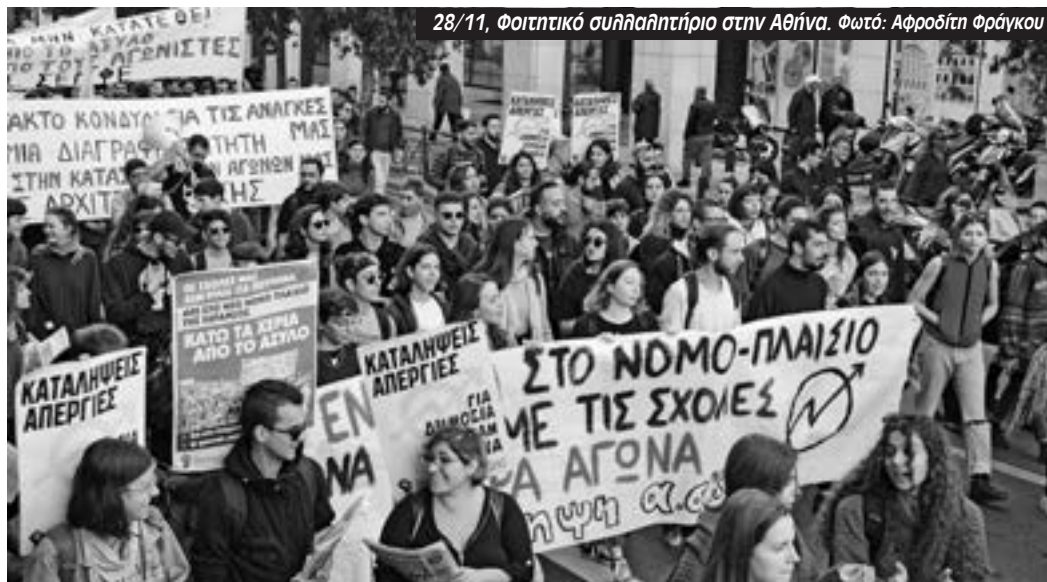
28/11, Φοιτητικό συλλαλητήριο στην Αθήνα.

Να μην τους αφήσουμε. Στο νέο γύρο γενικών συνελεύσεων να αποφασίσουμε συνέχεια των καταλήψεων, κλιμάκωση και συμμετοχή στα συλλαλητήρια στις 6 Δεκέμβρη, 11 χρόνια από