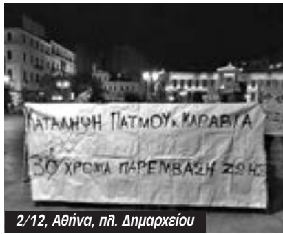
2/12, Αθήνα, πλ. Δημαρχείου

“Θα έπρεπε να κατέβει κάτω και να τους υποδεχτεί ο ίδιος ο δήμαρχος. Είναι απαράδεκτη η στάση της δημοτικής αρχής όπως απαράδεκτο είναι και το τελεσίγραφο του Χρυσοχοϊδη που στρέφεται ενάντια στο κίνημα των καταλήψεων, ένα κίνημα που εκφράζει κοινωνικές ανάγκες: Η κατάληψη Πά-