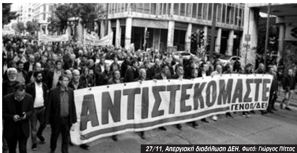
27/11, Απεργιακή διαδήλωση ΔΕΗ.

Ο Αλέκος Βερναρδάκης , συνταξιούχος της ΔΕΗ δήλωσε σχετικά με το νομοσχέδιο του Χατζηδάκη: “Ο Χατζηδάκης μας λέει προνομιούχους. Ξεχνάει σε τι συνθήκες εργάζονται οι συνάδελφοι στα ορυχεία ή οι εναερίτες στις βλάβες. Προσωπικά εργαζό-