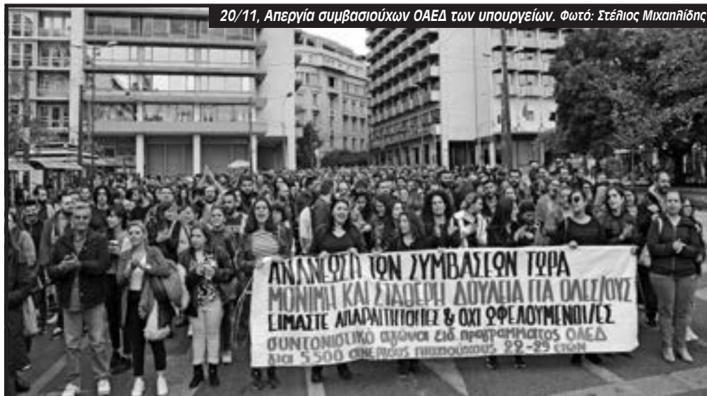
20/11, Απεργία συμβασιούχων ΟΑΕΔ των υπουργείων.

Ματίνα: Εργαζόμαστε σε μια σειρά τομείς του δημοσίου. Που σημαίνει ότι αν φύγουμε οι