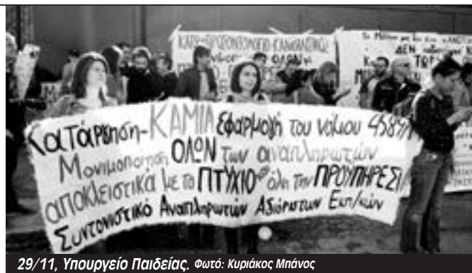
29/11, Υπουργείο Παιδείας.

Το συλλαλητήριο ήταν κομμάτι των αποφάσεων που είχαν