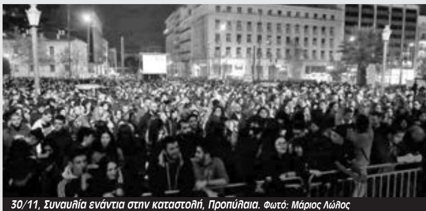
30/11, Συναυλία ενάντια στην καταστολή, Προπύλαια.

Ο αστυνομικός δεν ασχολήθηκε με το να ελέγξει τα στοιχεία κανενός εκ των επιβατών που έφεραν ελληνικές ταυτότητες παρά μόνο σε όσους φαινόταν αλλοδαποί. Σε μια εκ των επιβατών, η οποία φαινόταν αλλοδαπή και κρατούσε ένα χαρτί Α4 με τα στοιχεία της, ζητήθηκε να ακολουθήσει τον αστυνομικό στο περιπολικό, όπου και την επιβίβασαν. Σε ερώτηση προς τους αστυνομικούς για ποιο λόγο γίνεται αυτό, το όργανο που παρέμενε στο περιπολικό απάντησε πως απλώς διενεργούν έναν έλεγχο. Από τους επιβαίνοντες δεν ζητήθηκε να επιδείξουν εισιτήρια, ενώ ο έλεγχος δε έγινε παρουσία ελεγκτή που να φέρει μηχανήμα ελέγχου εισιτηρίων”.