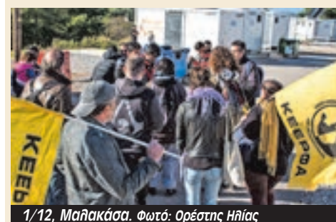
1/12, Μαλακάσα.