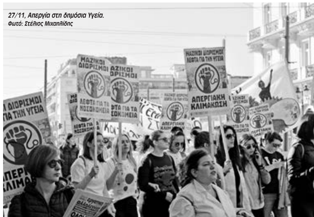
27/11, Απεργία στη δημόσια Υγεία.