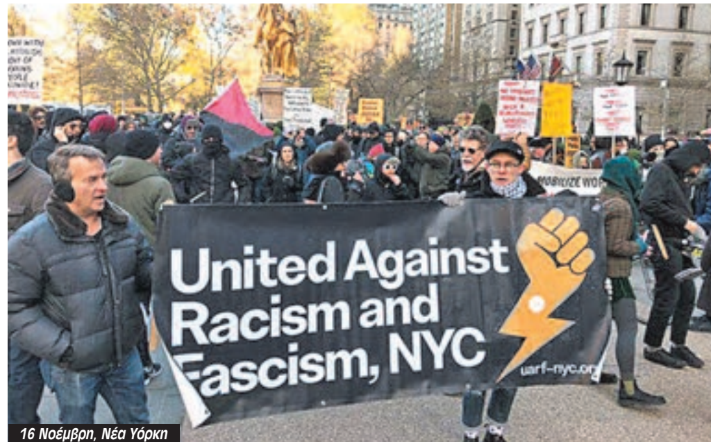
16 Νοέμβρη, Νέα Υόρκη

κρατεί συστηματικά τους μαύρους, τους λατίνους και τους μετανάστες στον υπόγειο. Η βαναυσότητά της έχει καταγραφεί ευρέως από συλλήψεις παιδιών που πουλάνε καραμέλες και γυναικών που πουλάνε τσούρο μέχρι γρονθοκοπήματα και τράβηγμα όπλων εναντίον μαύρων επιβατών. Αυτά τα περιστατικά είναι τόσο συχνά ώστε κάθε μέρα κάνει την εμφάνισή του και ένα καινούργιο βίντεο με ένα νέο περιστατικό αστυνομικής βίας.