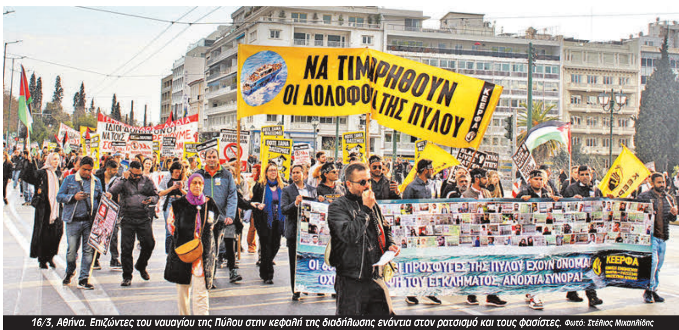
16/3, Αθήνα. Επιζώντες του ναυαγίου της Πύλου στην κεφαλή της διαδήλωσης ενάντια στον ρατσισμό και τους φασίστες.

Στόχος μας ενόψει της δίκης των εννέα και του ενός χρόνου από το έγκλημα είναι να δημιουργήσουμε ένα μέτωπο στα Πανεπιστήμια. Θα πάρουμε την πρωτοβουλία για νέες εκδηλώσεις με ομιλήτες από το ναυάγιο, για πικετοφορίες μέσα στις σχολές, για παρεμβάσεις στα μαθήματά μας. Ξεκινάμε με το που θα ανοίξουν οι σχολές μας με εκδήλωση στη Φιλοσοφική Αθήνας στις 15 Μάη, στο ΠΑΔΑ και την ΑΣΚΤ στις 16 Μάη. Το παράδειγμα του Κολούμπια που πυροδότησε διαδηλώσεις και κινητοποιήσεις στα πανεπιστήμια όλης της Αμερικής δείχνει ότι μπορούμε να τους ανατρέψουμε. Οι δισεκατομμυριοστές επενδυτές που δίνουν λεφτά σε αυτά τα πανεπιστήμια άρχισαν να αποκαλούν τους φοιτητές που μιλάνε για την Παλαιστίνη «τρελούς» και να απειλούν ότι θα αποσύρουν τα λεφτά τους. Καταδεικνύει τον πανικό που νιώθουν κάθε φορά που το φοιτητικό κίνημα εξεγείρεται και γίνεται ο πυροδότης των αγώνων.