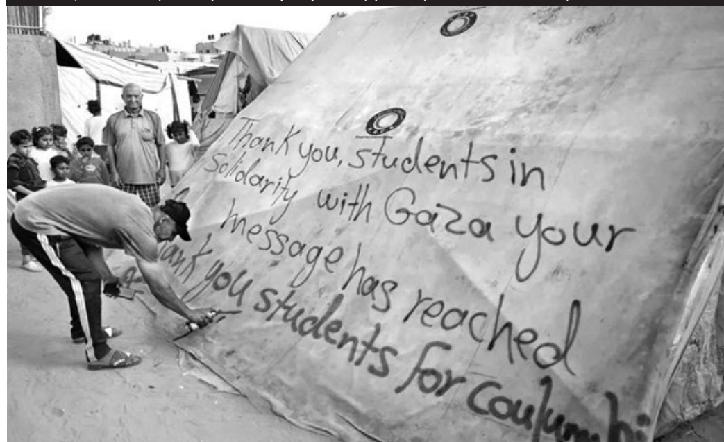
27/4, Παλαιστίνιος στη Ράφα στέλνει μήνυμα στους φοιτητές που διαδηλώνουν στις ΗΠΑ.

Υπογραφές στο κείμενο της MENA εδώ: https://tinyurl.com/8azb722e