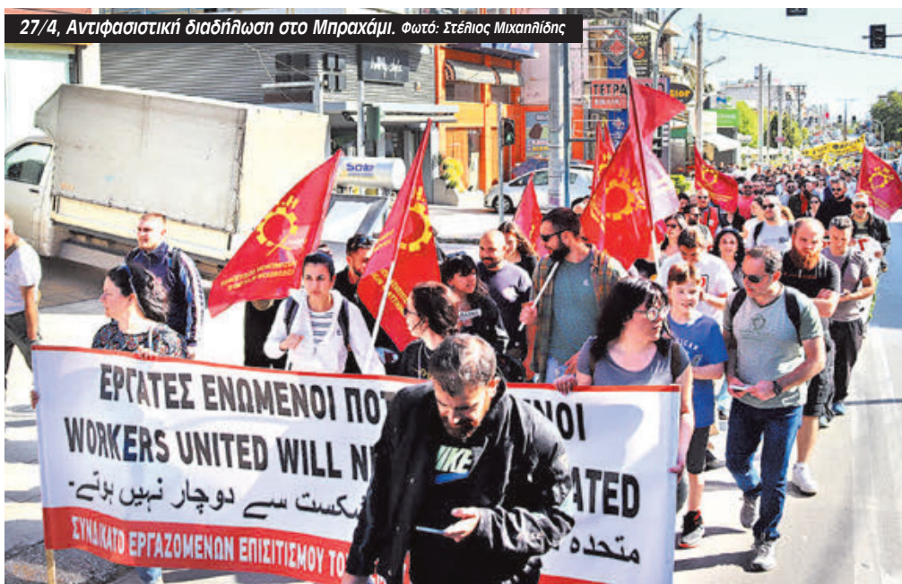
27/4, Αντιφασιστική διαδήλωση στο Μπραχάμι.

τόνισε ότι: «Θέλουμε άμεσα να συλληφθεί αυτός που έκανε την επίθεση. Αυτά που έλεγε όταν τον βάραιγε δείχνουν τα ρατσιστικά του κίνητρα και πρέπει να συλληφθεί και να τιμωρηθεί. Η αστυνομία δεν έπρεπε –όπως έκανε- να κάνει έλεγχο στον Σάχιντ αλλά να συλλάβει το δράστη. Έχουμε πολύ μεγάλη εμπειρία από το 2011-12 όταν σε εκατοντάδες περιπτώσεις που καταγγέλαμε ρατσιστικές επιθέσεις η αστυνομία έκανε πρώτα έλεγχο στα θύματα που μπορούμε και να χαροπάλευαν».