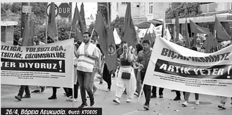
26/4, Βόρεια Λευκωσία.