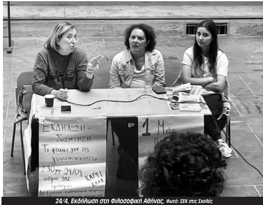
24/4, Εκδήλωση στη Φιλοσοφική Αθήνας.

νά, υποψήφια διδακτορίσα, έβαλε το ζήτημα της έμφυλης εμπειρίας και πώς ο λόγος που υιοθετούμε διαμορφώνει τις ιδέες μας.