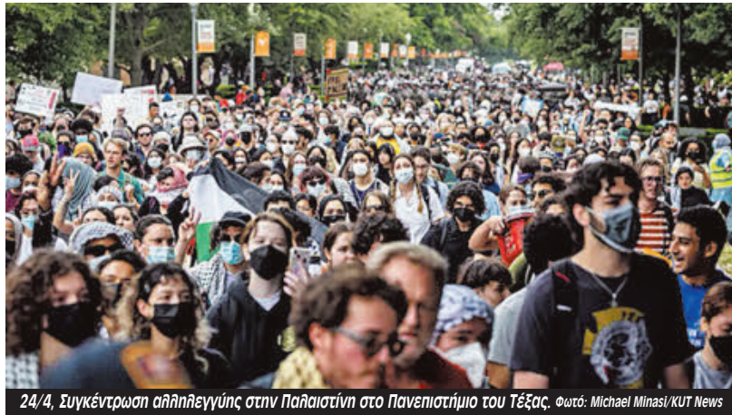
24/4, Συγκέντρωση αλληλεγγύης στην Παλαιστίνη στο Πανεπιστήμιο του Τέξας.

Η κυβέρνηση Μπάιντεν προσπάθησε να διασκεδάσει τις εντυπώσεις από την επιχείρηση καταστολής με τον εκπρόσωπο του Λευκού Οίκου Κίρμπι να δηλώνει: «Σεβόμαστε το δικαίωμα των ειρηνικών διαδηλώσεων». Αλλά οι επιθέσεις των ειδικών δυνάμεων με κλομπ, χημικά, τείζερ, έφιππη αστυνομία, (Τέξας), σφαίρες καουτσούκ (πανεπιστήμια Νότιας Καλιφόρνια και Έμεριτ στην Τζόρτζια), ελεύθερους σκοπευτές στην οροφή κτιρίων (πανεπιστήμιο Οχάιο και Πανεπιστήμιο Μπλούμινγκτον στην Ιντιάνα) δεν αφή-