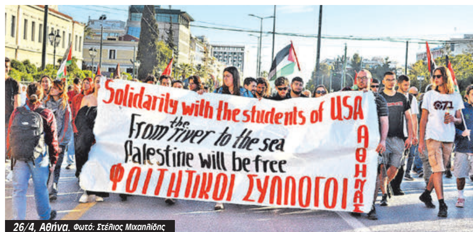
26/4, Αθήνα.

Καμιά τρομοκρατία δεν μπορεί να ανακόψει τον αγώνα των φοιτητών και του λαού. Δεν τρομοκρατούμαστε! Δεν θα περάσει η προσπάθεια φίμωσης κάθε φωνής που διεκδικεί μια ζωή με αξιοπρέπεια κόντρα στην πολιτική κυβέρνηση και συστήματος». Μαζική συγκέντρωση έγινε το ίδιο απόγευμα έξω από τοπικό αστυνομικό τμήμα.