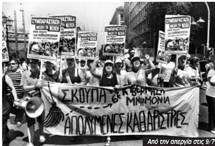
Από την απεργία στις 9/7

“Κατά τις 4μμ πήγαμε στο υπ. Οικονομικών στην οδό Νίκης να φωνάξουμε συνθήματα, επειδή μάθαμε ότι θα ερχόταν η Τρόικα. Η αστυνομία ήταν κατευθείαν πολύ επιθετική. Άρχισαν να μας σπρώχνουν και να μας χτυπάνε. Ένας από τους αστυνομικούς, ένα ντερέκι, γομάρι κανονικό, άρχισε να φωνάζει ‘τι τις κοιτάτε ρε, βάλτε τα κράνη σας και πάρτε τες από δω’. Είχαν αρχίσει ήδη να μας ορμάνε και να μας επιτίθενται πολύ άσχημα. Κάποια στιγμή, δεν ξέρω για ποιο λόγο άρχισε να μου φωνάζει ‘τι χτυπάς;’. Έψαχνε με λίγα λόγια κάποιον να ενοχοποιήσει και να συλλάβει. Κάποια στιγμή με βουτάει από τα χέρια βάνουσα και φωνάζει ‘να συλληφθεί η κυρία’. Με τράβηξαν από την άλλη και οι συναδέλφισσες να με απεγκλωβίσουν, κάποια στιγμή κατάφερα να γυρίσω πλάτη και να απεγκλωβίσω τα χέρια μου. Με γραπώνει από την πλάτη με τα χέρια του σαν μέγγενη κι αρχίζει να με σφίγγει πάρα πολύ δυνατά, προκαλώντας κακώσεις στα