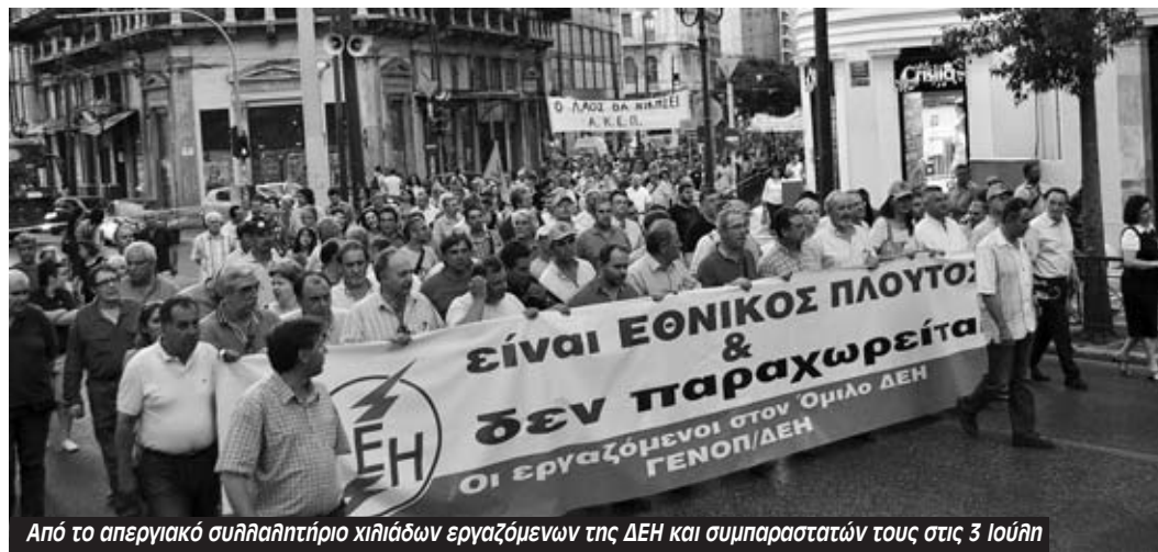
Από το απεργιακό συλλαλητήριο χιλιάδων εργαζόμενων της ΔΕΗ και συμπαραστών τους στις 3 Ιουλίου

Οι εργαζόμενοι στη ΔΕΗ όμως δεν ήταν σε καμία στιγμή μόνοι τους. Δεν ήταν μόνοι τους στο μεγάλο συλλαλητήριο στις 3/7 στην Αθήνα, αλλά μαζί με χιλιάδες συμπαραστάτες. Δεν ήταν μόνοι τους σε όλη τη Βόρεια Ελλάδα αφού σύσσωμες οι τοπικές κοινωνίες βρέθηκαν στο πλευρό των απεργών της ΔΕΗ. Την ίδια μέρα με την ψήφιση του νομοσχεδίου και του συλλαλητηρίου, στις 9/7, απεργούσε όλο το δημόσιο ενάντια στην "αξιολόγηση", τις διαθεσιμότητες και τις απολύσεις, με μεγάλα ποσοστά συμμετοχής και μαζικές διαδηλώσεις. Αντί για τη μετατροπή της 9/7 σε Γενική Απεργία, ΓΣΕΕ και ΓΕΝΟΠ αποφάσισαν να καλέσουν σε απογευματινό συλλαλητήριο έχοντας κλείσει την απεργία στη ΔΕΗ.