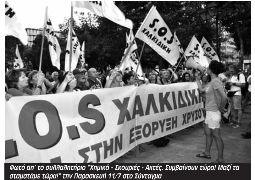
Φωτό απ' το συλλαλητήριο "Χημικά - Σκουριές - Ακτές. Συμβαίνουν τώρα! Μαζί τα σταματάμε τώρα!" την Παρασκευή 11/7 στο Σύνταγμα

σαν να στήνονται πανό στην πλατεία από τους φορείς και τις συλλογικότητες. Πρώτη θέση μπροστά στην εξέδρα είχαν οι ηρωικοί κάτοικοι των Σκουριών και στο πλευρό τους οι καθαρίστριες του Υπουργείου Οικονομικών που φώναζαν συνθήματα μαζί.