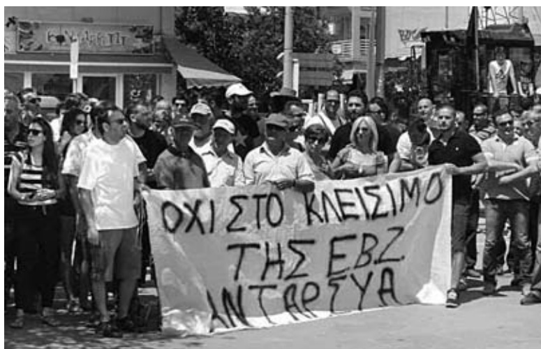
Συγκέντρωση ενάντια στο κλείσιμο των εργοστασίων της ΕΒΖ, τη Δευτέρα 14/7 στην Ορεστιάδα

Το πρόβλημα είναι ότι η πολιτική της ΕΕ και των κυβερνήσεων τα τελευταία χρόνια έχουν οδηγήσει σε μείωση της παραγωγής ζάχαρης με αποτέλεσμα τα εργοστάσια να παρουσιάζουν ζημιές. Σταμάτησαν κάθε επιδότηση στην παραγωγή ζαχαρότευπλων με αποτέλεσμα χιλιάδες αγρότες να εγκαταλείψουν την καλλιέργειά τους. Το 2007, το Συμβούλιο υπουργών Γεωργίας της ΕΕ υιοθέτησε την πρόταση της Κομισιόν να μπορούν να δίνονται επιπλέον κίνητρα - επιδοτήσεις