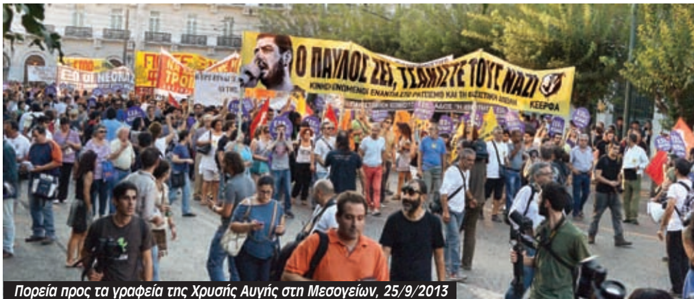
Πορεία προς τα γραφεία της Χρυσής Αυγής στη Μεσογείων, 25/9/2013