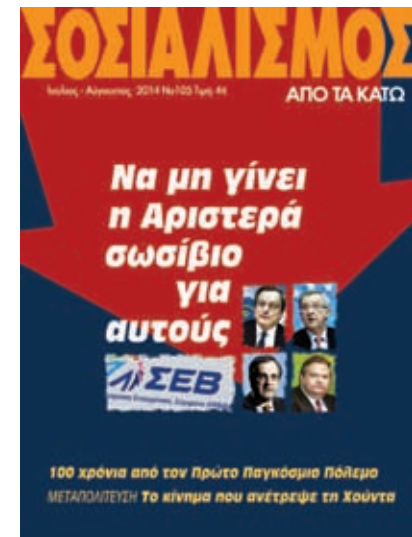
Αφιέρωμα στη Μεταπολίτευση θα βρείτε και στο «Σοσιαλισμό από τα Κάτω» που κυκλοφορεί