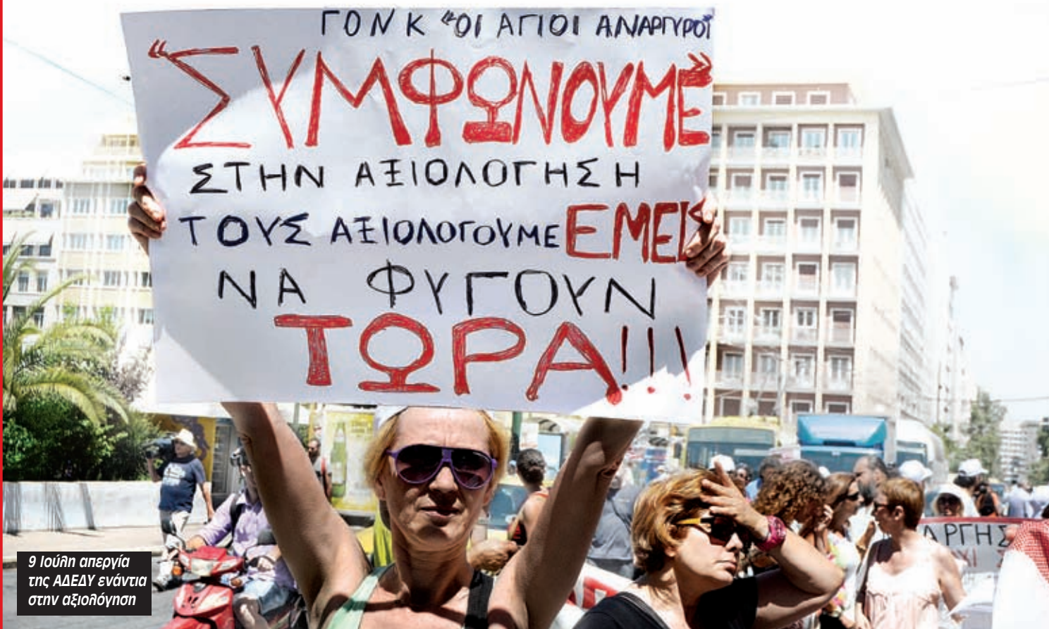
9 Ιούλη απεργία της ΑΔΕΔΥ ενάντια στην αξιολόγηση