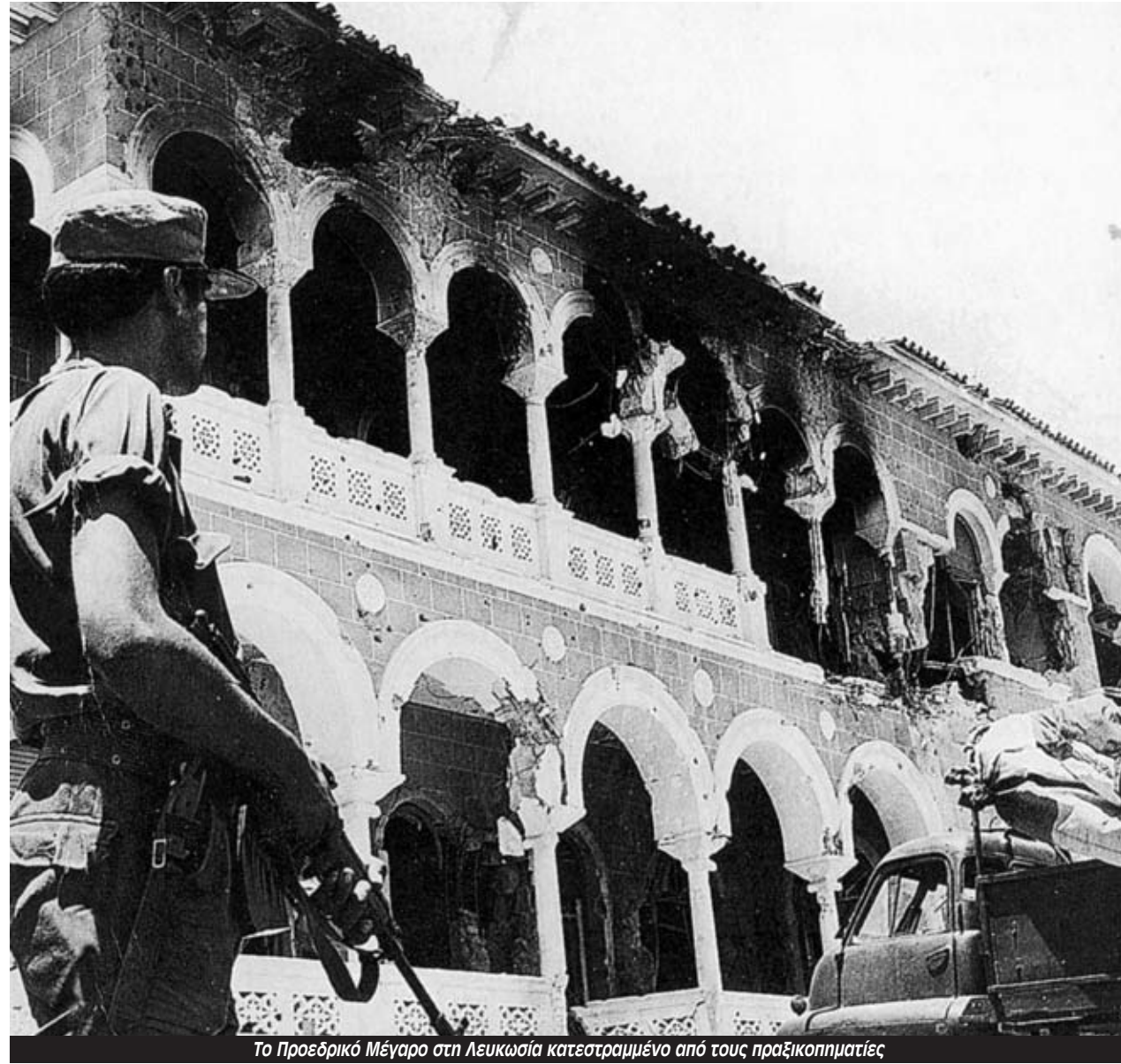
Το Προεδρικό Μέγαρο στη Λευκωσία κατεστραμμένο από τους πραξικοπηματίες

Αυτή η κόντρα είχε παρελθόν. Μέχρι τις αρχές της δεκαετίας του '50 η Κύπρος ήταν σχεδόν άγνωστη λέξη για τους πολιτικούς της Ελλάδας και