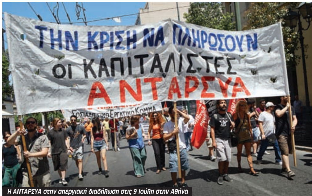
Η ΑΝΤΑΡΣΥΑ στην απεργιακή διαδήλωση στις 9 Ιουλίου στην Αθήνα

Διαμορφώνεται και μέσα στην ΑΝΤ.ΑΡ.ΣΥ.Α. ένα ρεύμα κριτικής υποστήριξης. Και δεν διατυπώνεται ευθέως, πράγμα που θα συγκεκριμενοποιούσε και θα διευκόλυνε τη συζήτηση, αλλά μέσα από φλύαρα κείμενα αναλύσεων επί παν-