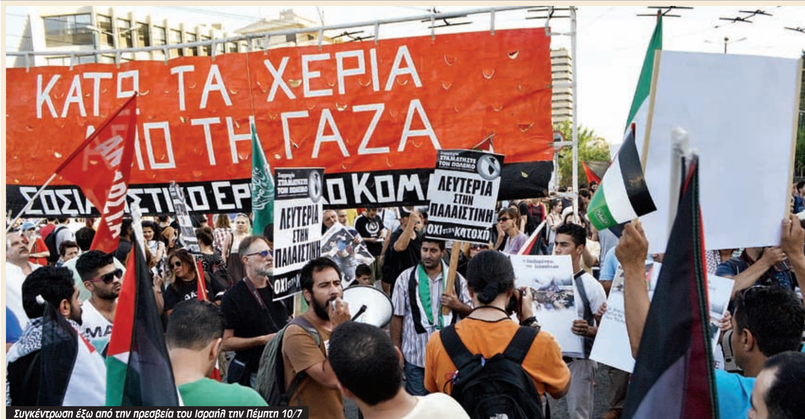
Συγκέντρωση έξω από την πρεσβεία του Ισραήλ την Πέμπτη 10/7