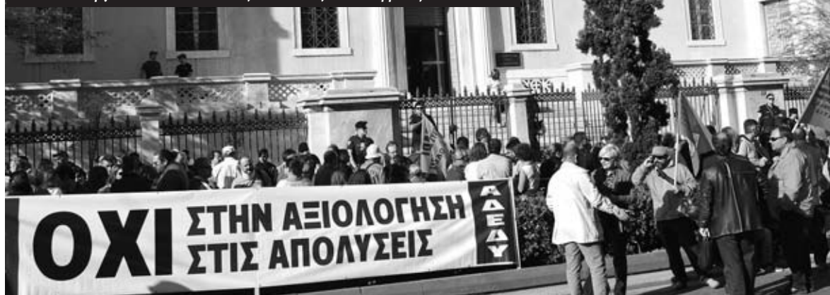
Από την απεργιακή κινητοποίηση της ΑΔΕΔΥ στις 10 Οκτώβρη έξω από το ΣτΕ

ολόκληρη την τοποθέτησή του για να επιτεθεί στις Παρεμβάσεις που πρότειναν κλιμάκωση με επαναλαμβανόμενες απεργίες χρησιμοποιώντας όποιο αντιδραστικό επιχείρημα υπάρχει. Κατέληξε να λέει ότι η πρόταση των Παρεμβάσεων είναι υποταγμένη στην « τυραννία της μορφής » των κινητοποιήσεων και ότι πρέπει « να λαμβάνουμε υπόψη μας την κοινωνική πραγματικότητα και τις συνθήκες » κι όχι να ρέπουμε στον «βολονταρισμό» .