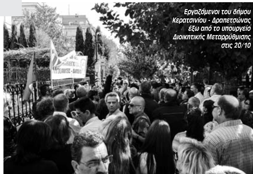
Εργαζόμενοι του δήμου Κερατσινίου - Δραπετσώνας έξω από το υπουργείο Διοικητικής Μεταρρύθμισης στις 20/10

Πριν σχεδόν 10 χρόνια μονιμοποιήθηκαν χιλιάδες εργαζόμενοι κι έτσι έπρεπε. Για την ακρίβεια, έπρεπε να μονιμοποιηθούν ακόμα περισσότεροι. Αυτή τη στιγμή έρχεται ο φασισ-