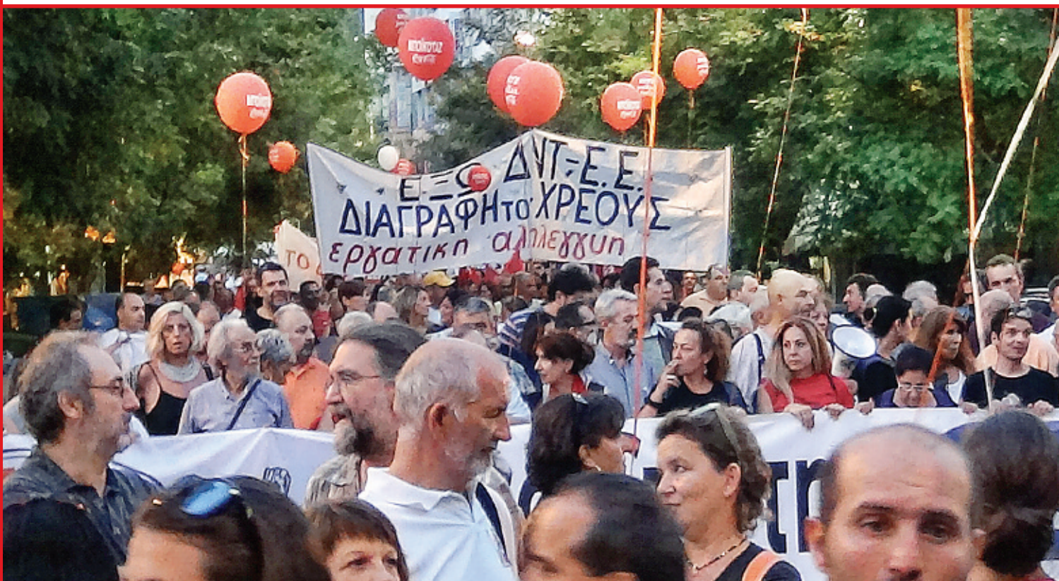
Διαγραφή του χρέους γράφει το πανό της Εργατικής Αλληλεγγύης. Η φωτο από το συλλαλητήριο στη Θεσσαλονίκη τον Σεπτέμβρη

Εκδηλώσεις για τα 70 χρόνια από την Απελευθέρωση