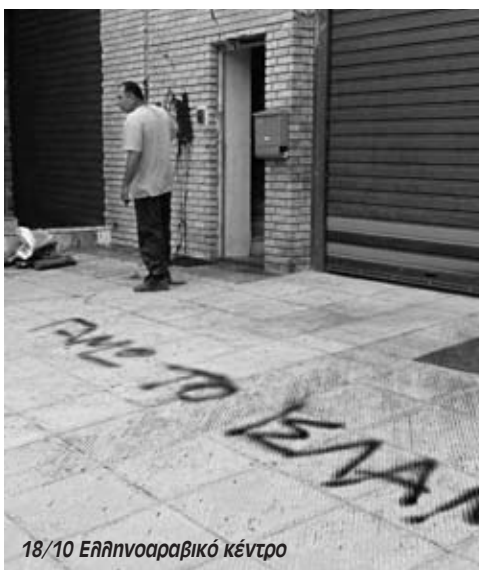
18/10 Ελληνοαραβικό κέντρο

“Ηρθε η αντιρατσιστική υπηρεσία και κατέγραψε το περιστατικό, θέλουμε να βρεθούν οι δράστες” τόνισε στην Εργατική Αλληλεγγύη ο Ναϊμ Ελγαντούρ. “Είναι αποτέλεσμα της κατάστασης που επικρατεί