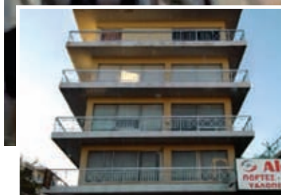
Από την αντιφασιστική πορεία στα γραφεία της Χρυσής Αυγής στο Μαρούσι, την Πέμπτη 16/10. Στη μικρή φωτό τα κλειστά γραφεία δύο μέρες μετά

Ε κατοντάδες συμμετείχαν σε μια ακόμα μαζική αντιφασιστική κινητοποίηση ενάντια στην παρουσία γραφείων της Χρυσής Αυγής στο Μαρούσι. Η συγκέντρωση πραγματοποιήθηκε το απόγευμα της Πέμπτης 16/10, στο σταθμό του ΗΣΑΠ Αμαρουσίου κι ακολούθησε πορεία μέχρι τα γραφεία των νεοναζι στη λεωφ. Κηφισίας.