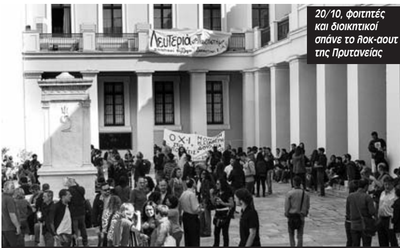
20/10, φοιτητές και διοικητικοί σπάνε το λοκ-άουτ της Πρυτανείας

“Νέος γύρος συνελεύσεων ξεκινάει αυτή την εβδομάδα στα πανεπιστήμια του Βόλου. Αυτή ήταν και η από-