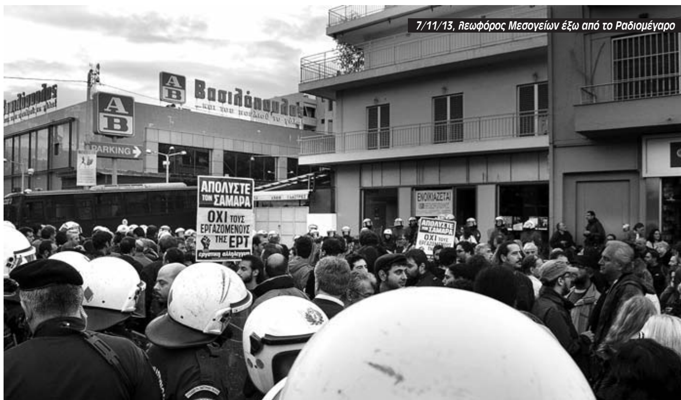
7/11/13, λεωφόρος Μεσογείων έξω από το Ραδιομέγαρο