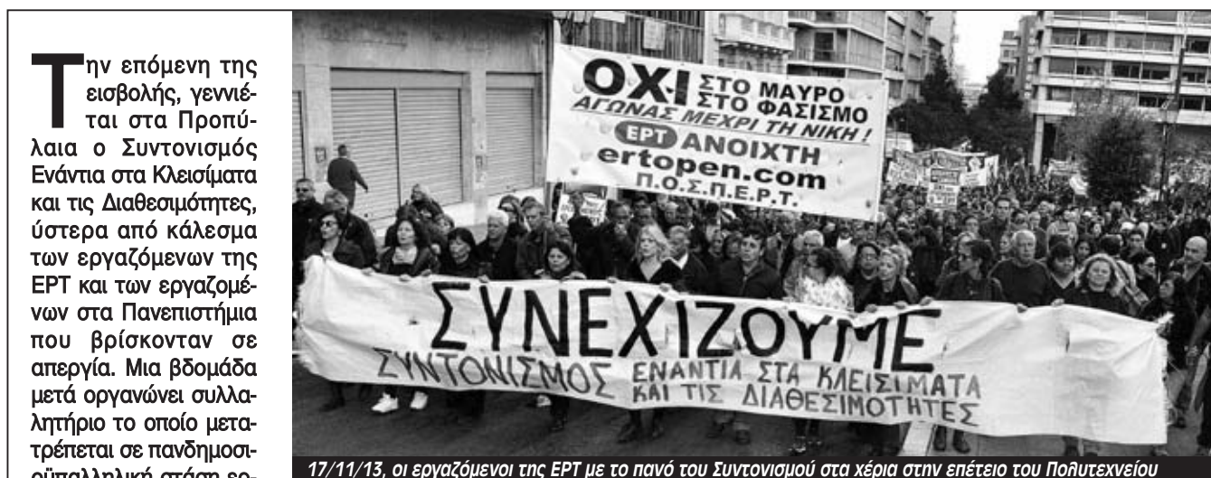
17/11/13, οι εργαζόμενοι της ΕΡΤ με το πανό του Συντονισμού στα χέρια στην επέτειο του Πολυτεχνείου

Την επόμενη της εισβολής, γεννιέται στα Προπύλαια ο Συντονισμός Εναντίον στα Κλεισίματα και τις Διαθεσιμότητες, ύστερα από κάλεσμα των εργαζομένων της ΕΡΤ και των εργαζομένων στα Πανεπιστήμια που βρίσκονταν σε απεργία. Μια βδομάδα μετά οργανώνει συλλαλητήριο το οποίο μετατρέπεται σε πανδημοσιούπαλληλική στάση εργασίας με χιλιάδες διαδηλωτές.