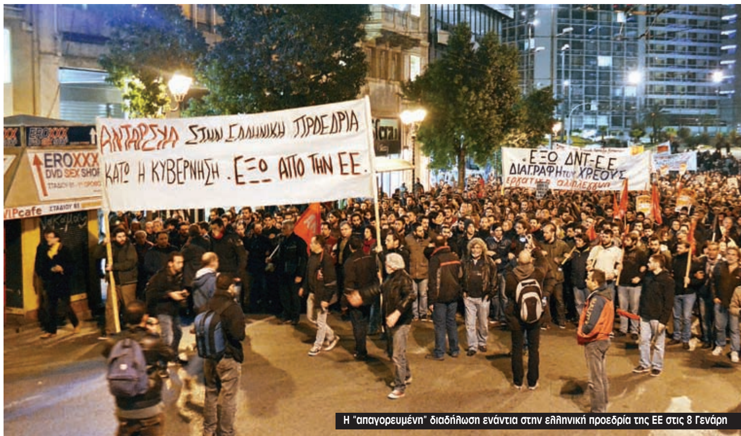
Η "απαγορευμένη" διαδήλωση ενάντια στην ελληνική προεδρία της ΕΕ στις 8 Γενάρη