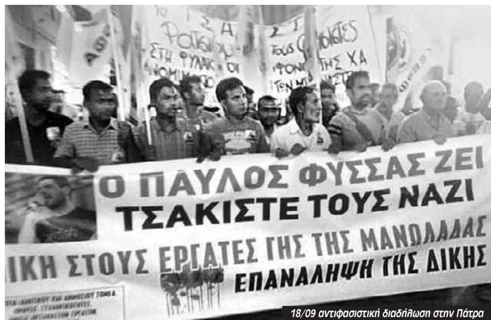
18/09 αντιφασιστική διαδήλωση στην Πάτρα

Μόλις χθες (Σάββατο 18/10) αργά το απόγευμα, κλιμάκιο της “Κίνησης Υπεράσπισης Δικαιωμάτων Προσφύγων και Μεταναστών Πάτρας” μαζί με μέλος του συντονιστικού της ΚΕΕΡΦΑ που δραστηριοποιείται στην περιοχή, επισκέφθηκαν το λεγόμενο “μπαγκλαντζικο παζάρι” και ενημέρωσαν διεξοδικά όλους τους παρευρισκόμενους για τον κίνδυνο σύλληψης που διατρέχουν ειδικά αυτή την περίοδο από την εφαρμογή της οδηγίας της Ε.Ε με την κωδική ονομασία MOS MAIORUM . Πρόκειται για μια αλάνα στο τέρμα του δρόμου που κάθε Κυριακή γίνεται μια από τις μεγαλύτερες λαϊκές αγορές στο νομό Ηλείας. Κάθε απόγευμα εκεί, κάνουν τη “βόλτα” τους και συναντιούνται εκατοντάδες μετανάστες εργάτες γης που διαμένουν και εργάζονται στην περιοχή.