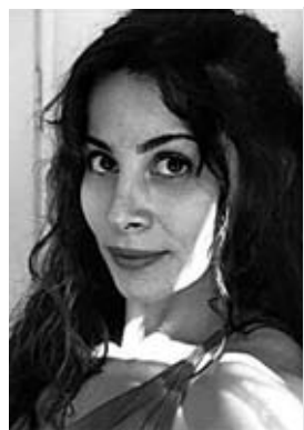
ΠΙΤΤΑ ΑΝΝΑ (ΤΑΤΙΑΝΑ) ηθοποιός