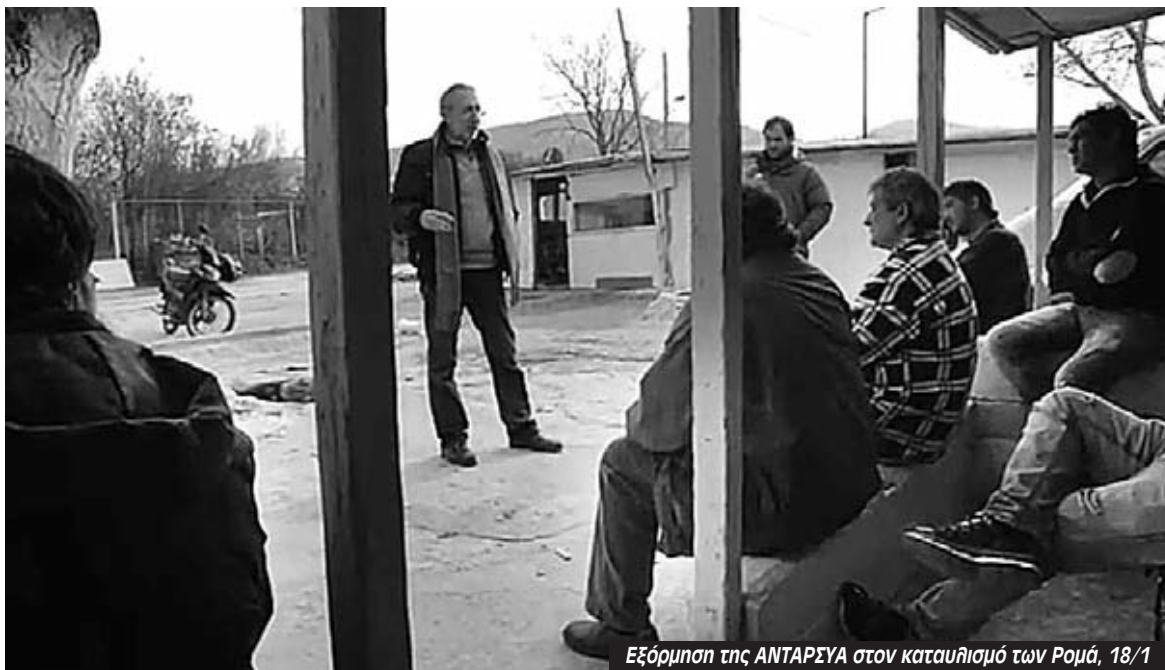
Εξόρμηση της ANΤΑΡΣΥΑ στον καταυλισμό των Ρομά, 18/1

Παρακάτω μπορείτε να πάρετε μια μικρή γεύση από την καμπάνια στήριξης της ANΤΑΡΣΥΑ.