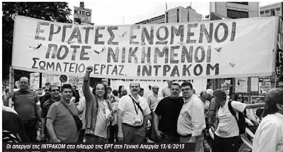
Οι απεργόι της INTRACOM στο πλευρό της ΕΡΤ στη Γενική Απεργία 13/6/2013