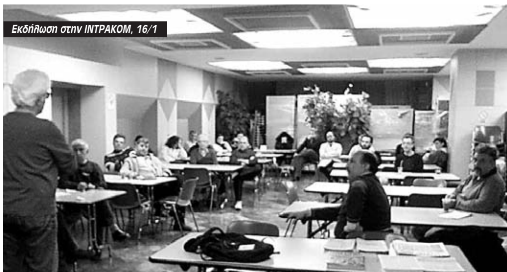
Εκδήλωση στην INTRAKOM, 16/1

Δείτε βίντεο από την επίσκεψη στον καταυλισμό στο www.sekonline.gr