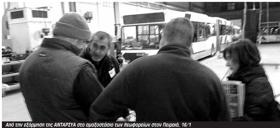
Από την εξόρμηση της ANΤΑΡΣΥΑ στο αμαξοστάσιο των ηεωφορείων στον Πειραιά, 16/1