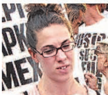
ΑΡΓΥΡΗ ΝΙΚΗ Συντονιστική Επιτροπή ΚΕΕΡΦΑ