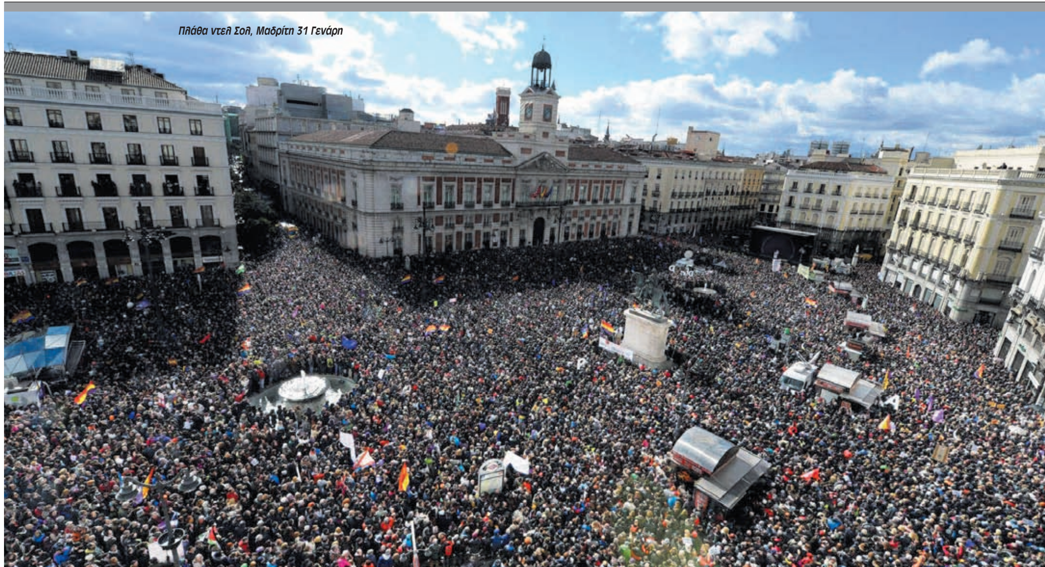
Πλάθα ντελ Σολ, Μαδρίτη 31 Γενάρη