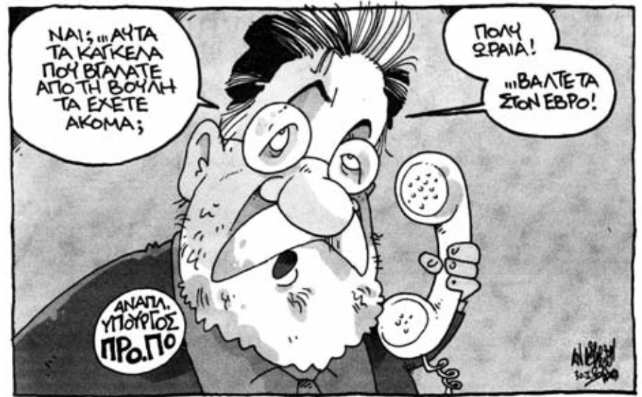
Σκίτσο που δημοσιεύτηκε στην “Αυγή” στις 31/1

Το αντιρατσιστικό και αντιφασιστικό κίνημα που πάλεψε το ρατσισμό και τους νεοναζί, μαζί με το κίνημα που αντιτάχθηκε στην αστυνομική αυθαιρεσία και καταστολή, δεν περιμένουν την συμφιλίωσή τους με την αστυνομία και τα ΜΑΤ. Αυτό που περιμένουν είναι την κα-