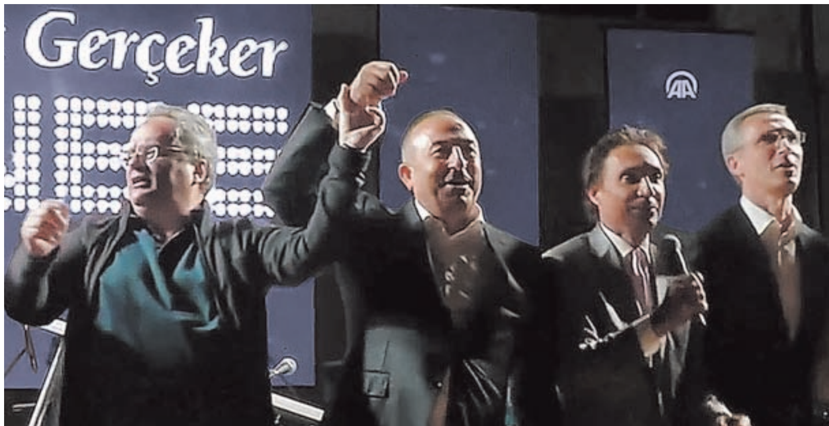
Ο Κοτζιάς τραγουδά μαζί με τους ομολόγους του το "we are the world" στη σύνοδο κορυφής του NATO

Το τι ρόλο παίζει η Ευρωπαϊκή Ένωση σαν «δανειστές» το έχει νοιώσει ο καθένας και η καθεμιά μέσα από τα μνημόνια των τελευταίων χρόνων και τους εκβιασμούς των τελευταίων μηνών. Και ενώ η κυβέρνηση ετοιμάζεται για έναν «έντιμο συμβιβασμό» σε αυτόν τον τομέα, έρχεται στο προσκήνιο η άλλη βάρβαρη όψη της ΕΕ: σαν ιμπεριαλιστικού οργανισμού που επεμβαίνει και στρατιωτικά στην πιο παραγμένη περιοχή του πλανήτη, τη Μέση Ανατολή.