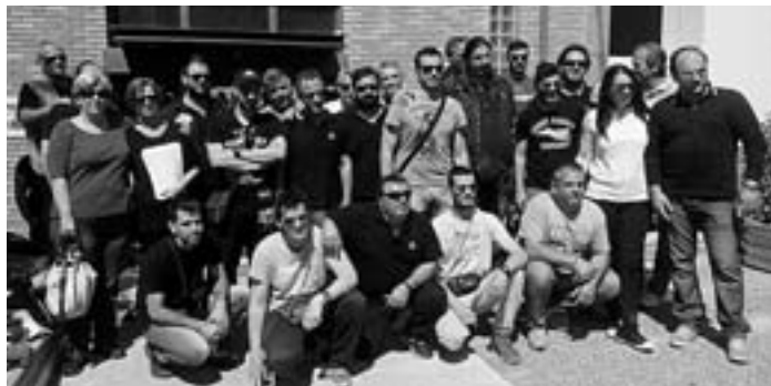
Οι απεργοί της Ζαριφόπουλος στην πύλη της εταιρίας

Η εργοδοσία προχώρησε από το 2010 σε ατομικές συμ-