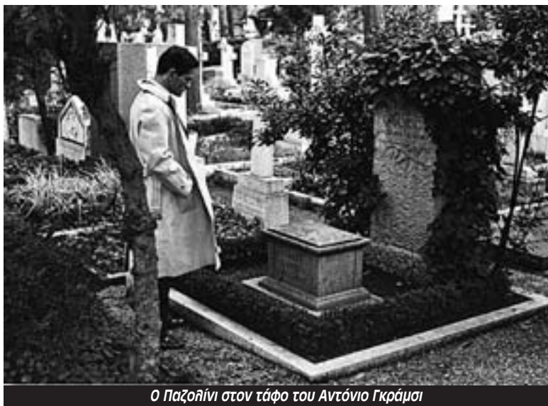
Ο Παζολίνι στον τάφο του Αντόνιο Γκράμσι

Σε όλη του τη ζωή ο Παζολίνι ανακατεύεται και –σε μεγάλο βαθμό ταυτίζεται με τις πολιτικές εξελίξεις στην Ιταλία. Το 1947 ήταν ένας νεαρός, πολλά υποσχόμενος λογοτέχνης και φιλόλογος, όταν δημοσιεύτηκε μια δήλωσή του στην πρώτη