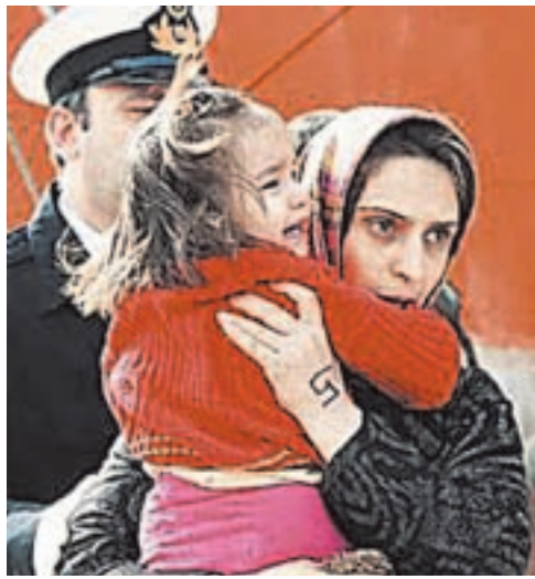
Η "Ναυτική Δύναμη Μεσογείου της ΕΕ" βάζει στο στόχαστρο τους πρόσφυγες της Μέσης Ανατολής.