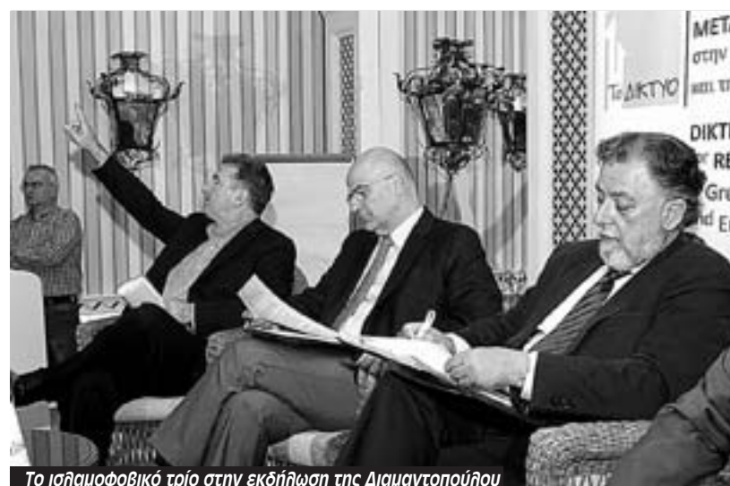
Το ισλαμοφοβικό τρίο στην εκδήλωση της Διαμαντοπούλου