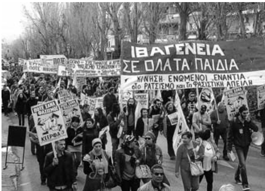
20 Απρίλη, διαδήλωση στον Κορυδαλλό την πρώτη μέρα της δίκης των νεοναζί

Δυστυχώς το νέο σχέδιο νόμου είναι προσαρμοσμένο στις αποφάσεις του ΣτΕ, κάνοντας αυστηρότερες, ακόμα