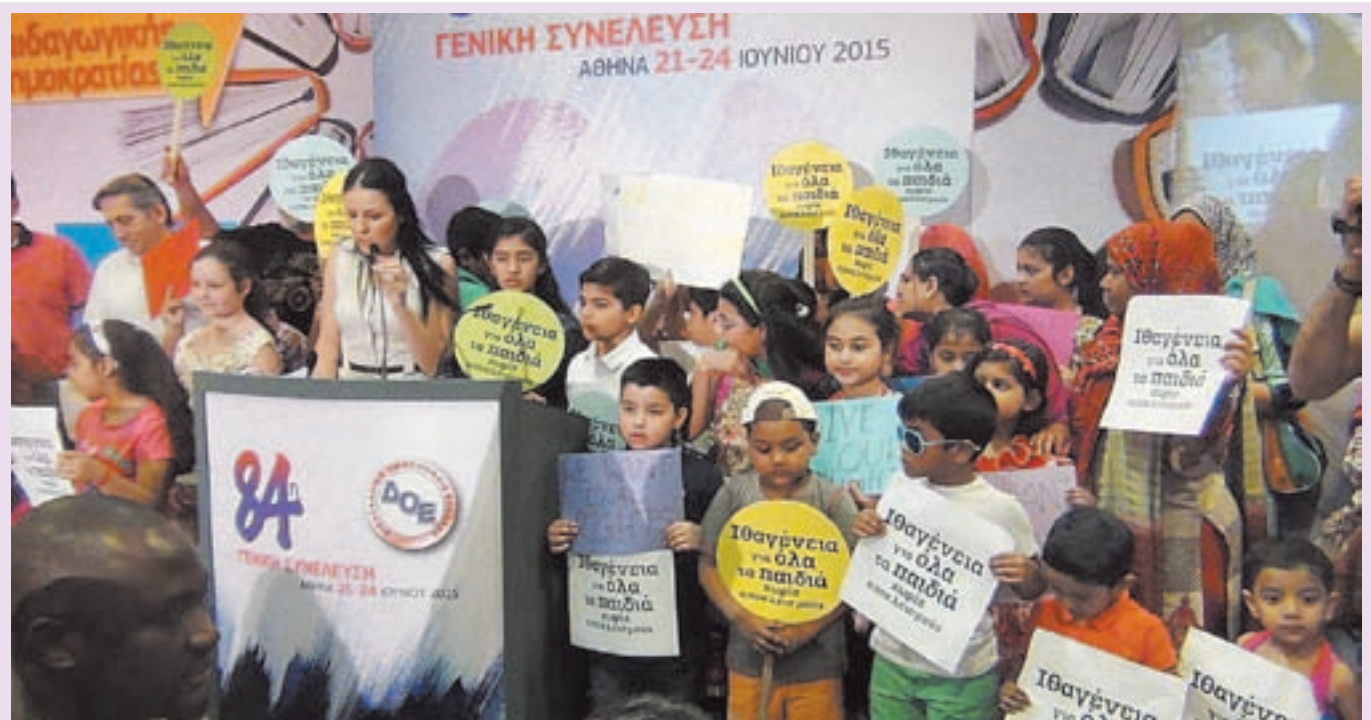
Συγκλήθισαν το Συνέδριο της ΔΟΕ οι μικροί μαθητές, παιδιά μεταναστών, με την παρέμβασή τους για να εγκριθεί ψήφισμα υπέρ της Ιθαγένειας σε όλα τα παιδιά, χωρίς αποκλεισμούς. Περισσότερα για το Συνέδριο στη σελίδα 6. Για την παρέμβαση των μικρών διαδηλωτών στη Βουλή, σελίδα 20.

Ως «αλυσίδα με αδιάκοπη σειρά» χαρακτήρισαν τη σχέση των μελών με την εγκληματική οργάνωση Χρυσή Αυγή οι συνήγοροι της οικογένειας του Παύλου Φύσσα στη δικάσιμο της 22/6.