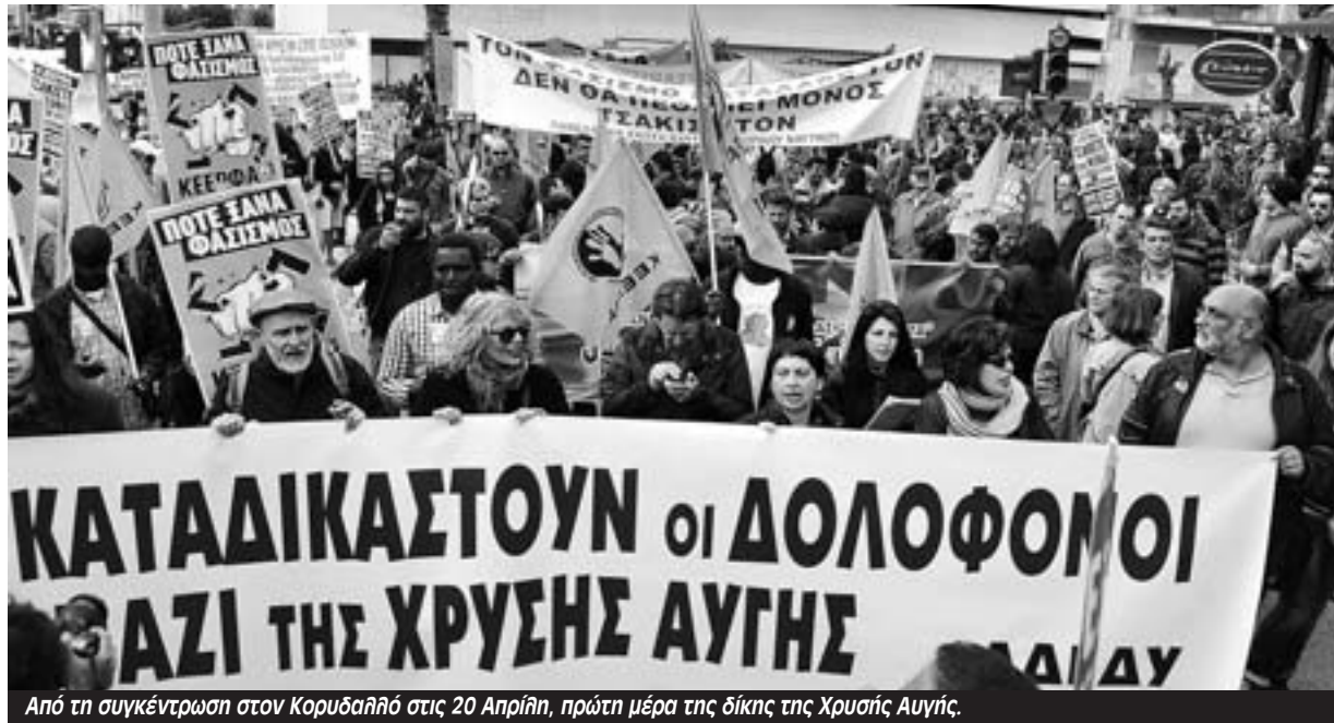
Από τη συγκέντρωση στον Κορυδαλλό στις 20 Απριίλη, πρώτη μέρα της δίκης της Χρυσής Αυγής.

Πρόκειται για μία από τις πιο κρίσιμες διαδικασίες. Οι συνήγοροι των χρυσαυγιτών επιχειρούν να περιορίσουν την πολιτική αγωγή στις κατηγορίες των εγκληματικών πράξεων (δολοφονία και απόπειρες δολοφονίας) για τις οποίες κατηγορούμενοι είναι πυρηνάρχες και μέλη των ταγμάτων εφόδου και να την αποβάλλουν από τις κατηγορίες της ένταξης και διεύθυνσης εγκληματικής οργάνωσης (άρθρο 187 του Ποινικού Κώδικα) για τις οποίες κάθονται στο εδώλιο όλοι οι κατηγορούμενοι αλλά και η ηγεσία της Χρυσής Αυγής. Πίσω από τις νομικές διατάξεις με τις οποίες το δικαιολογούν, ο πραγματικός τους στόχος είναι να εμποδίσουν την πολιτική αγωγή να αποδείξει ότι οι δολοφονικές επιθέσεις δεν ήταν πρωτοβουλία κάποιων ατόμων αλλά σχεδιάστηκαν και εκτελέστηκαν από τα τάγματα εφόδου στο πλαίσιο της εγκληματικής οργάνωσης Χρυσή Αυγή, την οποία καθοδηγούσε η ηγεσία, ο Μιχαολιάκος,