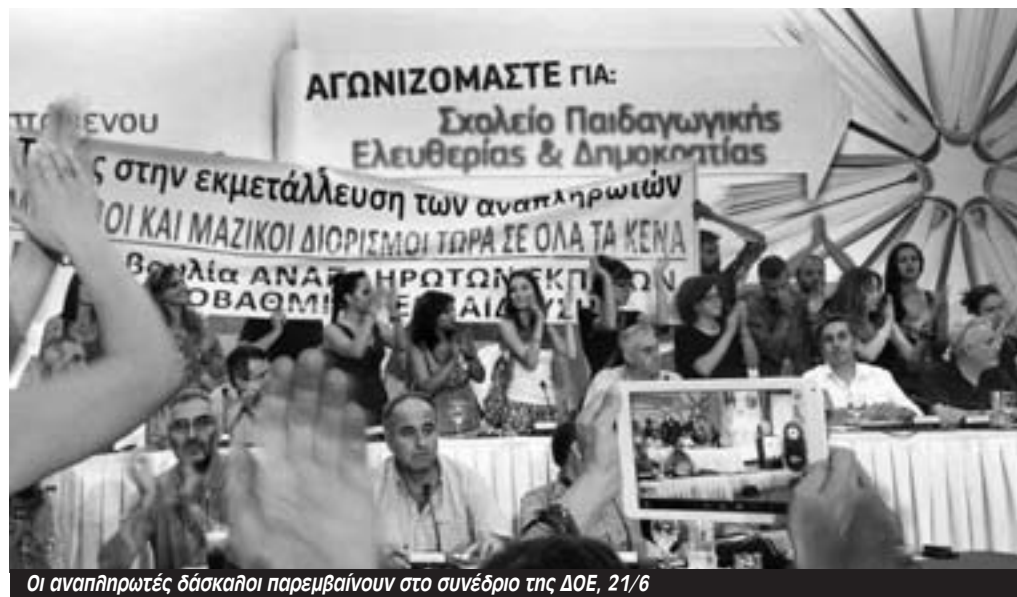
Οι αναπληρωτές δάσκαλοι παρεμβαίνουν στο συνέδριο της ΔΟΕ, 21/6