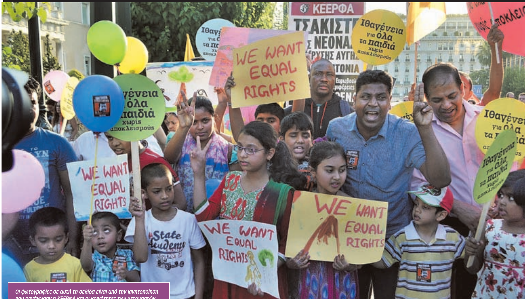
Οι φωτογραφίες σε αυτή τη σελίδα είναι από την κινητοποίηση που οργάνωσαν η ΚΕΕΡΦΑ και οι κοινότητες των μεταναστών στη Βουλή στις 16/6. Το νομοσχέδιο για την Ιθαγένεια μπαίνει στην οθόνη της Βουλής την Τετάρτη 24/6.

Φ τάνει στην Ολομέλεια της Βουλής ένα νομοσχέδιο για την ιθαγένεια στο οποίο πάνω από διακόσιες χιλιάδες παιδιά μεταναστών εναποθέτουν τις ελπίδες τους για να βγουν από την αφάνεια και να αποκτήσουν πλήρη δικαιώματα στην ζωή, την κοινωνία, την εργασία.