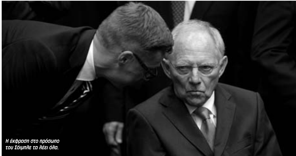
Η έκφραση στο πρόσωπο του Σόμπλε τα λέει όλα.

Μόλις πριν από λίγες μέρες η ελληνική κυβέρνηση, σε μια από τις αλλεπάλληλες κινήσεις «καλής θέλησης» του τελευταίου τετραμήνου, είχε προτείνει στην τρόικα ένα μνημόνιο μέτρων που περιλάμβανε 7,9 δις ευρώ από περικοπές σε δημόσιο-