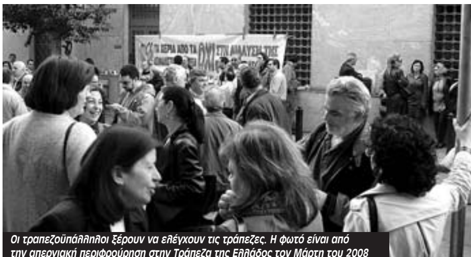
Οι τραπεζοϋπάλληλοι ξέρουν να ελέγχουν τις τράπεζες. Η φωτό είναι από την απεργιακή περιφρούρηση στην Τράπεζα της Ελλάδος τον Μάρτη του 2008

Τώρα γίνεται ακόμη πιο επίκαιρο ότι οι τράπεζες πρέπει να κρατικοποιηθούν και το πραγματικό έλεγχο να τον έχουν οι εργαζόμενοι στις τράπεζες και τα σωματεία τους και όχι οι κάθε λογής τραπεζίτες που για τα κέρδη τους φτάσαμε στη σημερινή κρίση.