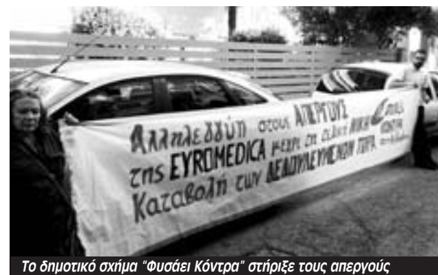
Το δημοτικό σχήμα "Φυσάει Κόντρα" στήριξε τους απεργούς