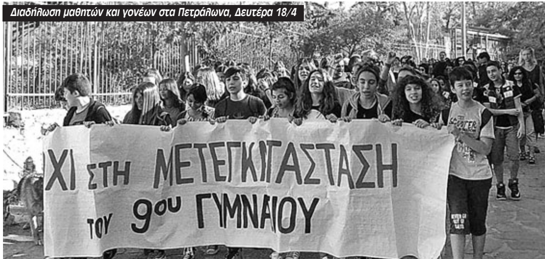
Διαδήλωση μαθητών και γονέων στα Πετραλώνα, Δευτέρα 18/4

Οι μαθητές του Γυμνασίου συμμετείχαν σε πρωινή αποχή από τα μαθήματα και συγκεντρώθηκαν στην είσοδο του σχολείου μαζί με τους γονείς τους και τους γονείς των δημοτικών σχολείων (72ο, 73ο, 76ο, 77ο) που επηρεάζονται άμεσα από το κλείσιμο της σχολικής μονάδας. Οι περίπου 150 - 200 συγκεντρωμένοι πορεύτηκαν στους δρόμους των Πετραλώνων, φωνάζοντας συνθήματα όπως "Σιγά μην κλάψω, σιγά μην φοβηθώ, το 9ο Γυμνάσιο δεν φεύγει από δω" και "Φίλη, Καμίνη ακούστε το καλά, το 9ο θα μείνει στα Πετραλώνα", ξεσήκωσαν την γειτονιά και κατέληξαν στο Κοινοτικό Συμβούλιο του 3ου διαμερίσματος Αθηνών.