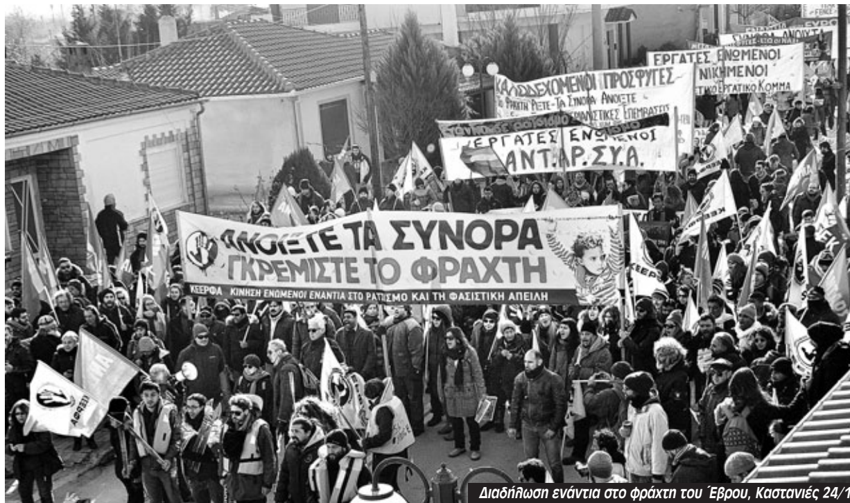
Διαδήλωση ενάντια στο φράχτη του Έβρου, Καστανιές 24/1