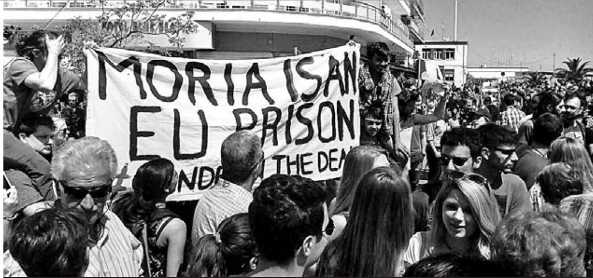
Λιμάνι Μυτιλήνης, Σάββατο 16/4, την ώρα της επίσκεψης του Πάπα. "Η Μόρια είναι φυλακή της ΕΕ - Καταδικάστε τη συμφωνία"

Την πραγματικά αξιόπαινη προσπάθεια του Αντιδραστηρίου να αποδομήσει τα ρατσιστικά-φασιστικά ψέματα, θα όφειλε να ακολουθήσει και η διοίκηση της ΕΡΤ που καθημερινά και επιμελώς φιλοξενεί και νομιμοποιεί στα δελτία της τους απόλυτους εκφραστές αυτών των ψεμάτων, τον υπόδικο Μιχαολιάκο και τη ναζιστική εγκληματική του οργάνωση.