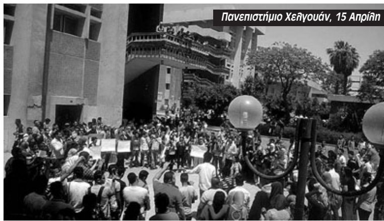
Πανεπιστήμιο Χεΐγουάν, 15 Απρίλη

Η αφορμή μοιάζει αναπάντεχη. Ο στρατάρχης Σίσι χάρισε δύο ακατοίκητα νησιά της Ερυθράς Θάλασσας, το Τιράν και το Σαναφίρ, στο βασιλιά της Σαουδικής Αραβίας, στο πλαίσιο μιας συμφωνίας για τον καθορισμό των θαλάσσιων συνόρων. Η απόφαση σήμανε συναγερό στα αντανακλαστικά του κόσμου. Ο Σίσι οφείλει την καρέκλα του στην αμέριστη στήριξη της Σαουδικής Αραβίας. Με σαουδικό χρήμα και πολιτική κάλυψη κατέσφαξε την αντιπολίτευση και έριξε χιλιάδες στις φυλακές. Τώρα ο εκτελεστής της Αραβικής Άνοιξης ανταποδίδει τις χάρες στους χρηματοδότες της σφαγής. Τα νησιά έχουν επιπλέον