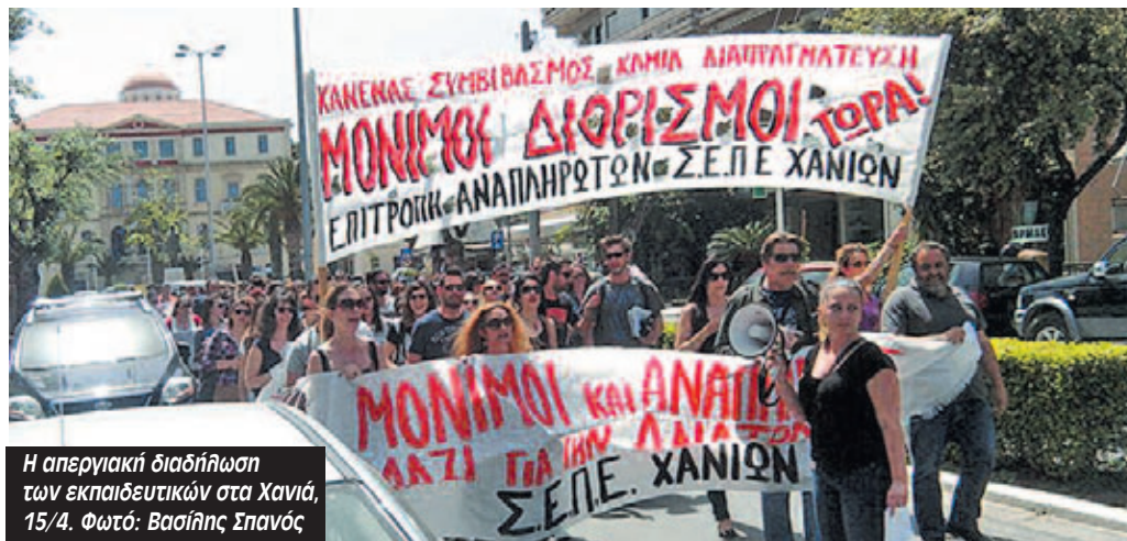
Η απεργιακή διαδήλωση των εκπαιδευτικών στα Χανιά, 15/4.

Μαζική και μαχητική ήταν η κινητοποίηση των δασκάλων και των καθηγητών στο υπουργείο Παιδείας την Παρασκευή 15/4.