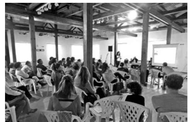
Από το διήμερο εκδηλώσεων στην Καβάλα στις 15 και 16 Απρίλη

Μεγάλοι και μικροί συμμετείχαν στο διήμερο κατά τη διάρκεια του οποίου έγιναν συζητήσεις, δράσεις και μια σειρά από καλλιτεχνικά δρώμενα κ.α. Τοποθετηθήκαμε στη συζήτηση που άνοιξε με θέμα την άμεση ένταξη των παιδιών των προσφύγων στα σχολεία, προτείνοντας να γίνουν τώρα μαζικές προσλήψεις εκπαιδευτικών αντί να δαπανούν εκατομμύρια ευρώ για το φράχτη στον Έβρο και χιλιάδες αστυνομικούς για τα κέντρα κράτησης και τις απελάσεις».