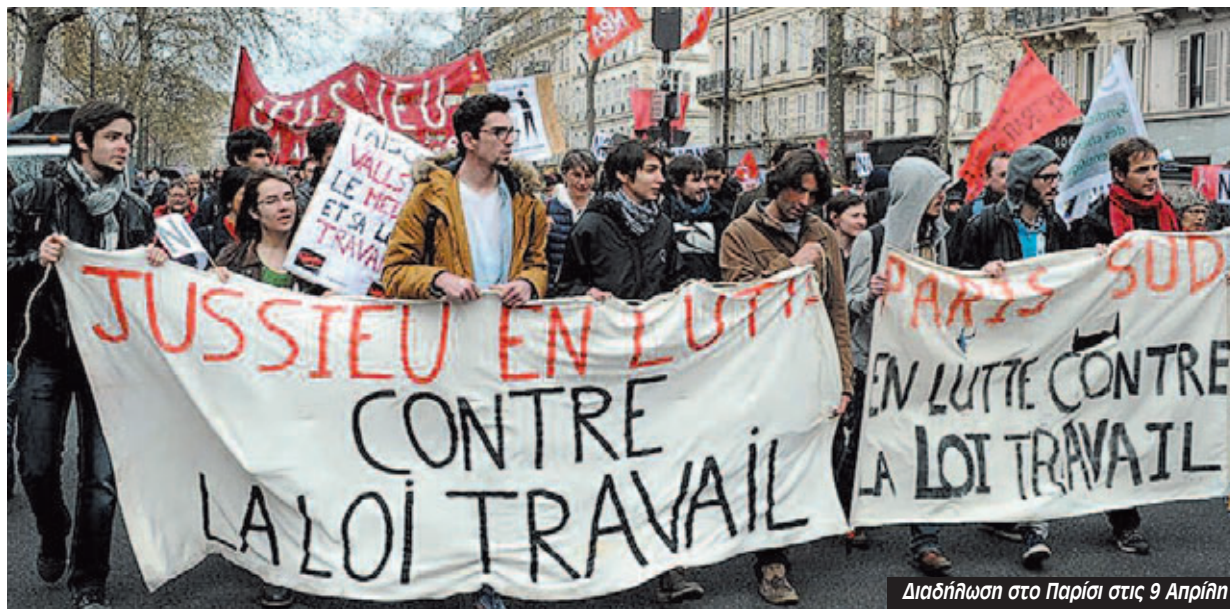
Διαδήλωση στο Παρίσι στις 9 Απρίλη

Η διάθεση για μια γενικευμένη αμφισβήτηση στις πολιτικές που ακολουθούνται τα τελευταία χρόνια στη Γαλλία φαίνεται στις συζητήσεις που ανοίγουν στις πλατείες ξεκινώντας από την εργατική “μεταρρύθμιση”, τον διαβόητο “νόμο Ελ Χομρί” (από την Υπουργό Εργασίας της κυβέρνησης Βαλς, Μυριάμ Ελ Χομρί). Οι συμμετέχοντες όμως δεν περιορίζονται σε αυτόν. Τα θέματα που έχουν συζητηθεί στο δημόσιο χώρο διαπερνούν όλο το φάσμα της κοινωνίας και των πολιτικών εξελίξεων: το προσφυγικό και η αλληλεγγύη, η κοινωνική ασφάλιση, η άνοδος της ακροδεξιάς, η αλληλεγγύη στο ελληνικό κίνημα κατά της λιτότητας, ο ρατσισμός, ο σεξισμός, τα ΛΟΑΤΚΙ+ δικαιώματα, το περιβάλλον κ.α. Στις περισσότερες περιπτώσεις οι συμμετέχοντες δεν επιτρέπουν σε αντιδραστικές φωνές να καπελώσουν το κίνημα αυτό, όπως φαίνεται από το κινήμα φασιστών που έγινε στη διαδήλωση της Νάντ, αλλά και από την αποδοκιμασία-εκδίωξη του “διανοούμενου” Αλέν Φίνκιλκράουτ (που στο παρελθόν έχει εκφράσει “προβληματισμούς” για τον εκφυλισμό του δυτικού πολιτισμού από την πο-