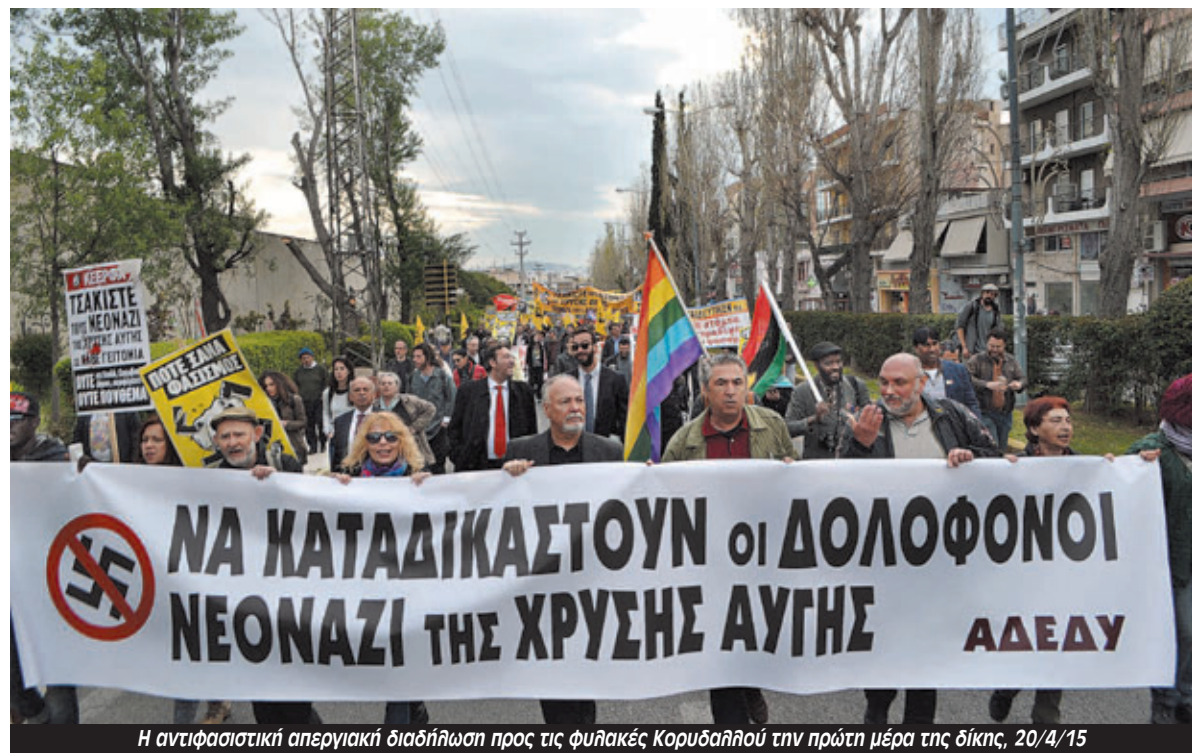
Η αντιφασιστική απεργιακή διαδήλωση προς τις φυλακές Κορυδαλλού την πρώτη μέρα της δίκης, 20/4/15