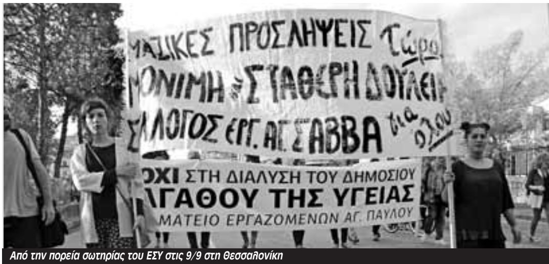
Από την πορεία σωτηρίας του ΕΣΥ στις 9/9 στη Θεσσαλονίκη

Πέμπτη και Παρασκευή στις 22 και 23 Σεπτέμβρη συγκαλείται η Πανελλαδική Συνδιάσκεψη της ΑΔΕΔΥ στο ξενοδοχείο Novotel. Ο Κώστας Πίντας, γραμματέας της Ομοσπονδίας Υπαλλήλων τ. ΥΠΙΑΝ μίλησε στον Κυριάκο Μπίνο για τα ζητήματα που ανοίγονται και τη σημασία της συνδιάσκεψης.