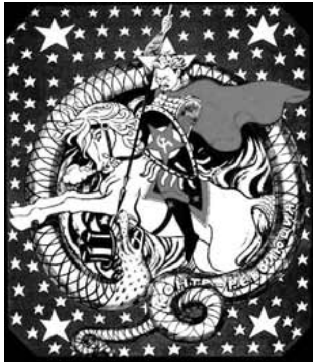
Ο Τρότσκι σκοτώνει το τέρας της καπιταλιστικής αντεπανάστασης

Η προοπτική της νίκης της επανάστασης ήταν ανοιχτή. Στην Ισπανία το 1936, στις καταλήψεις των εργοστασίων στη Γαλλία και στις