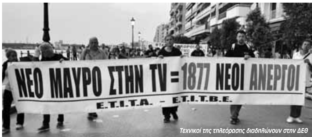
Τεχνικοί της τηλεόρασης διαδηλώνουν στην ΔΕΘ

Η πίεση για απεργιακή απάντηση ήρθε από τα