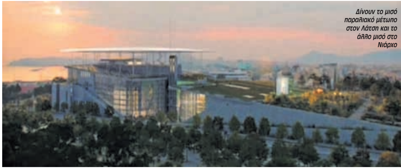
Δίνουν το μισό παραλιακό μέτωπο στον Λάτση και το άλλο μισό στο Νιάρχο

Το αποτέλεσμα; Πήραμε πρόσφατα αποσπάσματα από τις ομιλίες της Δούρου, του Καραμάνου που είναι αντιπεριφερειάρχης οικονομικών και της Θανοπούλου