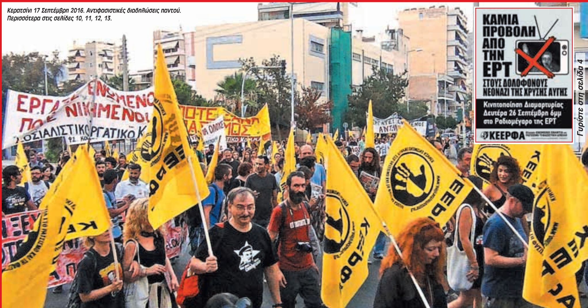
Κερατσίνι 17 Σεπτέμβρη 2016. Αντιφασιστικές διαδηλώσεις παντού. Περισσότερα στις σελίδες 10, 11, 12, 13.