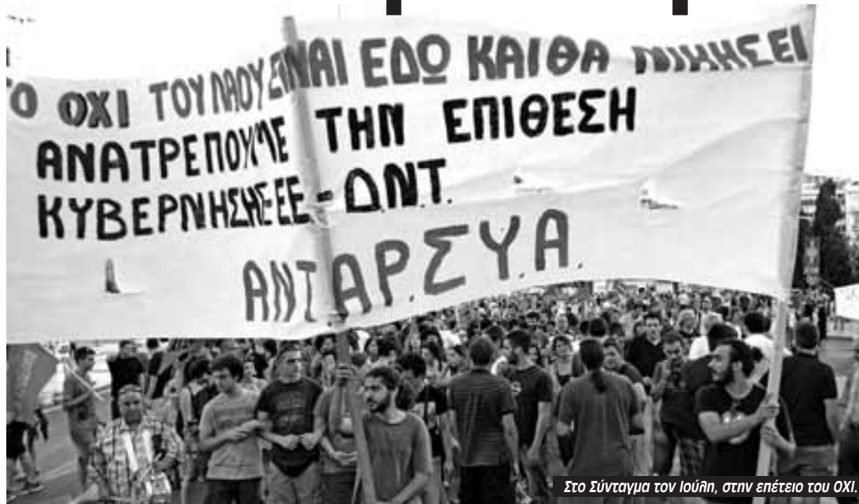
Στο Σύνταγμα τον Ιούλη, στην επέτειο του ΟΧΙ.

Μάχες ενάντια στον πόλεμο και τον ιμπεριαλισμό και την άθλια προσπάθεια της ελληνικής κυβέρνησης να αναδειχτεί σε «πυλώνα σταθερότητας» και έμπιστο σύμμαχο του ΝΑΤΟ και των αντιδραστικών καθεστώτων στην περιοχή. Να κλείσουν οι βάσεις, να σταματήσουν οι εξοπλισμοί, άσυλο στους πρόσφυγες και όχι στους επίδοξους πραξικοπηματίες”.