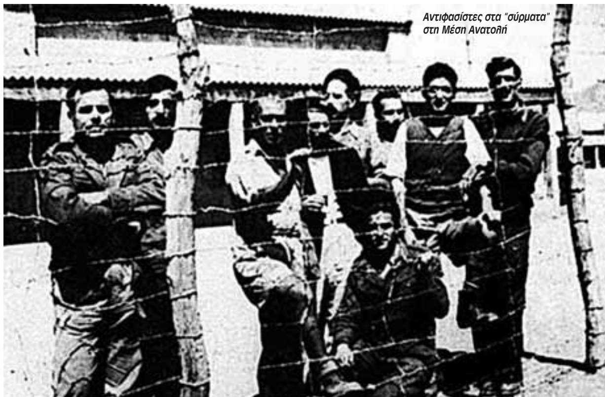
Αντιφασίστες στα "σύρματα" στη Μέση Ανατολή

Η φυγή καθίσταται μονόδρομος για όσους μπορούσαν και για τους κατοίκους των νησιών του Ανατολι-