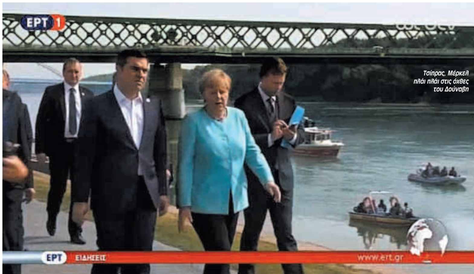
Τσίπρας, Μέρκελ πηγαίνει στις όχθες του Δούναβη