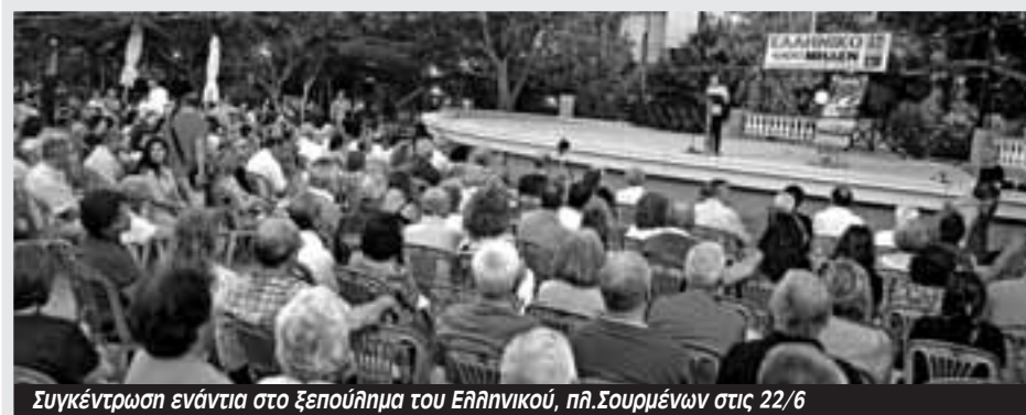
Συγκέντρωση ενάντια στο ξεπούλημα του Ελληνικού, πλ. Σουρμένων στις 22/6

Η ιστορία του Ελληνικού δεν τελειώνει εδώ».