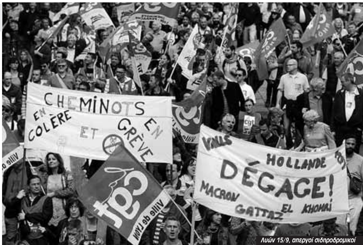
Λυών 15/9, απεργοί σιδηροδρομικοί