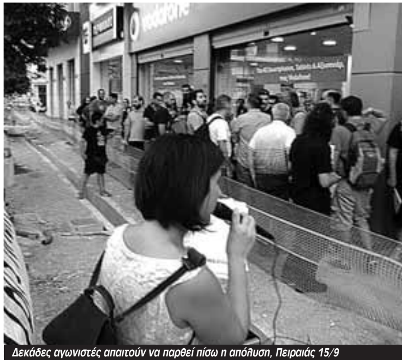
Δεκάδες αγωνιστές απαιτούν να παρθεί πίσω η απόλυση, Πειραιάς 15/9

Μετά τη συγκέντρωση ενημέρωση έκανε η Ζακλίν από το σωματείο της Vodafone: «Ο εκπρόσωπος της