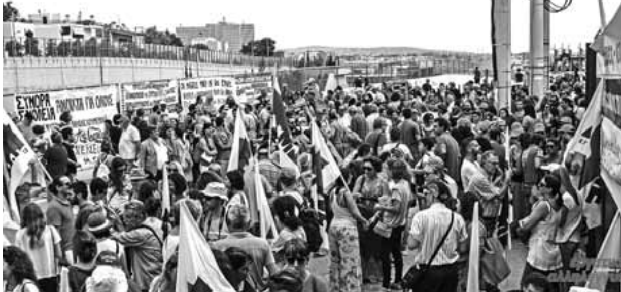
Η απεργιακή συγκέντρωση στο υπουργείο Παιδείας, 15/9

δες το Υπουργείο. Τα ψέματα του Υπουργού και η κατάντια της κυβέρνησης μας εξοργίζουν: στη συνάντηση του Δ.Σ. της ΔΟΕ με το Φίλη την ημέρα της απεργιακής συγκέντρωσης έξω από το Υπ. Παιδείας, ο Υπουργός υπερασπίστηκε μέχρι τελευταίας ρανίδας την εφαρμογή του 3ου Μνημονίου στην Παιδεία. Οι 20.000 μόνιμοι διορισμοί που υπο-