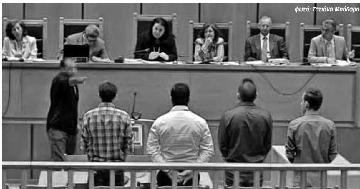
Εφετείο 19/9. Ο μάρτυρας αναγνωρίζει τον πυρηνάρχη Περάματος της Χ.Α. (κάτω) Συγκέντρωση λίγο νωρίτερα στη λεωφ. Αλεξάνδρας

Το εφιαλτικό κλίμα της επίθεσης περιέγραφε με εκφράσεις που έδειχναν καθαρά ότι τα θύματα φοβήθηκαν για τη ζωή τους: «Φωνάξαμε βοήθεια για να μας προλάβουν», «Φωνάξαμε ασθενοφόρο, παρακαλέσαμε να έρθουν γρήγορα γιατί 'το παιδί πεθαίνει'. Τους είπαμε ότι ήρθαν και μας χτύπησαν και σκότωσαν έναν» και «Φοβόμουν να βγω. Ό,τι και να έριχναν δε θα έβγαينا από το σπίτι. Αν βγαίναμε έξω, από αυτά