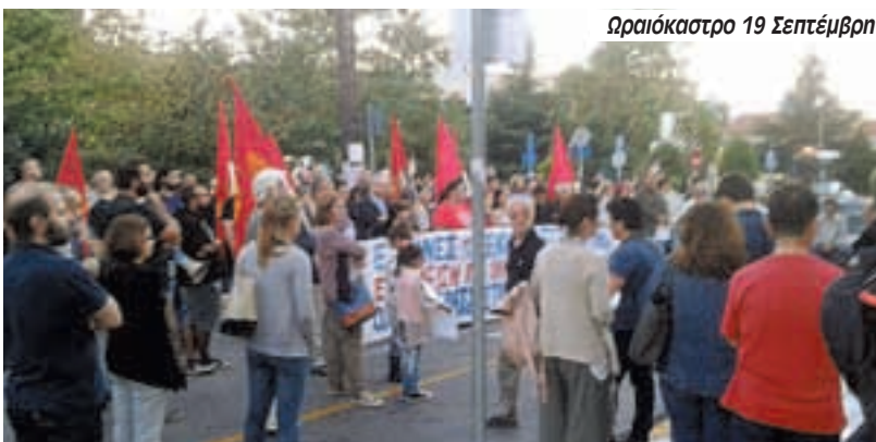
Ωραιόκαστρο 19 Σεπτέμβρη

Ήταν ένα χαστούκι απέναντι στο ρατσισμό και μια προσπάθεια υλοποίησης όσων το υπουργείο εξαγγέλλει αλλά δεν κάνει πράξη. Φυσικά χρειάζεται συνέχεια για να πάνε πράγματι αυτά τα παιδιά στο σχολείο. Ο διευθυντής του σχολείου, παρόλο που δέχτηκε την εγγραφή, μέχρι σήμερα δεν κάνει τίποτα ώστε αυτή να υλοποιηθεί συγκεκριμένα. Μόνο οι εκπαιδευτικοί μπορούμε να το επιβάλλουμε”.