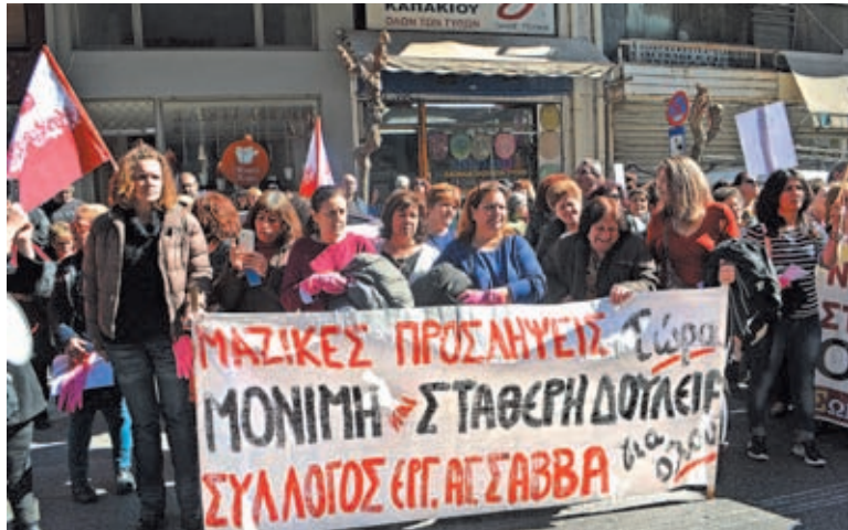
Εργολαβικοί των νοσοκομείων και συνάδελφοί τους έξω από το Υπ. Υγείας