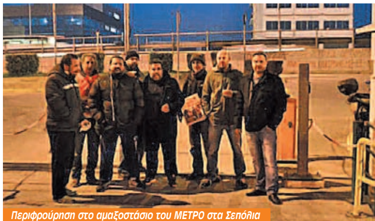
Περιφρούρηση στο αμαξοστάσιο του ΜΕΤΡΟ στα Σειθήια