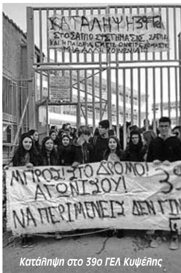
Κατάληψη στο 39ο ΓΕΛ Κυψέλης

Όπως αναφέρουν ανάμεσα σε άλλα στο διαδικτυακό κάλεσμα που έχουν κάνει: «Λέμε όχι στην κατάργηση των επαναληπτικών εξετάσεων! Σε περίπτωση που κάποιος μαθητής πάθει το στι-δήποτε και απουσιάσει