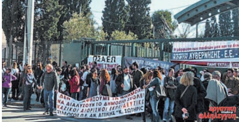
Εκπαιδευτικοί έξω από το Υπουργείο Παιδείας