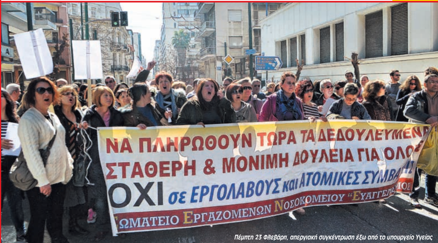
Πέμπτη 23 Φεβράρη, απεργιακή συγκέντρωση έξω από το υπουργείο Υγείας