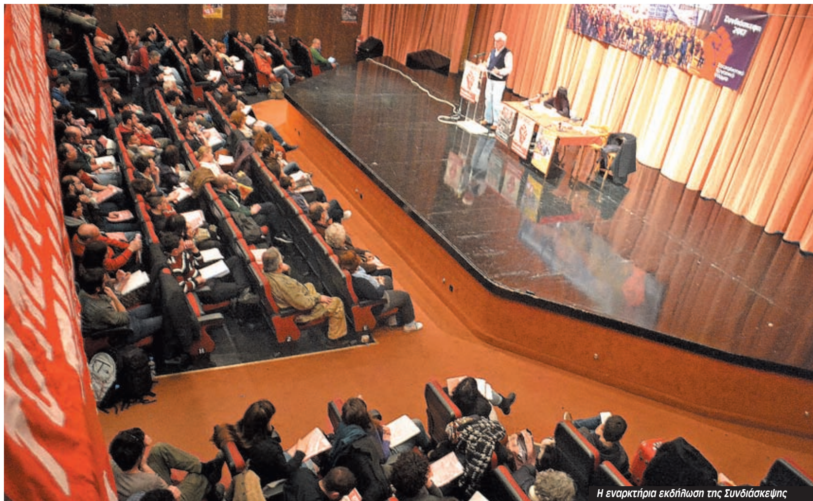
Η εναρκτήρια εκδήλωση της Συνδιάσκεψης