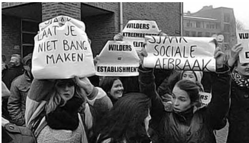
Την αναστολή των δημόσιων προεκλογικών του εμφανίσεων ανακοίνωσε ο ακροδεξιός Γκέερτ Βίλντερς του Κόμματος της Ελευθερίας, επικαλούμενος ζητήματα "ασφάλειας". Η πραγματικότητα είναι ότι η οργή ενάντια στην ρατσιστική εκστρατεία του φουντώνει, με αντι-διαδηλώσεις κάθε φορά που επιχειρεί να εμφανιστεί

Αυτή η κατάσταση σήμανε ότι ο ακροδεξιός πολιτικός Γκέερτ Βίλντερς μπορεί να παρουσιάζει τον