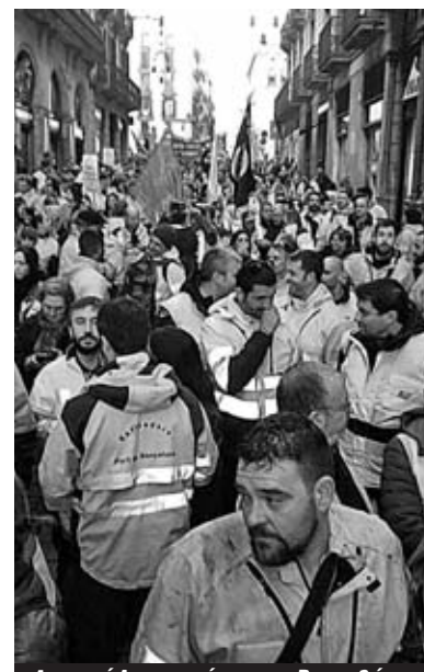
Απεργοί Λιμενεργάτες στη Βαρκελώνη

εκκλησίας που ελέγχει μεγάλο μέρος της ιδιωτικής εκπαίδευσης. Συντονισμοί εμφανίζονται και για την υπεράσπιση των συντάξεων, αλλά και για την υποδοχή των προσφύ-