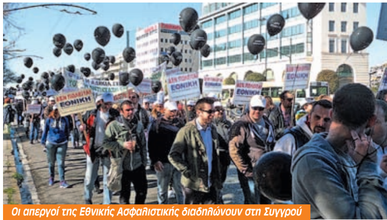
Οι απεργοί της Εθνικής Ασφαλιστικής διαδηλώνουν στη Συγγρού