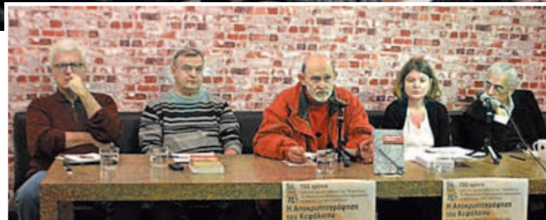
Η αίθουσα και το πάνελ της εκδήλωσης