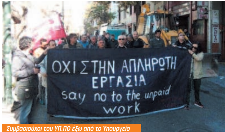
Συμβασιούχοι του ΥΠ.ΠΟ έξω από το Υπουργείο