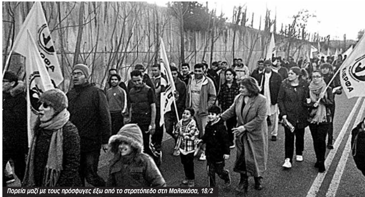
Πορεία μαζί με τους πρόσφυγες έξω από το στρατόπεδο στη Μαλακάσα, 18/2

Η αθώωση Πελετίδη είναι άλλη μία νίκη του αντιφασιστικού κινήματος, που στέλνει το μήνυμα ότι έχει τη δύναμη να απομονώσει τη Χρυσή Αυγή από παντού και από τους Δήμους και από τα κανάλια και από τη Βουλή.