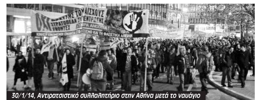
30/1/14, Αντιρατσιστικό συλλαλητήριο στην Αθήνα μετά το ναυάγιο