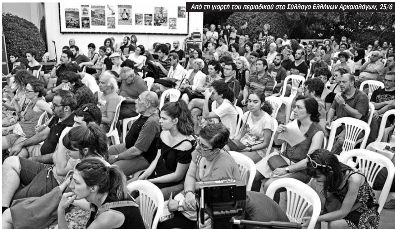
Από τη γιορτή του περιοδικού στο Σύλλογο Ελλήνων Αρχαιολόγων, 25/6

Η υποχρέωση της αριστεράς είναι τεράστια. Έχει πρόταση διεξόδου από την κρίση; Η Αντικαπιταλιστική Αριστερά λέει διαγραφή του χρέους, κρατικοποίηση των τραπεζών με εργατικό έλεγχο, έξοδος από ΕΕ και ευρώ. Είναι άμεσα αιτήματα για την ίδια τη τάξη που παλεύει. Η ανασύνταξη της αριστεράς γίνεται μέσα από συζήτηση και κοινή δράση αλλά με καθαρή στρατηγική ότι το υποκείμενο είναι η εργατική τάξη και ότι η στρατηγική της είναι να ανατρέψει αυτό το σύστημα και να χτίσει την εργατική εξουσία ξεκινώντας από τις σημερινές μάχες.