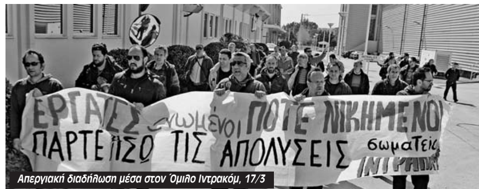
Απεργιακή διαδήλωση μέσα στον Όμιλο Ιντρακόμ, 17/3

Τελευταίο δείγμα αυτής της σκληρής πραγματικότητας ήταν ο πρόσφατος νικηφόρος αγώνας των εργαζομένων στην IN-MAINT, οι οποίοι με απεργιακές κινητοποιήσεις πληρώθηκαν τα δεδουλευμένα και πήραν πίσω τις τρομοκρατικές απολύσεις των δύο εργαζόμενων και συνδικαλιστών. Αποτέλεσε μια συνέχεια στους δυνατούς αγώνες που έχουμε δώσει οι εργαζόμενοι με το σωματείο μας στο παρελθόν, με πιο κομβικούς τις 48ωρες στον όμιλο το 2011 και την πολυήμερη στη DEFENSE το 2012, όπου δεν πέρασε η «οικογενειακή» υποτίθεται νοοτροπία με την εργοδοσία. Τουναντίον παλέψαμε και βάλαμε φρένα στις εργοδοτικές επιθέσεις δημιουργώντας οι εργαζόμενοι ένα συσχετισμό δύναμης που