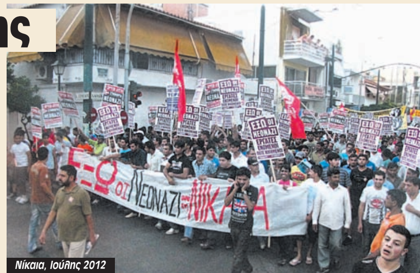
Νίκαια, Ιούνης 2012

Τα επίσημα εγκαίνια του άνητρο δολοφονικών εξορμήσεων της Χρυσής Αυγής Νίκαιας έγιναν στις 9 Ιούνη του 2012, παρουσία του ίδιου του Κασσιδιάρη στην πρώτη του δημόσια εμφάνιση μετά το τέλος του 48ωρου αυτόφωρου, για την επίθεση που είχε κάνει μπροστά στις κάμερες στις δύο βουλευτικές της αριστεράς. Εκείνη τη μέρα έγινε αντιφασιστική συγκέντρωση και πορεία στον Κορυδαλλό, αφού η Νίκαια είχε μετατραπεί σε κόκκινη ζώνη από την μεγάλη κινητοποίηση της αστυνομίας και των ΜΑΤ. Δύο μέρες μετά η δολοφονική δράση των φασιστών κλιμακώθηκε με την εισβολή στο σπίτι των Αιγυπτίων ψαράδων στο Πέραμα τα Ημερώματα της 12ης Ιούνη. Τις επόμενες ημέρες οι χρυσαυγίτες άρχισαν να στήνουν μπλόκα στους δρόμους της Νίκαιας, κυρίως τις πολύ πρωινές ώρες, κάνοντας επιθέσεις στους μετανάστες που πήγαιναν να πιάσουν δουλειά. Τους χτυπούσαν με σιδερορογιοθιές και ρόπαλα και τους άφηναν αιμόφυρτους στο δρόμο. Την ίδια περίοδο μηχανοκίνητα τάγματα εφόδου της Χρυσής Αυγής μαζί με μηχανές της ομάδας ΔΙΑΣ, προσπάθησαν να τρομοκρατήσουν τους Πακιστανούς ιδιοκτήτες μαγαζιών στην πλατεία Αγίου Νικόλα, δι-