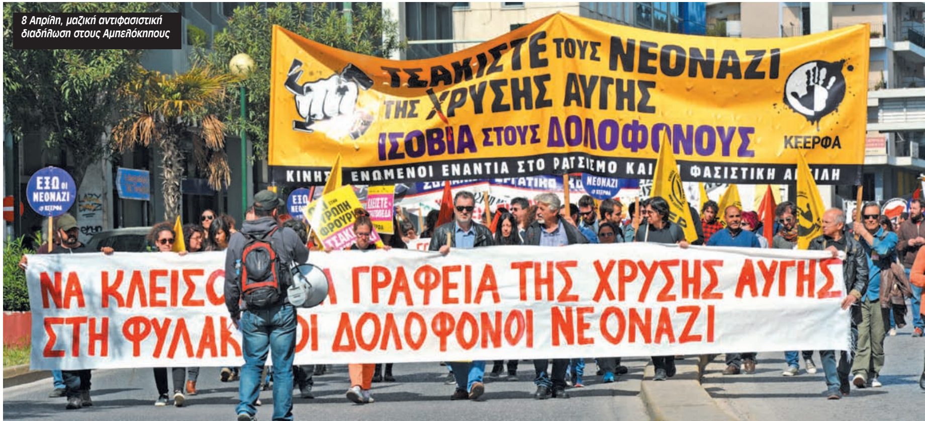
8 Απριλίη, μαζική αντιφασιστική διαδήλωση στους Αμπελόκηπους

Είναι τα ίδια γραφεία που προστάτευε η αστυνομία όταν στις 25/9/13 το ποτάμι των 50.000 αντιφασιστών πλημμύριζε το κέντρο της Αθήνας μια βδομάδα αργότερα, προχωρώντας σε 62 προσαγωγές και 5 συλλήψεις που αφορούσαν φυσικά αντιφασίστες. Το κλείσιμο της «Κομαντατούρ» θα είναι μια νίκη για τους κατοίκους των Αμπελόκηπων και των γύρω περιοχών αλλά και για το αντιφασιστικό κίνημα συνολικά.