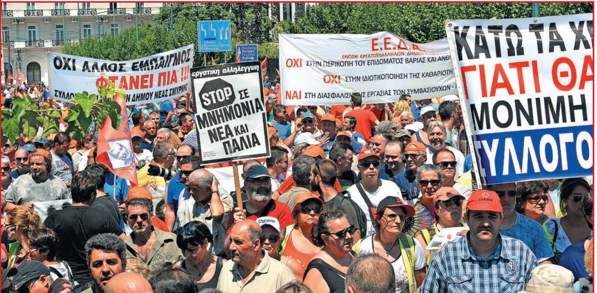
Η απεργία στους Δήμους και οι μάχες σε Νοσοκομεία, Σχολεία, ΜΜΕ στις σελίδες 2 - 9

25 χρόνια "Σοσιαλισμός από τα κάτω" Που βαδίζει η Αριστερά σήμερα; σελίδες 3, 12, 13