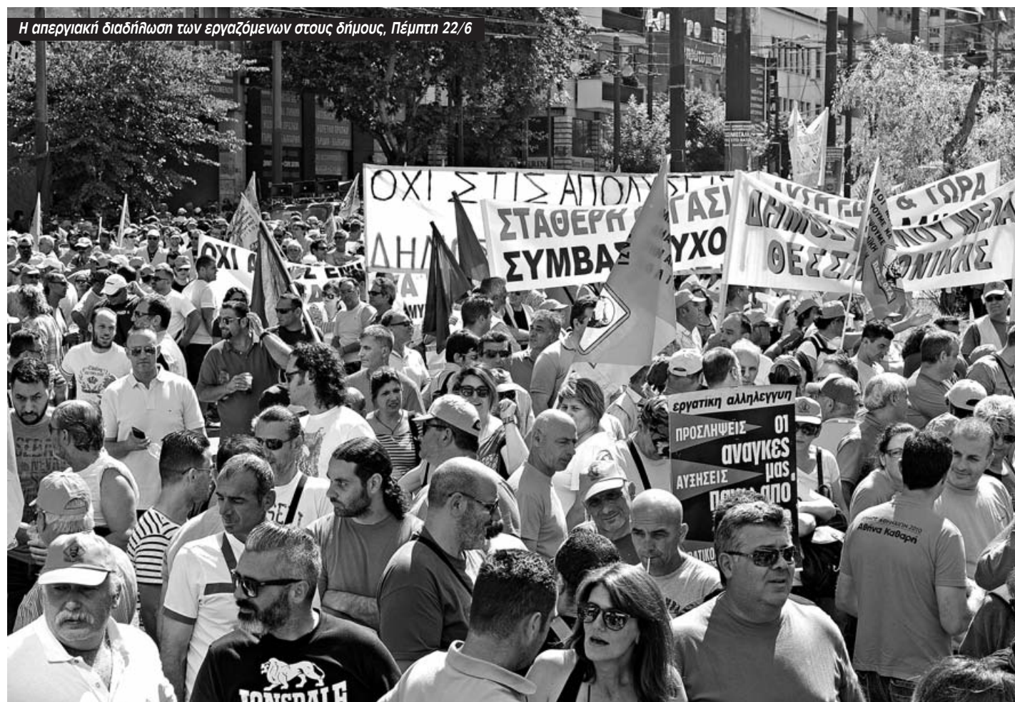
Η απεργιακή διαδήλωση των εργαζομένων στους δήμους, Πέμπτη 22/6