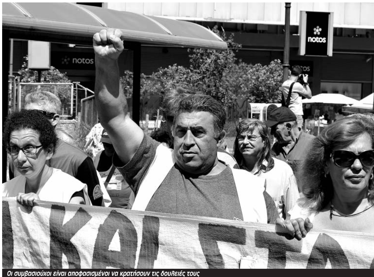
Οι συμβασιούχοι είναι αποφασισμένοι να κρατήσουν τις δουλειές τους

Εν τω μεταξύ οι καταλήψεις όλο αυτό το δεκαήμερο, έχουν τη δικιά τους ζωή – εμπειρία ανεκτίμητη για τον κόσμο που παλεύει για τη δουλειά του. Έχοντας να αντιμετωπίσουν προσπάθειες απεργοσπασίας από αφεντικά και δημάρχους, αλλά και τόνους λάσπης και αρνητικής προπαγάνδας από τα μνημονιακά ΜΜΕ, οι αγωνιζόμενοι εργάτες πραγματοποιούν καθημερινά συζητήσεις και συνελεύσεις, εξορμήσεις και τοπικές διαδηλώσεις και παλεύουν για το κέρδιμα συμπάρστασης σε κάθε γειτονιά.