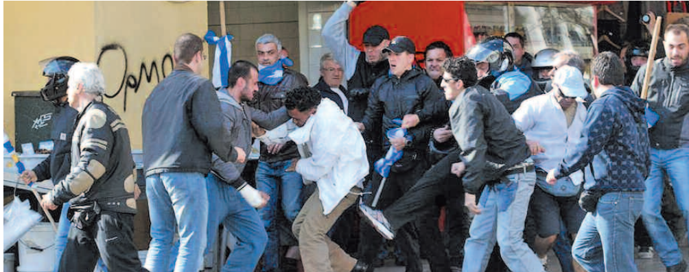
Μάης 2011: Χρυσουγίτικο πογκρόμ κατά μεταναστών. Το Δίκτυο Καταγραφής Περιστατικών Ρατσιστικής Βίας συστάθηκε τον Οκτώβριο του ίδιου έτους.

Η μάρτυρας κατέθεσε για τους στόχους του ΣΕΜ και τι οδήγησε στην ανάγκη συστηματικής παρακολούθησης της ρατσιστικής βίας: «Κάθε ΣΕΜ έχει ως αντικείμενο να λειτουργήσει ως δίαυλος επικοινωνίας ανάμεσα στους μετανάστες κατοίκους και τη δημοτική Αρχή. Μέσα από τη δράση μας, από το 2011 και μετά, κρίναμε ότι λόγω των πολλών κρούσμάτων ρατσιστικής βίας στο κέντρο, έπρεπε να συμματάσσουμε ως παρατηρητές στο Δίκτυο Καταγραφής Περιστατικών Ρατσιστικής Βίας, που ιδρύθηκε το 2011 από την Ύπατη Αρμοστεία και την Εθνική Επιτροπή για τα Δικαιώματα του Ανθρώπου (ΕΕΔΑ)». Η ΕΕΔΑ είναι «θεσμός της Πολιτείας και λειτουργεί παρά τω πρωθυπουργώ. Έχει συσταθεί με νόμο και εί-