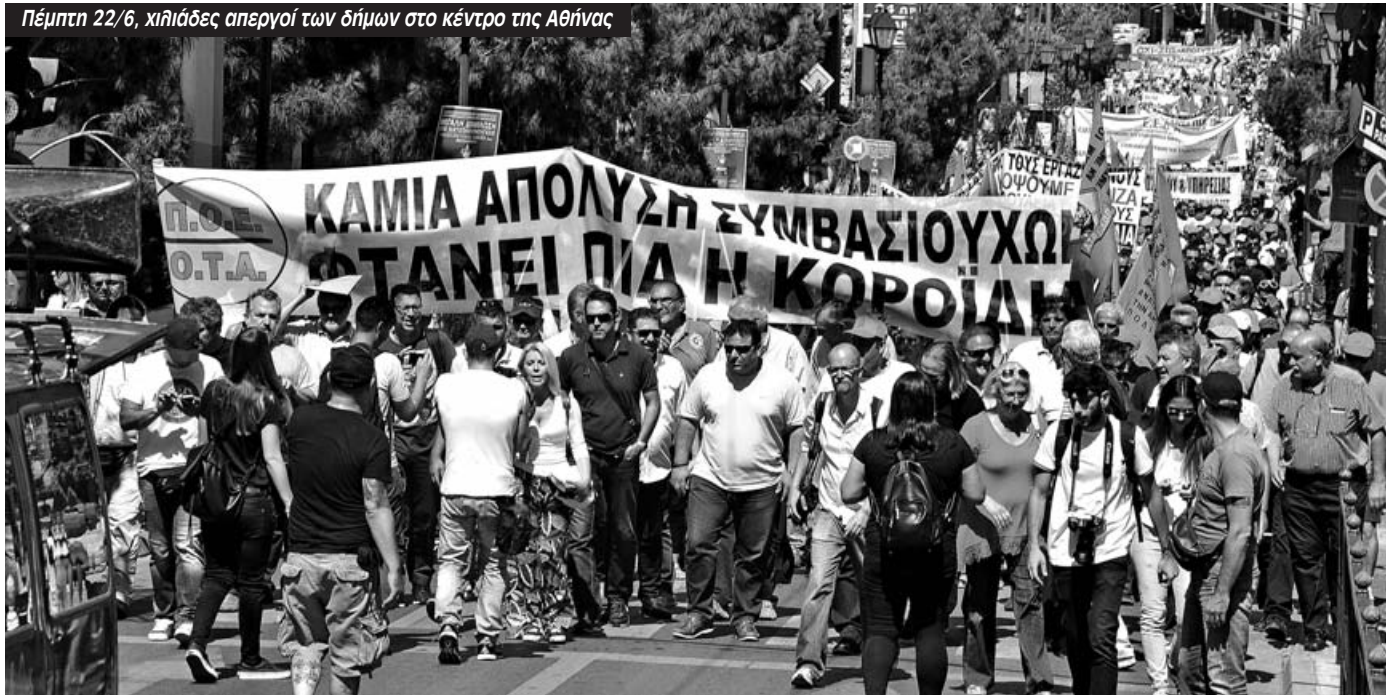
Πέμπτη 22/6, χιλιάδες απεργοί των δήμων στο κέντρο της Αθήνας

Με αυτό τον προσανατολισμό χρειάζεται να προχωρήσουμε σε κάθε δήμο στην δημιουργία απεργιακών επιτροπών για να οργανωθούν ακόμα πιο αποτελεσματικά και τα δύο και η περιφρούρηση της απεργίας και των καταλήψεων, αλλά και το άνοιγμα της συμπαραστάσης σε κάθε συνδικάτο και γειτονιά”.