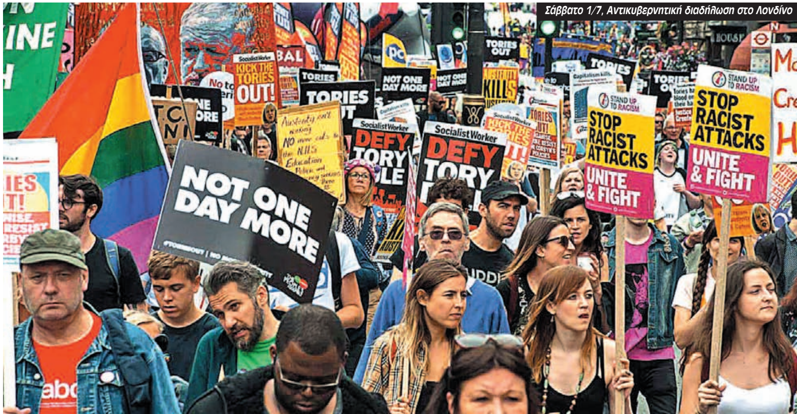
Σάββατο 1/7, Αντικυβερνητική διαδήλωση στο Λονδίνο

Περίπου εκατό χιλιάδες διαδηλωτές βάδισαν στο κέντρο του Λονδίνου το περασμένο Σάββατο με κεντρικό σύνθημα “Ούτε μια μέρα παραπάνω” για την Τερέζα Μέι και την κυβέρνηση της. Ήταν μια διαδήλωση που καλέστηκε από την κίνηση “Λαϊκή Συνέλευση” και πολλά συνδικάτα και στηρίχτηκε από όλο το φάσμα της αριστεράς στη Βρετανία.