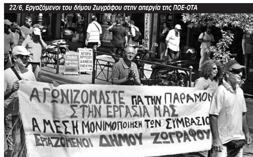
22/6, Εργαζόμενοι του δήμου Ζωγράφου στην απεργία της ΠΟΕ-ΟΤΑ