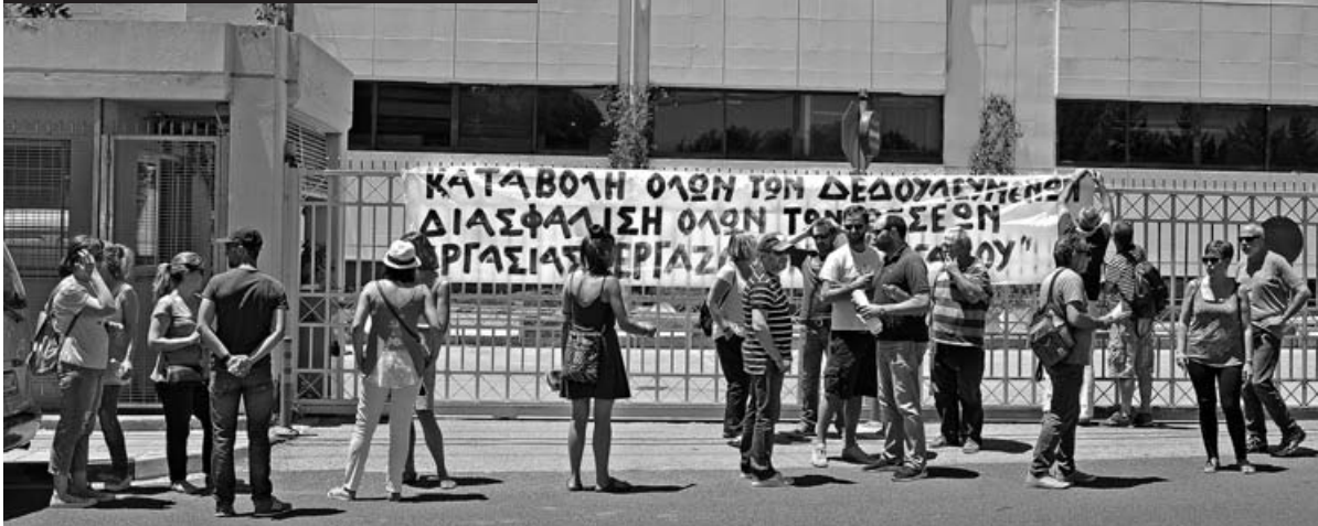
Κινητοποίηση των εργαζόμενων στον Πήγασο, 3/7

βρήκε μπροστά της την αντίδραση των εργαζόμενων που μερικές δεκάδες από αυτούς μπήκαν μέσα στο κτήριο και επέβαλαν πως θα συναντηθούν με τον Μπόμπολα αυτοπροσώπως.