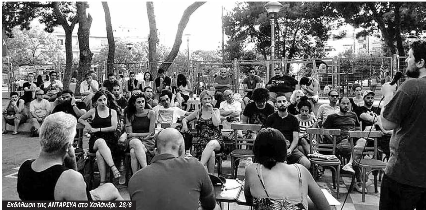
Εκδήλωση της ANΤΑΡΣΥΑ στο Χαλάνδρι, 28/6