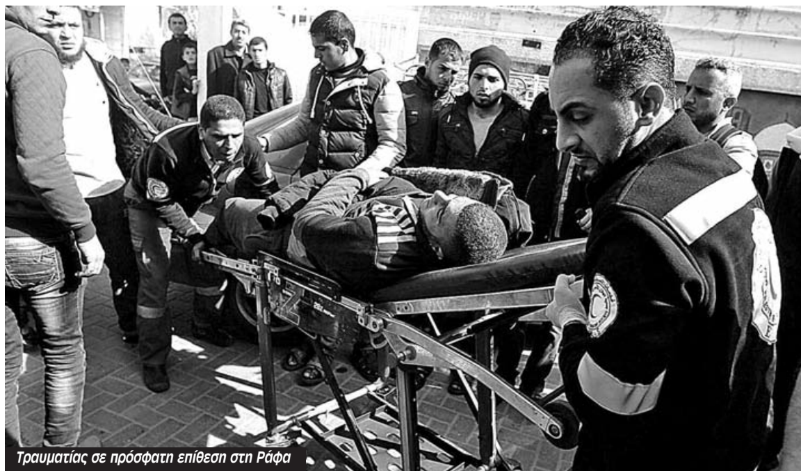
Τραυματίας σε πρόσφατη επίθεση στη Ράφα

Μ ε πυραύλους κατά τριών περιοχών της Λωρίδας της Γάζας επιτέθηκε το Ισραήλ την περασμένη βδομάδα. Το γεγονός επανέφερε για λίγο την κατάσταση της Γάζας στην επικαιρότητα, όμως όταν διαπιστώθηκε πως δεν υπήρξαν νεκροί η Γάζα εξαφανίστηκε ξανά από τις ειδήσεις. Ένα μαζικό έγκλημα εξελίσσεται στη Λωρίδα της Γάζας αυτό το καλοκαίρι.