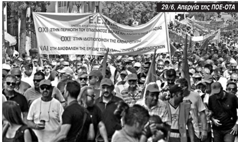
29/6, Απεργία της ΠΟΕ-ΟΤΑ