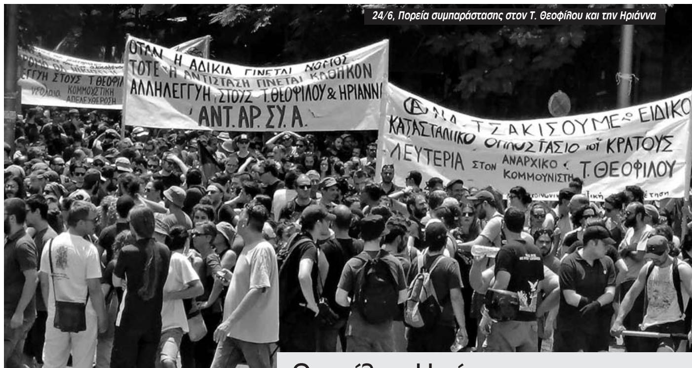
24/6, Πορεία συμπαραστάσης στον Τ. Θεοφίλου και την Ηριάννα