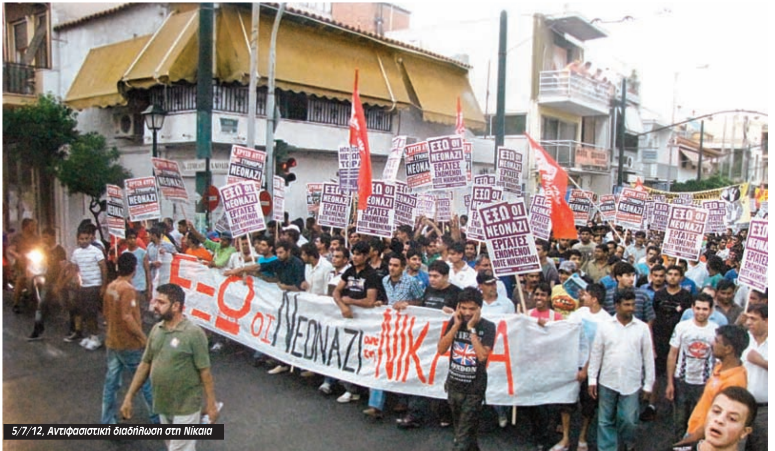
5/7/12, Αντιφασιστική διαδήλωση στη Νίκαια

Εκτενή αναφορά έκανε στη δράση της τοπικής της Νίκαιας: «Ήταν πραγματικός στρατός. Έκαναν γυμνάσια, βηματισμό, παρελάσεις, τσαμπουκάδες, ξύλο». Ωστόσο αν και παρουσίαζε την τοπική Νοτίων ως «εξευγενισμένη» και την Νίκαια ως στρατό, δεν μπόρεσε να μην παραδεχτεί τις ομοιότητες των τοπικών: «Η Νίκαια ήταν η πιο σκληροπυρηνική. Με το ίδιο μοντέλο λειτουργούσαμε όλοι. Αυτό που στη Νίκαια λέγεται 'τάγματα εφόδου' εμείς το λέγαμε 'φρουρά'. Επιλέγαμε τα πιο σωματώδη και γυμνασμένα μέλη. Ο υπεύθυνος της φρουράς άνηκε και στο 5μελές της