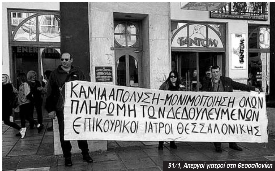
31/1, Απεργία γιατρών στη Θεσσαλονίκη

“Οι επικουρικοί ζουν στην αβεβαιότητα. Δεν είναι καθόλου βέβαιο ότι θα δουλεύουν ακόμα και μέχρι το τέλος του χρόνου ενώ υπάρχει μεγάλο πρόβλημα και