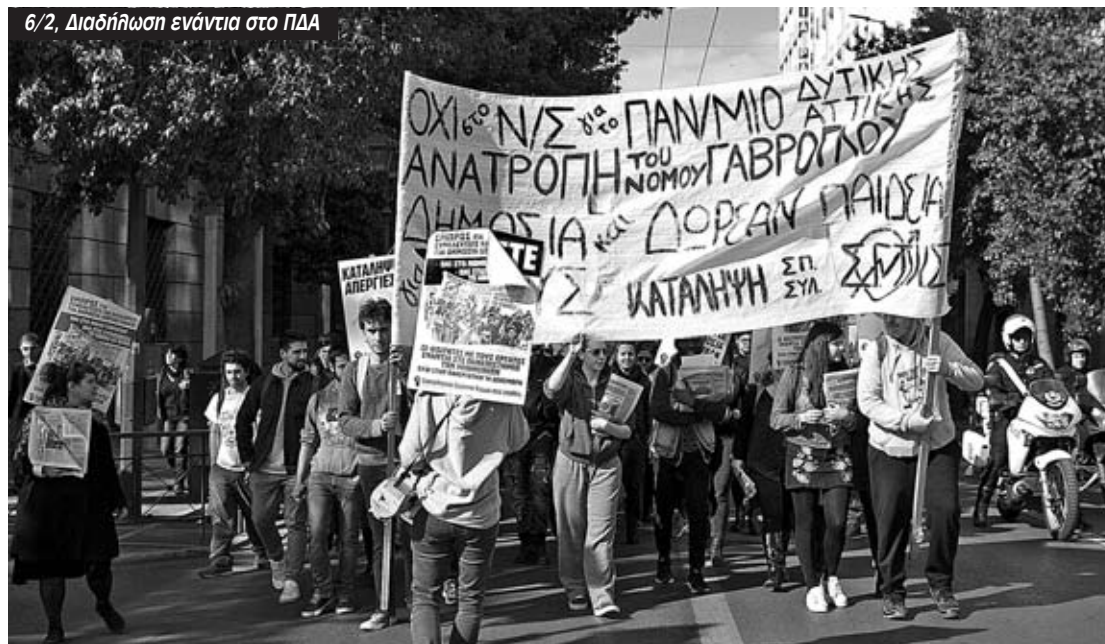
6/2, Διαδήλωση ενάντια στο ΠΔΑ

Την επόμενη, με μπλοκ αντικατάληψης ΠΑΣΠ-ΔΑΠ ανοίγει η ΣΕΥΠ, ενώ για 2 ψήφους χάνεται η συνέλευση της ΣΓΤΚΣ. Οι φοιτητές/τριες δεν το έβαλαν κάτω, μαζεύουν υπογραφές για τη συνέχεια και στις 31/1 καλούνται νέες συνελεύσεις. Η συνέλευση στη ΣΓΤΚΣ ήταν η μαζικότερη που έχει γίνει. Ψηφίσαμε εβδομαδιαία κατάληψη και έχουμε νέα γενική συνέλευση στις 7/2 στις 12μες. Τις ημέρες της κατάληψης οργανώσαμε σειρά εξορμήσεων με σκοπό να βάλουμε σε