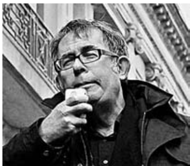
Γράφει ο Αλεξ Καλλίνικος

Παρά την παραδοσιακή υποταγή του Λονδίνου στην Ουάσινγκτον, ο προκάτοχος της Μέι, Ντέιβιντ Κάμερον, και ο υπουργός του των Οικονομικών, Τζορτζ Όσμπορν, προσπάθησαν να οικοδομήσουν μια στενή οικονομική συνεργασία με την Κίνα. Προώθησαν την ιδέα περί μιας νέας “χρυσής εποχής” στις αγγλοκινεζι-