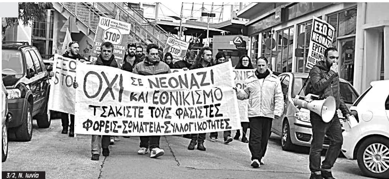
3/2, Ν. Ιωνία