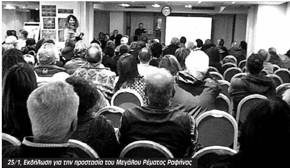
25/1, Εκδήλωση για την προστασία του Μεγάλου Ρέματος Ραφήνας