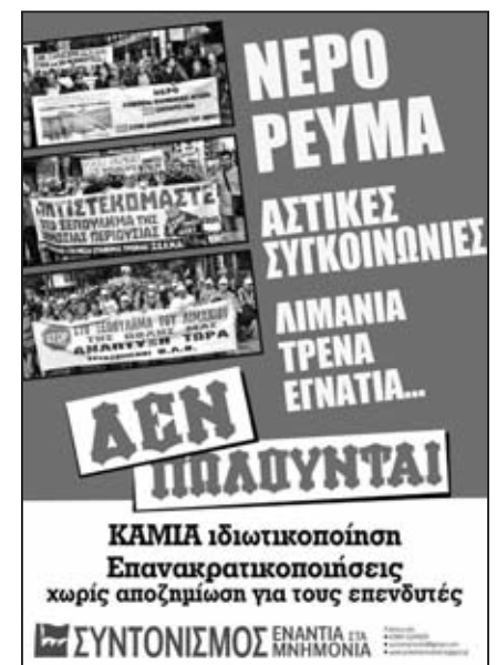
Απεργιακή συγκέντρωση έξω από το Χρηματιστήριο Αθηνών ενάντια στο ξεπούλημα του νερού

Τα έσοδα από τις αποκρατικοποιήσεις πηγαίνουν κατευθείαν στην αποπληρωμή