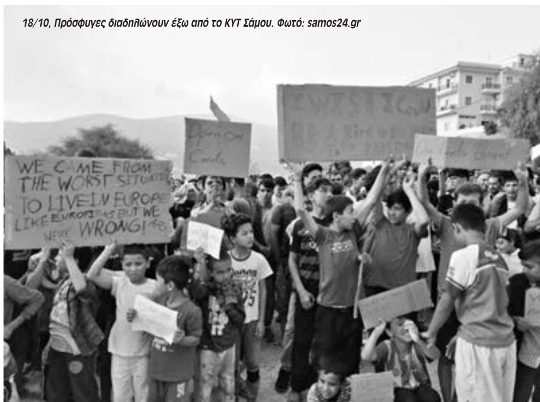
18/10, Πρόσφυγες διαδηλώνουν έξω από το ΚΥΤ Σάμου.

Αλλά σα να μην έφταναν όλα αυτά έρχεται η δημοτική αρχή Ανατολικής Σάμου, με τη στήριξη της περιφέρειας, της εκκλησίας, των εμπορικών συλλόγων – και δυστυχώς με την στήριξη του Εργατικού Κέντρου και της τοπικής ΑΔΕΔΥ να κλείσει τις υπηρεσίες του Δήμου και να καλέσει το απόγευμα της Δευ-