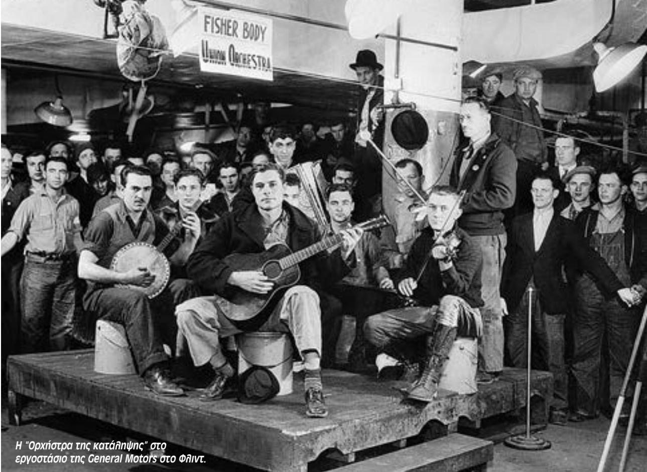
Η "Ορχήστρα της κατάληψης" στο εργοστάσιο της General Motors στο Φλίντ.

Χρεοκοπίες έγιναν, αλλά κυρίως μικρών τραπεζών ή μικρών επιχειρήσεων - και οι αγρότες χτυπήθηκαν ιδιαίτερα άγρια από τα βουνά των χρεών που είχαν στις τράπεζες. Όμως, οι μεγάλες μονοπωλιακές επιχειρήσεις που κυριαρχούσαν σε ολόκληρους κλάδους της οικονομίας μπορούσαν να αποφύγουν αυτή τη κατάληξη, βάζοντας τα εργοστάσιά τους να υπολειπούν και τσακίζοντας ακόμα περισσότερο μισθούς και δικαιώματα. Όμως, αυτές οι μέθοδοι απλά παρατείνανε την κρίση.