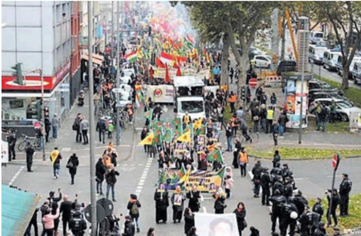
Διαδήλωση αλληλεγγύης στους Κούρδους στην Κολλωνία την Κυριακή 20 Οκτώβρη. Στην κάτω φωτό: Κούρδοι πετάνε σάπια λαχανικά στους Αμερικάνους που αποχωρούν.

Όμως, η συμφωνία που υπέγραψε ο Πενς δίνει στην Τουρκία την ευθύνη για την προστασία των αμάχων στις περιοχές που θα καταλάβει. Είναι λογικό ο κόσμος να φεύγει άρον άρον. Οι Κούρδοι γνωρίζουν με τι άγριες ορέξεις έρχεται ο τουρκικός στρατός και οι σύμμαχοί