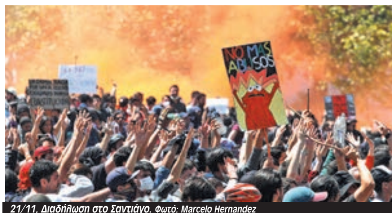
21/11, Διαδήλωση στο Σαντιάγο.

αιτήματα των εργαζομένων, των λαϊκών στρωμάτων, των νέων, των συνταξιούχων και των γυναικών".