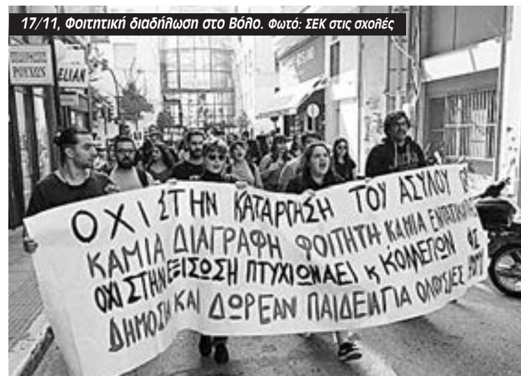
17/11, Φοιτητική διαδήλωση στο Βόλο.

Αρετή Κανέλλου, ΣΕΚ στις σχολές, Γιάννενα