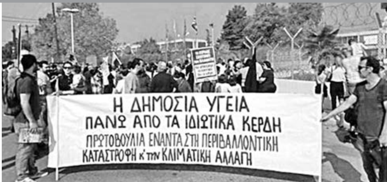
20/10, Θεσσαλονίκη.

“Συλλογικά και αγωνιστικά χρειάζεται να κινηθούμε με το νέο σωματείο την επόμενη περίοδο πατώντας στο συσχετισμό που έχουν κτίσει οι προηγούμενοι αγώνες μας, αυτός είναι ο αποτελεσματικός δρόμος για να υπερασπίσουμε δουλειές, μισθούς, δικαιώματα” σημειώνει η Πρωτοβουλία ΓΕΝΟΒΑ. Ως κύριες διεκδικήσεις προβάλλουν τα αιτήματα: Καμιά απόλυση. Όχι στην τρομοκρατία των ατομικών συμβάσεων εργασίας. Επαναφορά των συλλογικών συμβάσεων και μισθών μέσα από επιχειρησιακή σύμβαση με την εργοδοσία της IntracomTelecom, που θα επαναφέρουν πλήρως τα επίπεδα μισθών του 2010. Όχι στις αξιολογήσεις “που είναι εργαλείο εντατικοποίησης, πειθάρχησης, διάρεσης των εργαζομένων και συμπίεσης των μισθών. Καμιά παραβίαση, αντίθετα διεκδικήση και παραπέρα από τις νομοθετικές προβλέψεις που αφορούν στην πληρωμή των υπερωριών, των εκτός έδρας, των νυχτερινών, στην πληρωμή τα Σαββατοκύριακα, στο standby, στις συνθήκες υγιεινής και ασφάλειας”.