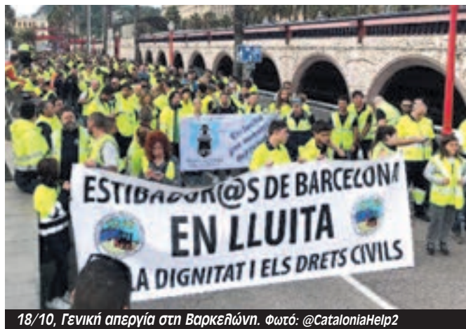
18/10, Γενική απεργία στη Βαρκελώνη.

Μ αζικές απεργίες και τεράστιες διαδηλώσεις σαράνουν την Καταλονία σαν απάντηση στις βάνουσες ποινές που επέβαλε το ανώτατο δικαστήριο του ισπανικού κράτους σε κορυφαίες πολιτικές προσωπικότητες υπέρ της ανεξαρτησίας, ποινές που έφτασαν τα 13 χρόνια φυλάκισης για τον Ορίολ Jonqueras, τον αντιπρόεδρο της Καταλονίας, και τα 9 με 12 χρόνια για τους υπόλοιπους.