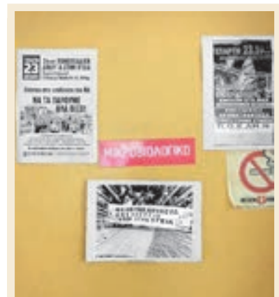
Μηνύμα από το Μικροβιολογικό Κέντρο Υγείας Άντισσας Λέσβου εν όψει της απεργίας 23/10. “Όλοι μαζί με τα παιδιά στην Αθήνα. Στέλνουμε τη Φ.Κ. να μας εκπροσωπήσει στον αγώνα για να διεκδικήσουμε τα αυτονόητα. Θέλουμε δουλειά, Όχι ανεργία, 4.000 στην Υγεία”.

“Σήμερα πραγματοποιήθηκε ανοιχτή σύσκεψη κατοίκων και φορέων της περιοχής στον χώρο της Πτέρυγας Μπόμπολα του νοσοκομείου Αμαλία Φλέμινγκ, στην οποία καλούσαν τα Σωματεία Εργαζομένων στα Νοσοκομεία «Αμαλία Φλέμινγκ», «Σισμανόγλειο» και Παιδων Πεντέλης.