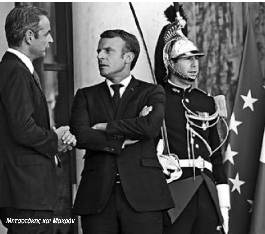
Μητσοτάκης και Μακρόν

Το πιο πιεστικό ζήτημα ήταν το Brexit . Η σύνοδος άνοιξε με μια “χαρμόσυνη είδηση” μιας νέας συμφωνίας, κυριολεκτικά στο παρά πέντε, ανάμεσα στην κυβέρνηση του Μπόρις Τζόνσον και την Ευρωπαϊκή Ένωση για την αποχώρηση της Βρετανίας στις 31 Οκτωβρίου. “Έχουμε καλά νέα” έσπευσε να δηλώσει την ώρα που έμπαινε στην σύνοδο ο Εμμανουέλ Μακρόν . Όπως αποδείχτηκε, όμως λίγες μέρες αργότερα, όταν το βρετανικό