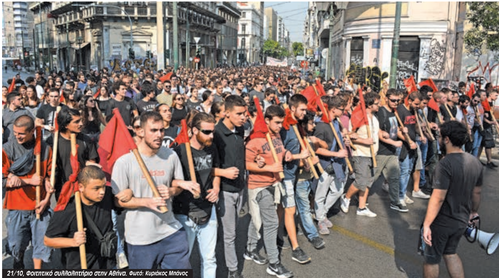
21/10, Φοιτητικό συλλαλητήριο στην Αθήνα.

“Στο Πάντειο η συστηματική δουλειά της προηγούμενης εβδομάδας οδήγησε στη μεγαλύτερη συνέλευση που έχουμε δει εδώ και πάρα πολλά χρόνια. Πάνω από 350 φοιτη-