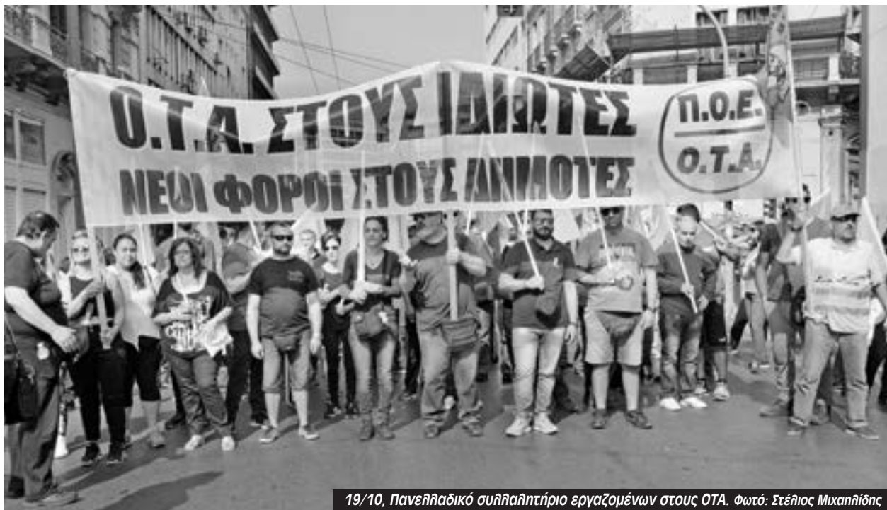
19/10, Πανελλαδικό συλλαλητήριο εργαζομένων στους ΟΤΑ.