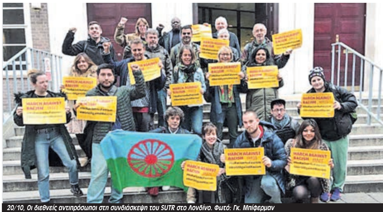
20/10, Οι διεθνείς αντιπρόσωποι στη συνδιάσκεψη του SUTR στο Λονδίνο.

γαλώνει μέρα με την ημέρα. Τώρα χρειαζόμαστε περισσότερη ενότητα και αλληλεγγύη σε διεθνές επίπεδο για να αντιμετωπίσουμε τον ρατσισμό και την άκρα δεξιά.