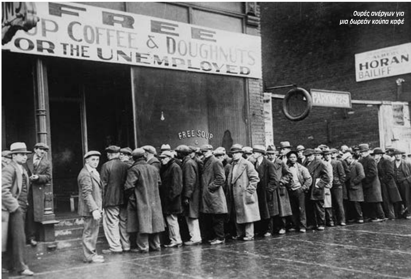
Ουρές ανέργων για μια δωρεάν κούπα καφέ

Το 1932 το 1/3 του εργατικού δυναμικού στις ΗΠΑ και τη Γερμανία και το 1/5 στην Βρετανία ήταν άνεργο. Αυτοί που είχαν πληγεί από την κρίση και την ανεργία δεν ήταν μόνο χειρώνακτες εργάτες, όπως είχε συμβεί σε προηγούμενες κρίσεις, αλλά και «χαρτογιακάδες» υπάλληλοι που θεωρούσαν τους εαυτούς τους κομμάτι της μεσοκλάς τάξης. Στις ΗΠΑ χρεοκόπησαν εκατοντάδες μικρές τράπεζες και στην Ευρώπη έγιναν μερικές θεαματικές καταρρεύσεις γιγάντιων τραπεζών εκμηδενίζοντας τις αποταμιεύσεις του κόσμου και εντείνοντας την γενικότερη αίσθηση καταστροφής. Η κρίση, μιας και χτύπησε όλες τις βιομηχανικές χώρες ταυτόχρονα, κατέστρεψε την ζήτηση για την παραγωγή των αγροτικών χωρών. Οι τιμές των αγροτικών προϊόντων κατέρρευσαν δημιουργώντας θάλασσες δυστυχίας. Καμιά περιοχή της υφηλίου δεν απέφυγε μια μείωση της παραγωγής και το παγκόσμιο εμπόριο μειώθηκε στο 1/3 του επιπέδου που είχε φθάσει το 1929.