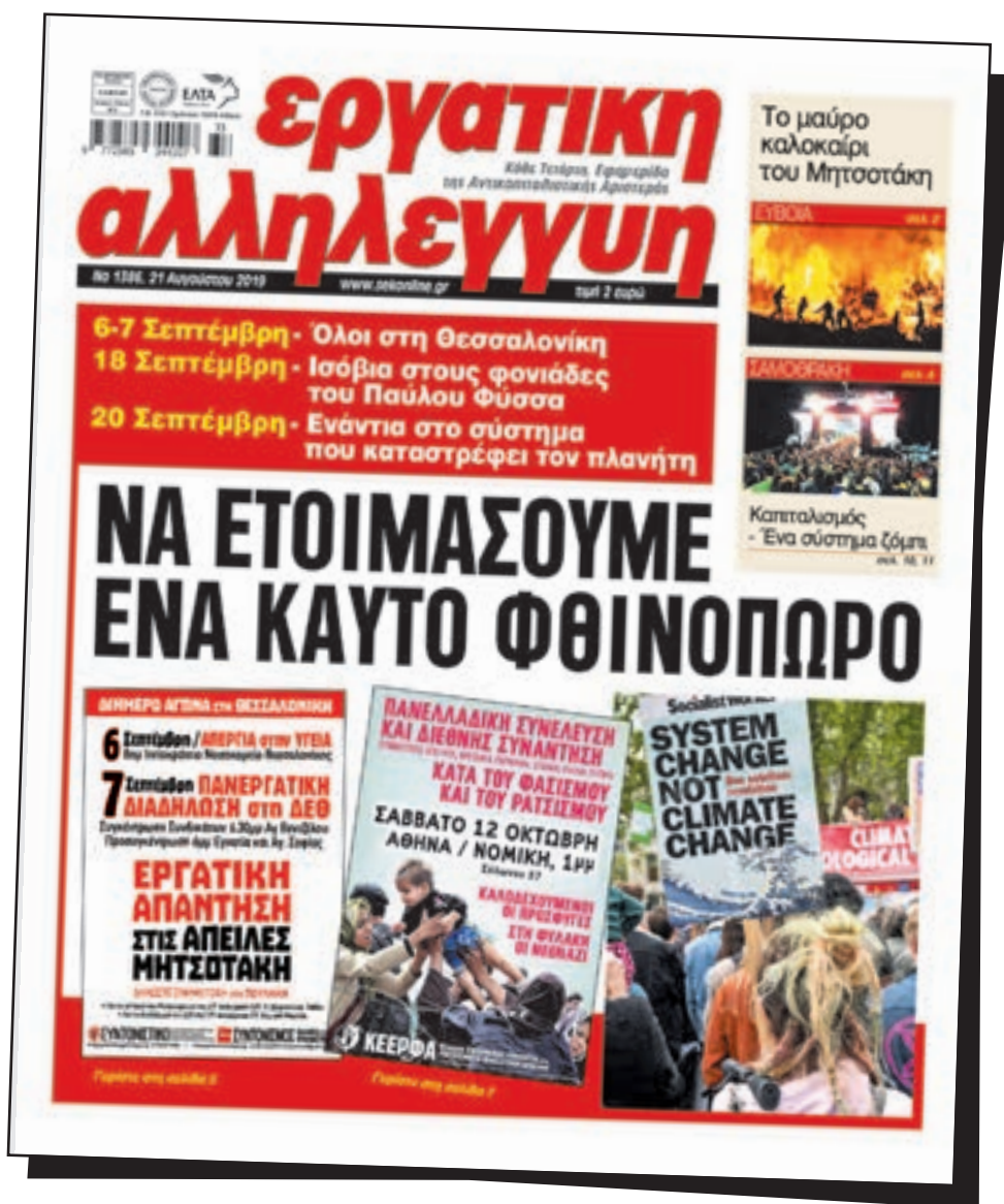
Πρωτοσέλιδο της Εργατικής Αλληλεγγυής στις 28 Αυγούστου 2019.

νης φάσης είναι το φθαρμένο κύρος των παραδοσιακών θεσμών και του πολιτικού κόσμου που τους διαχειρίζεται. Στην Αμερική, ο ύπατος θεσμός, ο “πλανητάρχης” κινδυνεύει στο πρόσωπο του Τραμπ να έχει την τύχη του Νίξον που σαρώθηκε από το τότε κύμα του κινήματος. Στην Ευρώπη, οι ηγέτες της ΕΕ παραπατούν από “ιστορικό λάθος” σε “ιστορικό λάθος” από τη Βρετανία ως τα Βαλκάνια. Ο κόσμος που διαδηλώνει διεθνώς την αλληλεγγύη του στους Κούρδους σιχαίνεται και τον Τραμπ και τον Πούτιν, και τον Ερντογάν και τον Άσαντ.