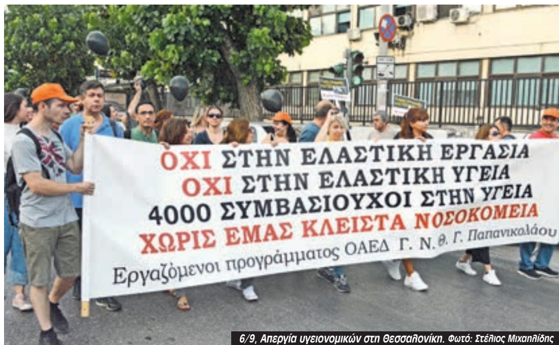
6/9, Απεργία υγειονομικών στη Θεσσαλονίκη.

“Στα νοσοκομεία μας η κατάσταση παραμένει τραγική” επισημαίνει το Συντονιστικό Νοσοκομείων . “Μπορεί τα τελευταία χρόνια με την «ένεση» των 12.000 και βάλε συμβασιούχων να μην έκλεισαν τα νοσοκομεία αλλά αυτό δεν σημαίνει ότι λειτουργούμε σωστά. Πέρα από τον άμεσο κίνδυνο να απολυθούν όλοι οι συμβασιούχοι από τον Κικίλια έως το πρώτο εξάμηνο του 2020, τα κενά παραμένουν τεράστια -πάνω από 40.000- τα μηχανήματα χαλάνε συνέχεια, η Πρωτοβάθμια Υγεία είναι διαλυμένη. Αντί να γίνουν μόνιμες προσλήψεις για να ανταποκριθεί το ΕΣΥ στις ανάγκες των εργαζόμενων, των φτωχών και των ανασφάλιστων η ΝΔ ξεκίνησε την διακυβέρνηση της απαγορεύοντας την νοσηλεία στα δημόσια νοσοκομεία των μεταναστών και των προσφύγων, στερώντας τους τη δυνατότητα να έχουν ΑΜΚΑ”.