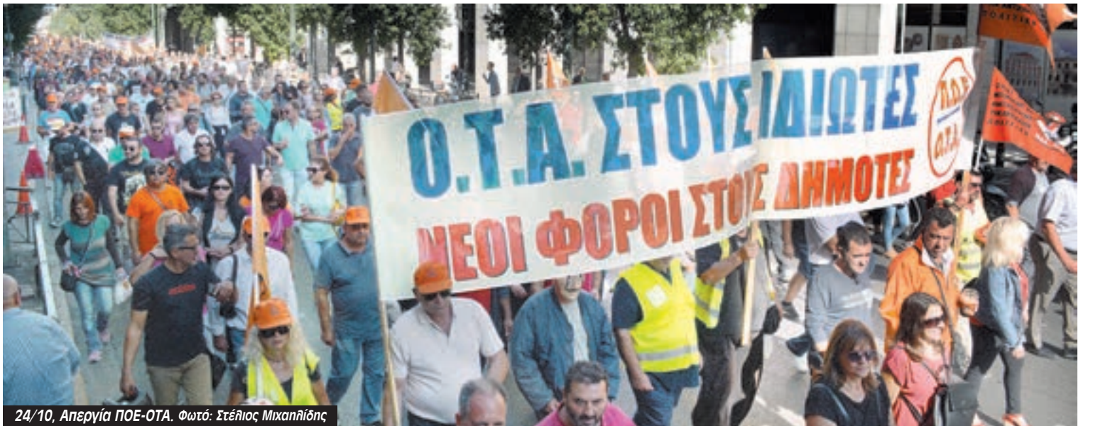
24/10, Απεργία ΠΟΕ-ΟΤΑ.

Τη σκυτάλη θα χρειαστεί να πάρουν οι ίδιοι οι εργαζόμενοι συνεχίζοντας και κλιμακώνοντας το απεργιακό κύμα, που αυτές τις μέρες έδειξε το ποιος έχει τη δύναμη να σταματήσει τις επιθέσεις της κυβέρνησης της ΝΔ, η οποία τα δίνει όλα στους καπιταλιστές. Είναι οι εργατικοί αγώνες και οι φοιτητικές καταλήψεις που ανοίγουν το δρόμο για να τα πάρουμε όλα πίσω”.