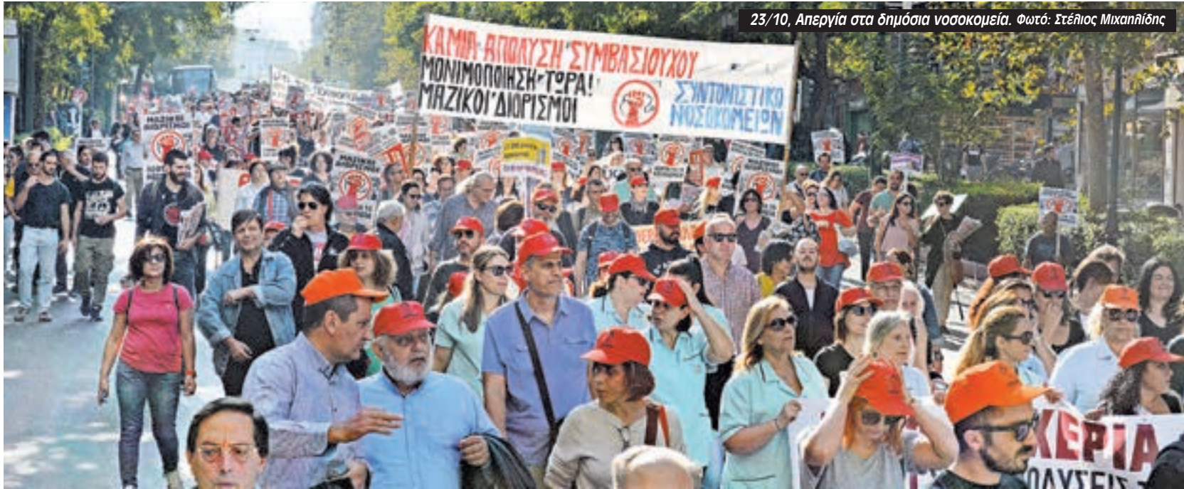
23/10, Απεργία στα δημόσια νοσοκομεία.

Η Τετάρτη 23/10 ήταν ημέρα 24ωρης πανελλαδικής απεργίας για όλους τους εργαζόμενους στη Δημόσια Υγεία. Από τον Έβρο μέχρι την Κρήτη, υγειονομικοί από όλη τη χώρα, συμμετείχαν στη μαζικότερη απεργιακή διαδήλωση που έχουν κάνει οι εργαζόμενοι των δημοσίων νοσοκομείων τα τελευταία χρόνια στην Αθήνα. 24ωρη απεργία είχαν κηρύξει οι ΠΟΕΔΗΝ και ΟΕΝΓΕ με κύριες διεκδικήσεις τη μονιμοποίηση όλων των συμβασιούχων, μαζικές προσλήψεις και αύξηση της χρηματοδότησης για τη δημόσια Υγεία.