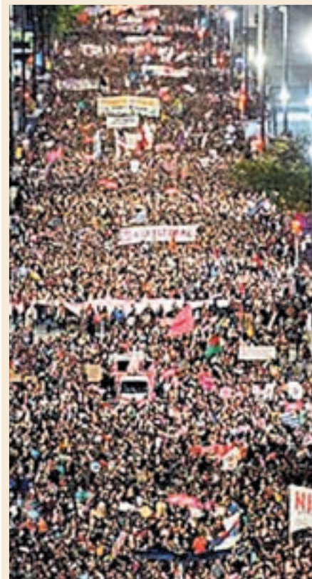
Μοντεβιδέο, 22 Οκτώβρη

Η μεγάλη διαδήλωση στο Μοντεβιδέο, δείχνει ότι ο άνεμος της Χιλής φτάνει και στην Ουρουγουάη (άλλο πρότυπο «σταθερότητας» στην Λατινική Αμερική) όποια κι αν είναι τα αποτελέσματα των εκλογών.