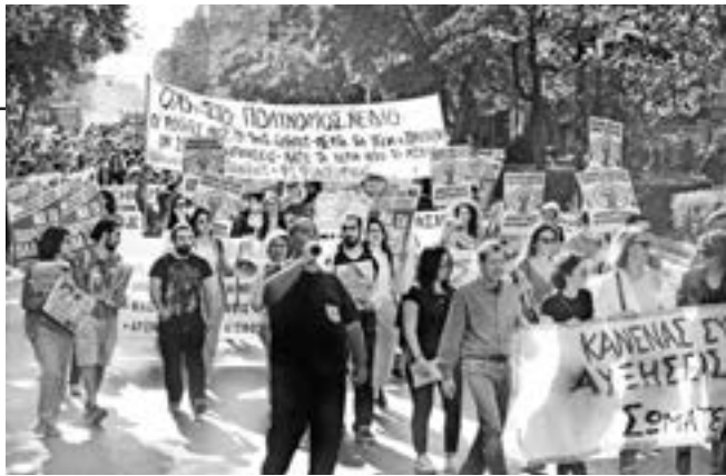
Οι καταλήψεις Παντείου και Φιλοσοφικής στην απεργιακή διαδήλωση των νοσοκομείων, Αθήνα 23/10.