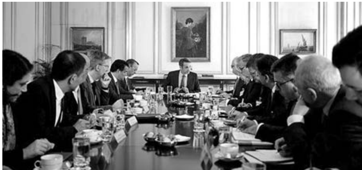
Μητσοτάκης (πάνω) και Τσίπρας (κάτω) με τους τραπεζίτες

άλλο παρά ετοιμόρροπους εγχώριους τραπεζίτες) με άλλα 9 περίπου δισεκατομμύρια Ευρώ.