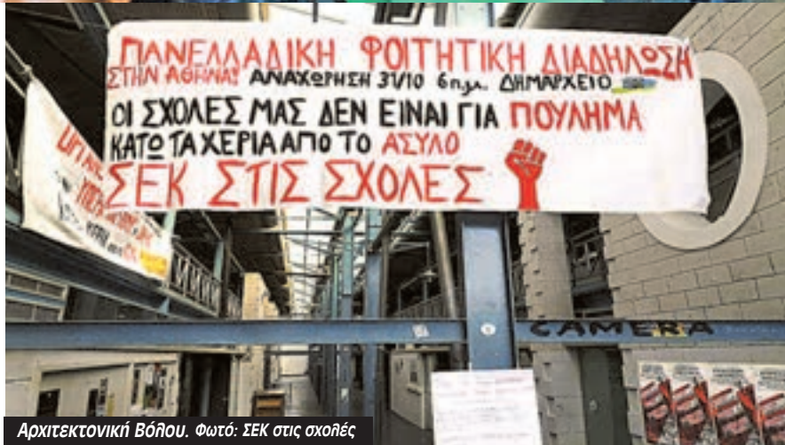
Αρχιτεκτονική Βόλου.