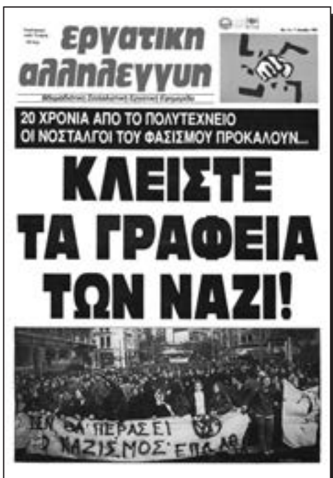
Πάνω πρωτοσέλιδο της ΕΑ στις 17 Νοέμβρη 1993, κάτω το κάλεσμα στις 6 Νοέμβρη 2019.