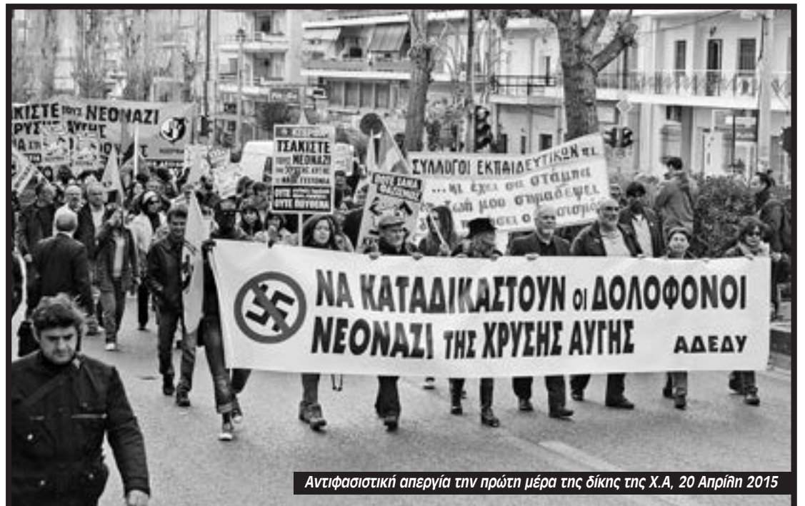
Αντιφασιστική απεργία την πρώτη μέρα της δίκης της Χ.Α., 20 Απρίλη 2015

Στα αναγνωστέα που έφερε η πολιτική αγωγή ήταν επίσης οι δεκάδες καταδικαστικές αποφάσεις σε βάρος μελών και στελεχών της Χρυσής Αυγής. Δείχνουν ότι ο τρόπος δράσης ήδη από τη δεκαετία του '90 είναι παντού παρόμοιος και ανταποκρίνεται στο σκοπό, που δεν είναι άλλος από τη φυσική εξόντωση των εχθρών του φασισμού και την καλλιέργεια του τρόμου σε όλη την κοινωνία.