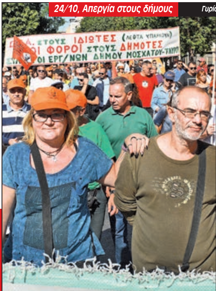
24/10, Απεργία στους δήμους