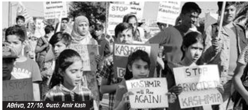
Αθήνα, 27/10.

Πιστεύουμε ότι ο αγώνας δεν πρέπει να σταματήσει γιατί, συν τους άλλους, δεν είναι μάταιος. Προτείνουμε να πάρουν την υπόθεση του Ελληνικού στα χέρια τους όλα τα κινήματα για την πόλη και το περιβάλλον στην Αττική. Η πρότασή μας αφορά μεταξύ άλλων που θα προταθούν συγκέντρωση επίκαιρης ενημέρωσης του λαού της Αττικής στο Σύνταγμα..."