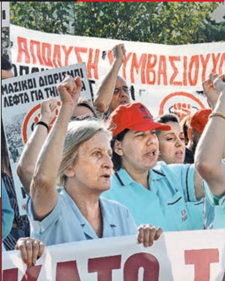
23/10, Απεργία στα νοσοκομεία