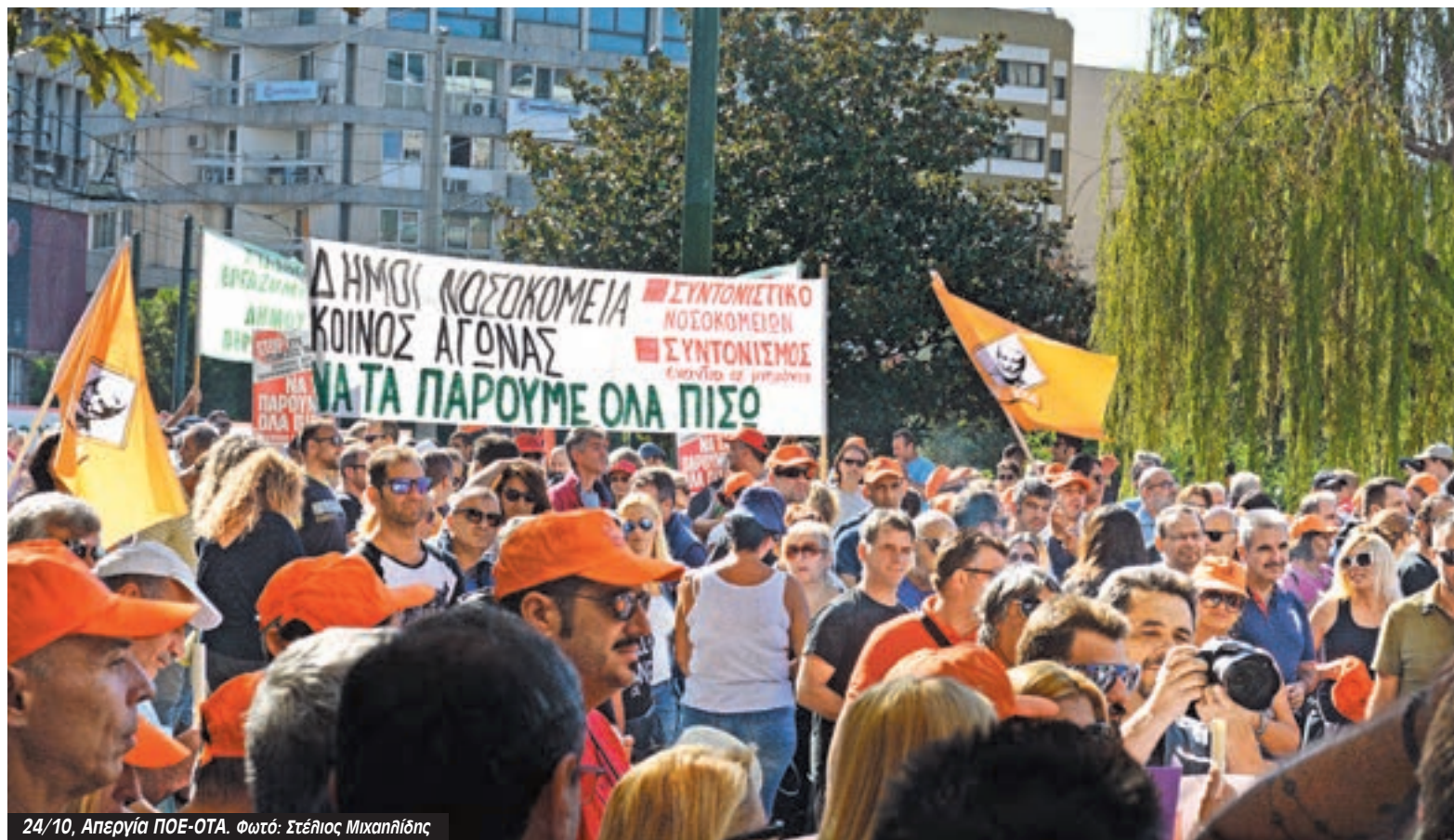
24/10, Απεργία ΠΟΕ-ΟΤΑ.