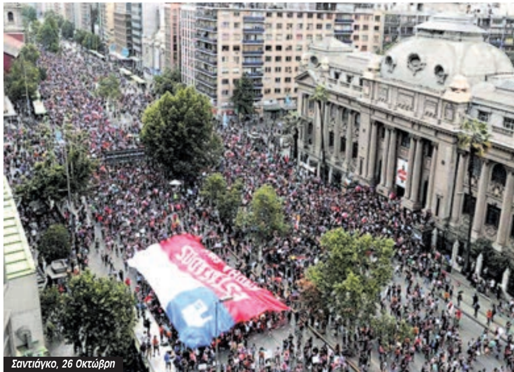
Σαντιάγκο, 26 Οκτώβρη

Μικρές παραχωρήσεις που ήρθαν πολύ αργά. Οι Φαινάνσιαλ Τάιμς υπολόγισαν ότι το κόστος του «πακέτου» ανέρχεται το πολύ σε 1,2 δις δολάρια, στο 0,4% του ΑΕΠ της Χιλής. Ένας πανεπιστημιακός εξηγεί στην ίδια εφημερίδα ότι «Να πέφτουν λεφτά σε αυτή την κατάσταση είναι ένα βήμα στην σωστή κατεύθυνση. Όμως, δεν θα λύσουν το βαθύτερο πρόβλημα.