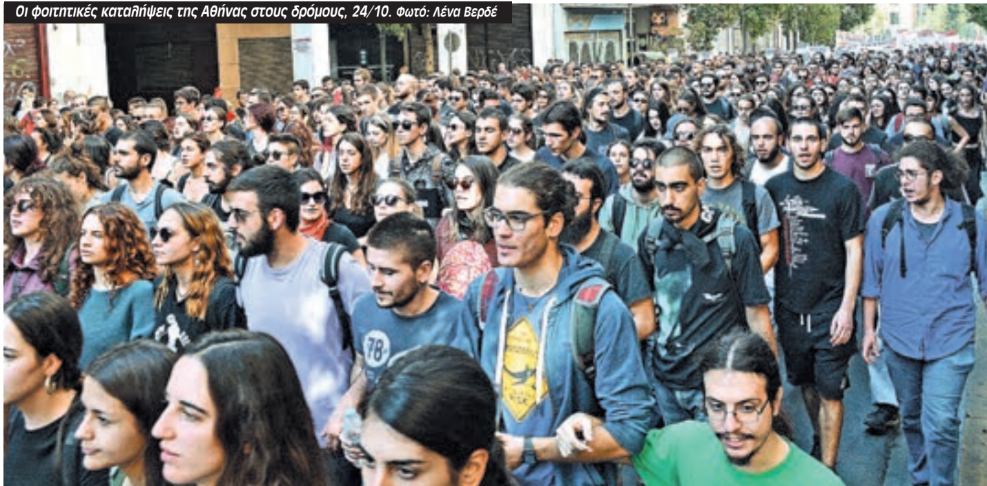
Οι φοιτητικές καταλήψεις της Αθήνας στους δρόμους, 24/10.