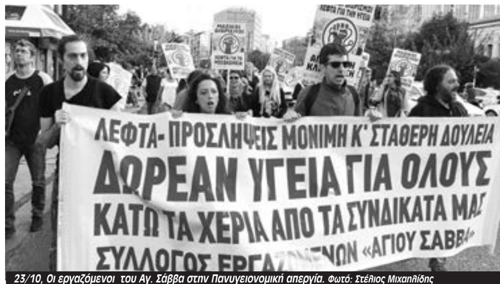
23/10, Οι εργαζόμενοι του Αγ. Σάββα στην Πανυγειονομική απεργία.

Με το που πληροφορήθηκαν οι εργαζόμενοι του νοσοκομείου τις απολύσεις σήμανε συναγερμός. Την Πέμπτη 24/10, δεκάδες εργαζόμενες κι εργαζόμενοι, μόνιμοι και συμβασιούχοι, συγκεντρώθηκαν στο προαύλιο του