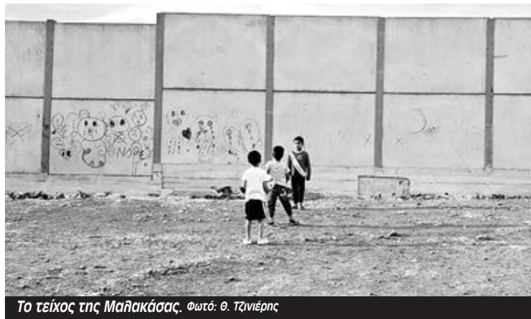
Το τείχος της Μαλακάσας.

Οι τοπικές επιτροπές ΚΕΕΡΦΑ Βορείων σύμφωνα με την ανακοίνωσή τους μιλώντας «με δεκάδες πρόσφυγες και προσφύγισες για τις επιθέσεις της κυβέρνησης Μητσοτάκη: το αντεργατικό νομοσχέδιο Χατζηδάκη, την ΚΥΑ που χαρακτηρίζει την Τουρκία ασφαλή τρίτη χώρα για την πλειονότητα των αιτούντων άσυλο στην Ελλάδα, τη διάλυση του ΕΣΥ» και κάλεσαν τους πρόσφυγες και τις προσφύγισες στο συλλαλητήριο της Τετάρτης 16/6, 11μμ, ενάντια στην ψήφιση του ν/σ Χατζηδάκη.