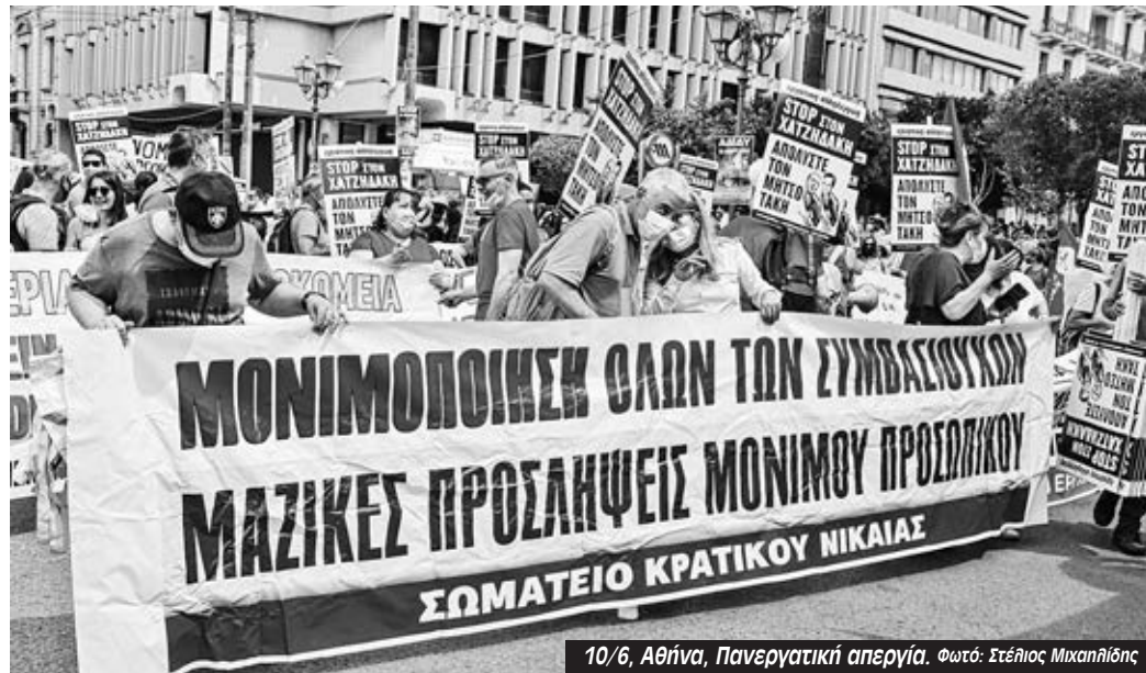
10/6, Αθήνα, Πανεργατική απεργία.

Οι εργαζόμενοι και οι εργαζόμενες στα νοσοκομεία δεν έχουν σταματήσει να δίνουν μάχες σε όλη τη διάρκεια της πανδημίας και έχουν παίξει καθοριστικό ρόλο στο φούντωμα του κινήματος που οδήγησε στις τρεις πανεργατικές απεργίες ενάντια στον νόμο Χατζηδάκη. Το υγειονομικό κίνημα δίνει από τώρα τη συνέχεια, καθώς οι εξαγγελίες του Μητσοτάκη για “αναδιάρθρωση” του ΕΣΥ είναι προάγγελος ακόμα μεγαλύτερων επιθέσεων και συνέχια των πολιτικών διάλυσης και ιδιωτικοποίησής του. Οι εργαζόμενοι/ες στο ΕΣΥ οργανώνουν στους χώρους τους την επόμενη μεγάλη απεργία των νοσοκομείων, στις 23 Ιούνη, μετά από τη μεταφορά της απεργίας και πανελλαδικής κινητοποίησης της ΠΟΕΔΗΝ.