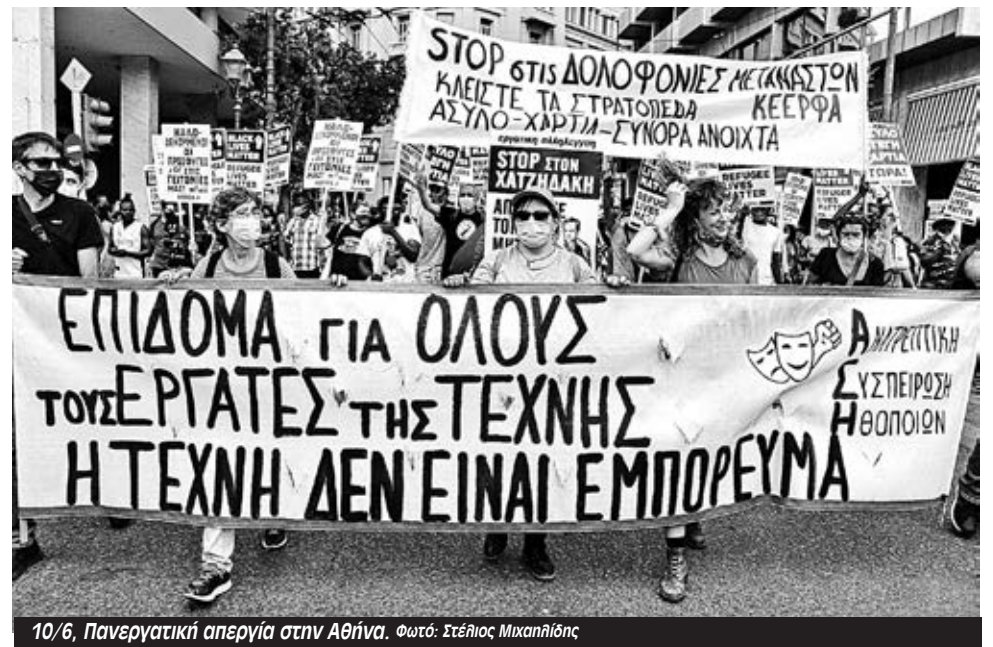
10/6, Πανεργατική απεργία στην Αθήνα.

«Θέλουν να περάσουν το ν/σ εν μέσω πανδημίας, εξαιτίας της οποίας αποκαλύφθηκε με τον πιο καταφανή τρόπο, πόσο σημαντική είναι η ύπαρξη ενός δυ-