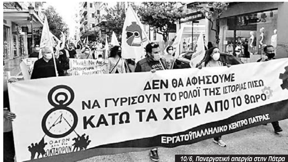
10/6, Πανεργατική απεργία στην Πάτρα

Μαζική η απεργιακή συγκέντρωση που κάλεσε το Εργατικό Κέντρο και η τοπική ΑΔΕΔΥ και στον Βόλο. Ακολούθησε πορεία στο κέντρο της πόλης και πίσω από τα συνδικάτα βρέθηκαν με τα πανό τους οργανώσεις της Αριστεράς. Ταυτόχρονα έγιναν δύο ακόμα συγκεντρώσεις και πορείες. Στην παρέμβασή μας με την Εργατική Αλληλεγγυή οι απεργοί συμφωνούσαν ότι πρέπει να συνεχίσουμε, απεργιακά και ενωτικά.