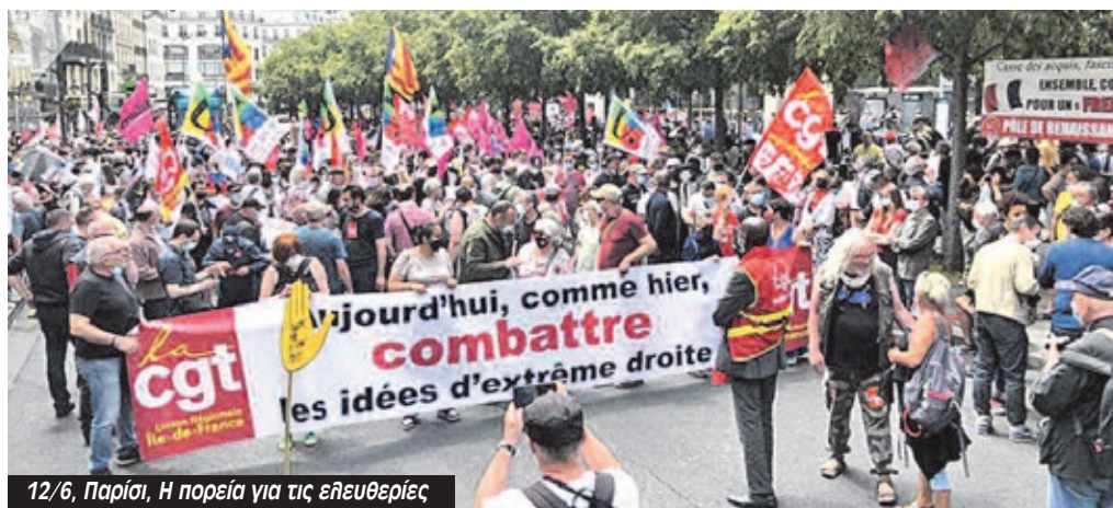
12/6, Παρίσι, Η πορεία για τις ελευθερίες

Στις διάφορες δημοσκοπήσεις για τις επερχόμενες προεδρικές εκλογές η ΕΣ φτάνει το 25-30% και ισοφαρίζει ή και ξεπερνά το «Εμπρός» του Εμμανουέλ Μακρόν. Οι αντεργατικές επιθέσεις, η διαχείριση της πανδημίας προς όφελος των μεγάλων αφεντικών σε συνδυασμό με τις απόπειρές του να περάσει κατασταλτικούς νόμους έχουν οδηγήσει το κόμμα του σε πτώση αλλά η Αριστερά δεν έχει καταφέρει να αξιοποιήσει αυτή την απογοήτευση. Αντίθετα, αυτή που την καρπώνεται μέχρι