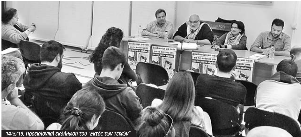
14/5/19, Προεκλογική εκδήλωση του «Εκτός των Τειχών»

Δημήτρης: Για όλα τα παραπάνω ζητήματα αλλά και για τα ζητήματα