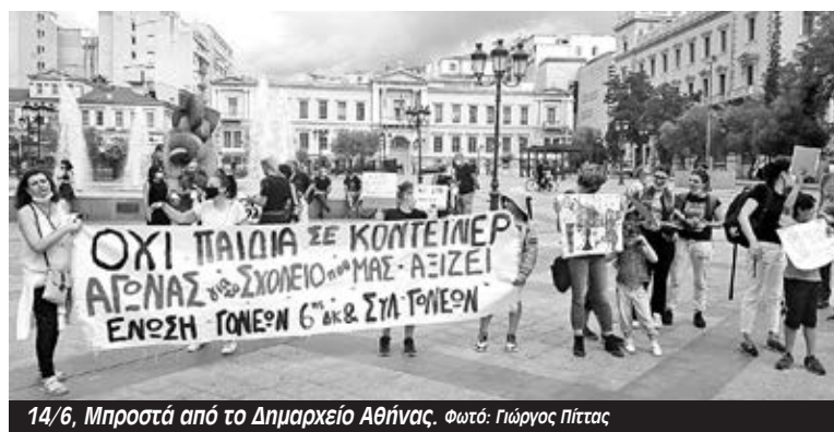
14/6, Μπροστά από το Δημαρχείο Αθήνας.

Μ αζική κινητοποίηση πραγματοποιήθηκε την Δευτέρα 14/6 στο Δημαρχείο, την ώρα που συνεδριάζει το δημοτικό συμβούλιο της Αθήνας, από μαθητές, γονείς και εκπαιδευτικούς του 133ου και 28ου δημοτικού σχολείου καθώς και της Ένωσης Γονέων της 6ης δημοτικής κοινότητας που απαιτούν να μην μπουν κοντέινερ στις αυλές των σχολείων και να δοθεί σοβαρή και μόνιμη λύση στο κτηριακό πρόβλημα της στέγασης της δίχρονης προσχολικής εκπαίδευσης.