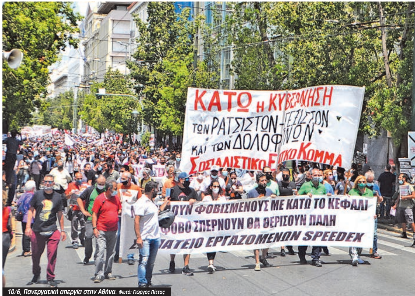
10/6, Πανεργατική απεργία στην Αθήνα.