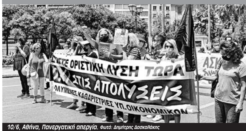
10/6, Αθήνα, Πανεργατική απεργία.