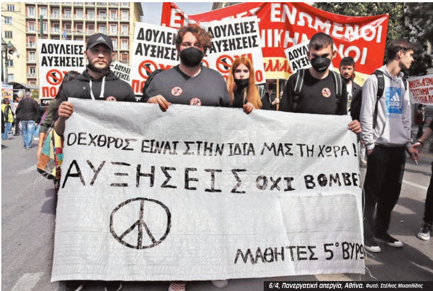
6/4, Πανεργατική απεργία, Αθήνα.

Τους τελευταίους μήνες έχουμε προχωρήσει σε τολμηρές αλλαγές στους πυρήνες και τις ηγεσίες τους, αξιοποιώντας παλιούς και νέους συντρόφους. Τα νέα μέλη είναι η κινητήρια δύναμη κάθε πυρήνα, το βλέπουμε για παράδειγμα στα Πατήσια που έχουμε πολλούς νέους συντρόφους και συντρόφισσες. Χρειαζόμαστε οργανωμένους πυρήνες, με προσπάθεια να τους κερδίσουμε όλους στη δράση, με ανανεώσεις όλων των μελών, με συνεδρίαση που είναι γεγονός στη γειτονιά. Και με την ίδια σταθερότητα να γίνεται η παρέμβαση τους εργατικούς χώρους. Θέλουμε ζωντανό διάλογο με