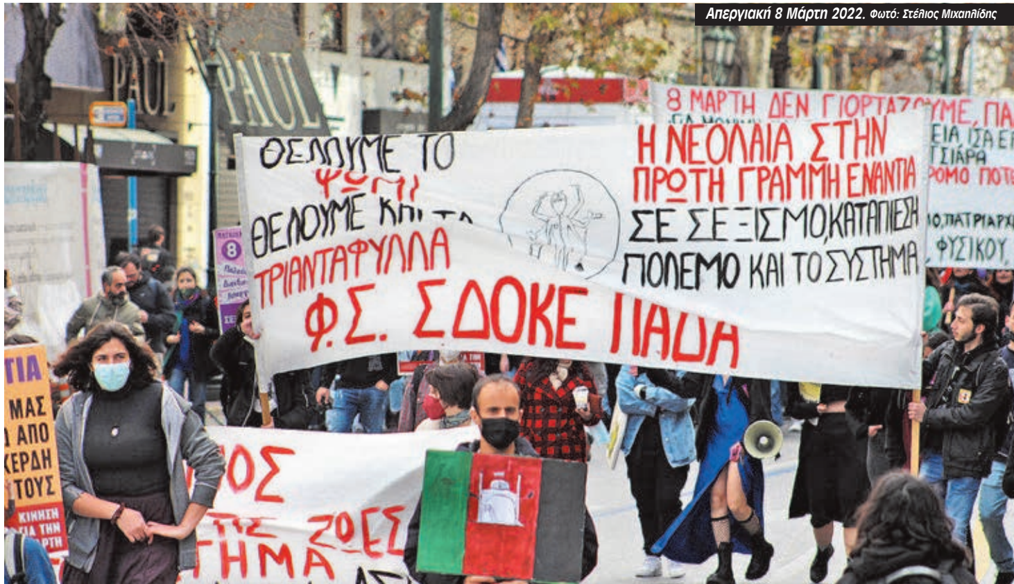
Απεργιακή 8 Μάρτη 2022.

Η κυβέρνηση της Νέας Δημοκρατίας σε όλη την περίοδο της διακυβέρνησής της ακολουθεί την πολιτική των περικοπών και των ιδιωτικοποιήσεων. Μητσοτάκης και Κεραμέως θέλουν μια εκπαίδευση που οι φοιτητές θα πληρώνουν και τελικά δεν θα μπορούν να τα βγάλουν πέρα.