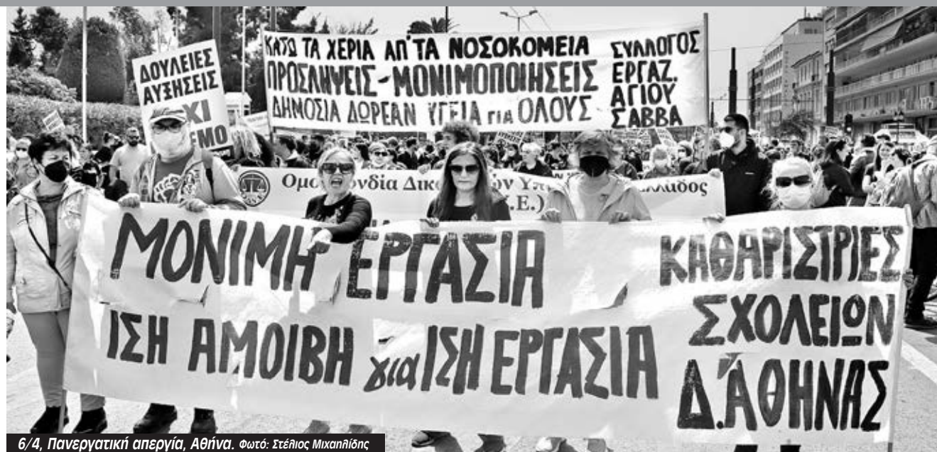
6/4, Πανεργατική απεργία, Αθήνα.

Κ αλούμε όλες και όλους τους συναδέλφους να συμμετέχουν στη διαδήλωση της Εργατικής Πρωτομαγιάς. Απεργήσαμε στις 6 Απρίλη ενάντια στον πόλεμο και την ακρίβεια. Ενάντια στην πολιτική της Νέας Δημοκρατίας και την κερδοσκοπία που γίνεται πάνω στην ενέργεια. Δίνουμε συνέχεια στον αγώνα.