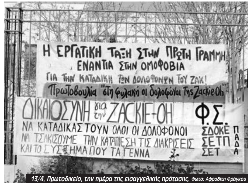
13/4, Πρωτοδικείο, την ημέρα της εισαγγελικής πρότασης.

Αντί όμως αυτό να τον οδηγήσει σε αποδοχή του αιτήματος της οικογένειας Κωστόπουλου για μετατροπή της κατηγορίας σε ανθρωποκτονία με ενδεχόμενο δόλο, στην επόμενη αποστολή του λόγου του τούς ρίχνει στα μαλακά λέγοντας: «Ο θάνατος οφείλεται σε αμέλεια του πρώτου και δευτέρου κατηγορουμένου ... έδρασαν απερίσκεπτα και έπληξαν τον παθόντα με τρόπο