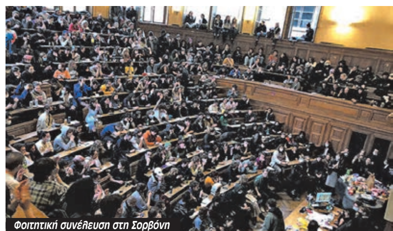
Φοιτητική συνέλευση στη Σορβόνη