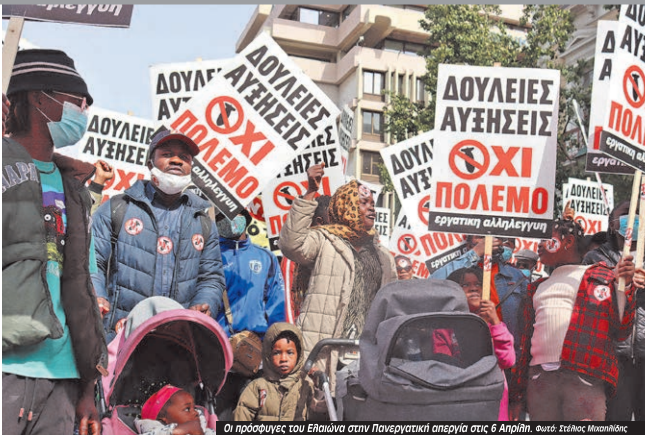
Οι πρόσφυγες του Ελαιώνα στην Πανεργατική απεργία στις 6 Απρίλη.

Η εισαγγελική πρόταση και η απόφαση θα βγουν στις 18 Μάη.