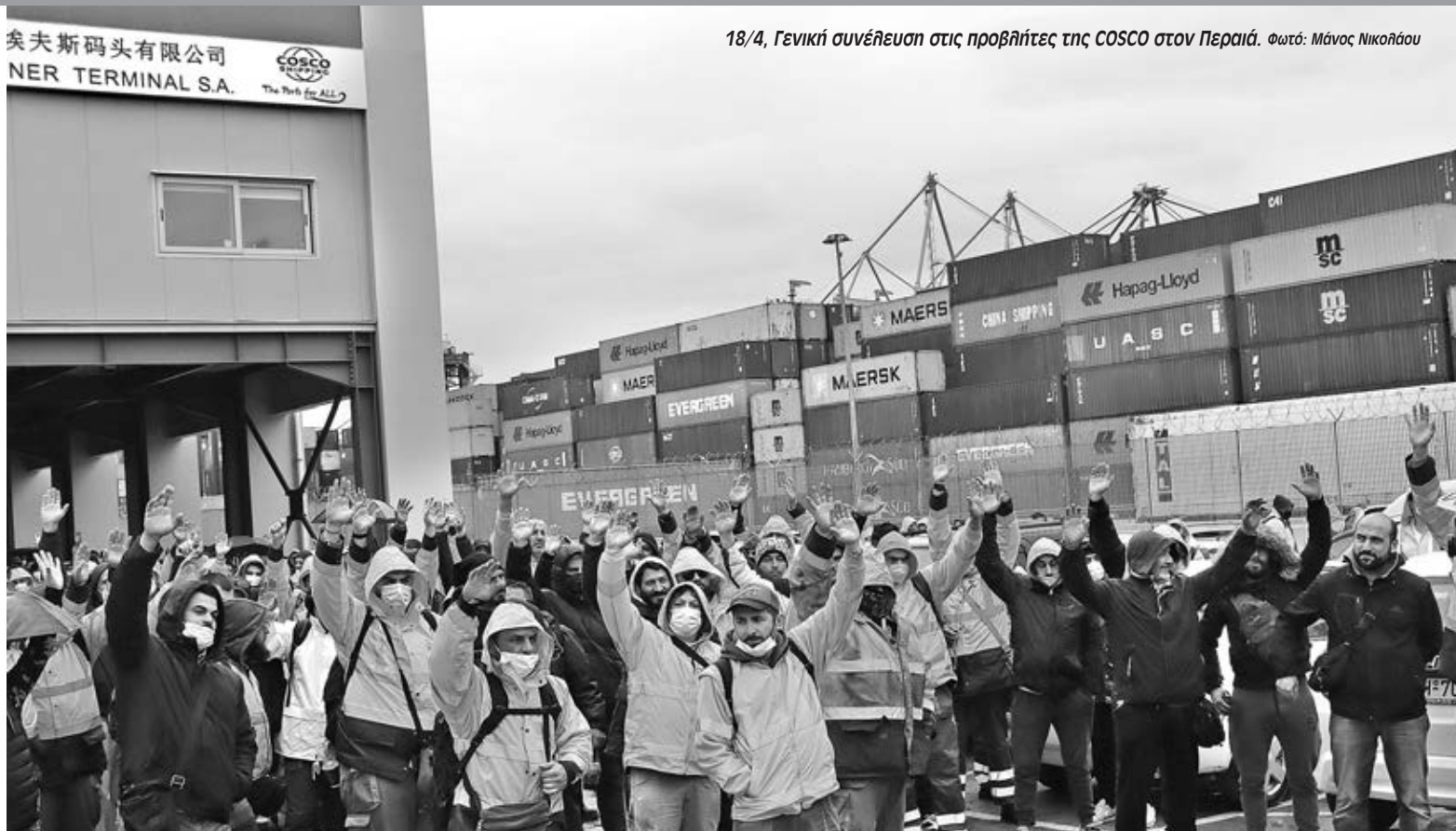
18/4, Γενική συνέλευση στις προβαίτες της COSCO στον Πειραιά.

Δεν μπορώ να κατανοήσω την ανάπτυξη που λένε ότι θα φέρει αυτό το έργο. Σίγουρα δεν θα είναι για την Αλεξανδρούπολη, ακόμα και την εξέδρα από έξω θα την φέρουν. Το θέμα είναι πόσες περισσότερες δουλειές εργασίας θα κλείσουν με αυτό το έργο σε σχέση με όσες ανοίξουν. Στον νομό Έβρου άλλες βιομηχανίες δεν υπάρχουν. Ο πρωτογενής τομέας είναι πολύ σημαντικός για την περιοχή, ειδικά τώρα που μιλούν για επισιτιστική κρίση. Θα πρέπει να δοθούν δυνατότητες να δουλέψουν οι παραγωγοί και όχι να μένουν στην άκρη».