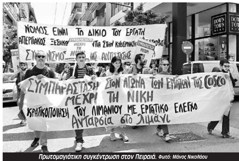
Πρωτομαγιάτικη συγκέντρωση στον Πειραιά.