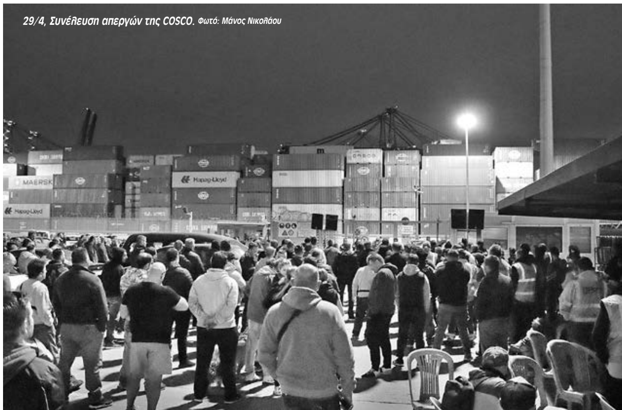
29/4, Συνέλευση απεργών της COSCO.

Η οργή ξεχείλισε στο λιμάνι. Σε κάθε συνέλευση που γινόταν καθημερινά η απόφαση για συνέχιση της