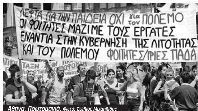
Αθήνα, Πρωτομαγιά.

Παρασκευή 6 Μάη 2μμ Αίθ. 11, πληροφορικής Ομιλητές: Νίκος Δημητρόπουλος, Κώστας Δεδικούσης και Αρετή Κανέλλου