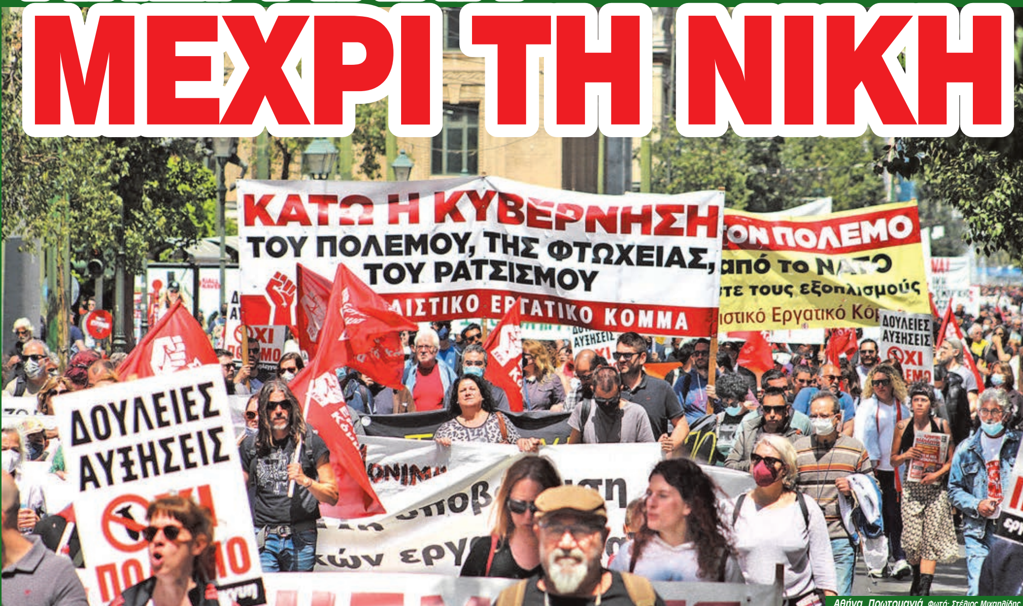
Αθήνα, Πρωτομαγιά.

Οργή για τους δολοφόνους του Ζακ σελ. 14 • Για πάντα στη φυλακή η ΧΑ σελ. 15