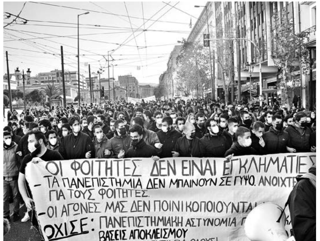
21/1/2021, Διαδήλωση ενάντια στην Πανεπιστημιακή αστυνομία.

Σ τις 18 Μάη είναι προγραμματισμένες οι φοιτητικές εκλογές, οι πρώτες από την άνοιξη του 2019. Ουσιαστικά οι πρώτες επί κυβέρνησης Μητσοτάκη. Αυτό σημαίνει ότι μια ολόκληρη νέα φουρνιά φοιτητών/ριών που αντιστοιχεί σε τουλάχιστον δύο ακαδημαϊκά έτη, χιλιάδες νέοι/ες, δεν έχουν συμμετάσχει ποτέ σε εκλογές των συλλόγων τους. Δεν ισχύει όμως το ίδιο σε σχέση με τους αγώνες που έχει δώσει αυτός ο κόσμος κι έχουν σημάδεψει τους εφιάλτες αυτής της κυβέρνησης αλλά και τη συνείδηση των φοιτητών/ριών. Αγώνες που βρήκαν την επαναστατική αριστερά και τα ΕΑΑΚ στην πρώτη γραμμή.