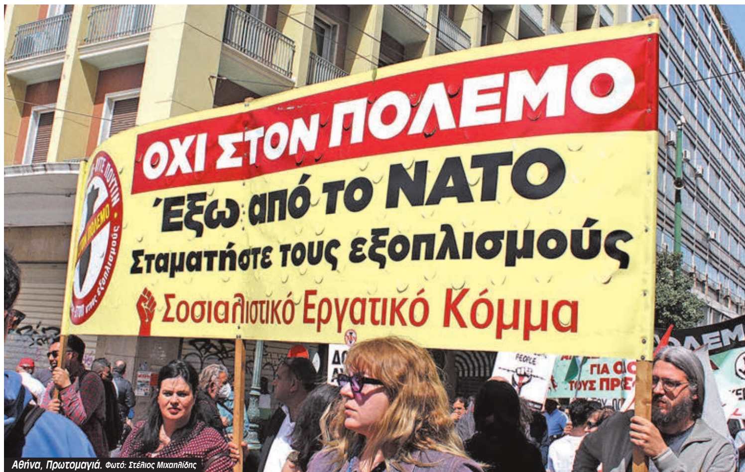
Αθήνα, Πρωτομαγιά.