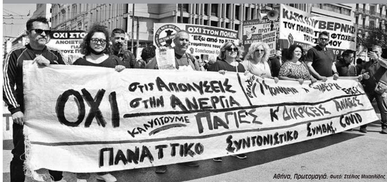
Αθήνα, Πρωτομαγιά.