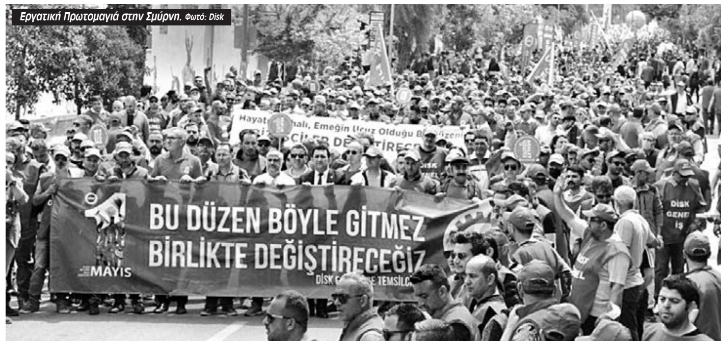
Εργατική Πρωτομαγιά στην Σμύρνη.

Αν προκαλείται κρίση για ένα νησιωτικό κράτος 650 χιλιάδων κατοίκων, για την κορεάτικη χερσόνησο, που παραμένει διχασμένη εδώ και 75 χρόνια λόγω των ιμπεριαλιστικών ανταγωνισμών, ο κίνδυνος είναι ασύγκριτα σημαντικότερος. Η ανάγκη για σύνδεση των εργατικών αγώνων με τον αγώνα ενάντια στον ιμπεριαλισμό και τον πόλεμο, όπως την οργανώνουν οι σύντροφοι της Εργατικής Αλληλεγγύης, ποτέ δεν ήταν μεγαλύτερη.