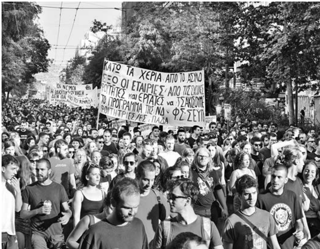
23/7/2019, Διαδήλωση ενάντια στην κατάργηση του Πανεπιστημιακού ασύλου.