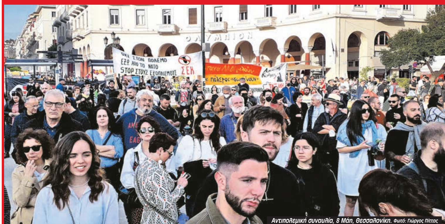
Αντιπολεμική συναυλία, 8 Μάη, Θεσσαλονίκη.