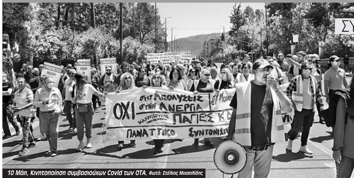
10 Μάη, Κινητοποίηση συμβασιούχων Covid των ΟΤΑ.