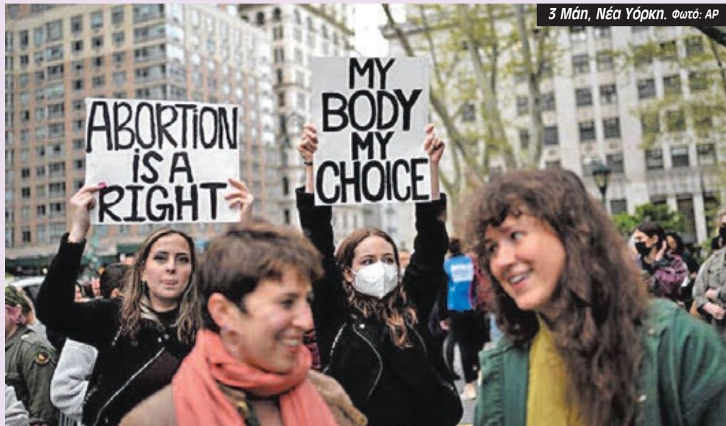
3 Μάη, Νέα Υόρκη.

Το γυναικείο κίνημα δεν βρέθηκε απροετοίμαστο μπροστά σε αυτές τις εξελίξεις. Το φθινόπωρο, η μάχη είχε ξεκινήσει με επίκεντρο την Πολιτεία του Τέξας, όπου η κυβέρνηση απαγόρευσε τις εκτρώσεις. Για να αποφευχθεί η αντισυνταγματικότητα του Νόμου, αντί η απαγόρευση να επιβάλλεται από το κράτος, επιβάλλεται από "ιδιώτες", δηλαδή ακροδεξιούς και τις οργανώσεις τους που μάλιστα παίρνουν και χρηματικό βραβείο για το χαφιεδισμό τους. Ξέσπασαν διαδηλώσεις αλληλεγγύης στις γυναίκες του Τέξας σε όλες τις Πολιτείες, που έφτασαν ως την Αθήνα με πρωτοβουλία της "Κίνησης για μια Απεργιακή 8 Μάρτη". Το Τέξας δεν ήταν απομονωμένο παράδειγμα. Μόνο μέσα στο 2022, υπολογίζεται ότι έχουν περάσει 519 καινούργιοι περιορισμοί στην έκτρωση σε 41 διαφορετικές Πολιτείες.