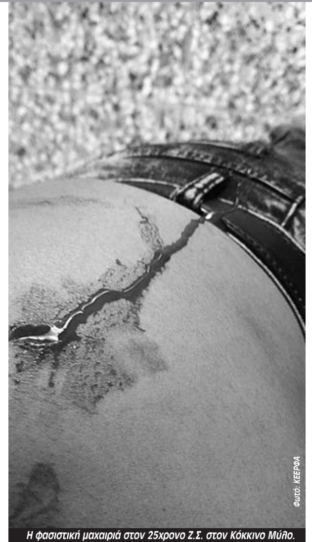
Η φασιστική μαχαίριά στον 25χρονο Ζ.Σ. στον Κόκκινο Μύλο.

Στις ανακοινώσεις της η ΚΕΕΡΦΑ τονίζει ότι όχι μόνο η ισλαμοφοβική κλιμάκωση της κυβέρνησης δίνει αέρα στα πανιά τέτοιων ομάδων, αλλά και ότι τα απομεινάρια της ίδιας της Χρυσής Αυγής παραμένουν ασύλληπτα, ενώ επιτρέπεται στους ηγέτες της να κάνουν εκπομπές μέσα από τη φυλακή και να καλλιεργούν ρατσιστικό μίσος. “Η ΚΕΕΡΦΑ αλλά και κόμματα της αριστεράς, όπως το ΚΚΕ, έχουν καταγγείλει την PROPATRIA που συνεργάζεται με τη συμμορία του φυλακισμένου Κασσιδιάρη για ανάλογες επιθέσεις κατά μελών της ΚΕΕΡΦΑ, της ΚΝΕ και του ΠΑΜΕ στο Ν. Ηράκλειο και το Μενίδι. Η εισαγγελική έρευνα για την σύνδεση των περιστατικών και την ύπαρξη εγκληματικής οργάνωσης, που έχει ξεκινήσει μετά τις επιθέσεις σε Θεσσαλονίκη, Ν.Ηράκλειο και Κοκκινιά είναι σε εξέλιξη. Χρειάζεται όμως να ολοκληρωθεί πριν θρηνησουμε νεκρούς από τις νέες επιθέσεις των φασιστών”, τονίζει.