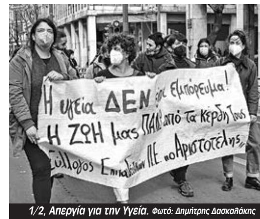
1/2, Απεργία για την Υγεία.

κούς γιατρούς που συγκρούστηκαν με τον Πλεύρη, μέχρι την πάλη ενάντια στο σεξισμό και την καταπίεση των γυναικών με τη συμμετοχή στην απεργιακή 8 Μάρτη. Από τη σύγκρουση με το αντεργατικό νομοσχέδιο Χατζηδάκη, μέχρι τη μάχη ενάντια στον ρατσισμό, τον φασισμό και τον πόλεμο με συμμετοχή στο συλλαλητήριο της 19ης Μαρτίου.