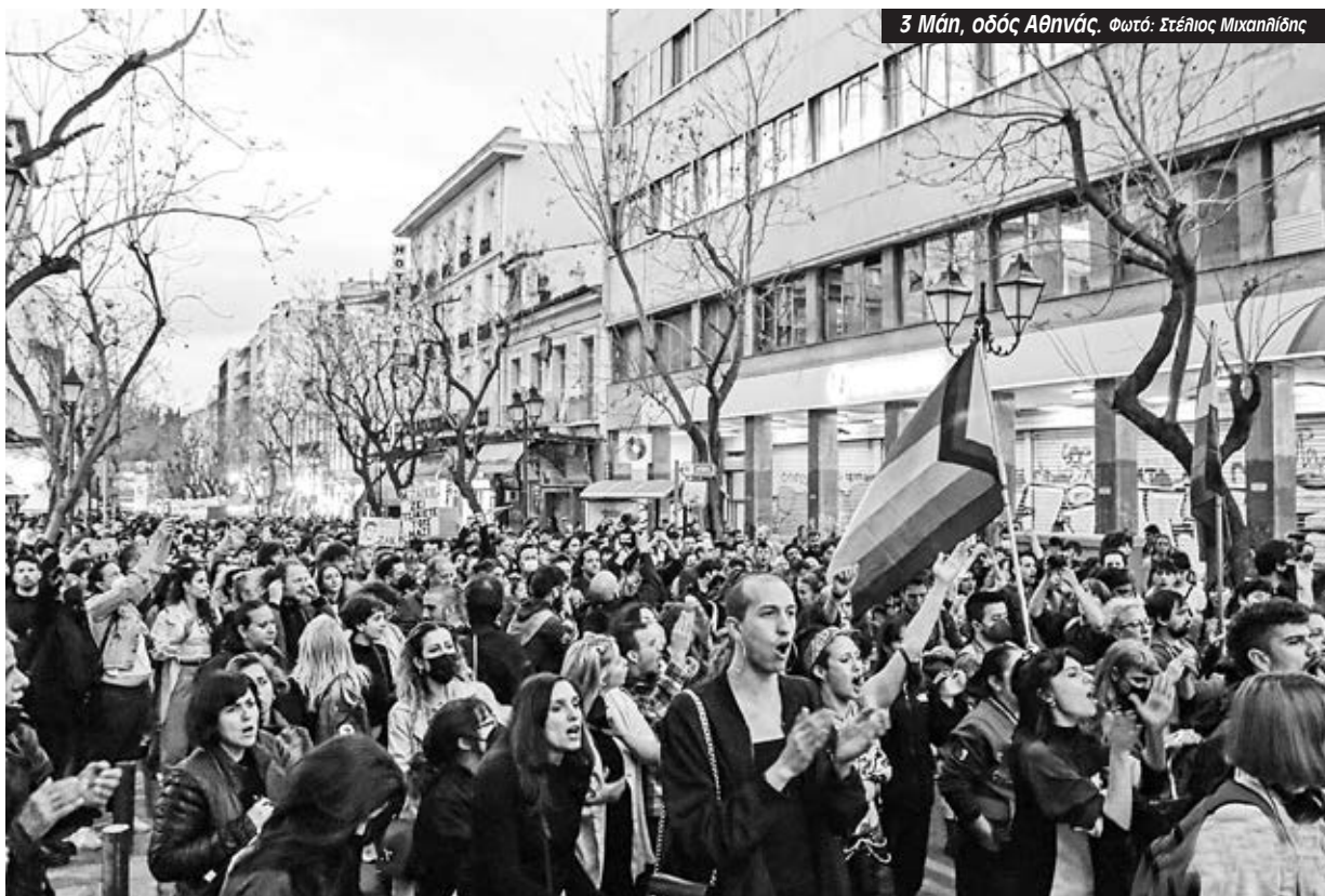
3 Μάη, οδός Αθηνών.

Αλλά και πέρα από την ίδια την απόφαση, η Πρωτοβουλία τονίζει ότι το κίνημα κατάφερε να σταματήσει την προσπάθεια συγκάλυψης, να αναποδογυρίσει το αφήγημα του «επικίνδυνου, ληστή Ζακ», να ανα-