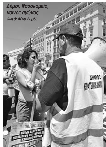
Δήμοι, Νοσοκομεία, κοινός αγώνας.

«Σήμερα η κυβέρνηση της ΝΔ κατεβάζει επείγοντως το νομοσχέδιο που ιδιωτικοποιεί την Υγεία και πρακτικά στερεί την πρόσβαση του κόσμου στα νοσοκομεία. Δεν φτάνει που έδωσαν δισεκατομμύρια μέσα στην πανδημία στους κλινικάρχες, θέλουν αυτό να το συνεχίσουν. Εμείς που δουλεύουμε στα νοσοκομεία ξέρουμε ότι ο κόσμος έχει πληρώσει με την υγεία και τη ζωή του τις περικοπές στο ΕΣΥ. Έχουμε συναδέλφους που είναι σε αναστολή εκτός εργασίας και τους θέλουμε πίσω. Σήμερα είναι μια πρώτη απάντηση, διεκδικούμε από την ΠΟΕΔΗΝ και την ΟΕΝΓΕ άμεση απεργιακή συνέχεια, αύριο, μεθαύριο και όσο χρειαστεί, ώστε αυτό το νομοσχέδιο ούτε να ψηφιστεί ούτε να εφαρμοστεί».