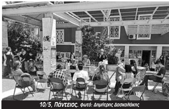
10/5, Πάντειο.

Στο ρόλο της εργατικής τάξης και των σωματείων εστίασε και η Τιάνα θυμίζοντας πως «τα δικαιώματα και οι διεκδικήσεις των γυναικών είναι και πρέπει να είναι υπόθεση ολόκληρης της εργατικής τάξης γιατί και έχει τη δύναμη αλλά έχει και το συμφέρον» να παλεύει για αυτά. Μίλησε για την επίθεση που βλέπουμε σήμερα στις ΗΠΑ ενάντια στο δικαίωμα στην έκτρωση, επίθεση που όπως είπε χαρακτηριστικά «ζηλεύουν ο Μητσοτάκης και η κυβέρνησή του»