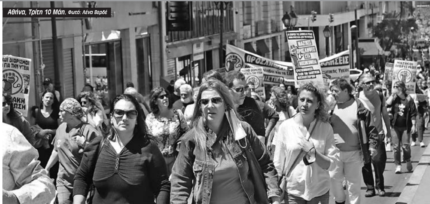
Αθήνα, Τρίτη 10 Μάη.

Καταγγελία για τον αποκλεισμό και στήριξη των γιατρών που θα καταθέσουν ασφαλιστικά μέτρα, αποφάσισε η ΕΙΝΗ.