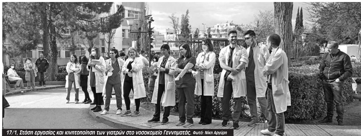
17/1, Στάση εργασίας και κινητοποίηση των γιατρών στο νοσοκομείο Γεννηματάς.

Μ ε μεγάλη επιτυχία ολοκληρώθηκε η στάση εργασίας και η κινητοποίηση των γιατρών του Γεννηματάς με την κάλυψη και συμμετοχή της ΕΙΝΑΠ και της ΟΕΝΓΕ την Τρίτη 17/1. Ήταν το αποκορύφωμα μια σειράς δράσεων που έλαβαν χώρα τις προηγούμενες ημέρες με κέντρο τους παθολόγους ενάντια στην υποστελέχωση.