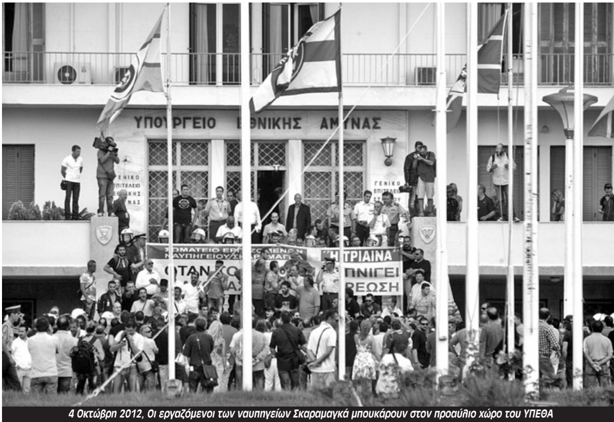
4 Οκτώβρη 2012, Οι εργαζόμενοι των ναυπηγείων Σκαραμαγκά μπουκάρουν στον προαύλιο χώρο του ΥΠΕΘΑ

Όπως δήλωσε ο πρόεδρος των ΗΠΑ στην Ελλάδα Τζόρτζ Τσούνης «Η κυβέρνηση της Κίνας έχει αποκαλέσει το λιμάνι του Πειραιά ως «το κεφάλι του δράκου» στην Ευρώπη γι' αυτό οι Ηνωμένες Πολιτείες επικεντρώνονται έντονα στα ναυπηγεία της Ελευσίνας και του Σκαραμαγκά».