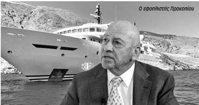
Ο εφοπλιστής Προκοπίου

Ο Προκοπίου βρίσκεται σύμφωνα με την Lloyd's List στη 12η θέση της λίστας με τα πρόσωπα με τη μεγαλύτερη επιρροή στον κόσμο, στη ναυτιλιακή βιομηχανία. Πρόσφατα ναύλωσε στην γερμανική κυβέρνηση δύο «Πλωτές Μονάδες Αποθήκευσης και Επαναεριοποίησης και συνολικά 13 πλοία μεταφοράς LNG χωρητικότητας 200.000 κυβικών μέτρων το καθένα με στόχο να βοηθήσει -με το αζημίωτο πάντα- τη Γερμανία να ανεξαρτητοποιηθεί από τις ρωσικές προμήθειες φυσικού αερίου. Ο νέος «ευεργέτης» των ναυπηγείων έχει στην κατοχή του έναν στόλο από συνολικά 126 πλοία: 69 δεξαμενόπλοια, 40 πλοία μεταφο-