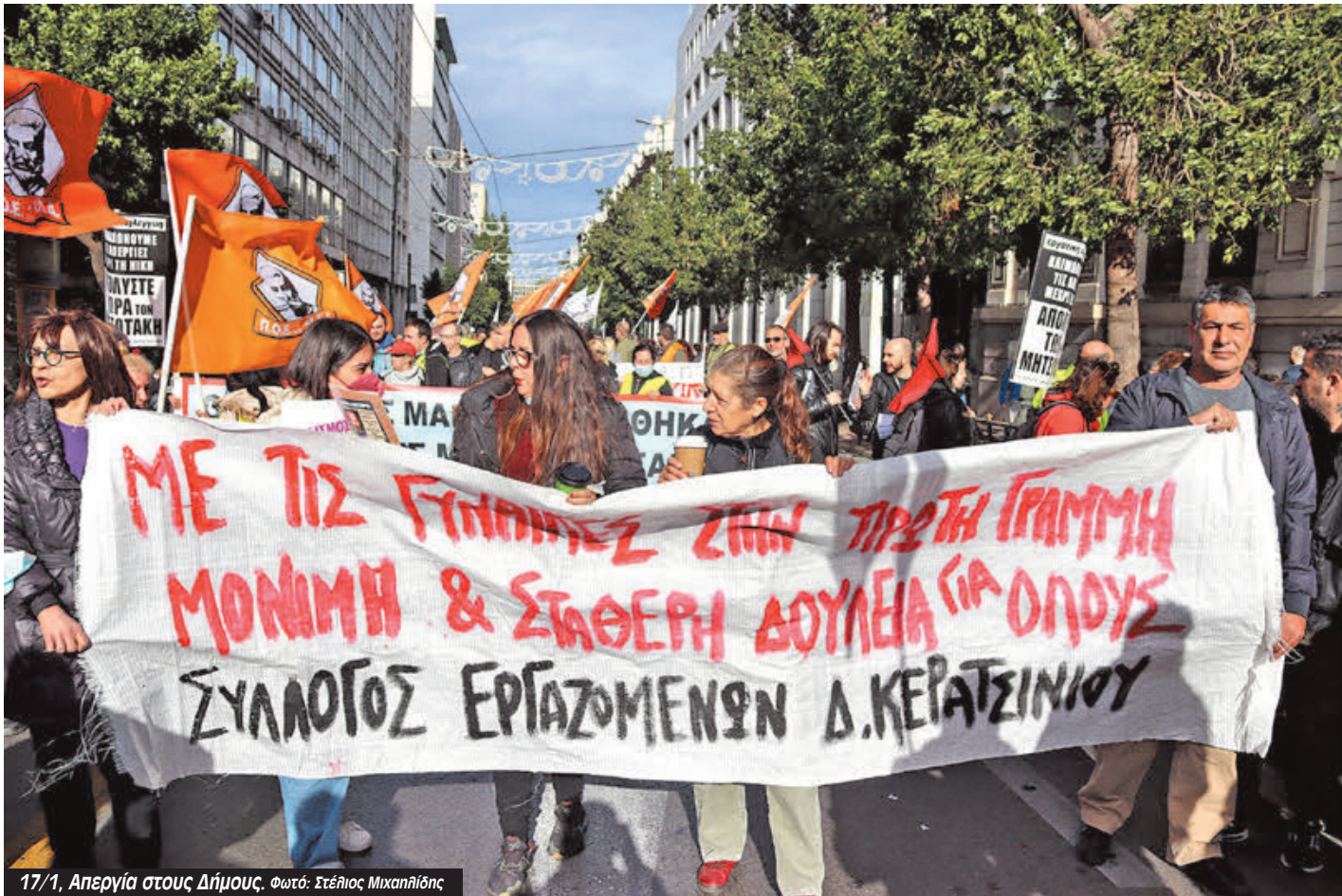
17/1, Απεργία στους Δήμους.

Η δραματική αύξηση των εργατικών «ατυχημάτων» στους ΟΤΑ οφείλεται ξεκάθαρα στην πολιτική που ασκεί αυτή η κυβέρνηση, αλλά και προηγούμενες καθώς και οι φιλικές τους δημοτικές αρχές. Πίσω από τα εργατικά «ατυχήματα» κρύβονται αλληλοσυνδεδεμένες αιτίες: