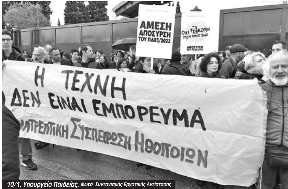
10/1, Υπουργείο Παιδείας.