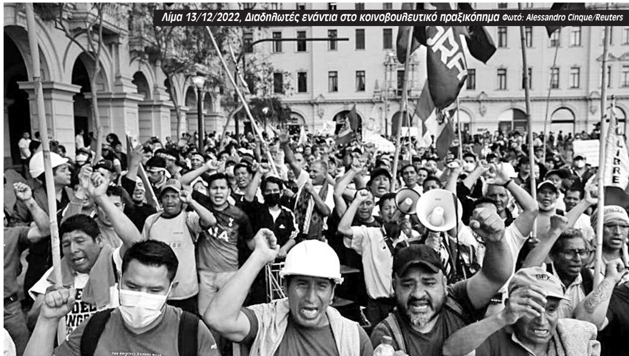
Λίμα 13/12/2022, Διαδηλωτές ενάντια στο κοινοβουλευτικό πραξικόπημα.

«Χιλιάδες διαδηλωτές βγήκαν στους δρόμους του Κούσκο απαι-