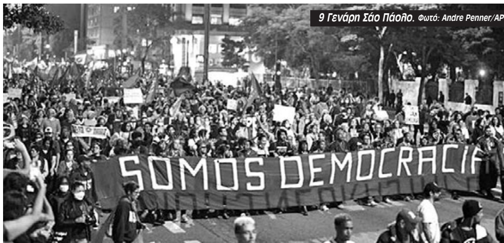
9 Γενάρη Σάο Πάολο.

Την προηγούμενη βδομάδα το αντιφασιστικό κίνημα, η Αριστερά, τα συνδικάτα, οι φοιτητικές οργανώσεις οργάνωσαν μαζικές και οργισμένες διαδηλώσεις σε όλες τις πόλεις της Βραζιλίας. Το αίτημα κοινό: να συλληφθούν όλοι οι επίδοξοι πραξικοπηματίες και να σαπίσουν στη φυλακή. Το σύνθημα «Εμείς είμαστε η δημοκρατία» συμπυκνώνει και την