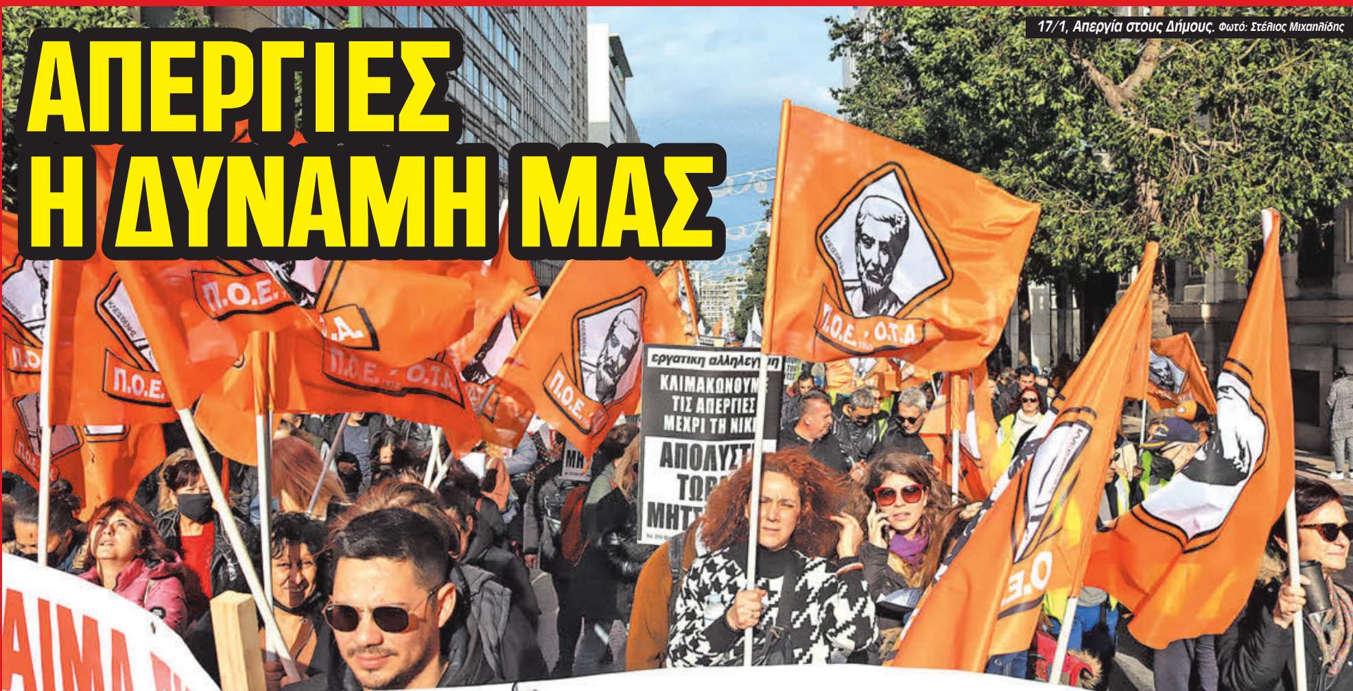
17/1, Απεργία στους Δήμους.