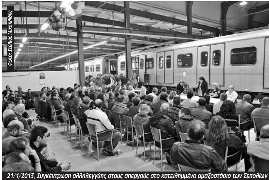
21/1/2013, Συγκέντρωση αλληλεγγύης στους απεργούς στο κατειλημμένο αμαξοστάσιο των Σεπολίων

Οι ακινητοποιημένοι συρμοί παρέλυσαν την Αθήνα για περισσότερο από μια εβδομάδα. Η κυβέρνηση και τα κανάλια από την πρώτη στιγμή άρχισαν να εκτοξεύουν τόνους λάσπης νυχθημερόν για τους απεργούς που ταλαιπωρούν τον κόσμο της Αθήνας. Κι όμως, οι απεργοί δέχονταν καθημερινά την αλληλεγγύη του κόσμου στο αμαξοστάσιο των Σεπολίων που είχαν μετατρέψει σε κέντρο της απεργίας. Συντρόφισσες και σύντροφοι της Εργατικής Αλληλεγγύης, της ΑΝΤΑΡΣΥΑ, εργαζόμενοι που συσπειρώνονται στη Συνάντηση Εργατικής Αντίστασης βρίσκονταν σταθερά στο πλευρό των απεργών. Όταν την 5η μέρα κήρυξαν παράνομη και καταχρηστική την απεργία, εκατοντάδες συνδικαλιστές κι εργαζόμενοι ανταποκρίθηκαν στο κάλε-