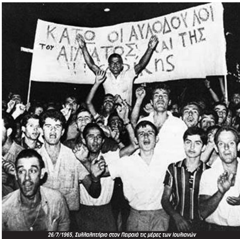
26/7/1965, Συλλαλητήριο στον Πειραιά τις μέρες των Ιουλιανών

Από ιστορική άποψη οι ελπίδες του δεν ήταν καθόλου αβάσιμες. Ο παππούς του, ο Κωνσταντίνος Α', εί-