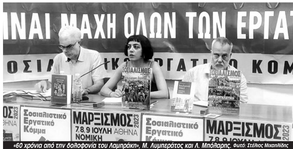
«60 χρόνια από την δολοφονία του Λαμπράκη», Μ. Λυμπεράτος και Λ. Μπόλαρης.