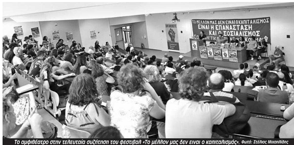
Το αμφιθέατρο στην τελευταία συζήτηση του φεστιβάλ «Το μέλλον μας δεν είναι ο καπιταλισμός». Φωτό: Στέλιος Μικαηλίδης

Τα κείμενα βασίζονται στις ομιλίες των εισηγητών/τριών στην τελική συζήτηση του φεστιβάλ ΜΑΡΞΙΣΜΟΣ 2023