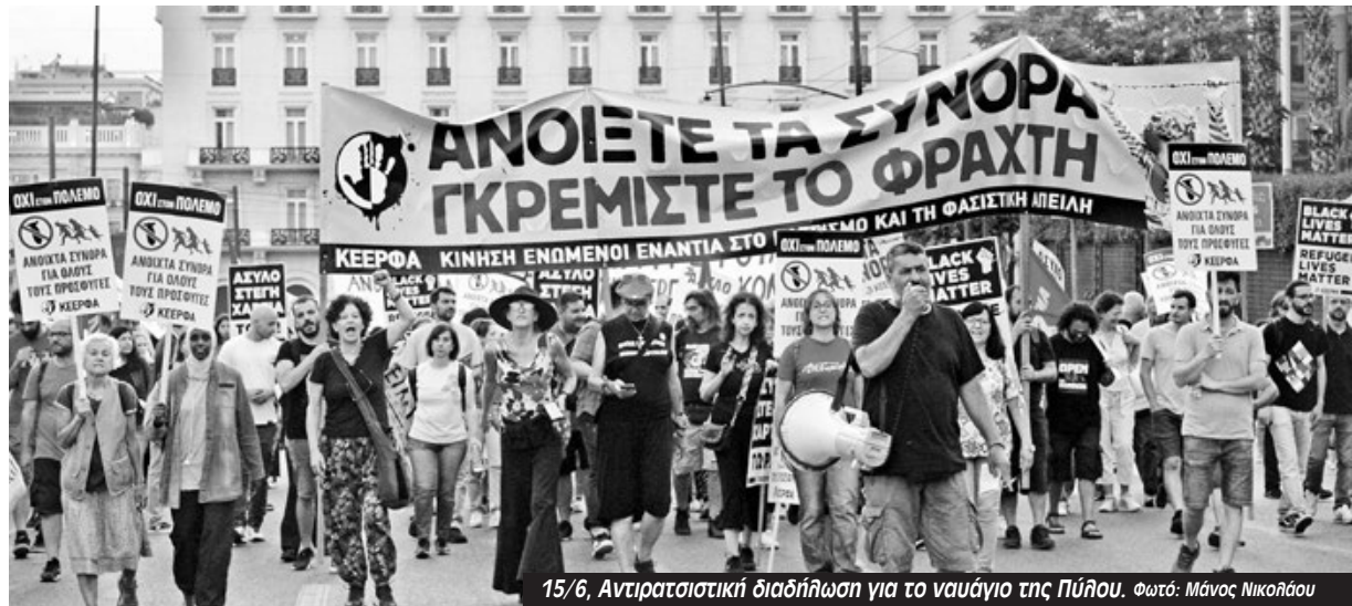
15/6, Αντιρατσιστική διαδήλωση για το ναυάγιο της Πύλου.