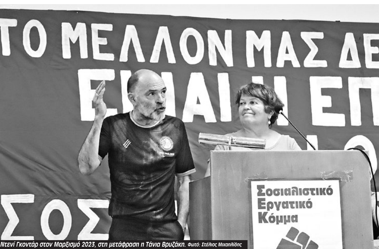
Ο Ντενί Γκοντάρ στον Μαρξισμό 2023, στη μετάφραση η Τάνια Βρυζάκη.

Αυτή η εικόνα επιβεβαιώνει αυτό που λέγαμε εδώ και καιρό. Το κίνημα για το συνταξιοδοτικό δεν ήταν απλά