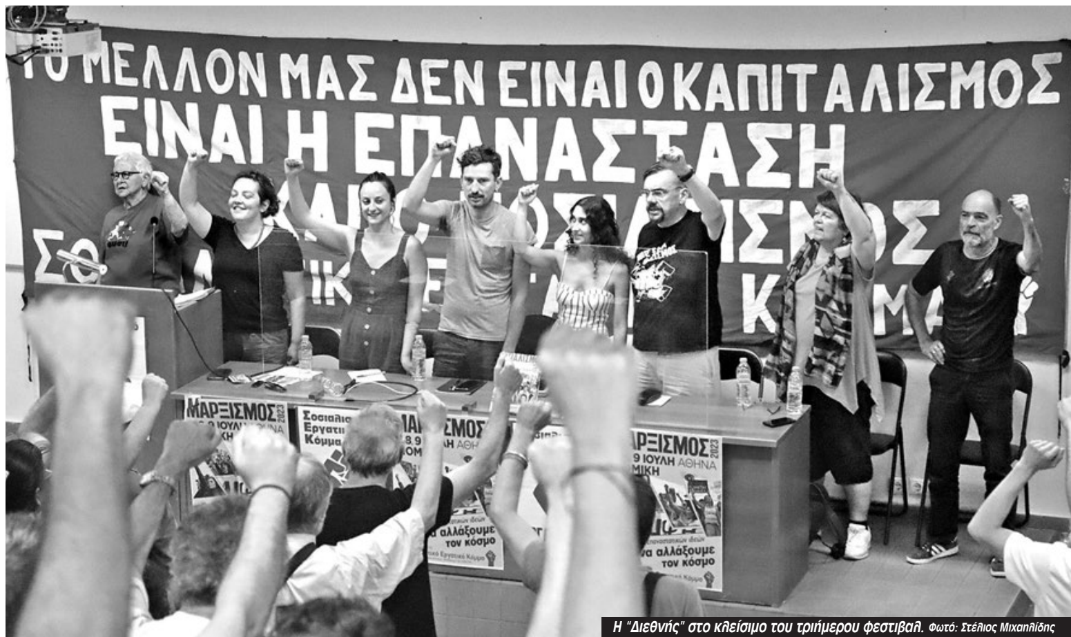
Η "Διεθνής" στο κλείσιμο του τριήμερου φεστιβάλ.

Το πετύχαμε αυτό γιατί σαν ΣΕΚ κάναμε την προσπάθεια όλα τα προηγούμενα χρόνια, που τα πράγματα έμοιαζαν να «κυλάνε αργά», να