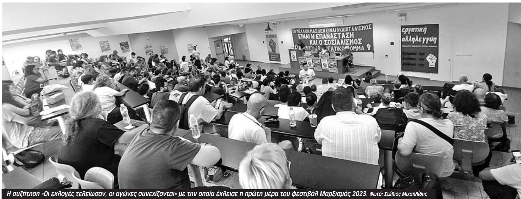
Η συζήτηση «Οι εκλογές τερματίζουν, οι αγώνες συνεχίζονται» με την οποία έκλεισε η πρώτη μέρα του φεστιβάλ Μαρξισμός 2023.

Το φεστιβάλ είναι ένας ωραίος συνδυασμός θεωρητικών και πρακτικών συζητήσεων. Η θεωρητική βάση του πώς μπορείς να φτάσεις στην επανάσταση και η πρακτική μέσω των συνδικάτων, του αγώνα, του δρόμου και μέσα από το κόμμα. Είναι ένα ωραίο πάντρεμα, με τον ρεαλισμό ενός οράματος που έχουμε συνηθίσει να παρουσιάζεται ως μη εφικτό, αλλά όταν παλεύεται συλλογικά και με αλληλεγγύη, λειτουργεί. Η συζήτηση για την Ρώσικη Επανάσταση και τον εργατικό έλεγχο μου έκανε εντύπωση γιατί απαντούσε άμεσα σε ερωτήματα που συζητούσαμε πιο πριν με τους συντρόφους και τις συντρόφισσες. Και επίσης η συζήτηση για τους εργατικούς αγώνες, γιατί πέρα από το θεωρητικό κομμάτι, έθεσε πρακτικά ζητήματα και πώς λύνονται μέσω των εργατικών αγώνων, παρά την κατήφεια που επικρατεί στην κοινωνία μας μετά τις εκλογές και όλους μας έχει επηρεάσει.