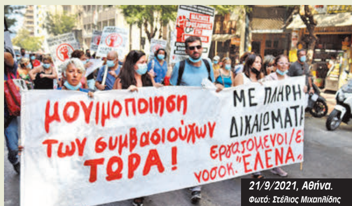
21/9/2021, Αθήνα.

Τριανταφυλλιά, νοσηλεύτρια στο νοσοκομείο Έλενα Βενιζέλου