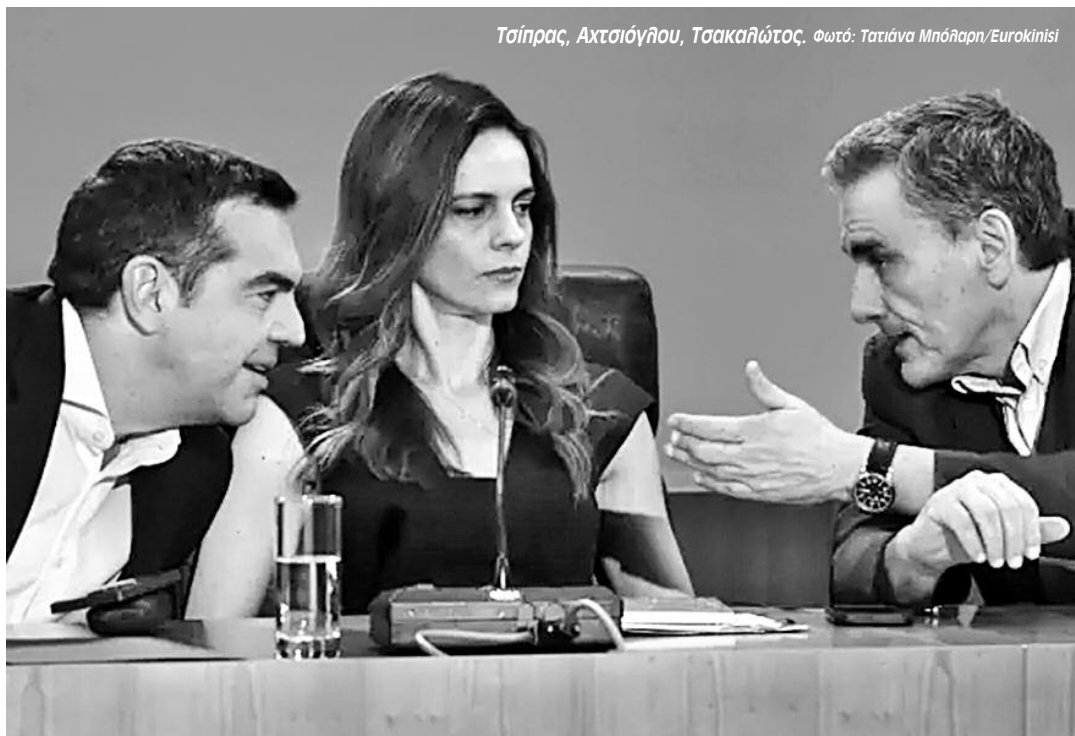
Τσίπρας, Αχτσιόγλου, Τσακαλώτος.