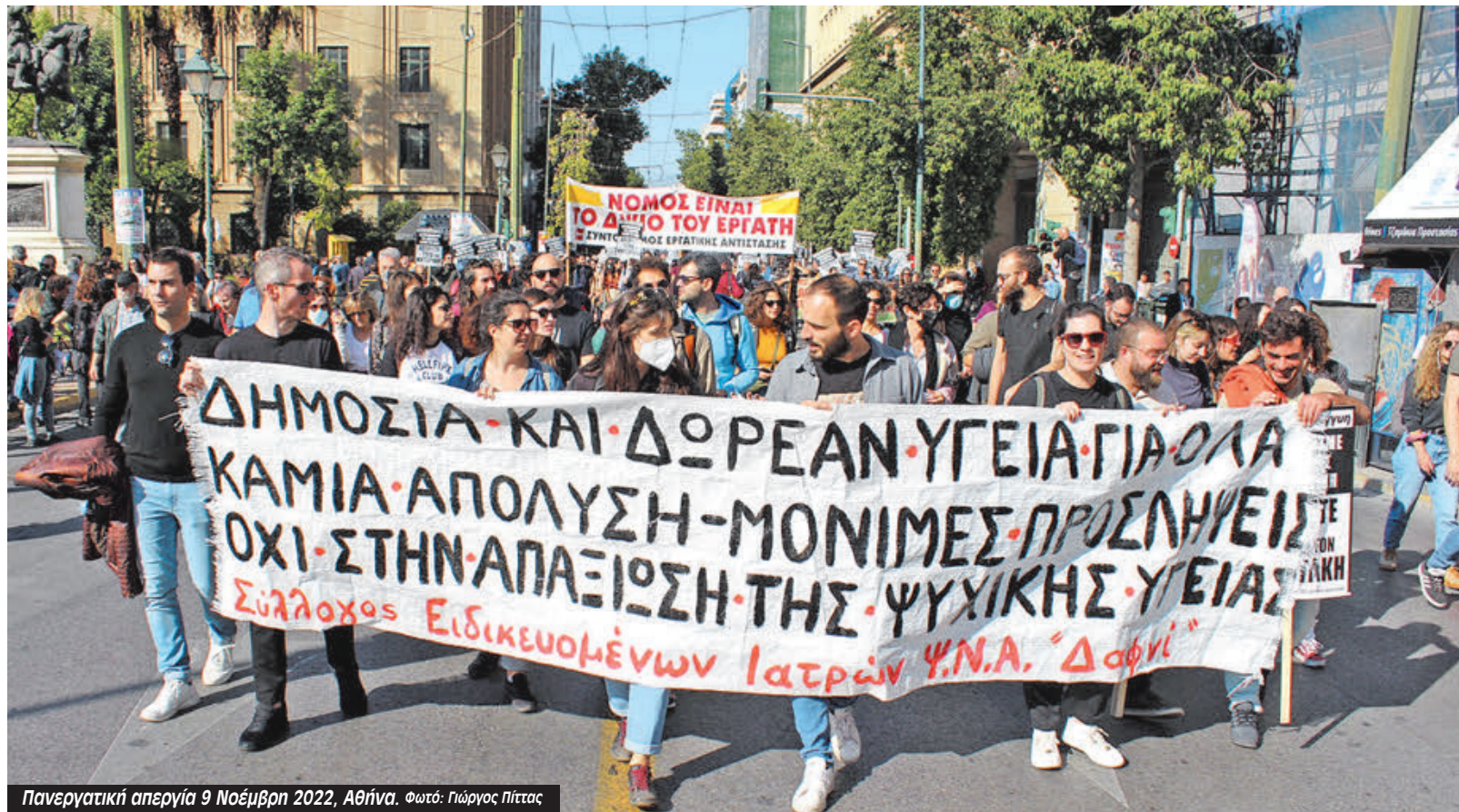
Πανεργατική απεργία 9 Νοέμβρη 2022, Αθήνα.