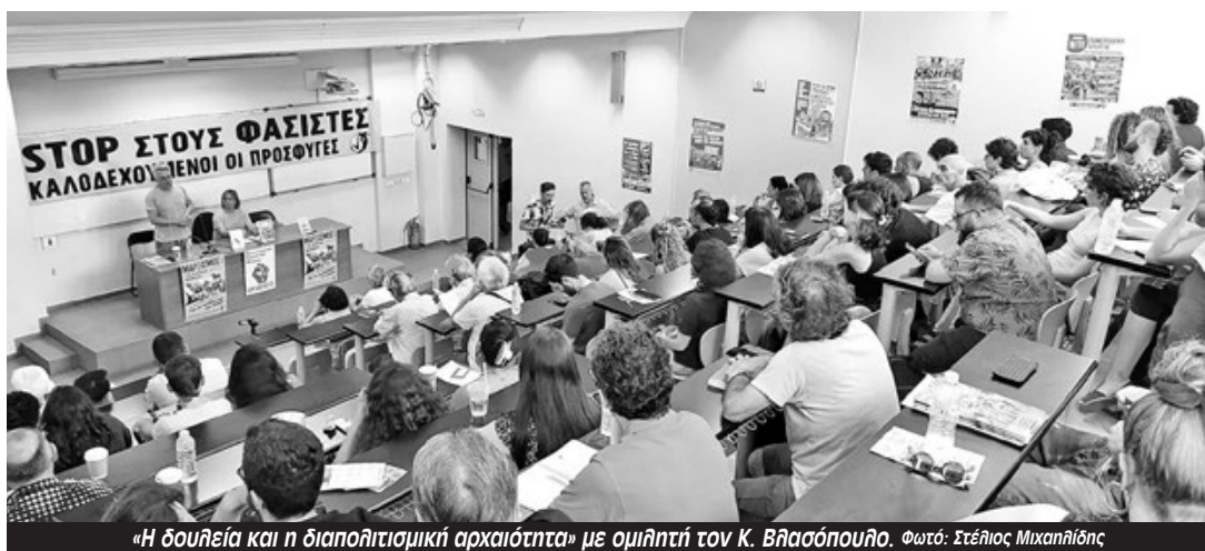
«Η δουλεία και η διαπολιτισμική αρχαιότητα» με ομιλήτη τον Κ. Βλασόπουλο.