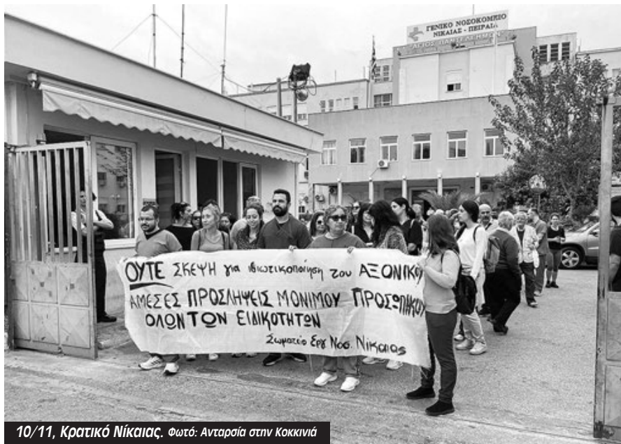
10/11, Κρατικό Νίκαιας.

Τμήματα του νοσοκομείου απειλούνται ακόμη και με κλείσιμο όπως αυτό του