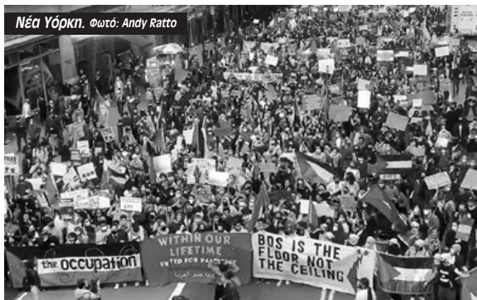
Νέα Υόρκη.

Πολύ μεγάλη ήταν η συγκέντρωση στις Βρυξέλλες στο Βέλγιο . «45.000 διαδηλωτές, ένα