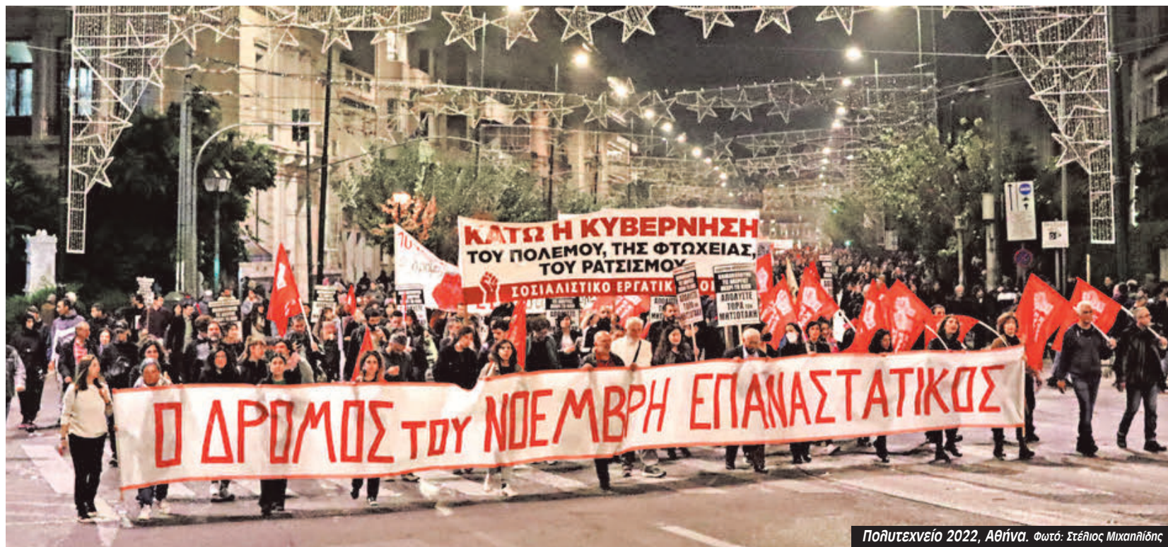
Πολυτεχνείο 2022, Αθήνα.