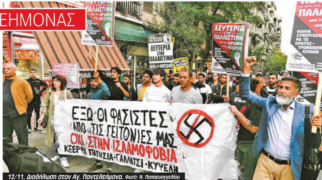
12/11, Διαδήλωση στον Αγ. Παντελεήμονα.

Η αστυνομία γι’ αυτές τις επιθέσεις λέει “δεν ξέρω δεν είδα”, παρότι έχει ακόμα και τις πινακίδες των φασιστοειδών. Δεν στάθηκαν βέβαια το ίδιο αδιάφοροι όταν πήγαν να συλλάβουν τον αγωνιστή που σήκωσε την παλαιστινιακή σημαία στο Σύνταγμα. Ούτε χτες φάνηκαν αδιάφοροι, στη Βοιωτία, που κυνήγησαν και δολοφόνησαν έναν ακόμα Ρομ, όπως έκαναν με τον Φραγκούλη και τον Σαμπάνη.