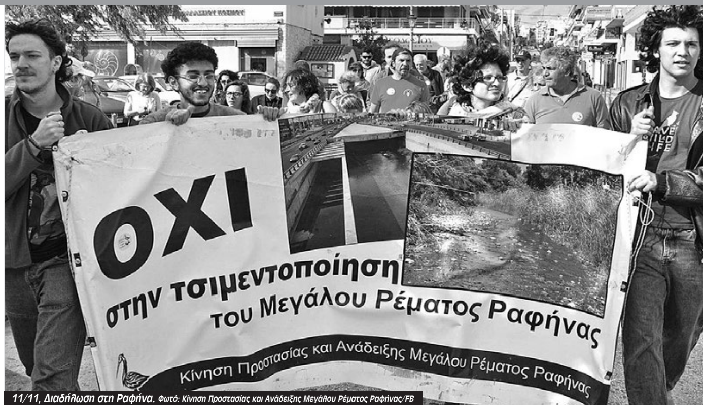
11/11, Διαδήλωση στη Ραφήνα.

Συγκέντρωση-πορεία για τη διάσωση του Μεγάλου Ρέματος Ραφήνας πραγματοποιήθηκε στην Ραφήνα το περασμένο Σάββατο με τη συμμετοχή κατοίκων, εκπροσώπων δημοτικών κινήσεων, συλλογικοτήτων και περιβαλλοντικών οργανώσεων ενάντια στην επανεκκίνηση από τις 25/10 των εργασιών διευθέτησης/οριοθέτησης του Μεγάλου Ρέματος Ραφήνας, που εκτελεί η ανάδοχος εταιρεία INTRAKAT με φορέα το υπουργείο Υποδομών και Μεταφορών.