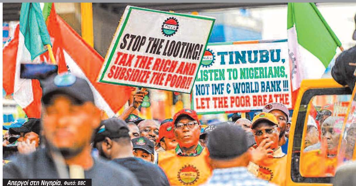
Απεργία στη Νιγηρία. Φωτό: BBC