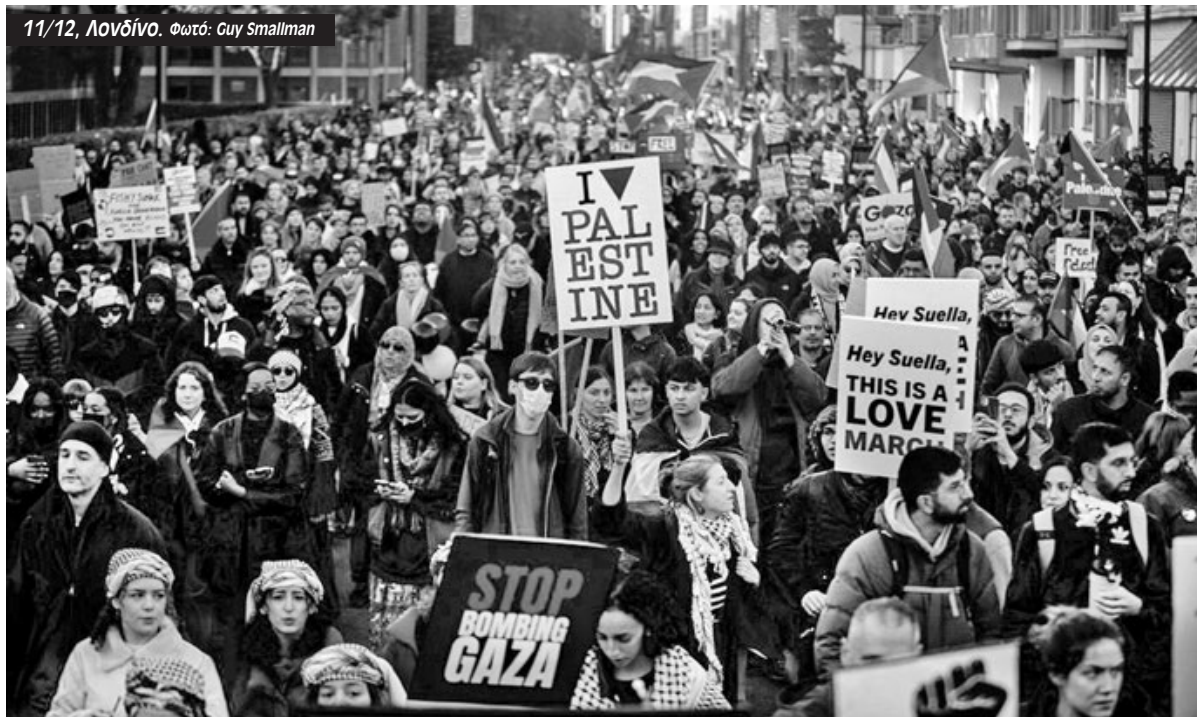
11/12, Λονδίνο.

Στις ΗΠΑ στη Νέα Υόρκη μια μαζική συγκέντρωση μπλόκαρε την κυκλοφορία στο Μανχάταν περιορίζοντας την πρόσβαση στον τερματικό σταθμό Grand Central Terminal την Παρασκευή 10/11 απαιτώντας την κατάπαυση του πυρός στην Γάζα. Την Πέμπτη μια ομάδα διαδηλωτών με επικεφαλής εργαζόμενους στα