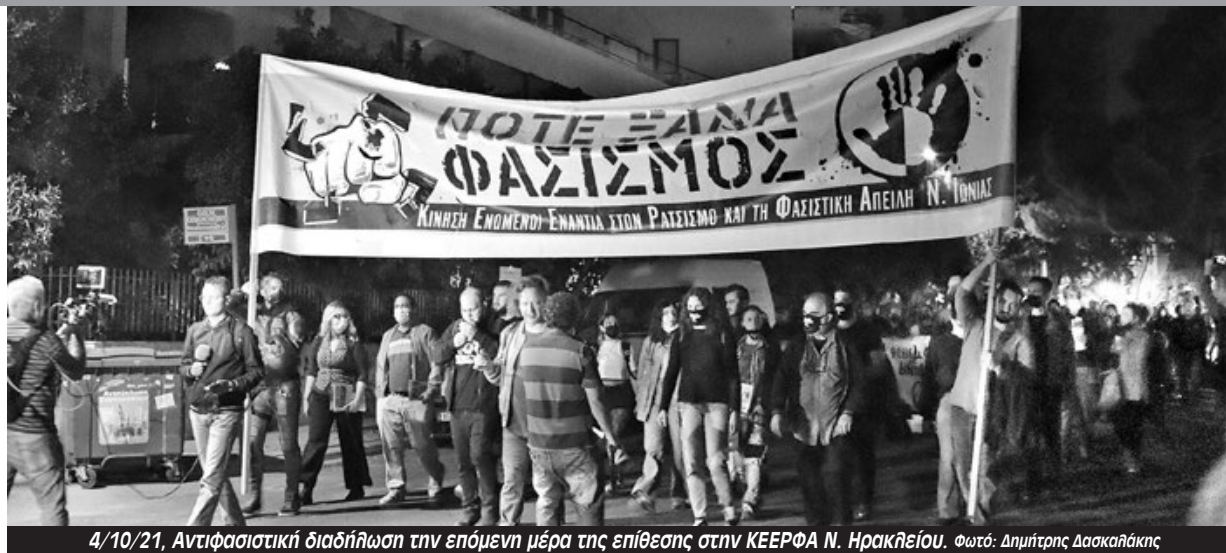
4/10/21, Αντιφασιστική διαδήλωση την επόμενη μέρα της επίθεσης στην ΚΕΕΡΦΑ Ν. Ηρακλείου.

«Στη δίκη αναδείχθηκε ο χρυσαυγίτικος τρόπος δράσης, όπως είναι γνωστός από τη δίκη της ΧΑ: οργανωμένη επίθεση πολλών ατόμων, με σχέδιο και ρόλους, με σκοπό να προκαλέσουν ζημιά στα θύματα, χτυπώντας στο κεφάλι. Αναδείχθηκε από τις καταθέσεις ότι ο πρώην χρυσαυγίτης Παπαδιονυσίου ήταν επικεφαλής του τάγματος που έστειλε 4 άτομα στο νοσοκομείο, καθώς πρωταγωνίστησε στον ξυλοδαρμό και τις καταστροφές, ενώ ήταν αυ-