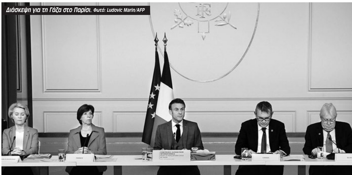
Διάσκεψη για τη Γάζα στο Παρίσι.

εδρος των ΗΠΑ Μπάιντεν που την περασμένη εβδομάδα ζήτησε να υπάρξουν μικρές «παύσεις» για απελευθέρωση ομήρων αλλά όχι κατάπαυση του πυρός ή εκκενοποίηση. «Παραδέχομαι πως δεν πιστεύω ότι οι εκκλήσεις να κηρυχθεί άμεση κατάπαυση του πυρός είναι σωστές, διότι αυτό θα σήμαινε πως το Ισραήλ θα προσέφερε στη Χαμάς τη δυνατότητα ν' ανασυνταχθεί και να προμηθευτεί νέους πυραύλους», είπε ο «σοσιαλιστής» καγκελάριος της Γερμανίας Σολτς . Ο πρόεδρος της Γαλλίας Μακρόν παρότρυνε «το Ισραήλ να σταματήσει τους βομβαρδισμούς που σκοτώνουν αμάχους» σπεύδοντας να προσθέσει όμως την επόμενη μέρα ότι «υποστηρίζει χωρίς περιστροφές το δικαίωμα και το