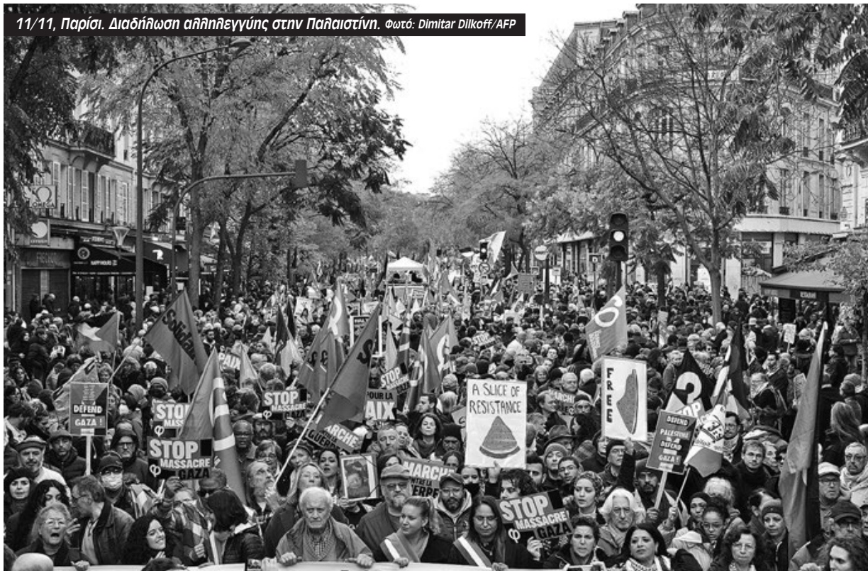
11/11, Παρίσι. Διαδήλωση αλληλεγγύης στην Παλαιστίνη.

«Η ελπίδα και η προσδοκία μου είναι ότι θα υπάρξει λιγότερο παρεμβατική δράση σε σχέση με τα νοσοκομεία», δήλωσε προκλητικά ο πρό-