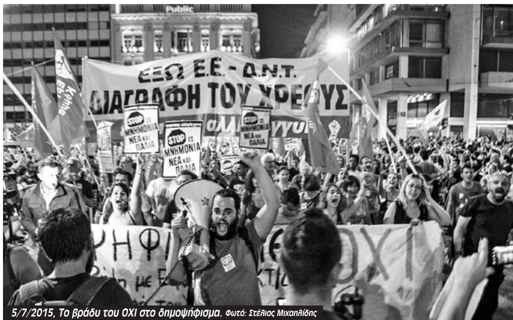
5/7/2015, Το βράδυ του ΟΧΙ στο δημοψήφισμα.