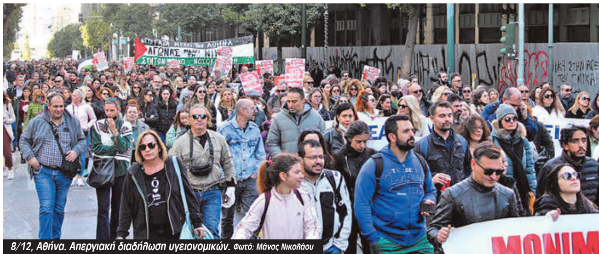
8/12, Αθήνα. Απεργιακή διαδήλωση υγειονομικών.

Από τη μικροφωνική στη συγκέντρωση στο Υπουργείο ανακοινώνονταν οι σύλλογοι εργαζομένων των νοσοκομείων και των Κέντρων Υγείας που συμμετείχαν στην κινητοποίηση και η λίστα ήταν πρωτοφανής σε αριθμό. Πιο διάχυτη από ποτέ ήταν και η διάθεση για κλιμάκωση με απεργία διαρκείας. Αυτό εκφράστηκε με τον ενθουσιασμό και το πιο δυνατό χειροκρότημα στην πρόταση