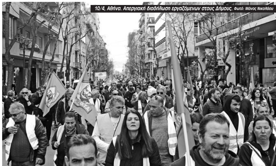
10/4, Αθήνα. Απεργιακή διαδήλωση εργαζομένων στους Δήμους.