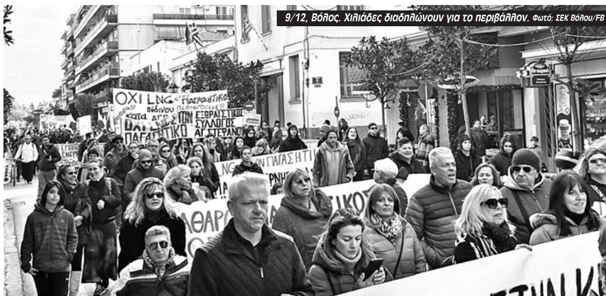
9/12, Βόλος. Χιλιάδες διαδηλώνουν για το περιβάλλον.

Μ ε μεγάλη επιτυχία ξεκίνησε η μάχη κατά της τερματικής μονάδας LNG στον Παγασητικό. Η Mediterranean Gas, ένα αρπακτικό της ενέργειας, επιθυμεί να κατασκευάσει ένα τερματικό σταθμό αποθήκευσης και μεταφοράς Υδροποιημένου Φυσικού Αερίου, καταστρέφοντας το οικοσύστημα όλης της περιοχής. Η αίτηση που έχει κάνει η εταιρεία έχει πάρει το πράσινο φως από την ΠΑΕ και έχει την στήριξη της κυβέρνησης της ΝΔ. Που αφενός δεν έχει βγάλει κιχ για το έργο, αφετέρου ξέρουμε τις βλέψεις της για την μετατροπή της Ελλάδας σε κόμβο μεταφοράς αερίου, στα Βαλκάνια και την Ευρώπη.