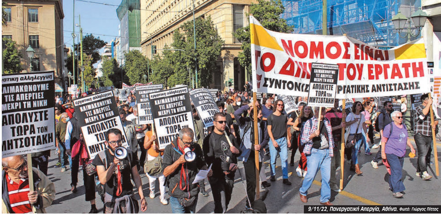
9/11/22, Πανεργατική Απεργία, Αθήνα.