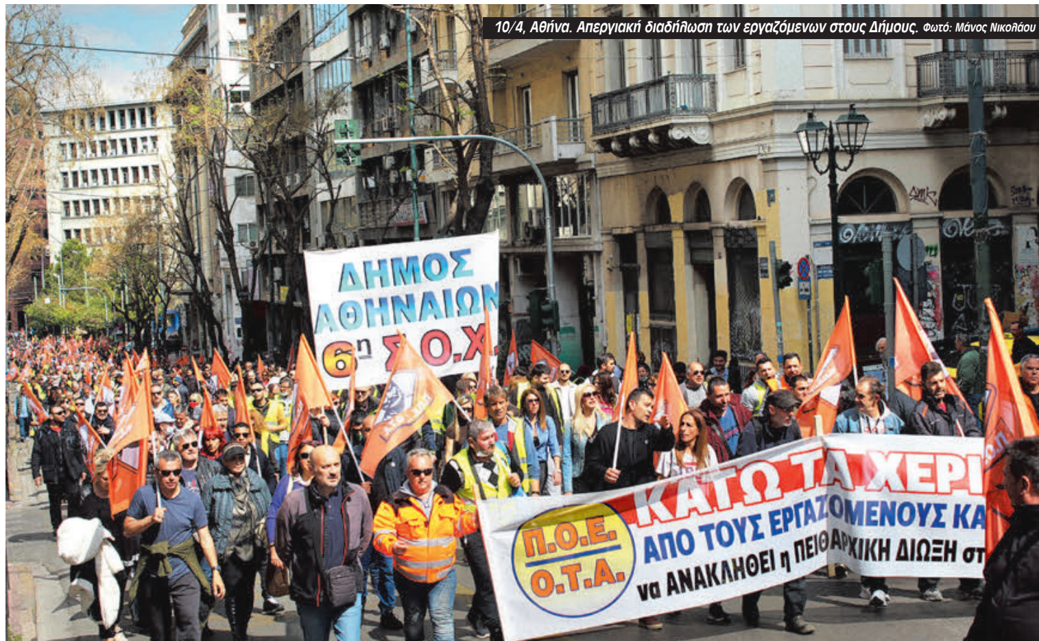
10/4, Αθήνα. Απεργιακή διαδήλωση των εργαζόμενων στους Δήμους.