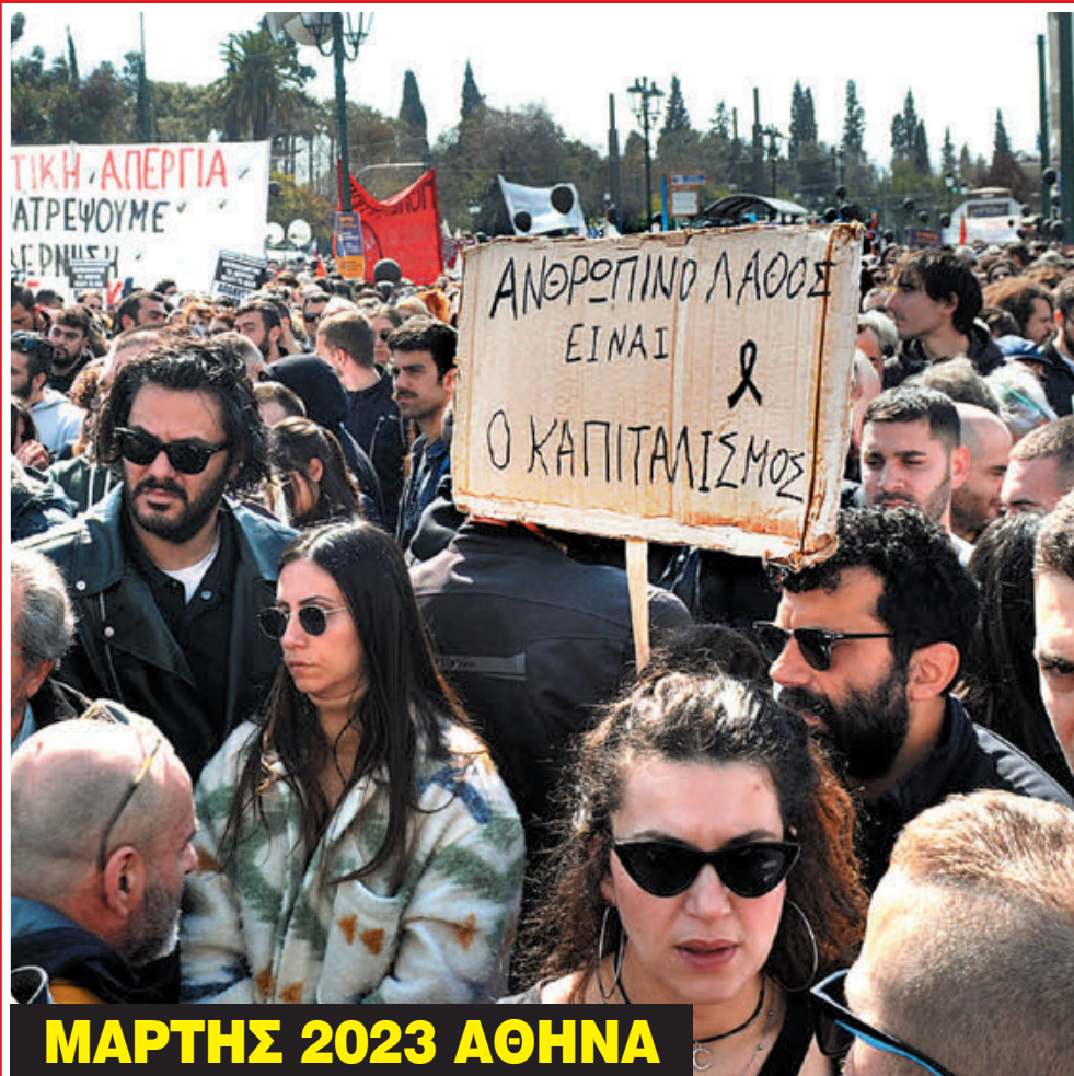
ΜΑΡΤΗΣ 2023 ΑΘΗΝΑ

Γιατί, το μέλλον μας ΔΕΝ είναι ο καπιταλισμός