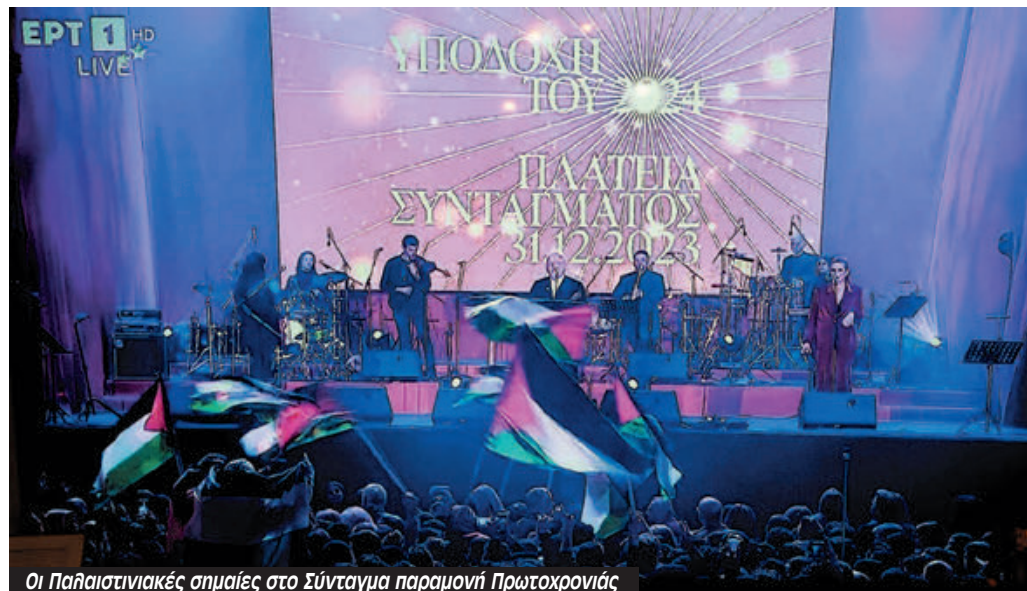
Οι Παλαιστινιακές σημαίες στο Σύνταγμα παραμονή Πρωτοχρονιάς