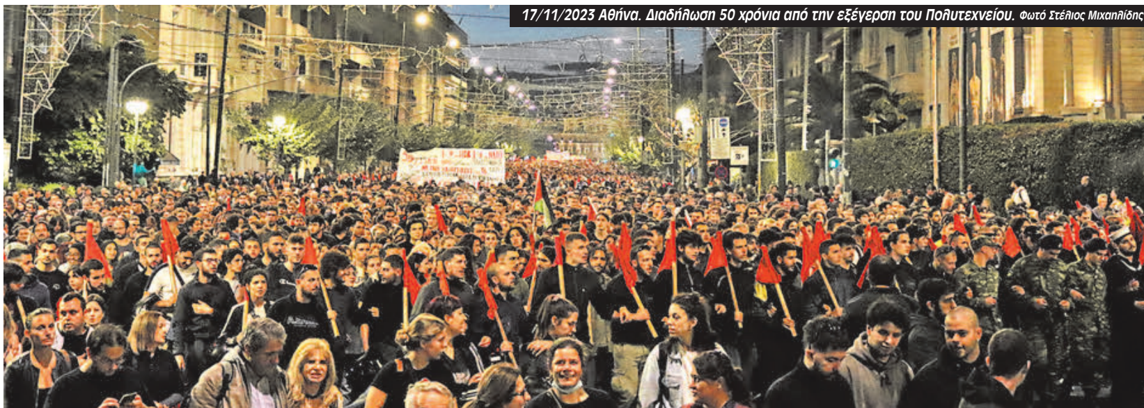
17/11/2023 Αθήνα. Διαδήλωση 50 χρόνια από την εξέγερση του Πολυτεχνείου.

Δεν ισχύει τίποτα από όλα αυτά. Όπως αναφέρει ο Σύλλογος Διδασκόντων Θετικών Επιστημών του ΕΚΠΑ: “Ο ισχυρισμός ότι τα δημόσια πανεπιστήμια θα βελτιωθούν μέσω του «ανταγωνισμού» με τα ιδιωτικά, έχει τόσο σχέση με την πραγματικότητα όσο και η «βελτίωση» του δημόσιου συστήματος υγείας