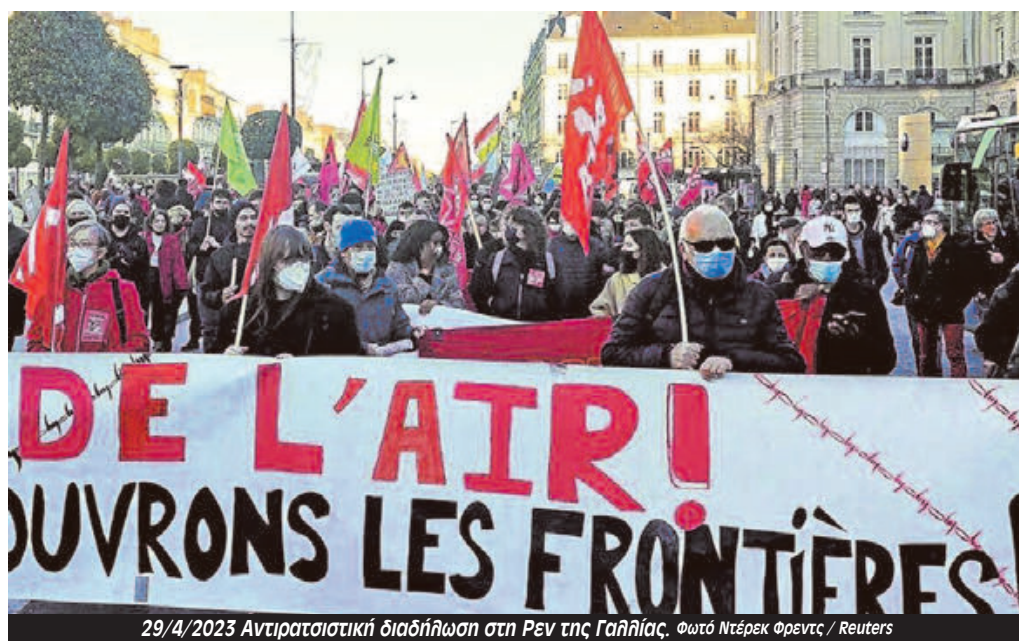
29/4/2023 Αντιρατσιστική διαδήλωση στη Ρεν της Γαλλίας.

το 1960 οι σεναριογράφοι και οι ηθοποιοί στις ΗΠΑ απέργησαν ταυτόχρονα. Στις αρχές Σεπτεμβρίου, οι Financial Times δημοσίευσαν μελέτη του Milken Institute, η οποία εκτιμούσε το κόστος της διπλής κινητοποίησης σε 5 δισεκατομμύρια δολάρια για την οικονομία της Καλιφόρνιας. Η απεργία τερματίζεται, χάρη σε μια νέα τριετή συλλογική σύμβαση για τους ηθο-