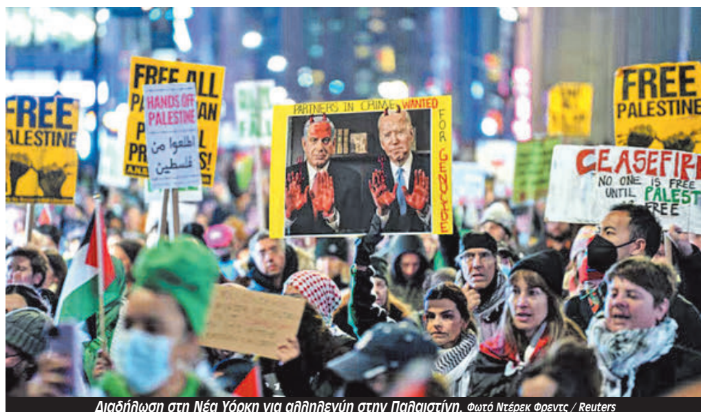
Διαδήλωση στη Νέα Υόρκη για αλληλεγγύη στην Παλαιστίνη.