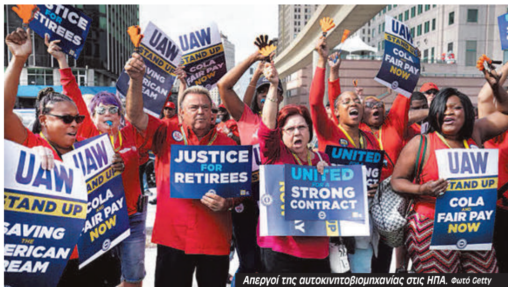
Απεργοί της αυτοκινητοβιομηχανίας στις ΗΠΑ.