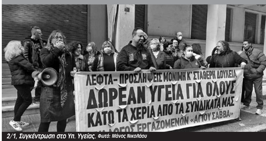
2/1, Συγκέντρωση στο Υπ. Υγείας.