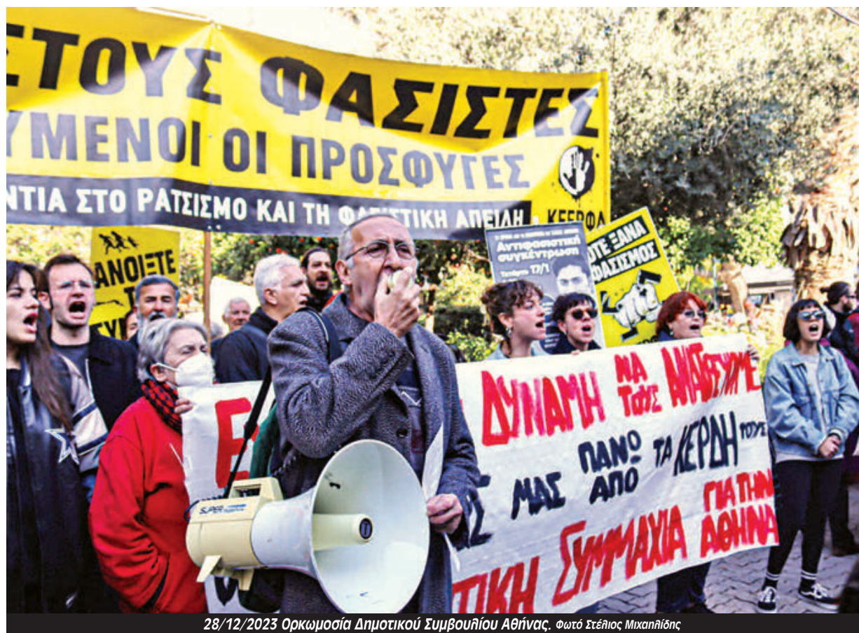
28/12/2023 Ορκωμοσία Δημοτικού Συμβουλίου Αθήνας.