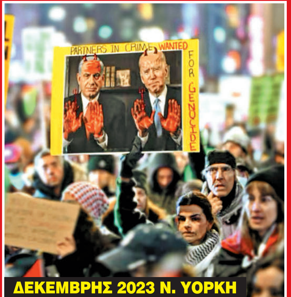
ΔΕΚΕΜΒΡΗΣ 2023 Ν. ΥΟΡΚΗ