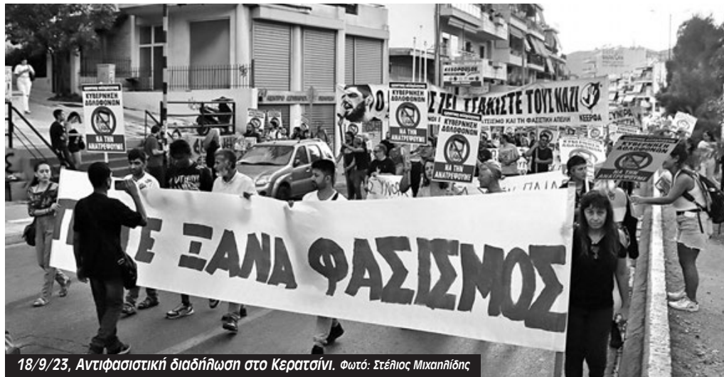
18/9/23, Αντιφασιστική διαδήλωση στο Κερατσίνι.

Μέχρι τότε τους έβλεπε σαν «μπουλούκι», αλλά όταν τους αρνήθηκαν τους κοινούς ελέγχους και το τάγμα προχώρησε μόνο του και μπήκε στη Λαϊκή ήταν, όπως είπε, «πιο συνταγμένοι». Παρότι δεν είδε την ίδια την επίθεση, είδε τα αποτελέσματά της -τους αναποδογυρισμένους πάγκους και τα πεσμένα πράγματα των μικροπωλητών, των «έγχρωμων», «αυ-