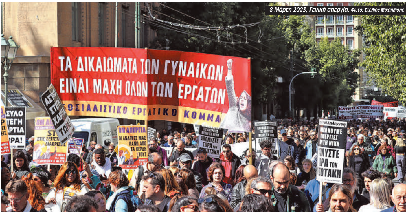
8 Μάρτη 2023, Γενική απεργία.