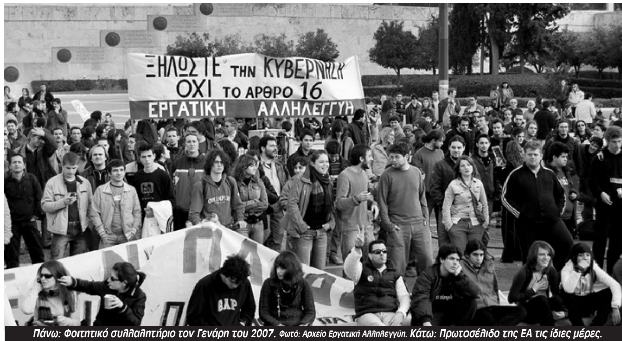
Πάνω: Φοιτητικό συλλαλητήριο τον Γενάρη του 2007. Κάτω: Πρωτοσέλιδο της ΕΑ τις ίδιες μέρες.

Ταυτόχρονα ερχόταν η έμπνευση από την εξέγερση των φοιτητών της