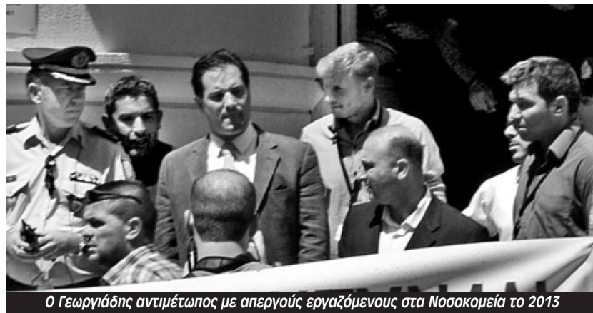
Ο Γεωργιάδης αντιμέτωπος με απεργούς εργαζόμενους στα Νοσοκομεία το 2013

Αυτή η εσκεμμένη ασυδοσία φάνηκε ανάγλυφα τον Αύγουστο όταν οι