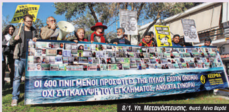
8/1, Υπ. Μετανάστευσης.

μας αύριο και όχι όπως μας είχαν ειδοποιήσει πιο πριν! Ο πανικός τους δεν κρύβεται, ούτε τα εγκλήματα της ρατσιστικής τους πολιτικής που κόστισαν ανθρώπινες ζωές στην Πύλο και τη Δαδιά».