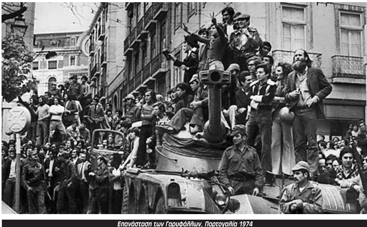
Επανάσταση των Γαρυφάλλων, Πορτογαλία 1974