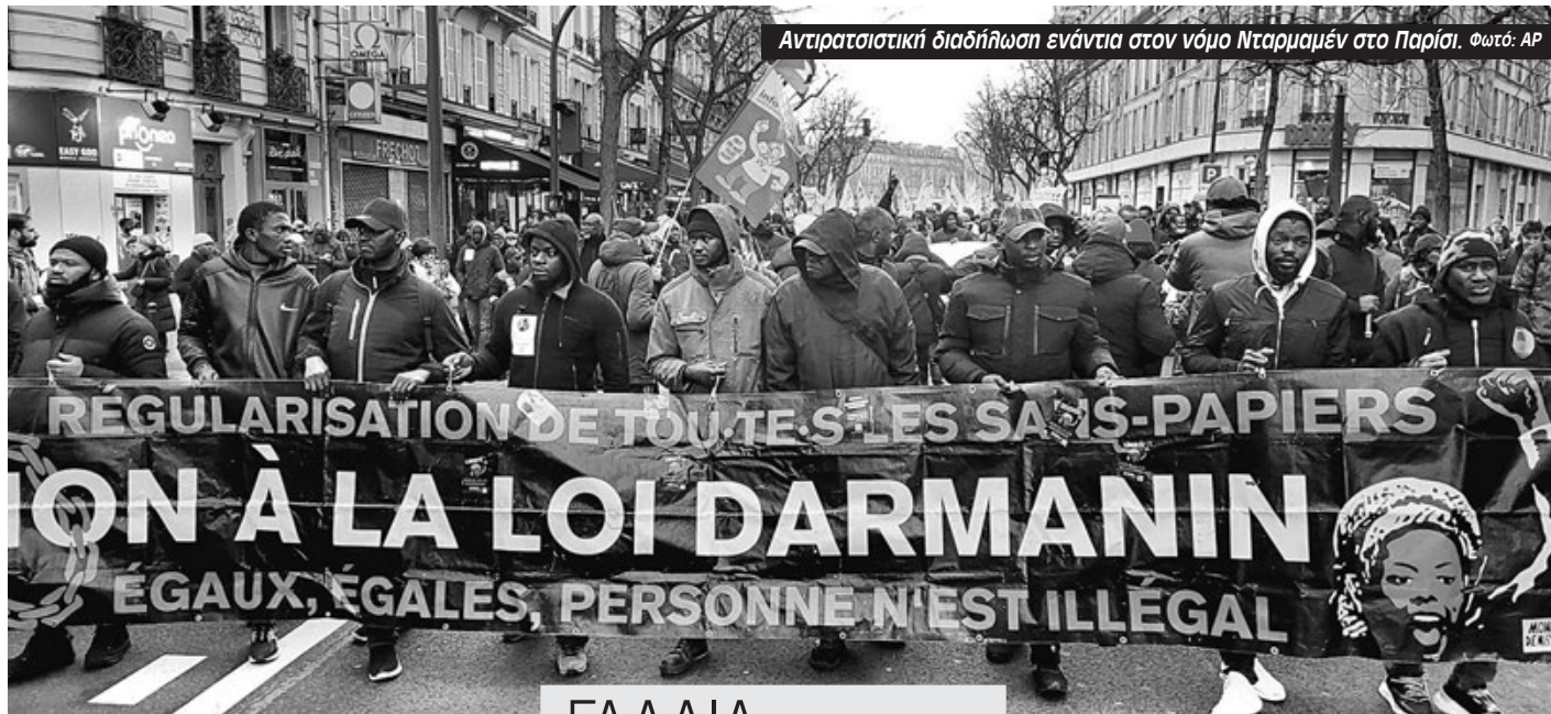
Αντιρατσιστική διαδήλωση ενάντια στον νόμο Νταρμανέν στο Παρίσι.