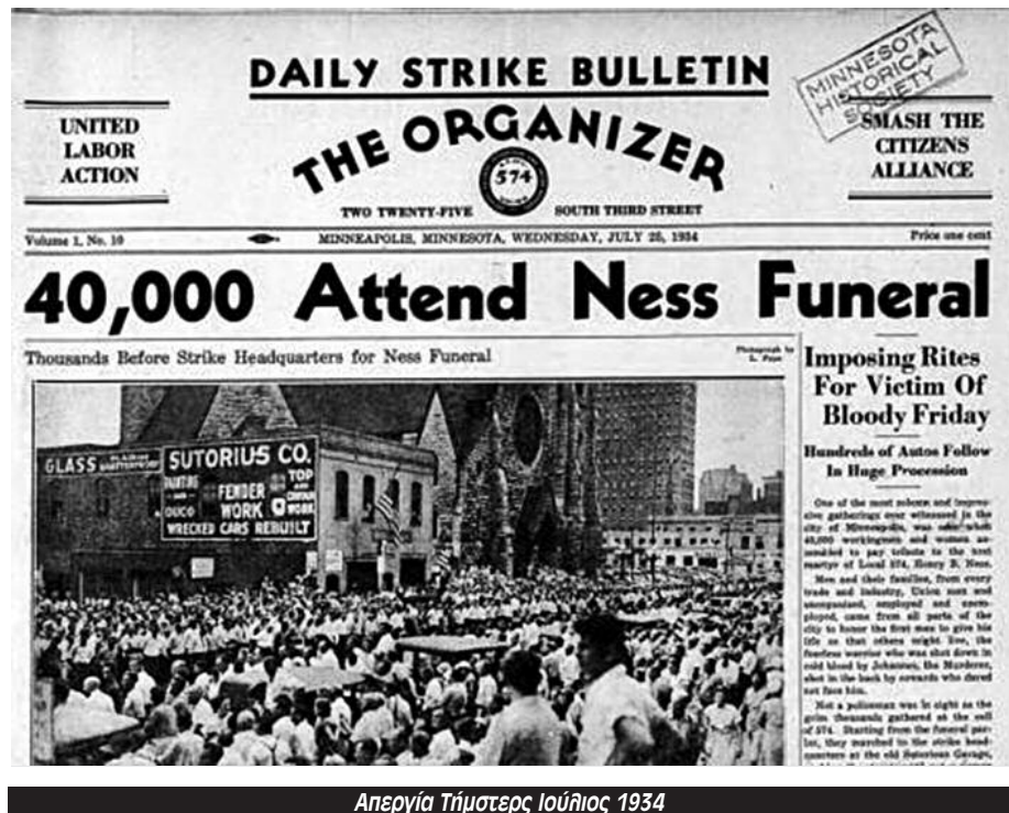
Απεργία τήμησες Ιουλίου 1934

Τον Φλεβάρη του 1924 ο μαρξιστής φιλόσοφος Γ. Λούκατις έγραφε σε ένα βιβλίο με τίτλο « Η Σκέψη του Λένιν »: «Η επικαιρότητα της επανάστασης: αυτή είναι η θεμελιώδης σκέψη του Λένιν, καθώς και το καθοριστικό σημείο που τον συνδέει με τον Μαρξ». Σήμερα, που ζούμε την πολυκρίση του καπιταλισμού, μπορούμε να χτίσουμε την Αριστερά της επανάστασης.