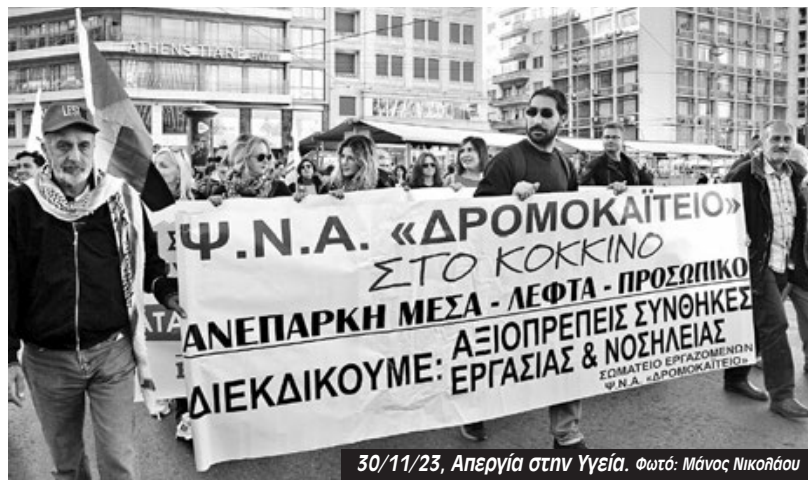
30/11/23, Απεργία στην Υγεία.

νων και Πρωτοχρονιάς και θα κατέβαινε για ψήφιση αρχές Γενάρη. Δεν έγινε ακόμη, αλλά ο Βαρτζόγλου, υφυπουργός Υγείας -και Επιστημονικός Υπεύθυνος ιδιωτικής Ψυχιατρικής Κλινικής(!)- βαυκαλιζεται ότι θα το φέρει πολύ άμεσα.