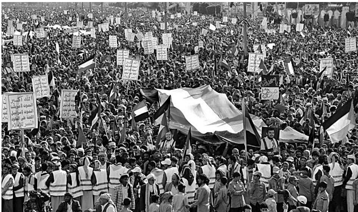
Διαδήλωση αλληλεγγύης στην Παλαιστίνη την Παρασκευή 5 Γενάρη στη Σαναά, πρωτεύουσα της Υεμένης.

Τα διεθνή ΜΜΕ παρουσιάζουν τους αντάρτες “Χούθι” (όπως τους