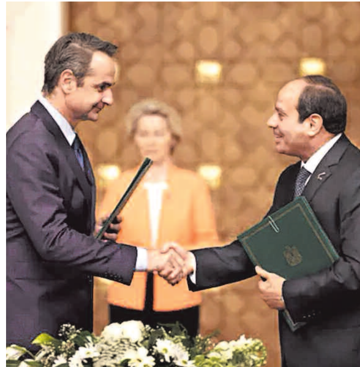
Μητσοτάκης, Σίσι και στο βάθος Φον ντερ Λάιεν.

Τα δίνει με κλειστά μάτια σε έναν απόλυτα διεφθαρμένο, προκειμένου να κρατήσει τον απελπισμένο κόσμο που μπαίνει στα καράβια του θανάτου προς την Ευρώπη. Το 2011 ο λαός επαναστάτησε και ανέτρεψε τον δικτάτορα Μουμπάρακ. Το 2012 για πρώτη φορά στην ιστορία της η Αίγυπτος εξέλεξε πρόεδρο με ελεύθερες εκλογές. Μέσα σε αυτούς τους δώδεκα μήνες διακυβέρνησης, οι απόδημοι Αιγύπτιοι έσπευδαν να επιστρέψουν και να προσφέρουν στην αναγέννηση της χώρας αντιστρέφοντας τις μεταναστευτικές ροές. Δυστυχώς αυτή η εξέλιξη δεν άρεσε στις ΗΠΑ και την ΕΕ κι έτσι ανέτρεψαν το δημοκρατικό καθεστώς γιατί ακριβώς προτιμά να συναλλάσσεται με δικτάτορες. Έτσι η Αίγυπτος είναι γη παραγωγής αλλά και δια-