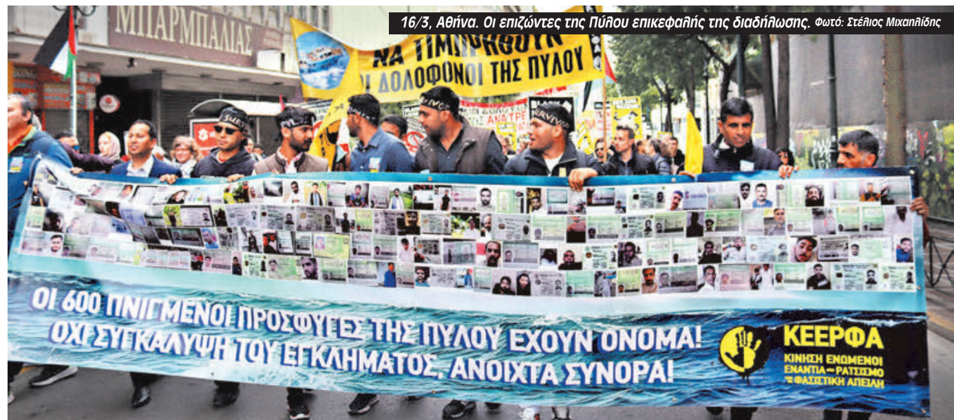
16/3, Αθήνα. Οι επιζώντες της Πύλου επικεφαλής της διαδήλωσης.

Δ υναμικό, με παλμό και οργή για το έγκλημα του ναυαγίου της Πύλου, ήταν το συλλαλητήριο της 16 Μάρτη κατά του ρατσισμού και του φασισμού. Ξεκίνησε με συγκέντρωση στην Ομόνοια και ακολούθησε πορεία στη Βουλή έχοντας στη πρώτη γραμμή τους επιζώντες του ναυαγίου της Πύλου.