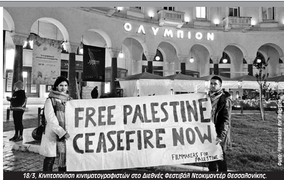
18/3, Κινητοποίηση κινηματογραφιστών στο Διεθνές Φεστιβάλ Ντοκιμαντέρ Θεσσαλονίκης.