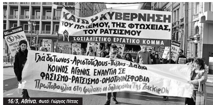
16/3, Αθήνα.

νήθηκε στις 21/9/18 λίγα μέτρα από εδώ, σε κοινή θέα, μέρα μεσημέρι, από μπάτσους και «νοικοκυραίους μαγαζάτορες ευυπόληπτους πολίτες». Από εκείνη τη μέρα, έχουν