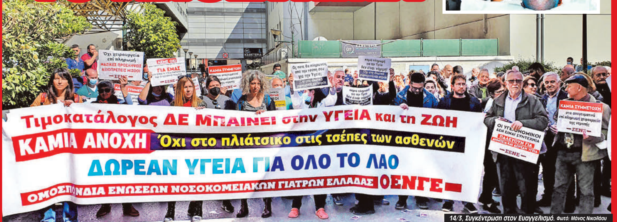
14/3, Συγκέντρωση στον Ευαγγελισμό.