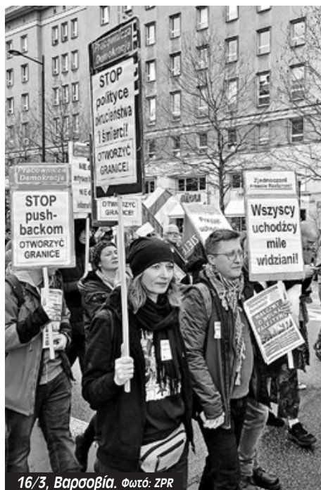
16/3, Βαρσοβία.

«Στη συνέχεια πραγματοποιήσαμε πορεία προς το κοινοβούλιο. Ο νέος κυβερνητικός συνασπισμός, που είναι υπό “φιλελεύθερη” ηγεσία στην Πολωνία υποσχέθηκε να αντιμετωπίσει τους μετανάστες πιο ανθρώπινα. Αλλά αυτό ήταν ένα ψέμα. Έχουμε ήδη δει 325 επαναπροωθήσεις στα σύνορα με τη Λευκορωσία από τα τέ-