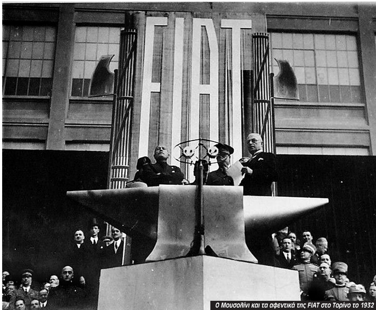
Ο Μουσολίνι και τα αφεντικά της FIAT στο Τορίνο το 1932

Στο Μιλάνο η απεργία ήταν ίσως πιο γενικευμένη. Συμμετείχαν οι οδηγοί του τραμ κάτι που έκανε την απεργία «ορατή» (και με επιπτώσεις) στους πάντες. Ομάδες των GAP (αντάρτες πόλης) ανατίναξαν μια μεγάλη σιδηροδρομική γραμμή. Οι φοιτητές/τριες πήραν σηκωτούς φασίστες καθηγητές και τους πέταξαν έξω από το πανεπιστήμιο. Πολλοί υπάλληλοι γραφείου σε εταιρείες όπως η Edison και η Montecatini