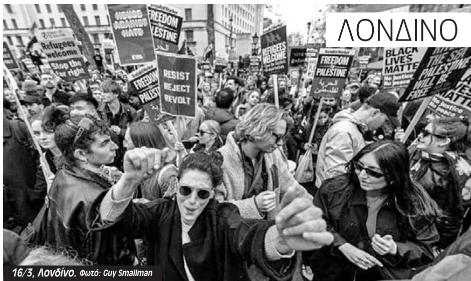
16/3, Λονδίνο.

Τις προηγούμενες μέρες υπουργός της κυβέρνησης Σούνακ προχώρησε σε ισλαμοφοβικές δηλώσεις κατηγορώντας τις μουσουλμανικές οργανώσεις για «εξτρεμισμό». Η Τρέισι από το συνδικάτο PCS και το SUTR του Μπέρμπιγχαμ, κατηγορήσε τον υπουργό ότι παίζοντας το χαρτί της ισλαμοφοβίας «προσπαθεί να διασπάσει το κίνημα της Παλαιστίνης σύμφωνα με φυλετικές και θρησκευτικές γραμμές -και να το συντρίψει. «Αλλά βλέπω παραδείγματα εξτρεμισμού στα κοινοβούλια κάθε φορά που ανοίγω την τηλεόραση» πρόσθεσε. Η Τζένη, από τα μαύρα μέλη του συνδικάτου Unison και την ομάδα LGBTQ+ είπε: