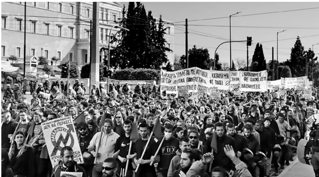
14/3, Διαδήλωση φοιτητικών καταλήψεων στην Αθήνα.

Αυτό που φοβάται περισσότερο απ' όλα η κυβέρνηση είναι την πολιτικοποίηση και την ριζοσπαστικοποίηση μιας νέας γενιάς που μπαίνει μπροστά στον αγώνα συνολικά ενάντια στην κυβέρνηση και αυτό το σύστημα. Φοβούνται και τρέμουν