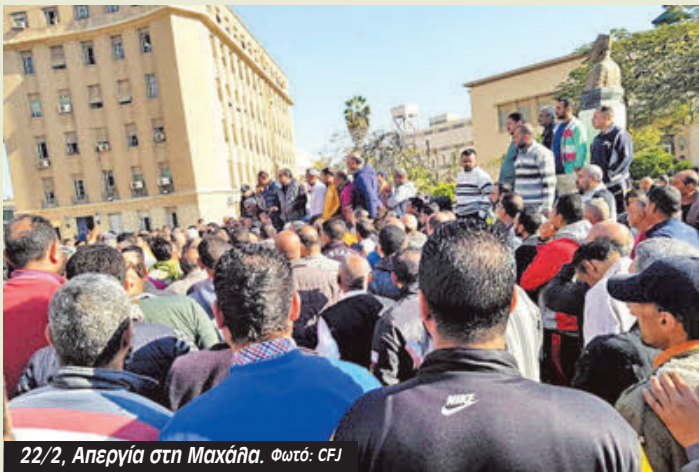
22/2, Απεργία στη Μαχάλα.