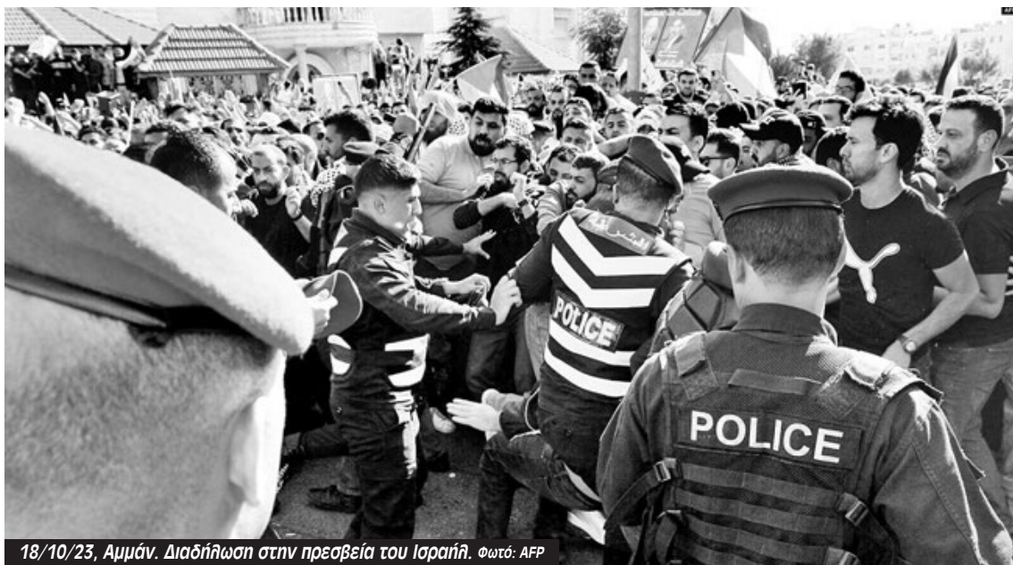
18/10/23, Αμμάν. Διαδήλωση στην πρεσβεία του Ισραήλ.

Η λαϊκή οργή για την επίθεση του Ισραήλ κατά των Παλαιστινίων φουντώνει σε ολόκληρη την Ιορδανία, η οποία συνορεύει με το Ισραήλ και τη Δυτική Όχθη. Οι πρόσφυγες παλαιστινιακής καταγωγής αποτελούν ένα σημαντικό ποσοστό της ιορδανικής κοινωνίας - περίπου δύο εκατομμύρια σε μια χώρα με πληθυσμό λίγο πάνω από 11 εκατομμύρια. Η πρωτεύουσα της Ιορδανίας, το Αμμάν, απέχει μόλις 90 μίλια από τη Γάζα.