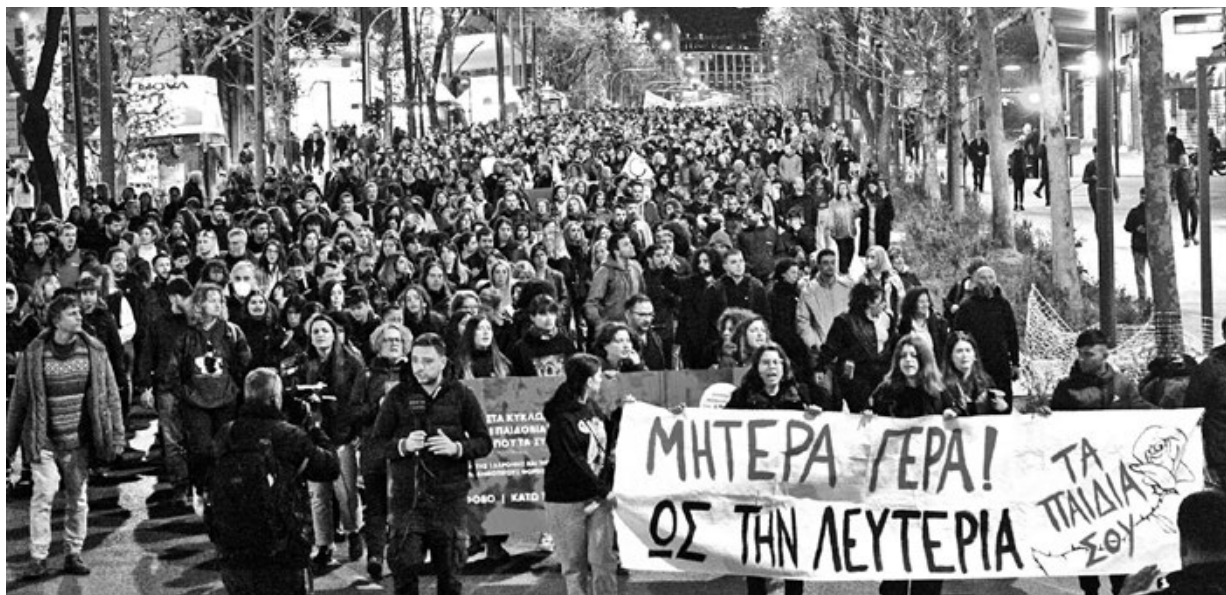
14/3, Διαδήλωση ενάντια στην εισαγγελική πρόταση στη δίκη των βιαστών της 12χρονης στον Κολωνό.