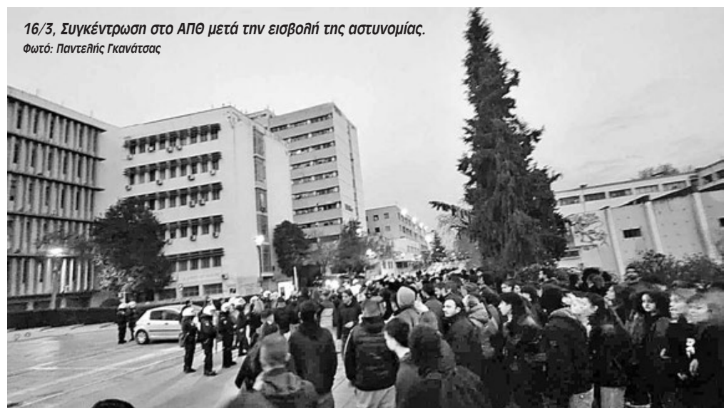
16/3, Συγκέντρωση στο ΑΠΘ μετά την εισβολή της αστυνομίας.