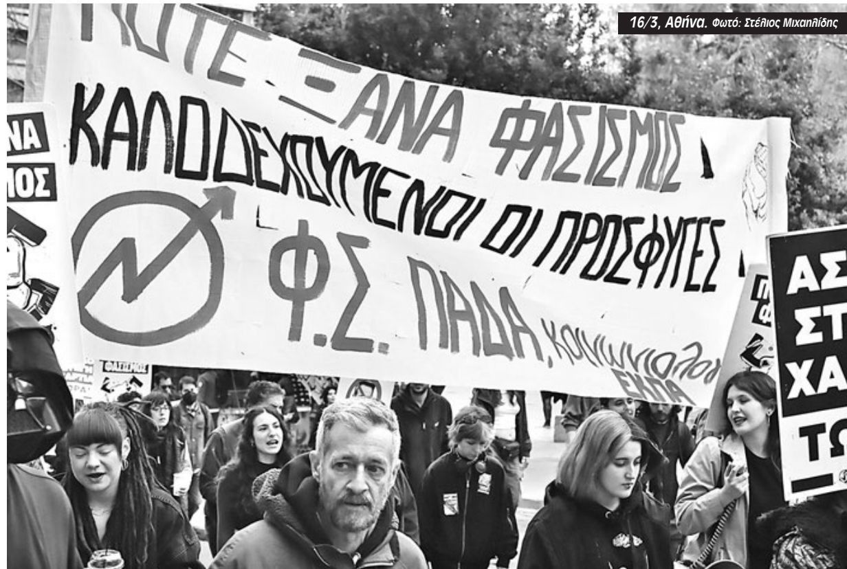
16/3, Αθήνα.

«Η ΧΑ είχε ήδη δραστηριοποιηθεί στην περιοχή», τόνισε. «Είχαν ανοίξει γραφεία στην Ιεράπετρα, είχαν ξενοφοβικό και ρατσιστικό λόγο, είχαν εμφανίσεις με βηματισμούς, παρελάσεις, παραγγέλματα, σαν στρατιωτικό άγημα», πρόσθεσε, λέγοντας ότι ο ίδιος ήταν ενεργός στα κινήματα αντίστασης της περιοχής όπως ενάντια στα μνημόνια ή για να μην κλείσει το νοσοκομείο της Ιεράπετρας. Αργότερα έγινε γνωστό ότι τα τζιπ που είχε δει ανήκαν στους Πετράκη και Γαροφαλάκη (τον δεύ-