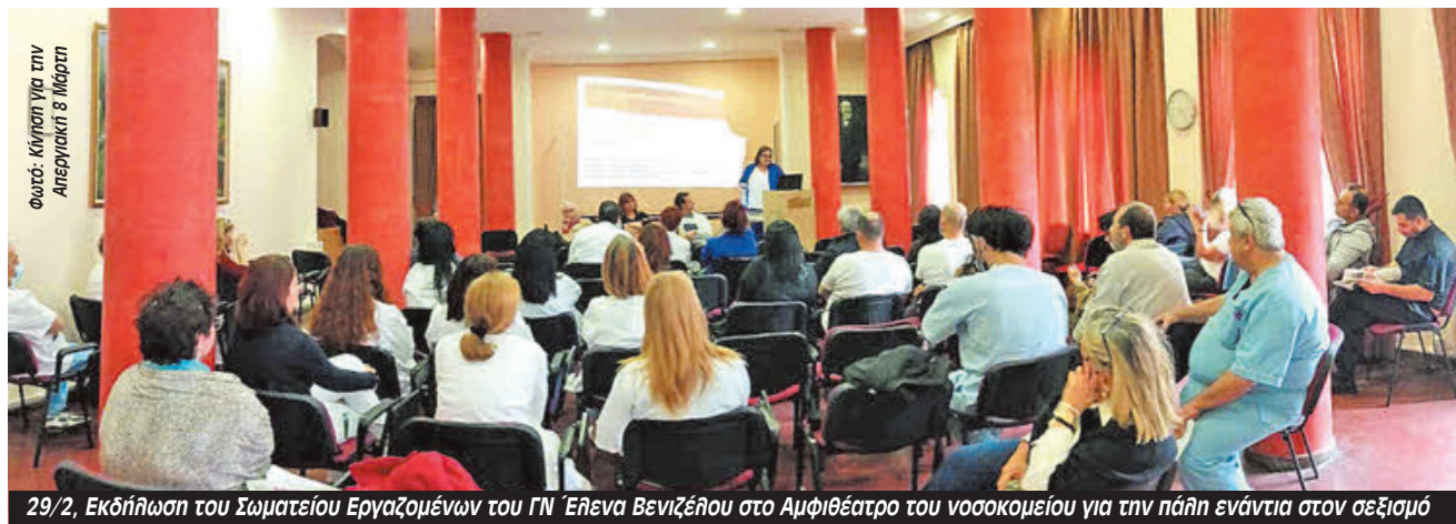
29/2, Εκδήλωση του Σωματείου Εργαζομένων του ΓΝ Έλενα Βενιζέλου στο Αμφιθέατρο του νοσοκομείου για την πάλη ενάντια στον σεξισμό

Διεκδικούμε εδώ και τώρα: Δημιουργία πρωτοκόλλου περίθαλψης-διαχείρισης κακοποιημένων γυναικών. Καμία εμπλοκή της αστυνομίας στο έργο μας. Μαζικές προσλήψεις στα γυναικολογικά νοσοκομεία και όχι απαξίωση και διάλυσή τους. Καλούμε ΠΟΕΔΗΝ, ΟΕΝΓΕ και τα πρωτοβάθμια σωματεία της υγείας να μπουν μπροστά στα ζητήματα της αντιμετώπισης των κακοποιημένων γυναικών, της έμφυλης βίας και του σεξισμού».