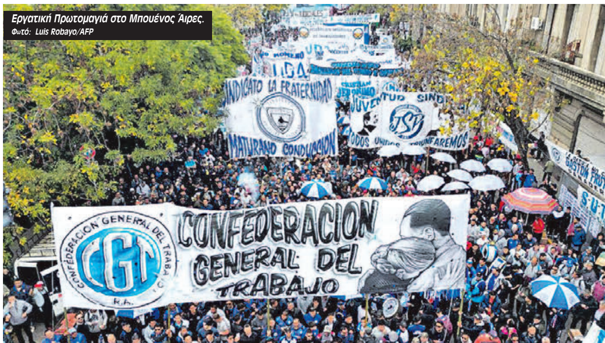
Εργατική Πρωτομαγιά στο Μπουένος Άιρες.

Στις 24 Γενάρη, τα συνδικάτα κάλεσαν την πρώτη γενική απεργία 12 ωρών. Από τότε δεν έχει σταματήσει να απλώνεται και η συζήτηση και η οργάνωση μέσα σε όλους τους χώρους για το ποια θα είναι η συνέχεια. Η αντίσταση έχει σαν αποτέλεσμα να μην έχει καταφέρει να σταθεροποιηθεί η κυβέρνηση Μιλέι. Ο Μιλέι ήρθε σαν σωτήρας της άρχουσας τάξης να κόψει με πριόνι όλες τις κατακτήσεις των εργατών και των εργατριών.