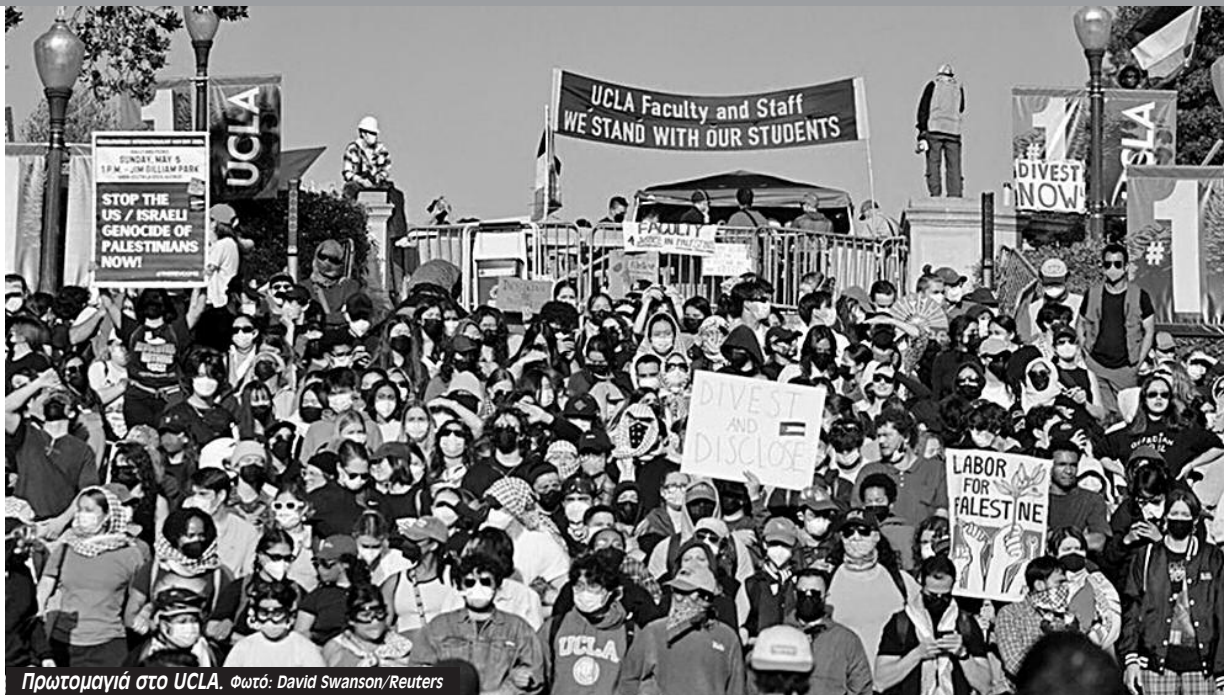
Πρωτομαγιά στο UCLA.

Ο Τραμπ που διεκδικεί την υποψηφιότητα για νέος πρόεδρος των ΗΠΑ έκανε ρελάνς: «Ήταν όμορφο να βλέπεις την αστυνομία να εισβάλλει στο Κολούμπια. Λέω διαλύστε αμέσως τους "καταυλισμούς", συντρίψτε τους ριζοσπάστες και πάρτε πίσω τις πανεπιστημιούπολεις μας για όλους τους φυσιολογικούς φοιτητές που θέλουν ένα ασφαλές μέρος για να μάθουν». Ταυτόχρονα δήλωσε ότι είναι έτοιμος να «αμφισβητήσει» ξανά ένα αποτέλεσμα που δεν τον βολεύει στις επερχόμενες εκλογές υπονοώντας πράξεις όπως η εισβολή των ακροδεξιών στο