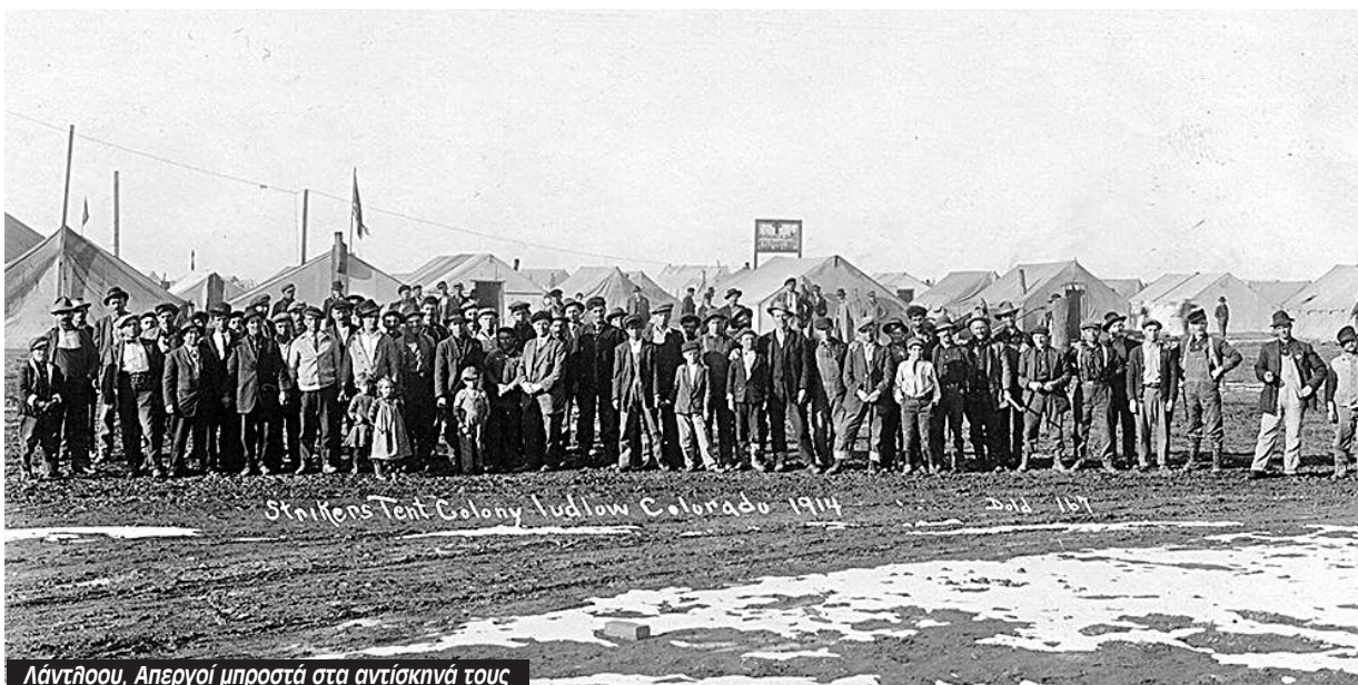
Λάντλοου, Απεργοί μπροστά στα αντίσκηνά τους

Ήταν Δευτέρα του Πάσχα του 1914 στον καταυλισμό των απεργών ανθρακωρύχων στο Λάντλοου στο Κολοράντο, όταν η Εθνοφρουρά άρχισε να γαζώνει με σφαίρες τις τέντες που έμεναν οι απεργοί. Την προηγούμενη μέρα, 19 του Απριλίου, οι Έλληνες απεργοί είχαν οργανώσει ένα μεγάλο πασχαλινό γλέντι στον καταυλισμό για όλους τους συναδέλφους τους, με σούβλες, χορούς, μουσικές και... μπίτζμπολ. Από τη μανία της επίθεσης ο καταυλισμός πήρε φωτιά και καταστράφηκε ολοσχερώς. Δεκάδες απεργοί, γυναίκες και παιδιά δολοφονήθηκαν, μεταξύ αυτών κι ο ηγέτης τους, ο Λούης Τίκας ή αλλιώς Ηλίας Σπαντιδάκης όπως τον ήξεραν στο χωριό του στο Ρέθυμνο.