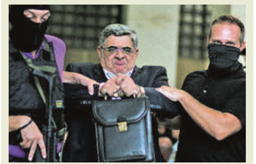
Πίσω στη φυλακή ο Μιχαλολιάκος