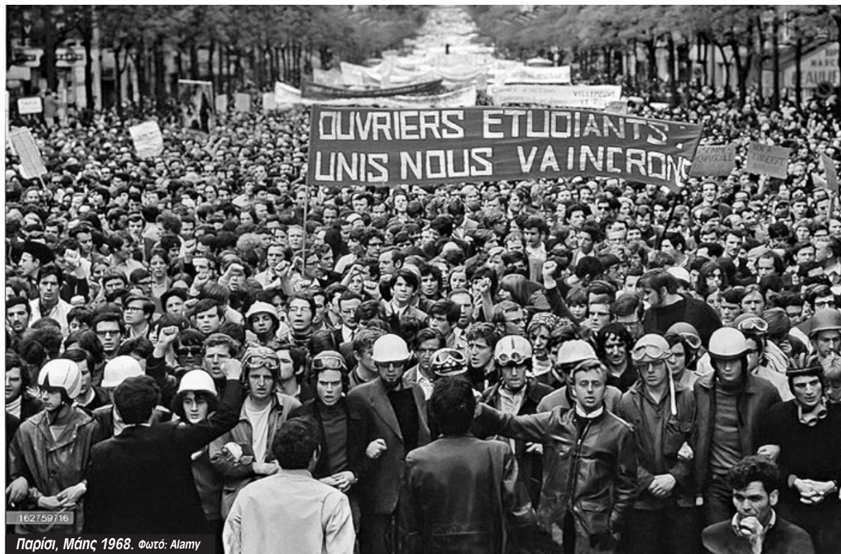
Παρίσι, Μάης 1968.

Κι όπως θυμόταν αργότερα ένας εργάτης στη Ρενό Μπιγιανκούρ: «Περίπου 25.000 εργάτες απεργούσαν στο εργοστάσιό μας. Η Ρενό Μπιγιανκούρ είχε τη μεγαλύτερη συγκέντρωση εργατών. Γι' αυτό το λόγο η απεργία εκεί ήταν τόσο σημαντική. Ο πρόεδρος Ντε Γκολ αναγκάστηκε να επιστρέψει άρον άρον από την επίσημη επίσκεψή του στη Ρουμανία εξαιτίας της κατάληψής μας. Ο Ζορζ Πομπιντού, ο πρωθυπουργός, σχολίασε μόλις έμαθε τα νέα: 'Τώρα το πράγμα σοβα-