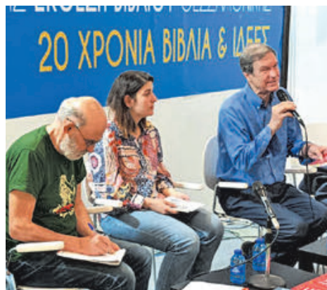
18/5, Διεθνής Έκθεση Βιβλίου Θεσσαλονίκης.