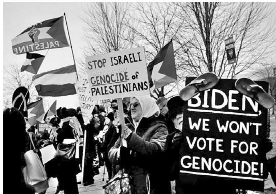
1/2, Συγκέντρωση έξω από ομιλία του Μπάιντεν στο Μίτσιγκαν.

Οι ΗΠΑ τρέχουν τώρα να δώσουν στην Ουκρανία τα όπλα που μέχρι πρόσφατα μπλόκαραν οι Τραμπικοί Ρεπουμπλικάνοι στο Κογκρέσσο. Ο Υπουργός Εξωτερικών, Άντονι Μπλίνκεν, έκανε μια επίσκεψη έκπληξη στο Κίεβο την περασμένη βδομάδα. Όσο τρελό και να φαίνεται, πήρε μια κιθάρα και έπαιξε το “Rockin in the Free World” του Νιλ Γιανγκ σε ένα μπαρ. Αυτού του είδους τα ψυχροπολεμικά κα-