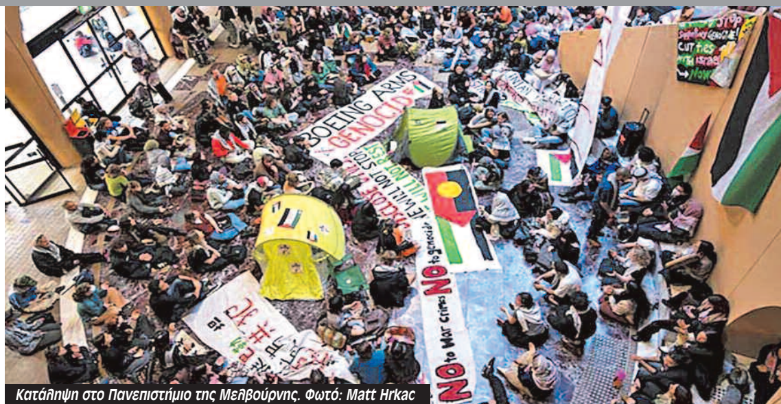
Κατάληψη στο Πανεπιστήμιο της Μελβούρνης.