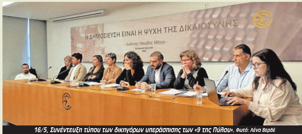
16/5, Συνέντευξη τύπου των δικηγόρων υπεράσπισης των «9 της Πύλου».

έναν χρόνο τώρα με πολύ βαριές κατηγορίες», συνέχισε. Και εκτίμησε ότι «οι ελληνικές αρχές θα προσπαθήσουν σε μια φαστ τρακ διαδικασία στο δικαστήριο, χωρίς το παραμικρό στοιχείο, να καταδικάσουν τους εννιά με σκοπό η Ελλάδα να συνεχίσει με τις ευλογίες της Ευρώπης τις θανατοπολιτικές στα σύνορα».