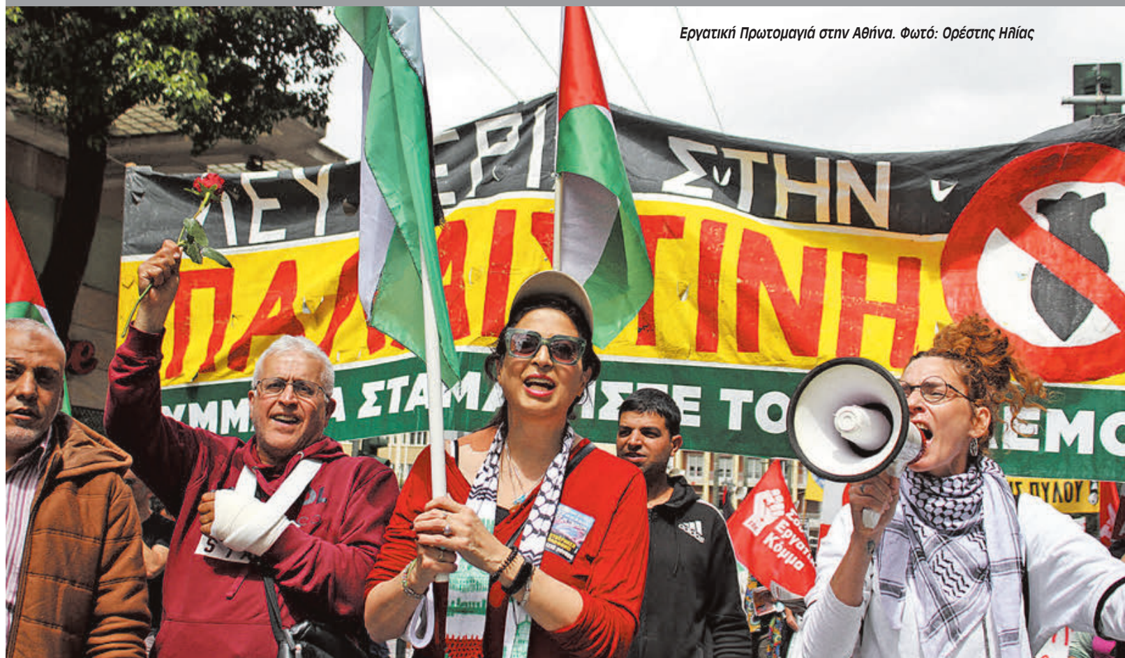
Εργατική Πρωτομαγιά στην Αθήνα.