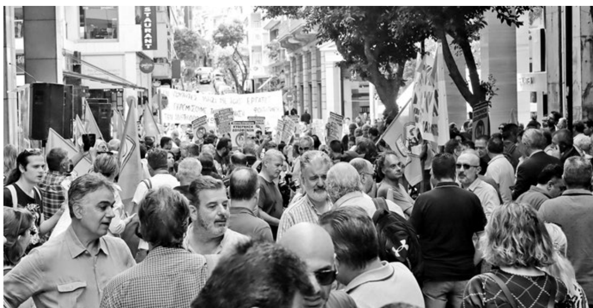
21/5, Αθήνα. Απεργία ΑΔΕΔΥ.

Τ α προβλήματα στην Έρευνα είναι πάρα πολλά και κοινά με το υπόλοιπο Δημόσιο. Οι χαμηλοί μισθοί, το πάγωμα των κλιμακίων και η περικοπή των δώρων σε συνδυασμό με την ακρίβεια έχουν υποβαθμίσει τραγικά την ποιότητα ζωής μας τα τελευταία χρόνια. Το εισόδημα δεν φτάνει ούτε για την επιβίωση. Ταυτόχρονα η Έρευνα διαλύεται. Η χρηματοδότηση είναι εξαιρετικά ελλιπής, οι υποδομές καταστρέφονται, δεν υπάρχει κανένα πλάνο, όπως και στην Υγεία και την Παιδεία. Ο ιδιωτικός τομέας μπαίνει όλο και πιο δυναμικά και στον χώρο της Έρευνας. Το κυβερνητικό σχέδιο λέει «στραφείτε στον ιδιωτικό τομέα, μην περιμένετε από το κράτος να σας στηρίξει». Εμείς