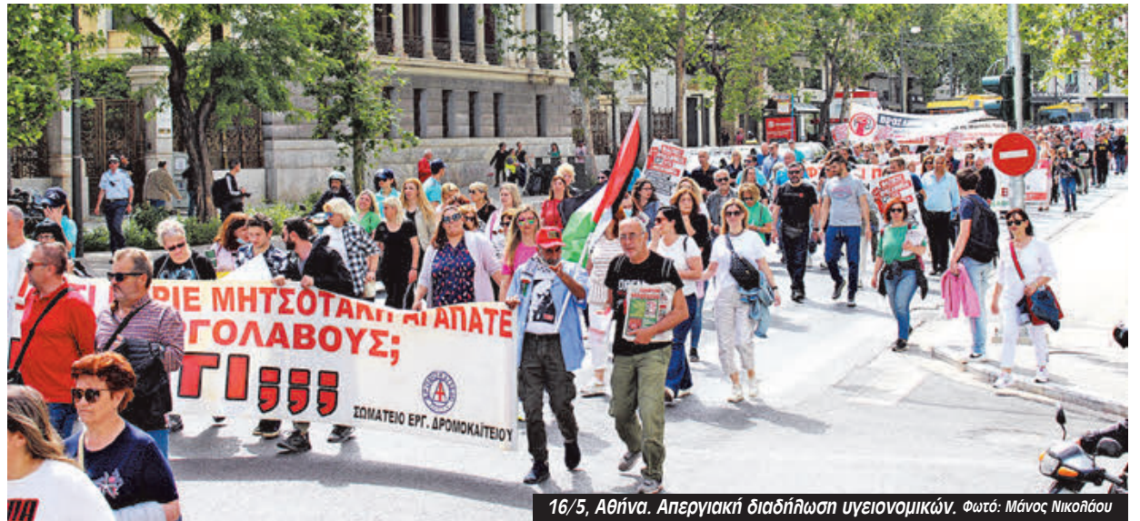
16/5, Αθήνα. Απεργιακή διαδήλωση υγειονομικών.

Μαζικά διαδήλωσαν την Πέμπτη 16 Μάη, ημέρα απεργίας της ΠΟΕΔΗΝ, οι απεργοί υγειονομικοί στο κέντρο της Αθήνας. Η συγκέντρωση ξεκίνησε από την πλατεία Μαβίλη και με στάσεις στο Μέγαρο Μαξίμου, στη Βουλή και στο Γενικό Λογιστήριο κατέληξε στο υπουργείο Υγείας.