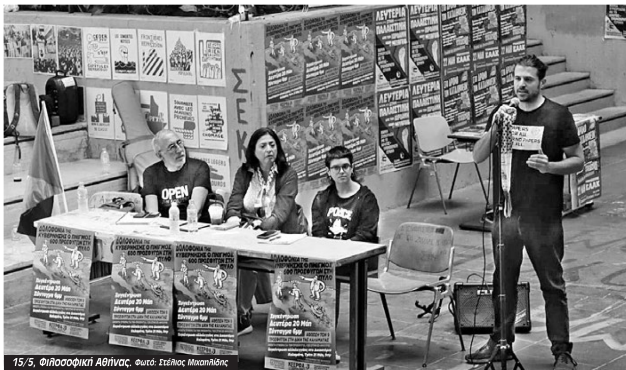
15/5, Φιλοσοφική Αθήνας.

Τι λένε πάντα όταν γίνεται ναυάγιο στην Ελλάδα ή στην Ιταλία; "Δεν φταίμε εμείς, τα ευρωπαϊκά κράτη. Οι διακινητές φταίνε". Πολλές φορές μάλιστα μιλάνε για δουλεμπορούς