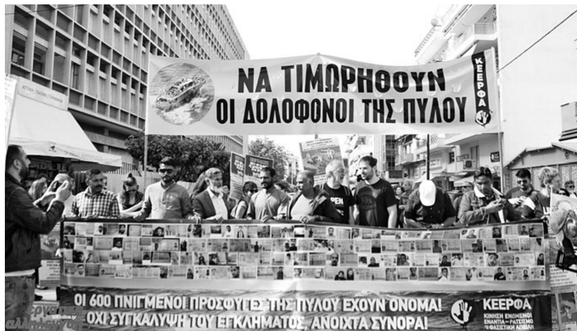
Επιζώντες από το ναυάγιο διαδηλώνουν έξω από τα δικαστήρια στην Καλαμάτα. Στη φωτό (κάτω) πανηγυρισμοί μετά την αθωωτική απόφαση.