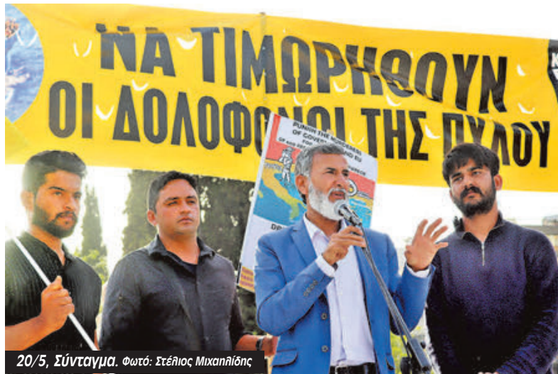
20/5, Σύνταγμα.

λιμενικού: «Το λιμενικό ήρθε πέταξε ένα σκοινί και λίγο μετά βρεθήκαμε στη θάλασσα. Πνιγόμασταν και προσπαθήσαμε να σωθούμε. Αν