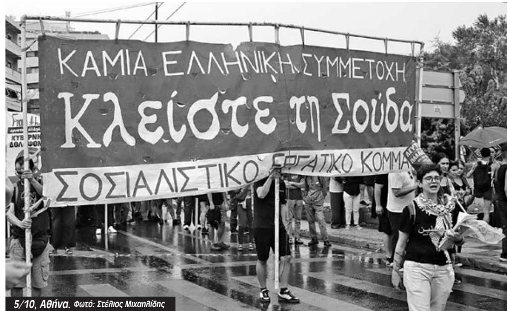
5/10, Αθήνα. Φωτό: Στέλιος Μικαηλίδης

κή κυβέρνηση ισχυρίστηκε ότι επρόκειτο για «ετήσιο εκπαιδευτικό ταξίδι των δοκιμών του ισραηλινού πολεμικού ναυτικού» αλλά η ισραηλινή πλευρά έκανε λόγο για «δοκιμαστικό πλου των δύο αρματαγωγών, στο πλαίσιο επιχειρησιακού σεναρίου που προβλέπει την κα-