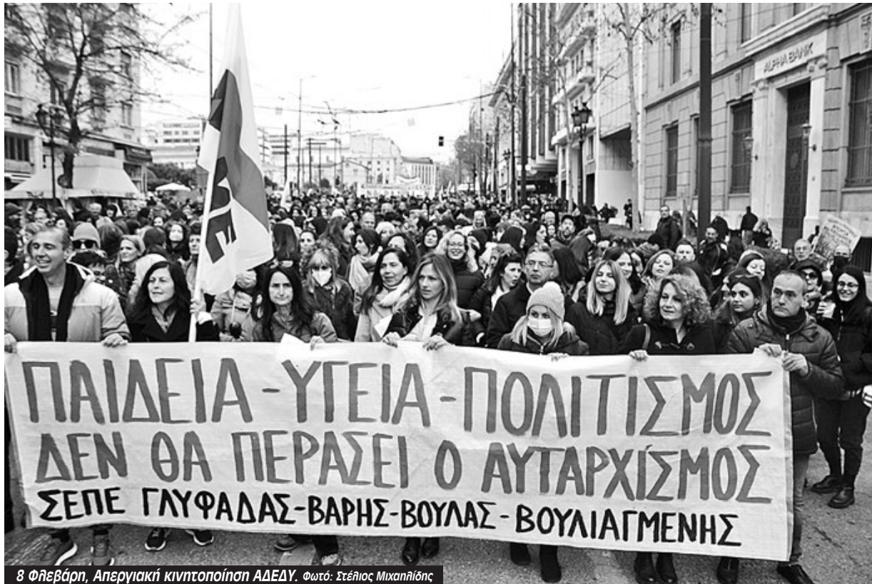
8 Φθεβάρη, Απεργιακή κινητοποίηση ΑΔΕΔΥ.

Την ίδια ώρα με τη συνεδρίαση του ΔΣ της ΔΟΕ ήταν σε εξέλιξη στάση εργασίας και συγκέντρωση