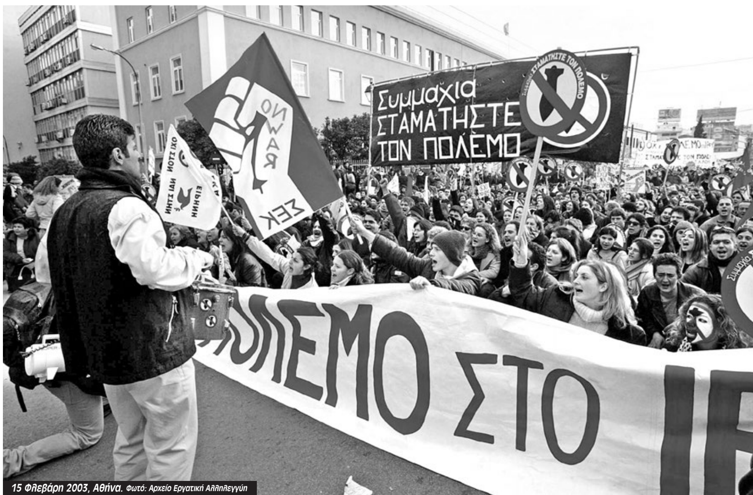
15 Φεβράρη 2003, Αθήνα.

Για εκατομμύρια κόσμο αυτή ήταν η πρώτη φορά που κατέβαινε σε διαδήλωση και έπαιρνε στα χέρια του εργαλεία τα οποία μέχρι τότε έμοιαζαν να μην του ανήκουν: πικέτα, συνθήματα, πανό, προκήρυξη. Στη Ρώμη, με τα τρία εκατομμύρια, καταγράφεται στο βιβλίο των ρεκόρ Γκίνες του 2004 ως το μεγαλύτερο αντιπο-