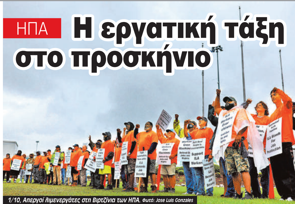
1/10, Απεργοί λιμενεργάτες στη Βιρτζίνια των ΗΠΑ.

Ένα από τα βασικά ζητήματα, εκτός από τους μισθούς, είναι η πίεση των εταιρειών για περισσότερα αυτόματα συστήματα στα λιμάνια. Η δουλειά των λιμενεργατών είναι να φορτώνουν, να ξεφορτώνουν, να καταγράφουν την πορεία των εμπορευμάτων και να συντηρούν τα μηχανήματα. Οι εταιρείες προσαθούν να χρησιμοποιήσουν περισσότερους γεραμούς και ηλεκτρονικά συστήματα για την παρακολούθηση. Παραπονιούνται ότι τα αμερικάνικα λιμάνια είναι πολύ πίσω τεχνολογικά σε σχέση με άλλες χώρες οι οποίες προσφέρουν φθηνότερες υπηρεσίες. Στις ΗΠΑ παραμένουν μάλιστα σε ισχύ κα-