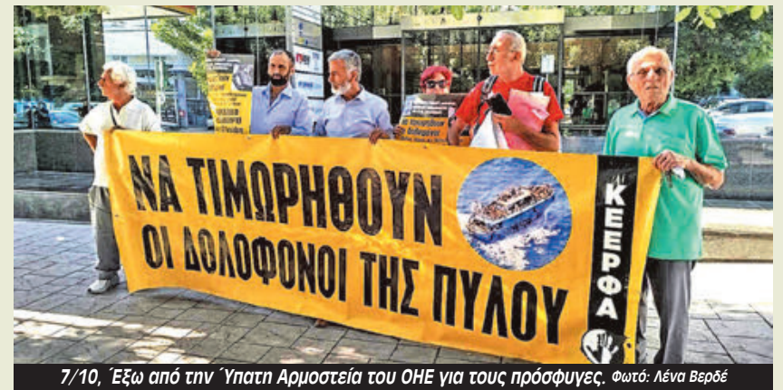
7/10. Έξω από την Ύπατη Αρμοστεία του ΟΗΕ για τους πρόσφυγες.

Η δημοσιοποίηση του εγγράφου έφερε σε δύσκολη θέση το αρχηγείο της ΕΛΑΣ που έτρεξε να διευκρινήσει με ανακοίνωσή του ότι η επίσκεψη της επιτροπής του ΟΗΕ είναι «εξάκθαρα τακτική και προγραμματισμένη», κι όχι έκτακτη λόγω των πρόσφατων θανάτων των μεταναστών στα ΑΤ Ομόνοιας και Αγίου Παντελεήμονα όπως προβλήθηκε. Αλλά δεν έβγαλε άχνα για την ξεκάθαρη οδηγία του προς τα ΑΤ να «καθαρίσουν» τα ίχνη από τους τόπους του εγκλήματος.