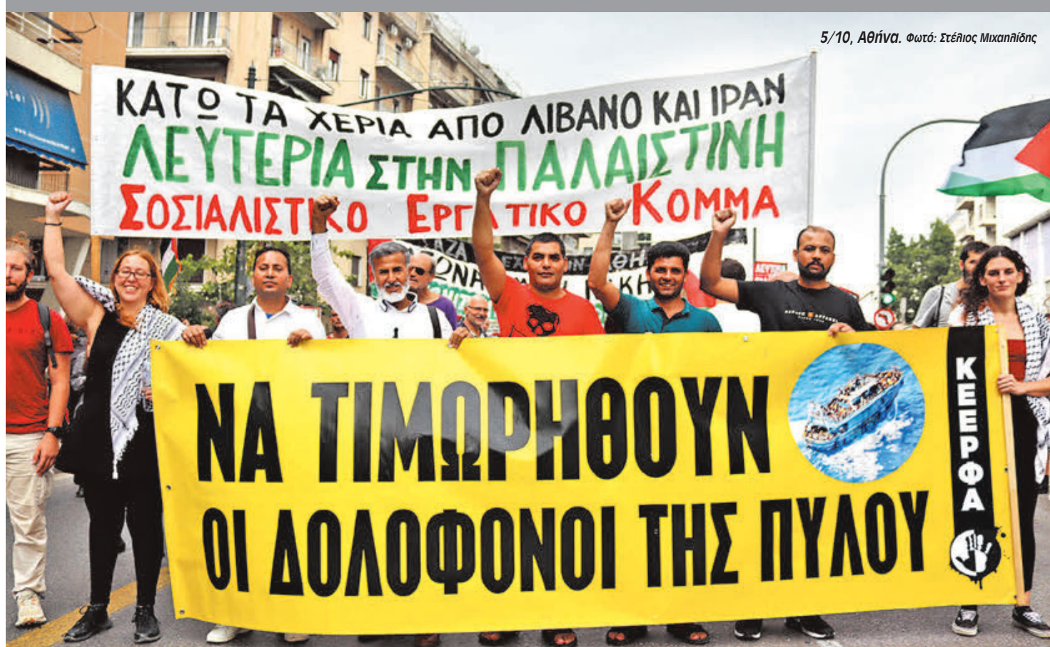
5/10, Αθήνα.