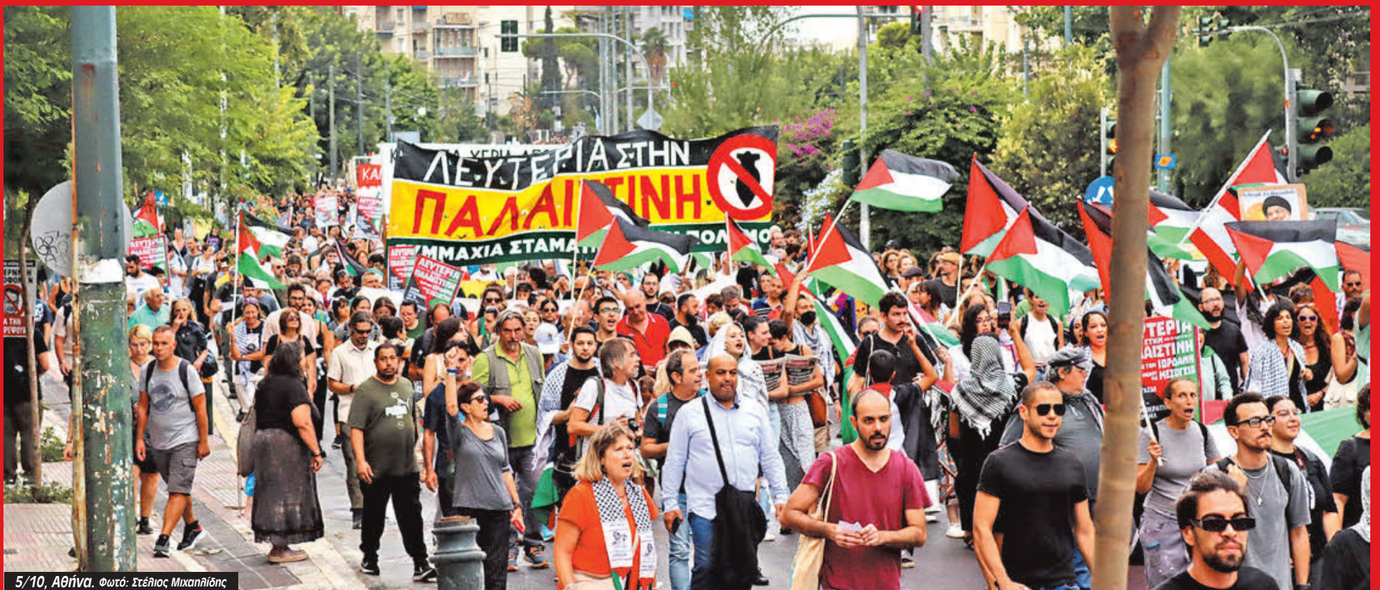
5/10, Αθήνα.

Γυρίστε στις σελίδες 6, 7, 8, 9, 10, 11, 12, 13