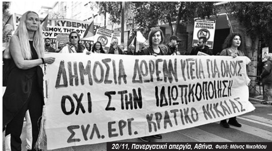
20/11, Πανεργατική απεργία, Αθήνα.