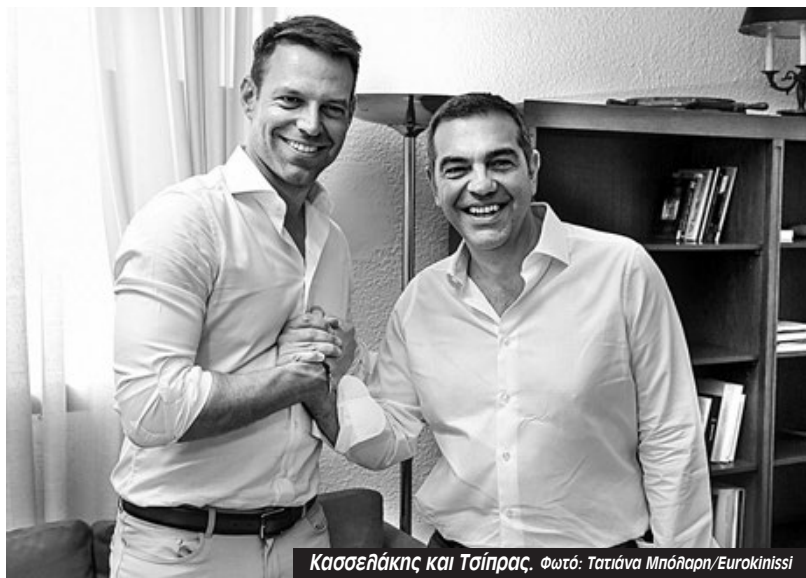
Κασσελάκης και Τσίπρας.

Οι βουλευτές αυτοί δεν μπόηκαν στα ψηφοδέλτια του ΣΥΡΙΖΑ επί Κασσελάκη. Μπόηκαν την εποχή που δεν είχε χαθεί ακόμα η «σοβαρότητα» -την οποία υπόσχεται τώρα ο Φάμελλος να αποκαταστήσει. Είχαν μπει στα ψηφοδέλτια το 2019, την εποχή που πρόεδρος του κόμματος ήταν ακόμα ο Αλέξης Τσίπρας και ο