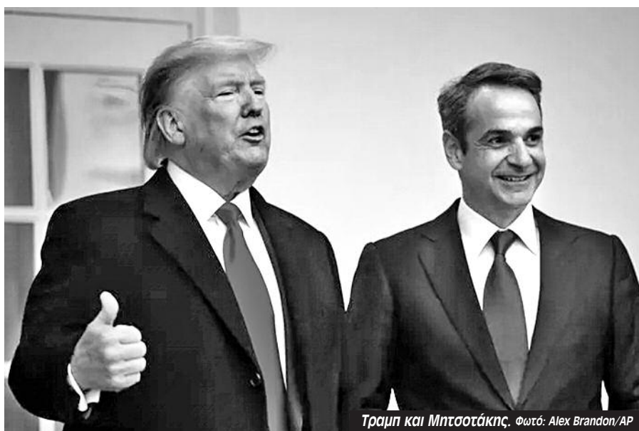
Τραμπ και Μητσοτάκης.

δεδομένου του αδιεξόδου στο Συμβούλιο Ασφαλείας. Αυτό αφήνει την Ευρώπη, είτε μέσω του ΝΑΤΟ, αλλά χωρίς αμερικανικές δυνάμεις, είτε μια προσαρμοσμένη ευρωπαϊκή δύναμη. Εδώ είναι που μπαίνει στο παιχνίδι η ευρωπαϊκή δυνητική επιρροή».