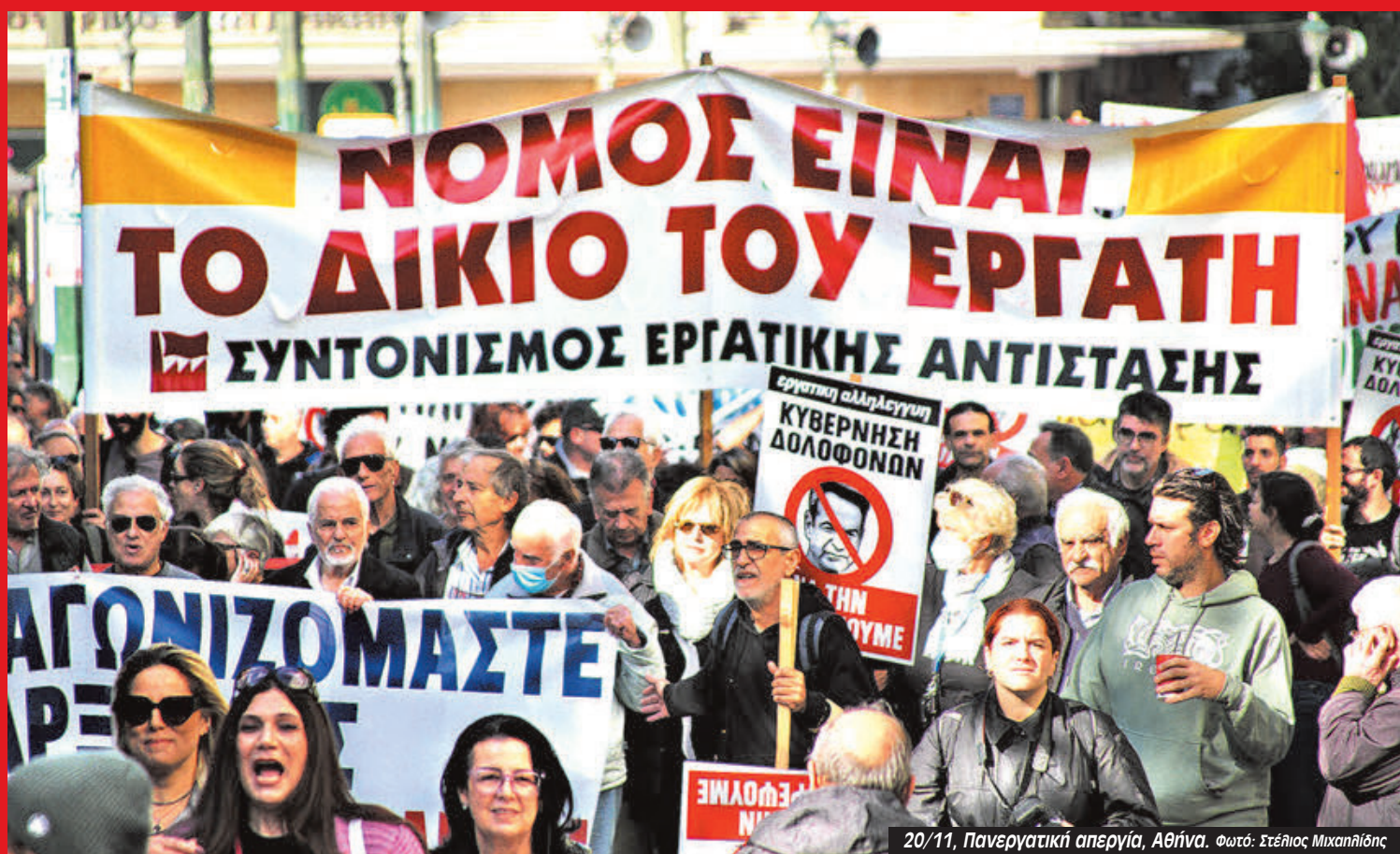
20/11, Πανεργατική απεργία, Αθήνα.