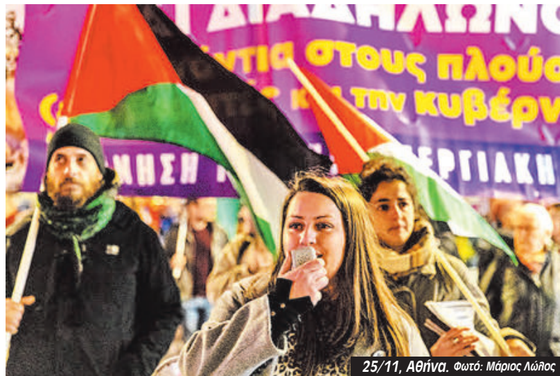
25/11, Αθήνα.

«Είμαστε εδώ για να ευαισθητοποιήσουμε για πράγματα που θα έπρεπε να είναι αυτονόητα, αλλά