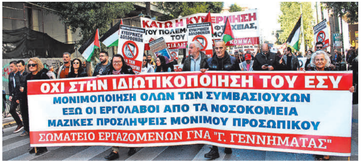
20/11, Πανεργατική απεργία, Αθήνα.

«Με μια πολύ μαζική και μαχητική απεργιακή συγκέντρωση απάντησαν στην κυβέρνηση οι εργαζόμενοι», υπογραμμίζει το ΣΕΚ στην Πάτρα . «Πολλοί εργασιακοί χώροι έβαλαν