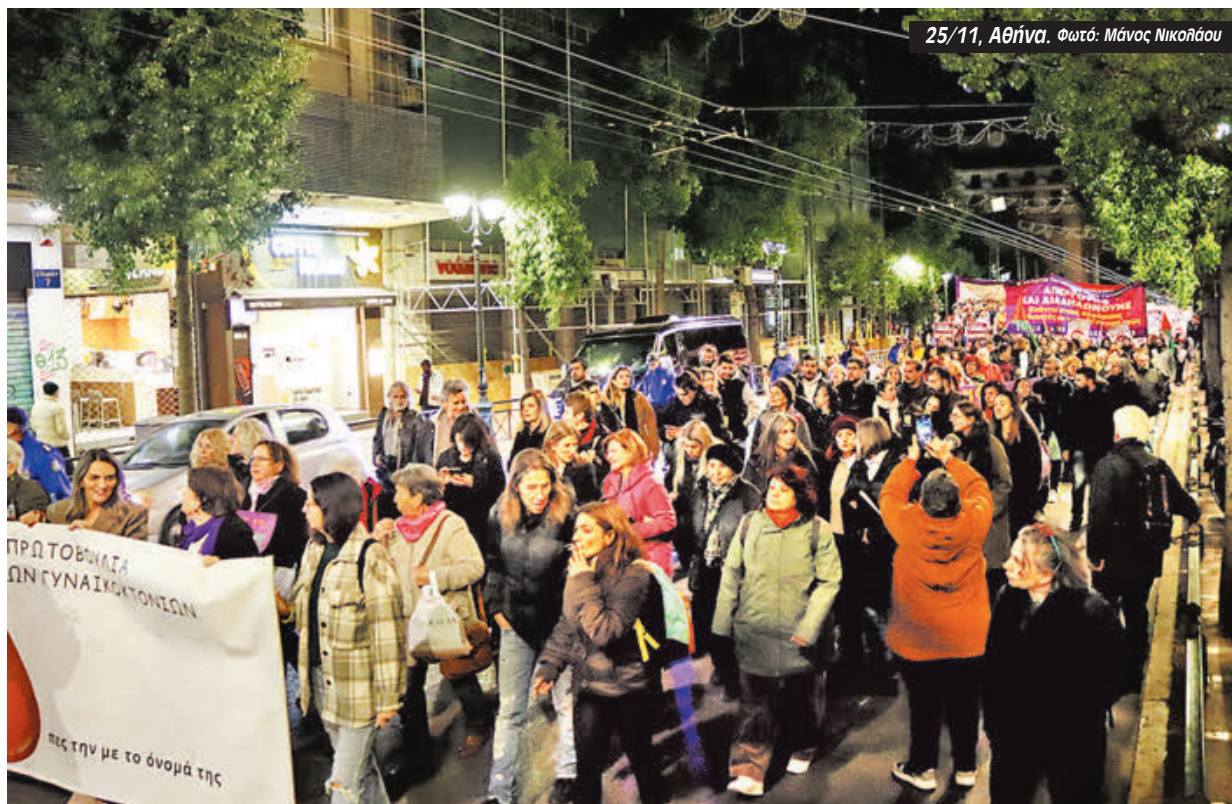
25/11, Αθήνα.

«Είμαστε εδώ ενάντια στη βία κατά των γυναικών, γιατί βλέπουμε το