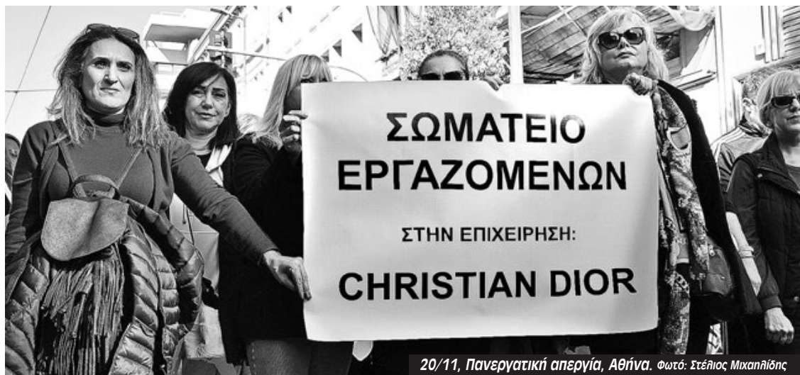
20/11, Πανεργατική απεργία, Αθήνα.

Η Parfum Cristian Dior Ελλάς -θυγατρική της πολυεθνικής- μας έβγαλε χωρίς καμία προειδοποίηση από την κλαδική Σύμβαση Εργασίας των Αισθητικών που ήμασταν, για να μας ρίξει στον κατώτατο μισθό. Ζητάμε επίσης τα επιδόματα που δικαιούμαστε για μια αξιοπρεπή ζωή. Γι' αυτό σήμερα η συμμετοχή μας στην απεργία είναι τεράστια, με περίπου το 95% να απεργεί. Μιλάμε για ένα σωματείο με πάνω από 100 άτομα, επί το πλείστον γυναίκες. Σπάμε το στερεότυπο και για τις γυναίκες που δουλεύουν στην αισθητική και για τον κλάδο του εμπορίου που είναι πιο δύσκολο να απεργήσει. Είμαστε εργαζόμενες της πρώτης γραμμής σε έναν κλάδο που παλεύει για την ισχύ της συλλογικής σύμβασης.