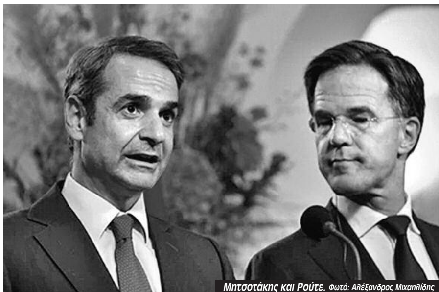
Μητσοτάκης και Ρούτε.

Όσον αφορά την επιτήρηση μιας συμφωνίας, οι έμπιστοι του Τραμπ είναι ανένδοτοι ότι δεν θα παρατάξει ούτε έναν Αμερικανό στρατιώτη. Η λύση της δεκαετίας του 1990, μια δύναμη από κυανόκρανους του ΟΗΕ, είναι επίσης εκτός συζήτησης,