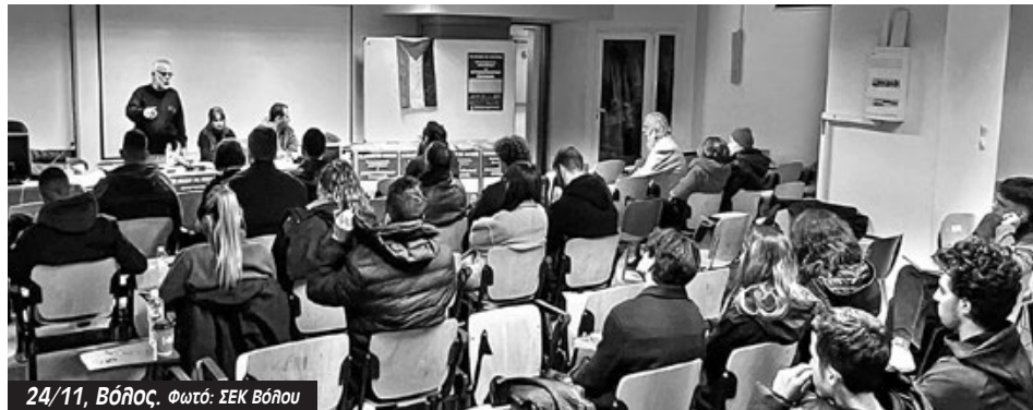
24/11, Βόλος.

Στη συνέχεια ακολούθησαν πολλές ερωτήσεις και τοποθετήσεις. Ένας σύντροφος έθεσε το ζήτημα κατά πόσο η Αριστερά συζητάει πραγματικά για τη στρατηγική της με νέους όρους ή μένει σε πα-