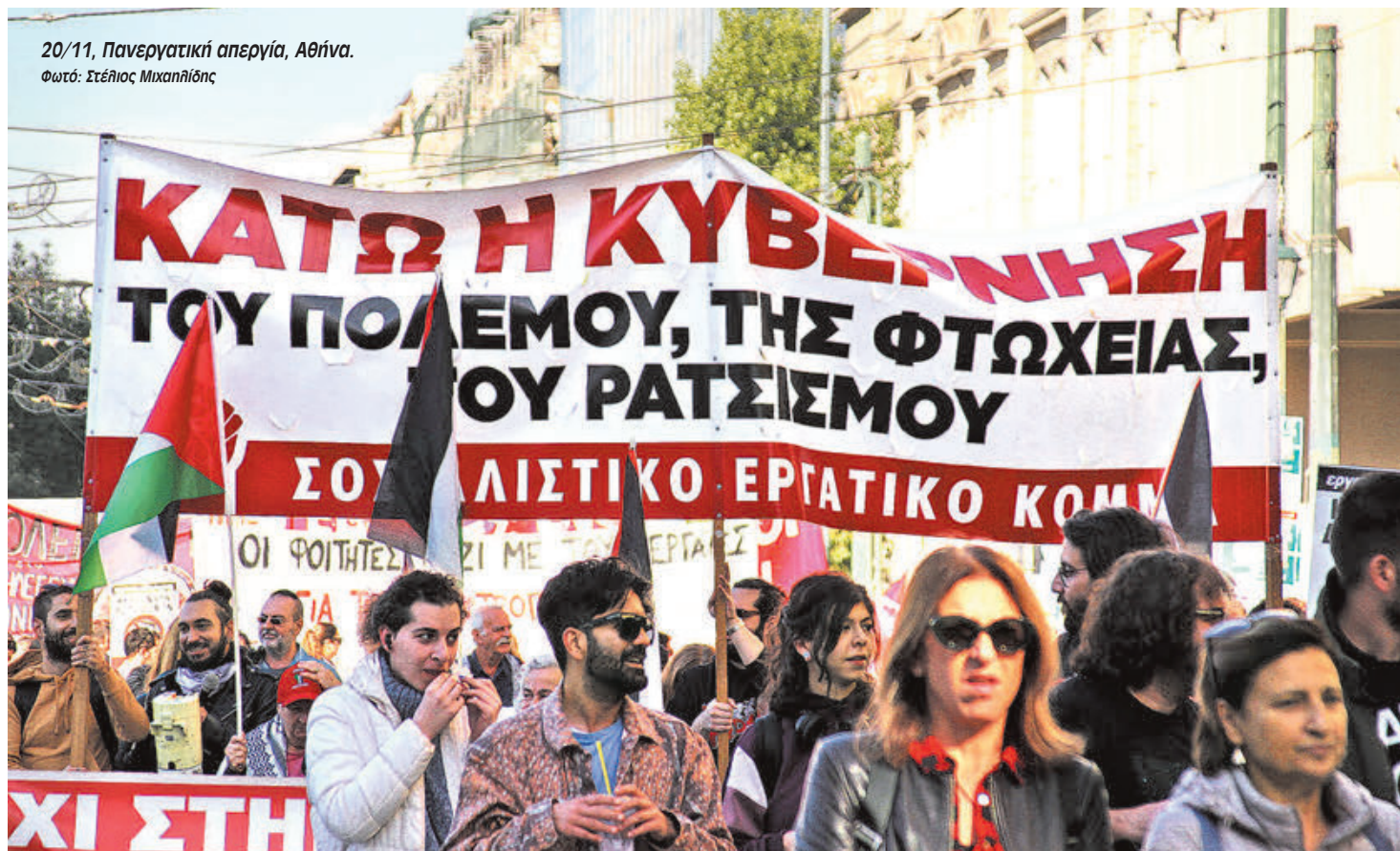
20/11, Πανεργατική απεργία, Αθήνα.