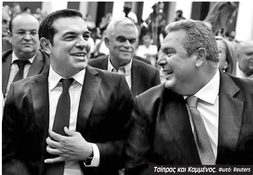
Τσίπρας και Καμμένος.