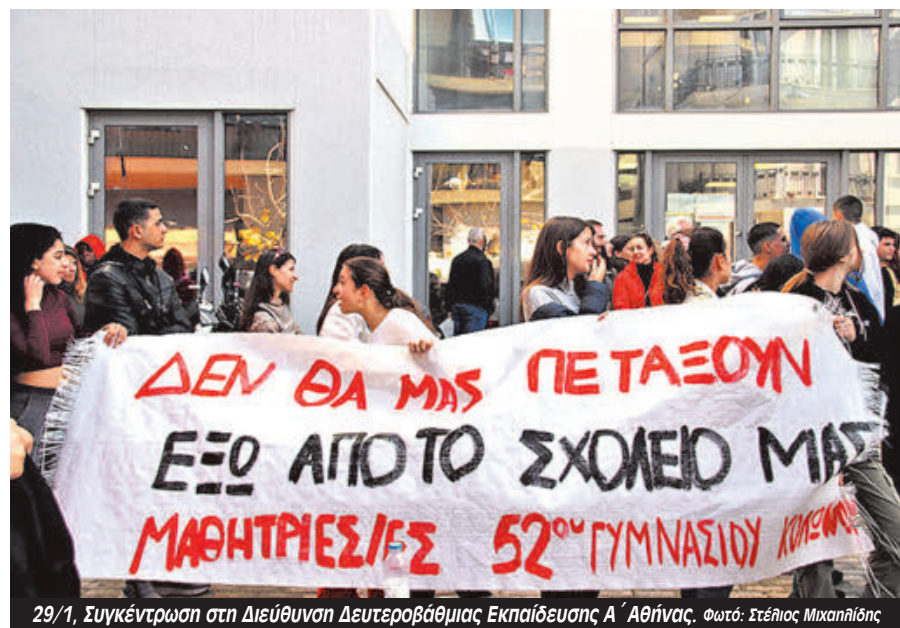
29/1, Συγκέντρωση στη Διεύθυνση Δευτεροβάθμιας Εκπαίδευσης Α' Αθήνας.

Την Παρασκευή 7/2 στις 12μ στα Προπύλαια θα πραγματοποιηθεί μεγάλο πανεκπαιδευτικό συλλαλητήριο, ενώ τις προηγούμενες ημέρες προγραμματίζονται νέες τοπικές κινητοποιήσεις. Από τη Δευτέρα 3/2 ξεκίνησε γύρος γενικών συ-