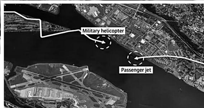
Δεξιά: Οι διαδρομές του ελικοπτέρου και του αεροσκάφους πριν τη σύγκρουση