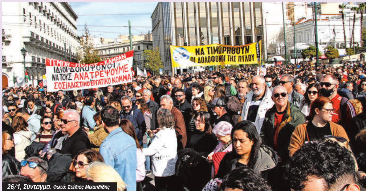
26/1, Σύνταγμα.