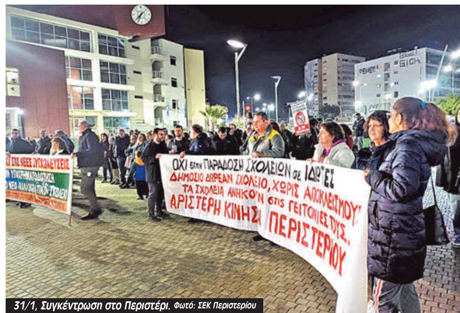
31/1, Συγκέντρωση στο Περιστέρι.

νελεύσεων στις ΕΛΜΕ εν όψει της Συνέλευσης Προέδρων των ΕΛΜΕ το Σάββατο 8/2. Το Δίκτυο Εκπαιδευτικών «Η Τάξη μας» προτείνει απεργιακή κλιμάκωση με άμεση κήρυξη 24ωρης απεργίας και νέα 48ωρη στις 27 και 28 Φλεβάρη.