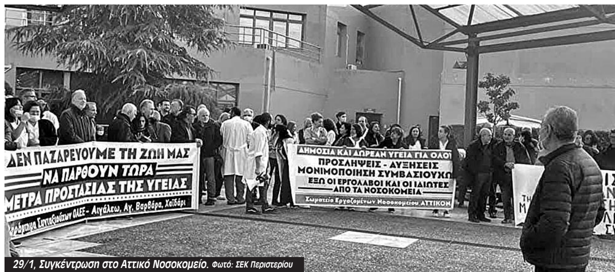
29/1, Συγκέντρωση στο Αττικό Νοσοκομείο.

Το νέο εφημεριακό καθεστώς απλά γιγαντώνει αυτό το πρόβλημα. Φτάνουμε εκεί γιατί έχει διαλυθεί η Πρωτοβάθμια Φροντίδα Υγείας, γιατί έκλεισαν νοσοκομεία στα χρόνια των μνημονίων και γιατί η υποστελέχωση έχει πιάσει ταβάνι. Αυτές είναι επικίνδυνες καταστάσεις. Όταν λέμε ότι είναι κυβέρνηση δολοφόνων είναι κυριολεκτικό. Και δεν έχουμε μεταξύ