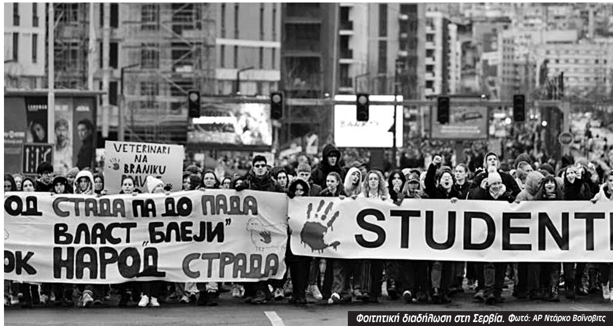
Φοιτητική διαδήλωση στη Σερβία.

Τώρα έχει βρεθεί χωρίς κυβέρνηση και σε πολιτικό αδιέξοδο αν θα σχηματίσει καινούρια ή θα πάει σε πρόωρες εκλογές με το κίνημα να συνεχίζει με μεγαλύτερη αποφασιστικότητα,