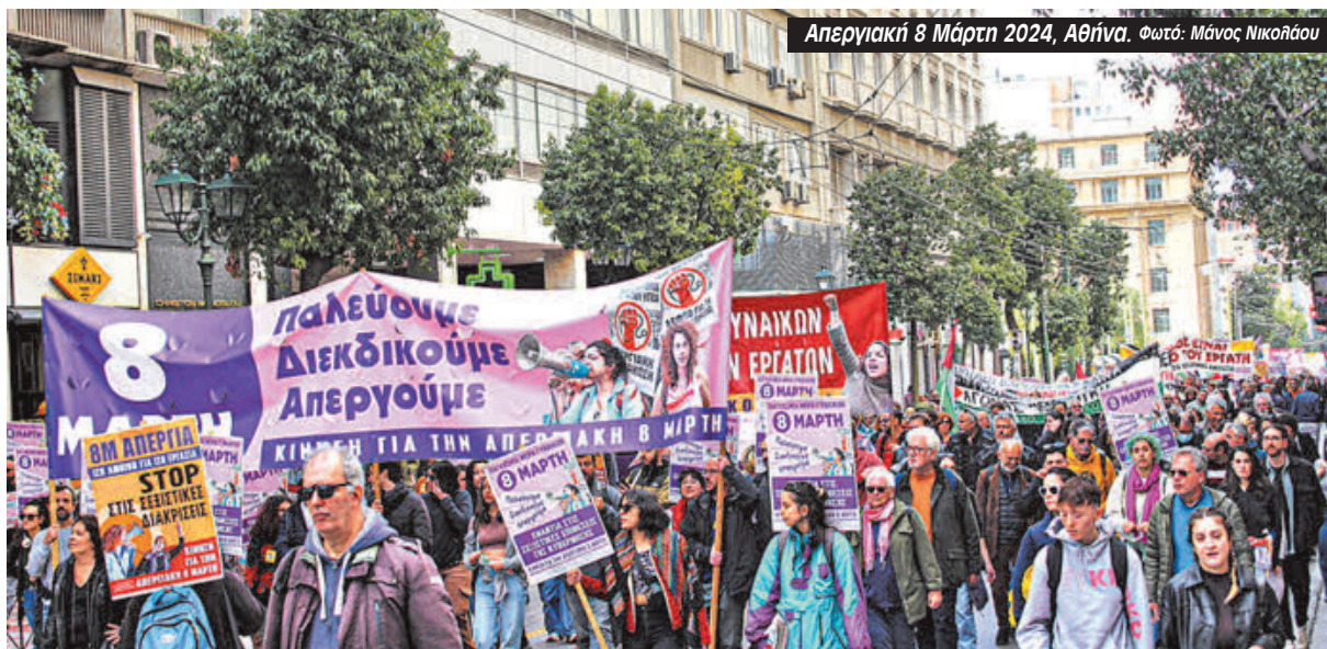
Απεργιακή 8 Μάρτη 2024, Αθήνα.

Η κυβέρνηση της Νέας Δημοκρατίας προσπαθεί συστηματικά να μας πείσει ότι η λύση για τη βία κατά των γυναικών είναι η μεγαλύτερη αστυνόμευση αλλά ματαιοπονεί. Η δολοφονία της Κυριακής Γρίβα έξω από το ΑΤ Αγίων Αναργύρων το απέδειξε αλλά το απέδειξαν και οι αποκαλύψεις του κυκλώματος της ΕΛΑΣ που πουλούσε προστασία σε οίκους ανοχής και άλλα. Πολύ περισσότερο, η εμπλοκή του «άνδρα με το κίτρινο μπλουζάκι» που τον