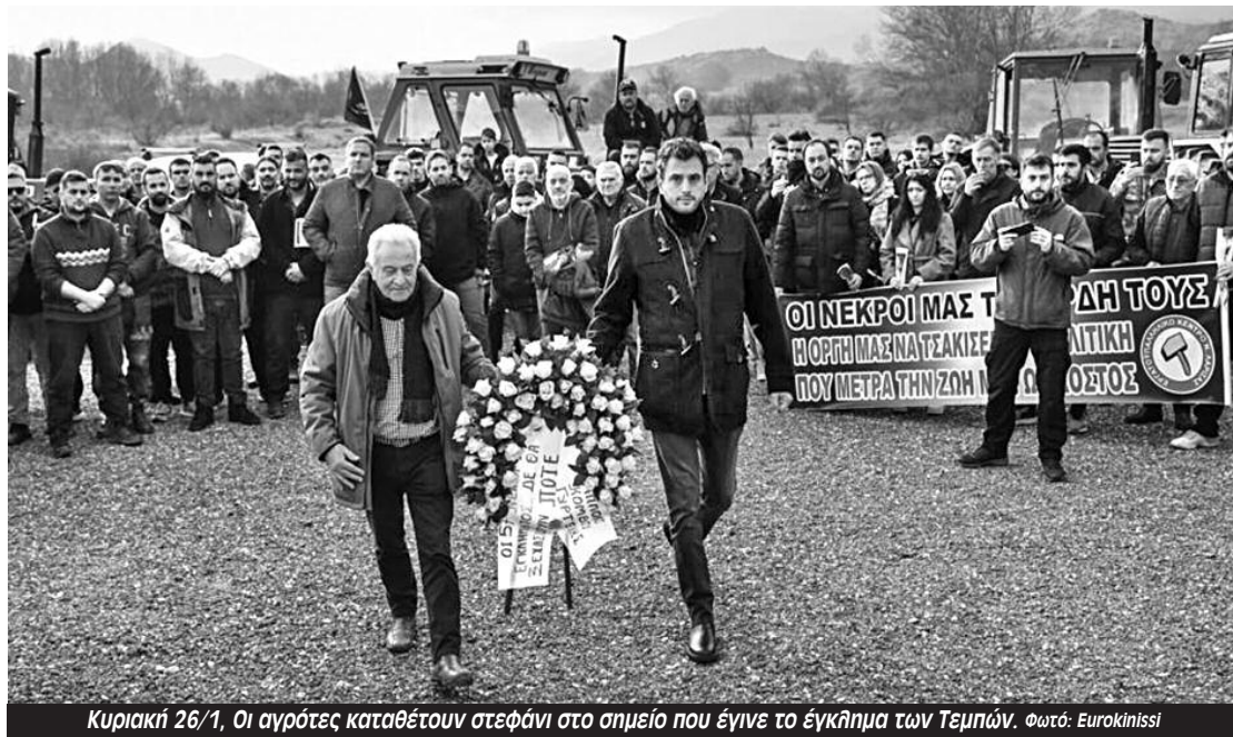
Κυριακή 26/1, Οι αγρότες καταθέτουν στεφάνι στο σημείο που έγινε το έγκλημα των Τεμπών.