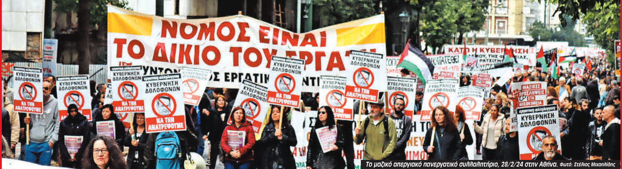
Το μαζικό απεργιακό πανεργατικό συλλαλητήριο, 28/2/24 στην Αθήνα.