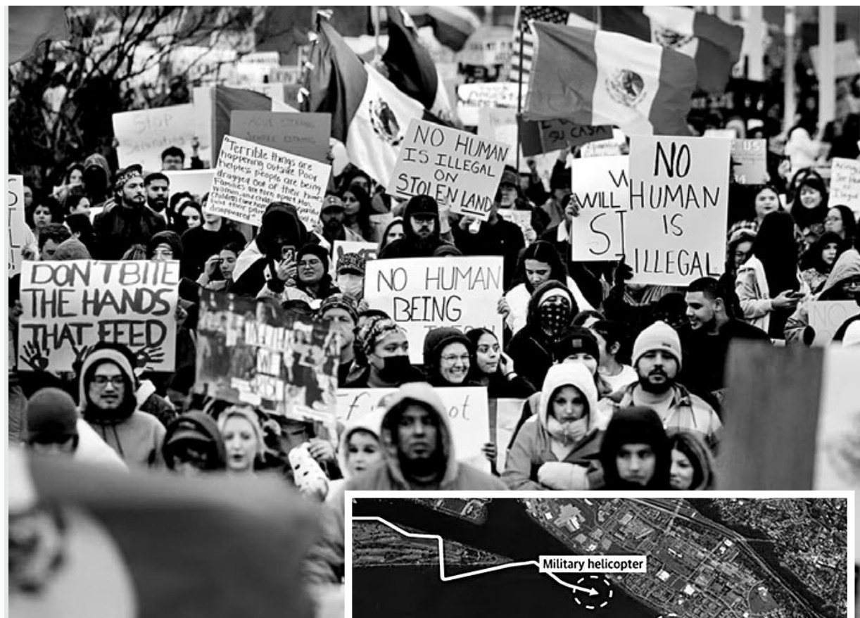
Πάνω: 26/1, Διαδήλωση στο Ντάλας ενάντια στα ρατσιστικά μέτρα του Τραμπ.

Οι απαντήσεις του στρατού μεγεθύνουν την γελοιότητα με την οποία αντιμετωπίζει το αμερικάνικο κράτος αυτήν την τραγωδία. Το ελικόπτερο επέλεξε να κάνει την εκπαιδευτική του πτήση βραδινές ώρες και μάλιστα σε μια από τις πιο πυκνές σε κυκλοφορία ώρες για το αεροδρόμιο. Πετούσε στο επιτρεπόμενο όριο ύψους ή και λίγο πάνω από αυτό. Οι υπεύθυνοι του στρατού σε όσους τους κάνουν κριτική, απαντάνε πως ο κόσμος δεν ξέρει πόσο σημαντικός είναι ο ρόλος αυτών των ελικοπτέρων στο πολιτικό κέντρο της χώρας. Συνοδεύουν υπουργούς, στελέχη των ενόπλων δυνάμεων και άλλους αξιωματούχους, εξασφαλίζουν τη “συνέχεια του κράτους”, είπαν