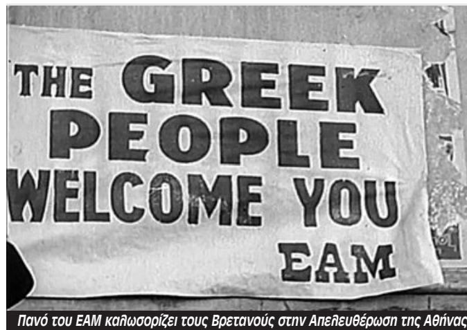
Πανό του ΕΑΜ καλωσορίζει τους Βρετανούς στην Απελευθέρωση της Αθήνας