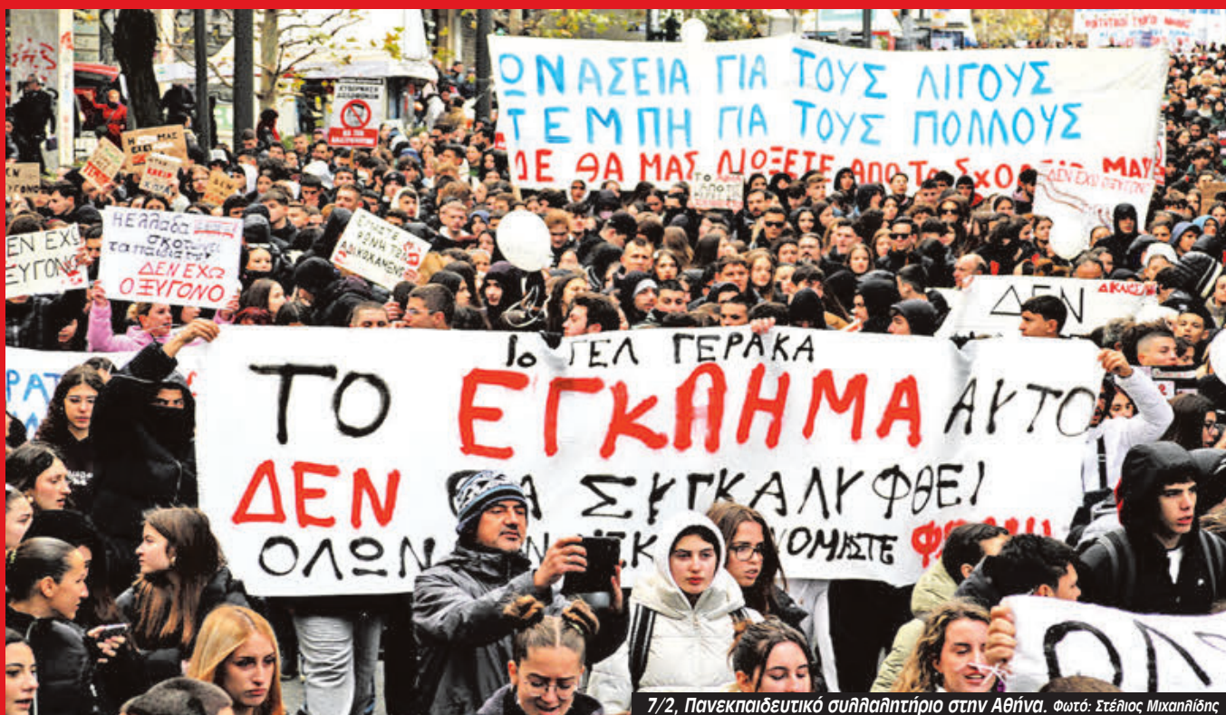
7/2, Πανεκπαιδευτικό συλλαλητήριο στην Αθήνα.