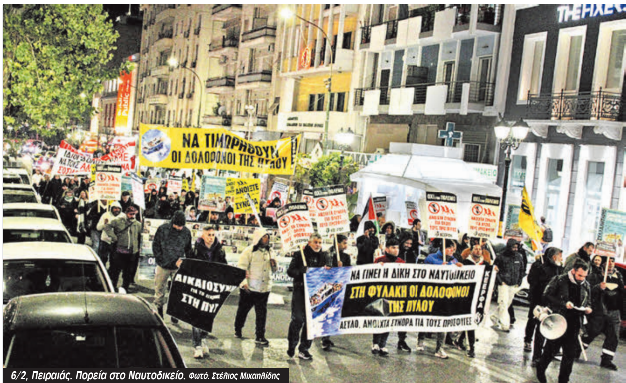
6/2, Πειραιάς. Πορεία στο Ναυτοδικείο.

Τη συγκέντρωση άνοιξαν με τα τραγούδια τους ο ΧΥΤ και ο Εμπεροαο, οι οποίοι είχαν συμμετάσχει και στη μεγάλη συναυλία αλληλεγγύης στους επιζώντες και τις οικογένειες των θυμάτων της Πύλου στις 18 Γενάρη. Με