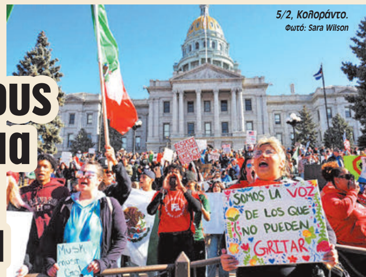
5/2, Κολοράντο.

Το κύμα αντίστασης στις ρατσιστικές και αντιμεταναστευτικές πολιτικές του Τραμπ συνεχίζεται και δυναμώνει. Όποια αμερικάνικη εφημερίδα και αν ανοίξει κανείς, από την πιο μεγάλη ως την πιο μικρή και τοπική, θα δει ρεπορτάζ από οργανωμένες διαδηλώσεις ενάντια στον Τραμπ, ενάντια στις επιθέσεις των αρχών κατά των μεταναστών, ενάντια στις απελασεις και σε αλληλεγγύη με όλο τον κόσμο που αισθάνεται την απειλή της σύλληψης και του διωγμού μέσα στο ίδιο του το σπίτι και στη δουλειά του.