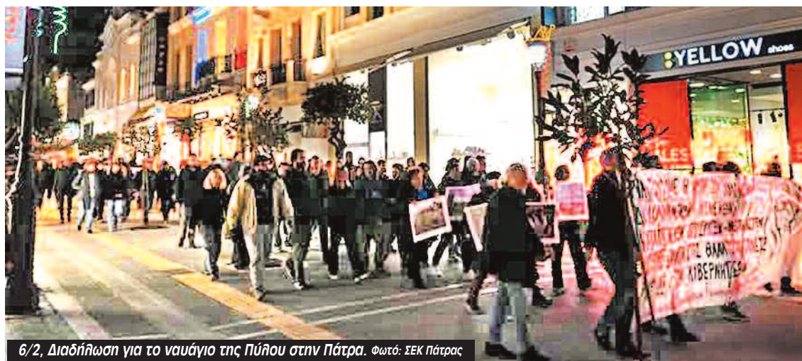
6/2, Διαδήλωση για το ναυάγιο της Πύλου στην Πάτρα.