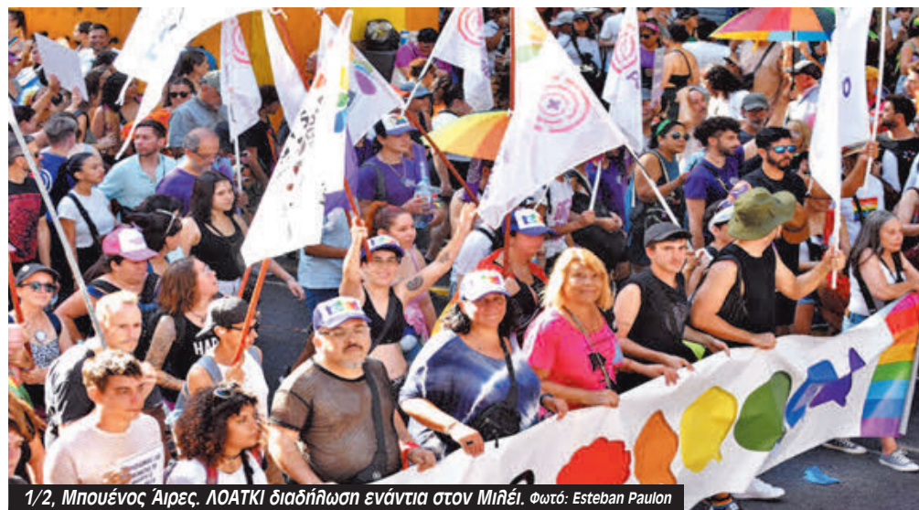
1/2, Μπουένος Άιρες. ΛΟΑΤΚΙ διαδήλωση ενάντια στον Μιλέι.