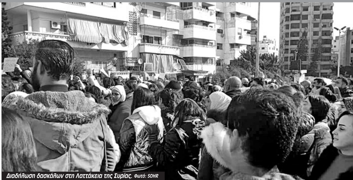
Διαδήλωση δασκάλων στη Λαττάκεια της Συρίας.

Καλούμε όλους τους υπαλλήλους και τους εργαζόμενους του δημόσιου και ιδιωτικού τομέα να οργανωθούν και να επιλέξουν τους εκπροσώπους τους στα συντονιστικά για την επίτευξη των ακόλουθων στόχων: Ακύρωση όλων των αποφάσεων της υπηρεσιακής κυβέρνησης που αφορούν απολύσεις, διαθεσιμότητες, μη ανανέωση συμβάσεων ή αναγκαστικές άδειες με οποιοδήποτε όνομα και με οποιοδήποτε πρόσχημα... Αύξηση των μισθών και των συντάξεων ίση με το ελάχιστο αξιοπρεπές επίπεδο διαβίωσης... Ανατροπή των ιδιωτικοποιήσεων... Η συνδικαλιστική οργάνωση ανήκει στους εργαζόμενους και αυτοί έχουν το δικαίωμα να αποφασίσουν για την τύχη της με νέες εκλογές χωρίς κηδεμονία...».