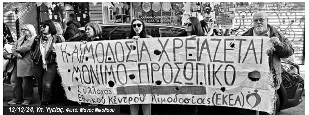
12/12/24, Υπ. Υγείας.

Η σταγόνα που ξεχείλισε το ποτήρι είναι ότι