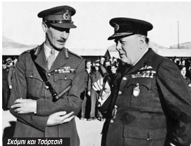
Σκόμπι και Τσόρτσι

Όλες οι υποσχέσεις της Συμφωνίας για ελεύ-