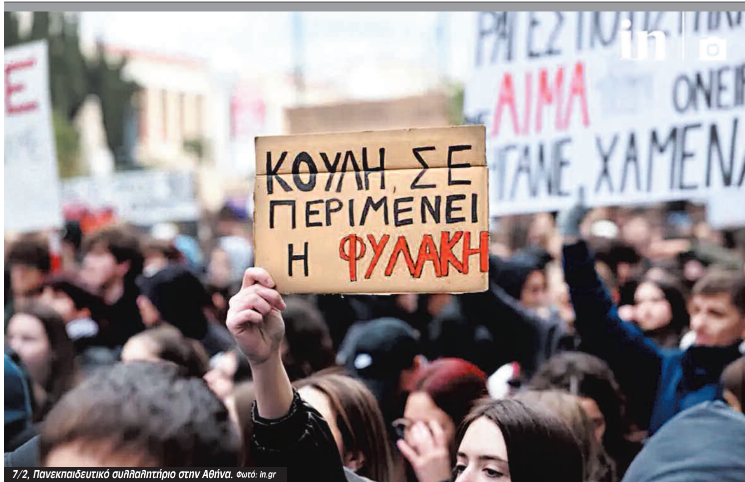
7/2, Πανεκπαιδευτικό συλλαλητήριο στην Αθήνα.