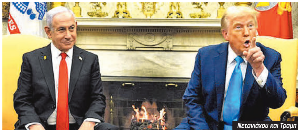
Νετανιάχου και Τραμπ

λώντας ανοιχτά με εθνικάθαρση την Γάζα και προσάρτηση τη Δυτική Όχθη. Αδιαφορώντας πλήρως για το «Διεθνές Δίκαιο» που ποτέ δεν ήταν δίκαιο, χωρίς καν να χρησιμοποιεί προφάσεις περί «τρομοκρατίας». Αδιαφορώντας για την στάση των ευρωπαϊών συμμάχων του και της ΕΕ που όλοι ανεξαιρέτως δήλωσαν την αντίθεσή τους σε ένα τέτοιο προσανατολισμό. Και απειλώντας τα συμμαχικά στις ΗΠΑ αραβικά κράτη με κόψιμο της χρηματοδότησης αν δεν αποδεχτούν τα σχέδιά του - ακυρώνοντας την ίδια τη δικιά του πολιτική που προσέβλεπε την εδραίωση του Ισραήλ μέσα από τις Συμφωνίες του Αβραάμ.