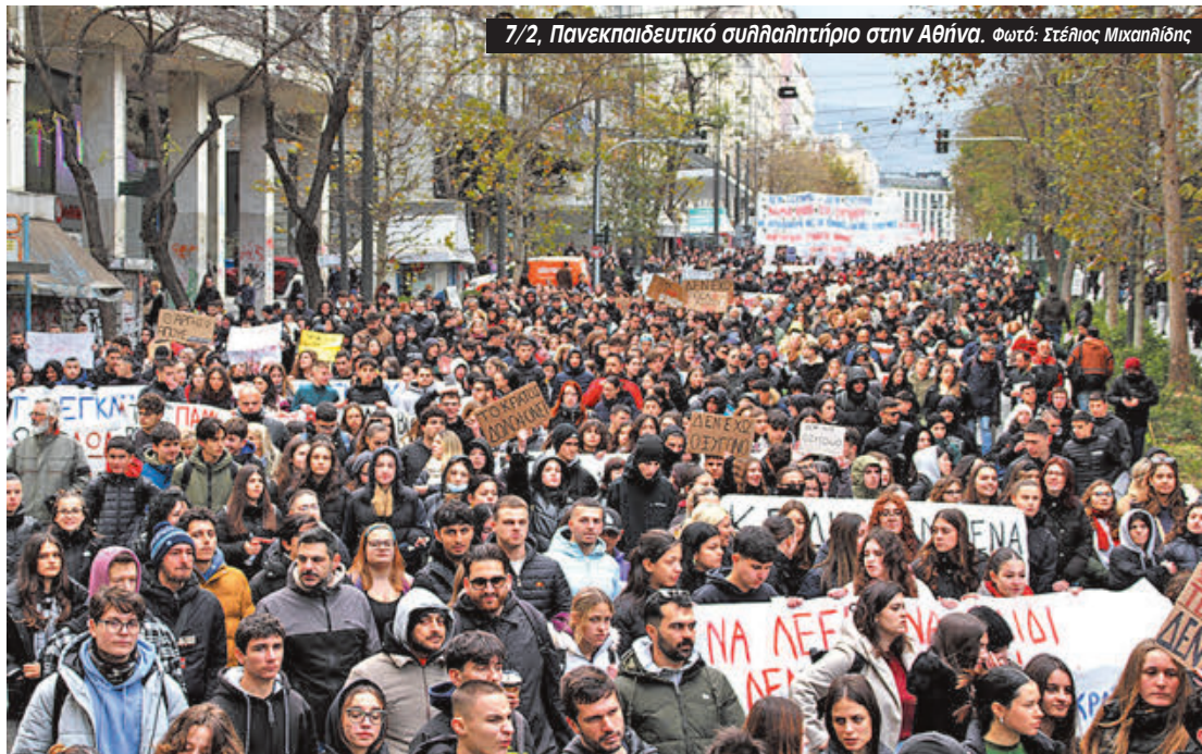
7/2, Πανεκπαιδευτικό συλλαλητήριο στην Αθήνα.

Το δημοτικό σχήμα “Ανταρσία στην Κοκκινιά της προσφυγιάς και της αντίστασης” απαιτεί από τη Δημοτική Αρχή «να πιστώσει άμεσα σε όλες τις σχολικές μονάδες το προβλεπόμενο ποσό και να προχωρήσει άμεσα στις απαραίτητες προμήθειες στέλλοντας στα σχολεία τα αναγκαία υλικά για την λειτουργία τους, χωρίς περικοπές. Από την κυβέρνηση γενναία αύξηση της χρηματοδότησης για την Παιδεία από τον κρατικό προϋπολογισμό, επανασύσταση των Σχολικών Επιτροπών και λειτουργία τους σύμφωνα με τις προτάσεις των εκπαιδευτικών Ομοσπονδιών. Έξω οι χορηγοί από τα σχολεία μας, δημόσιο σχολείο για όλα τα παιδιά, ΟΧΙ στα Ωνάσεια Σχολεία για λίγους και εκλεχτούς. Με απεργίες, καταλήψεις και τοπικούς συντονισμούς όλων των φορέων της εκπαίδευσης μπορούμε να σταματήσουμε την υποχρηματοδότηση των σχολείων και όλα τα σχέδια ιδιωτικοποίησης τους».