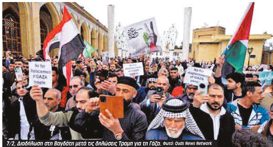
7/2, Διαδήλωση στη Βαγδάτη μετά τις δηλώσεις Τραμπ για τη Γάζα.

Συμμαχία Σταματήστε τον Πόλεμο-Αλληλεγγύη στην Παλαιστίνη