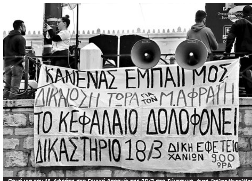
Πανό για τον Μ. Αφράτη στη Γενική Απεργία της 28/2 στο Σύνταγμα.