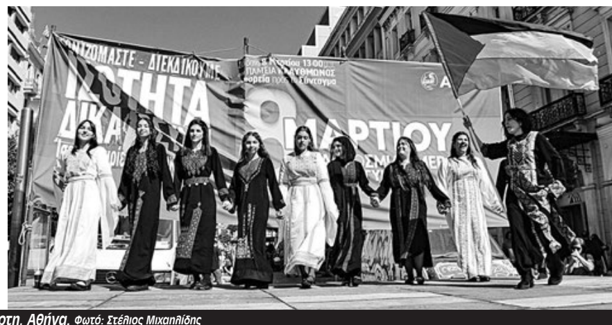
Απεργιακή 8 Μάρτη, Αθήνα.