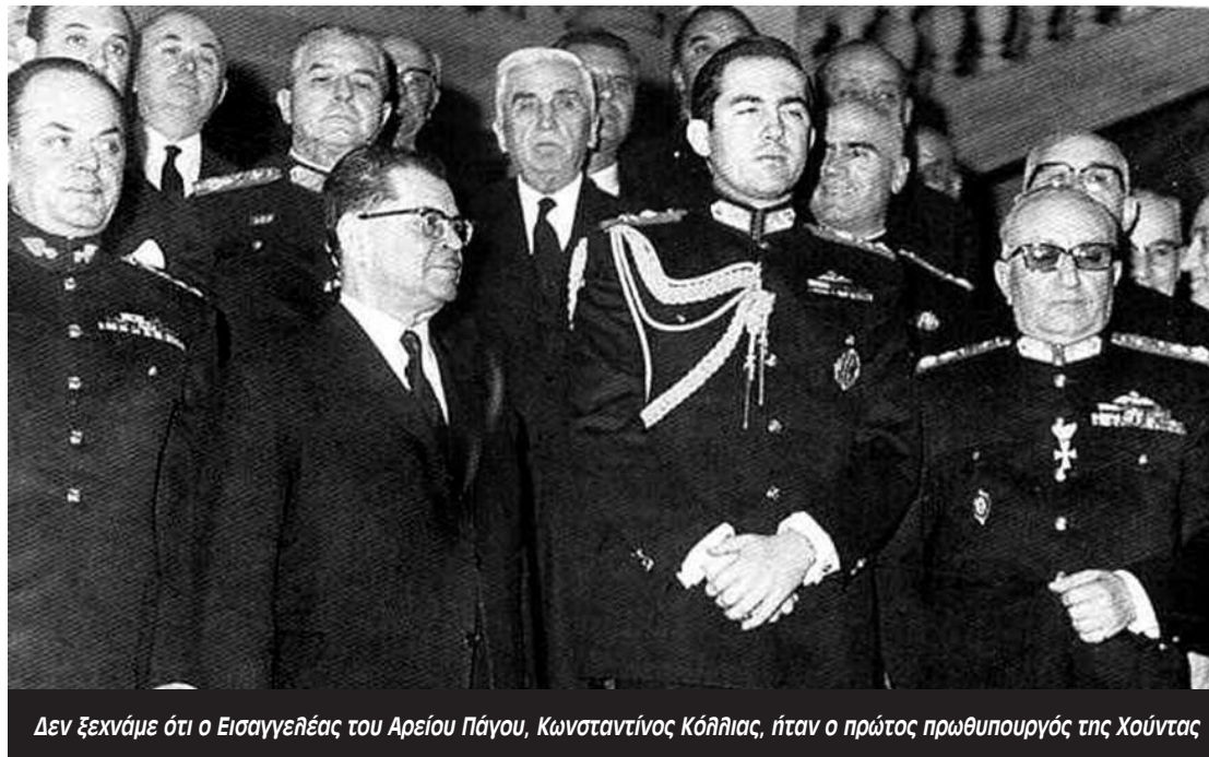
Δεν ξεχνάμε ότι ο Εισαγγελέας του Αρείου Πάγου, Κωνσταντίνος Κόλλιας, ήταν ο πρώτος πρωθυπουργός της Χούντας

Η συζήτηση για την Δικαιοσύνη έχει ανοίξει για τα καλά. Όπως σημειώνει ο Κώστας Παπαδάκης, σε πρόσφατο άρθρο του, που αναπαράχθηκε σε πολλές ιστοσελίδες, «δεν πρόκειται για "Δικαιοσύνη", αλλά για "Δικαστική εξουσία". Αυτήν τη "δικαιοσύνη" δεν την εμπιστεύονται ούτε καν αυτοί που μας καλούν να την εμπιστευτούμε... Το άρθρο 86 του Συντάγματος είναι εκείνο το οποίο απαγορεύει στους Εισαγγελείς της χώρας την άσκηση οποιασδήποτε ποινικής δίωξης εναντίον όσων διατελούν ή διετέλεσαν μέλη της κυβέρνησης για ποινικά αδικήματα που τέλεσαν κατά την άσκηση των καθηκόντων τους. Απαγορεύεται όχι μόνο δίωξη, αλλά ακόμα και προανάκριση ή προκαταρκτική εξέταση κατά των προσώπων αυτών χωρίς προηγούμενη απόφαση της Βουλής. Όταν λοιπόν η κυβερνητική εξουσία... δεν έχει καμία εμπιστοσύνη στην Δικαιοσύνη, τότε ποια εμπιστοσύνη να έχει ο κόσμος;... Στην περίπτωση του ναυαγίου της Πύλου, ο κυβερνητικός εκπρόσωπος "στόλισε" ανάλογα τον «Συνήγορο του Πολίτη» επειδή πρόσφατα με πόρισμά του ανέδειξε τις έως τώρα ανεπάρκειες της προκαταρκτικής εξέτασης. Ήταν ένα σπουδαίο δείγμα... σεβασμού των συνταγματικά θεσπισμένων Ανεξάρτητων Αρχών. Ίδια αντιμετώπιση είχε και η Α.Δ.Α.Ε. στο σκάνδαλο των υποκλοπών... η Δικαστική Εξουσία λειτουργεί χωρίς δημοκρατική λογοδοσία, εξυπηρετεί τα συμφέροντα των ισχυρών, επιβάλλει και εφαρμόζει νόμους που ωφελούν την αστική τάξη