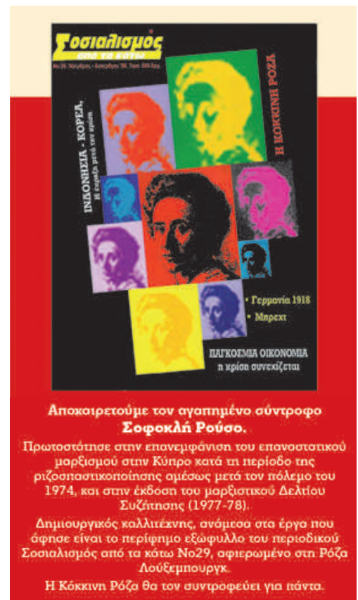
Το τεύχος αυτό είναι αφιερωμένο στον σ. Σοφοκλή Ρούσο που χάσαμε πρόσφατα