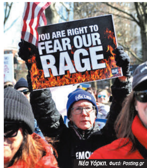
Νέα Υόρκη.

δεαν των αγώνα των γυναικών για απελευθέρωση και ίσα δικαιώματα με την αλληλεγγυή στις γυναίκες προσφύγισες, την Παλαιστίνη και το Σουδάν, την μάχη ενάντια στις άνισες πληρωμές με τη βία κατά των γυναικών, καθώς και την πάλη ενάντια στην ακροδεξιά. Στη διαδήλωση κυμάτιζαν Παλαιστινιακές σημαίες μαζί με φεμινιστικές και LGBTQ+, σημαίες και πανό συνδικάτων όπως η FNV (ΓΣΕΕ) μαζί με τα μπλοκ αριστερών οργανώσεων. Εκατοντάδες κόσμος διαδήλωσε με αυτοσχέδια πλακάτ που έγραφαν αντικαπιταλιστικά και φεμινιστικά συνθήματα. Αυτή η επιτυχία της 8ης Μάρτη έδωσε αυτοπεποίθηση στον κόσμο που παλεύει τις επιθέσεις της ακροδεξιής συγκυβέρνησης».