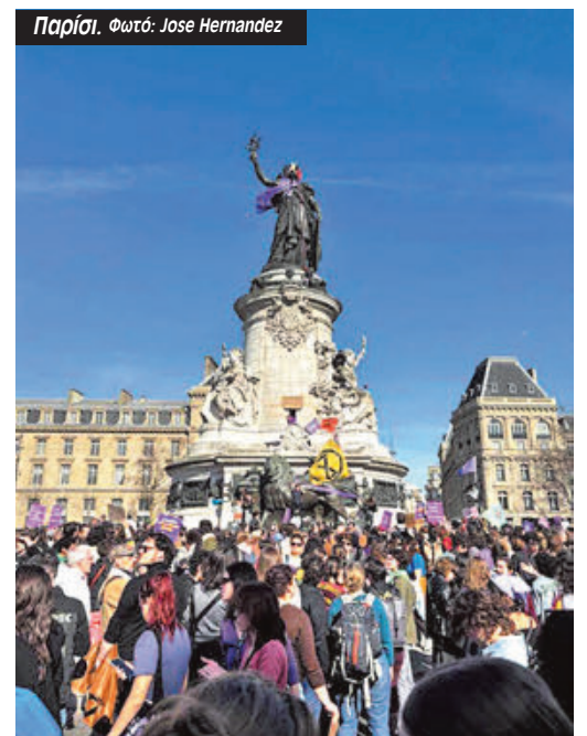
Παρίσι.