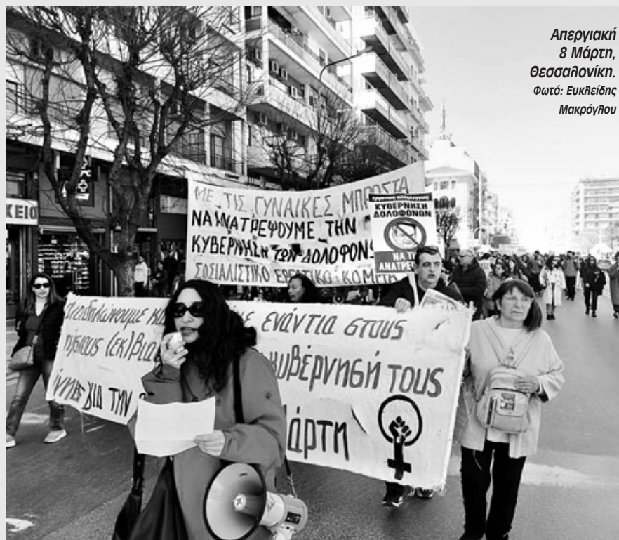
Απεργιακή 8 Μάρτη, Θεσσαλονίκη.

Στα Χανιά πραγματοποιήθηκαν συγκέντρωση και πορεία στην οποία συμμετείχαν η Κίνηση για την Απεργιακή 8 Μάρτη, ο Ενιαίος Φοιτητικός Σύλλογος Πολυτεχνείου Κρήτης, η ΕΛΜΕ, ο ΣΕΠΕ Χανίων, το Σωματείο Μισθωτών Τεχνικών παράρτημα Χανίων, οργανώσεις της αριστεράς, καταλήψεις και συλλογικότητες. Το μουσικό σχήμα Γαρ Αμάν συνόδεψε μουσικά τη συγκέντρωση. Η Κίνηση για την Απεργιακή 8 Μάρτη, συμμετείχε στη διαδήλωση τονίζοντας πως η απελευθέρωση των γυναικών είναι υπόθεση όλων των εργατών και δίνοντας τον τόνο για συνέχεια και κλιμάκωση με επόμενο σταθμό τη διεθνή μέρα ενάντια στον φασισμό και τον ρατσισμό στις 22 Μάρτη.