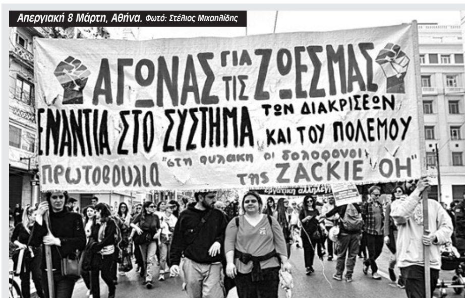
Απεργιακή 8 Μάρτη, Αθήνα.

Η "Πρωτοβουλία να μπουν στη φυλακή οι δολοφόνοι της Zackie Oh" καλεί στις 17/3 σε ημέρα κινητοποίησης στο Εφετείο όπου εκδικάζεται η αίτηση για την αναστολή που ζητάνε οι δολοφόνοι του Ζακ