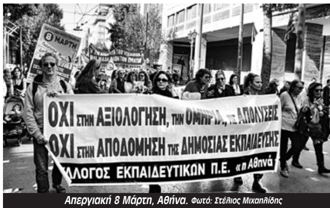
Απεργιακή 8 Μάρτη, Αθήνα.