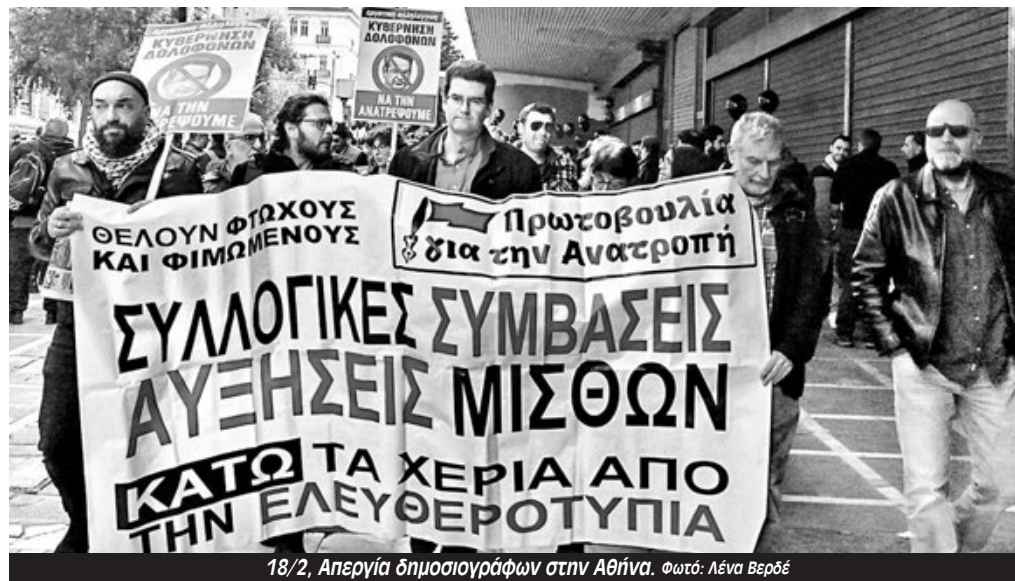
18/2, Απεργία δημοσιογράφων στην Αθήνα.

Σε ανακοίνωσή της η Πρωτοβουλία για την Ανατροπή στα ΜΜΕ τονίζει ότι «από την πρώτη στιγμή δίνει τη μάχη για την επιτυχία της απεργίας και διεκδικεί την κλιμάκωση του αγώνα για την υπογραφή ενιαίας ΣΣΕ για όλα τα ΜΜΕ, με αυξήσεις στους μισθούς/συντάξεις που θα αν-