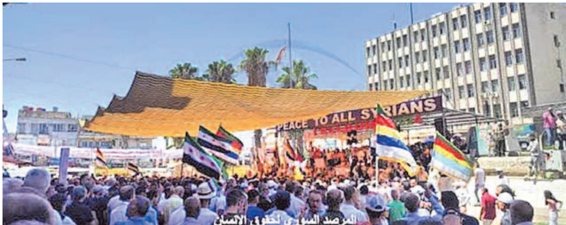
Διαμαρτυρία στην πόλη Αλ Σουείντα με αίτημα να σταματήσουν οι σφαγές των αμάχων και με σύνθημα “η επανάσταση έγινε για μια καλύτερη ζωή, όχι για εκδίκηση”.

Το πρωί της Παρασκευής 7/3 αποκαλύφθηκαν οι μεγαλύτερες οργανωμένες σχεταριστικές σφαγές από την πτώση του τυραννικού καθεστώτος του Άσαντ. Το SOHR σημείωσε ότι την Παρασκευή 7/3 κοινές δυνάμεις των υπουργείων Άμυνας και Εσωτερικών πραγματοποιήσαν ευρεία εκστρατεία “ασφαλείας” σε δεκάδες χωριά και σε προάστια της Λατάκειας, της Ταρτούς και της Χάμα, με τυχαίες επιδρομές σε σπίτια και πυροβολισμούς εναντίον των κατοίκων. Κατά τη διάρκεια της επιχείρησης πραγματοποιήθηκαν εκτεταμένες εκτελέσεις νεαρών ανδρών και γυναικών ηλικίας 18 ετών και άνω. Η επιχείρηση καταστολής οδήγησε σε διαδηλώσεις στην Ταρτούς,