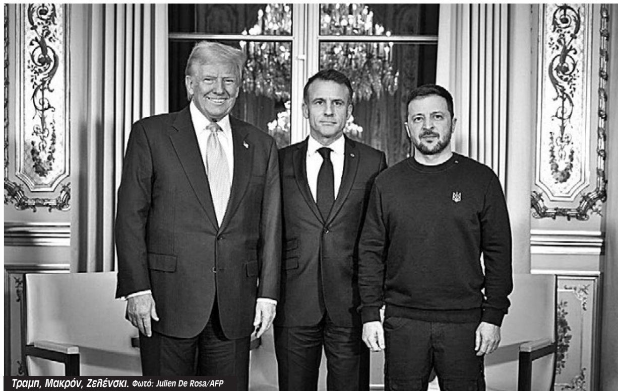
Τραμπ, Μακρόν, Ζελένσκι.

Όλα αυτά έχουν άμεσες επιπτώσεις στο ίδιο το μέτωπο. Η Ρωσία έχει ανακαταλάβει το μεγαλύτερο τμήμα από το Κουρσκ, τη ρωσική επαρχία που είχε καταλάβει πέρσι ο Ουκρανικός στρατός. Οι λιγοστές ουκρανικές δυνάμεις που έχουν παραμείνει στην πόλη Σούντζα κινδύ-