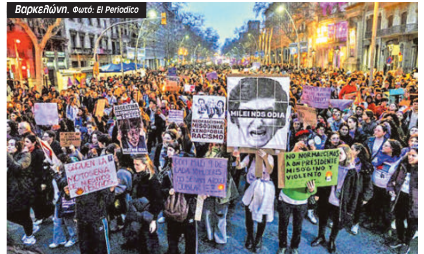
Βαρκελώνη.