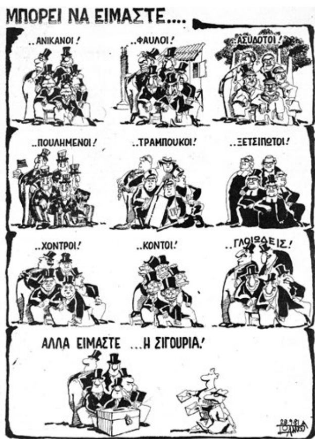
Σκίτσο του Γιάννη Ιωάννου από το 1981

Το 1981 ο αξεπέραστος Γιάννης Ιωάννου δημοσίευσε μια γελοιογραφία στην οποία οι υπουργοί της ΝΔ λέγανε με τη σειρά: «μπορεί να είμαστε...άνικανοι...φαύλοι...τραμπούκοι...ξετσίπωτοι...γλωιώδεις... Αλλά είμαστε η σιγουριά!». Αυτή τη γελοιογραφία θυμίζει σήμερα η κυβέρνηση της ΝΔ, με τη διαφορά ότι η καταστροφή και ο θάνατος που σπέρνει η