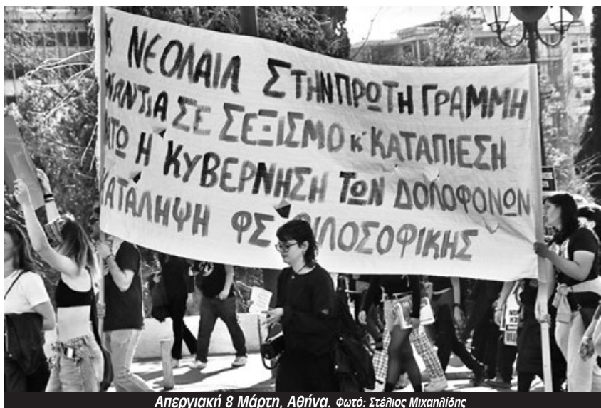
Απεργιακή 8 Μάρτη, Αθήνα.