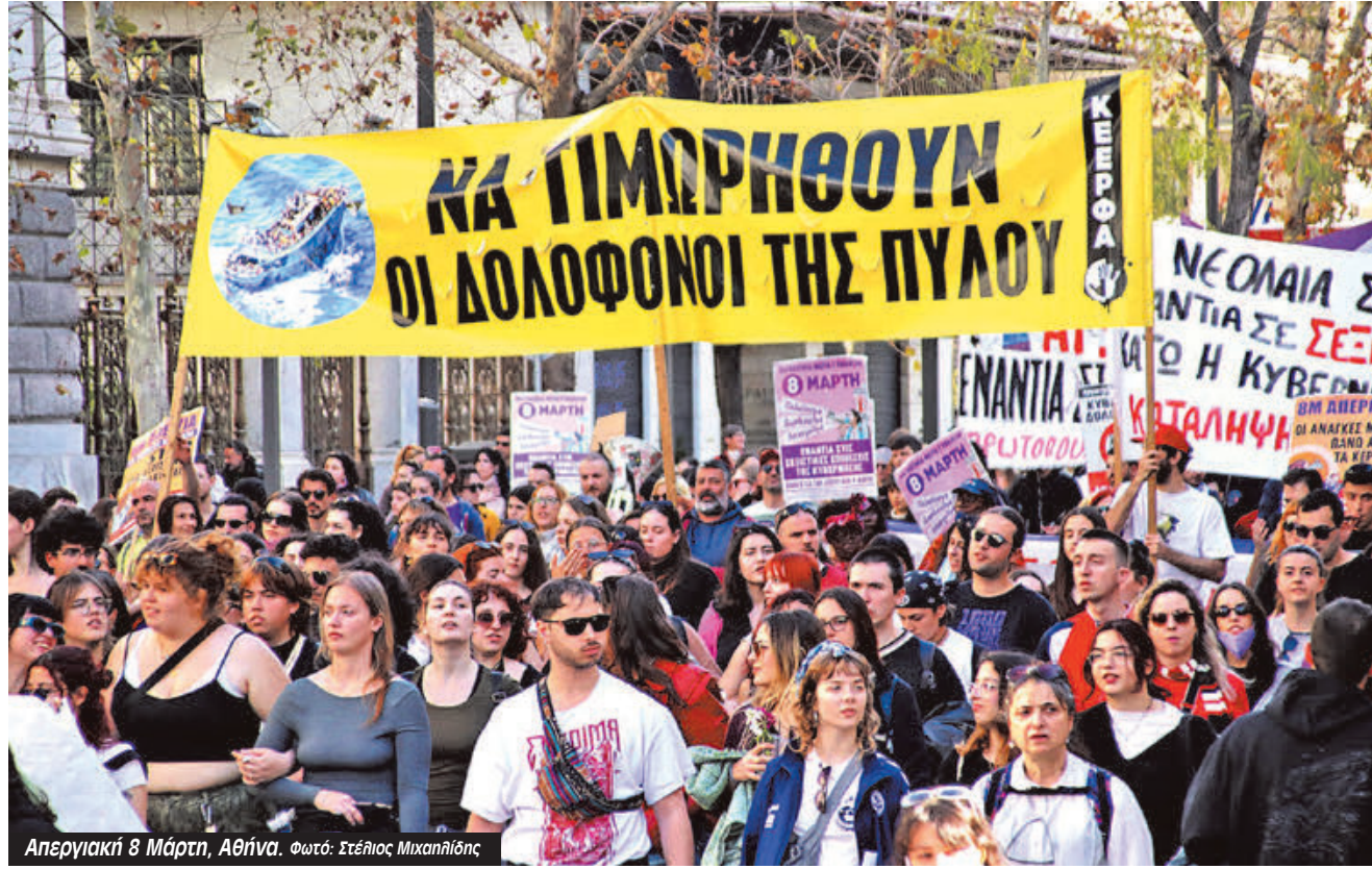
Απεργιακή 8 Μάρτη, Αθήνα.

Η παράλειψη των καταγραφών, η αγνόηση των αναφορών του εμπορικού πλοίου πριν αποδεσμευτεί για ακινητοποιήσεις και κλυδωνισμούς του αλιευτικού, η ύπαρξη βίντεο με το κλυδωνιζόμενο σκάφος στα χέρια τους, η επιμονή στην φάση «αβεβαιότητας» και της «παρακολούθησης» συνεχίζονται, αυξάνοντας τις πιθανότητες απώλειας του Αντριάνα όσο αυξάνεται το χρονικό διάστημα που αυτό παραμένει εκτεθειμένο σε κινδύνους. Κάτι που συμβαίνει στις 2.06πμ της 14ης Ιούνη 2023.