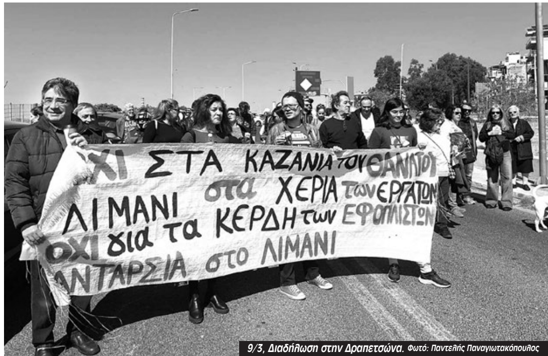
9/3, Διαδήλωση στην Δραπετσώνα.

σμάτων. Η δύναμη μας είναι μεγαλύτερη από την δίκη τους. Ο συντονισμός όλων των εργατικών σωματείων, των εργαζομένων στο λιμάνι, στο δήμο, στην εκπαίδευση παντού μαζί με