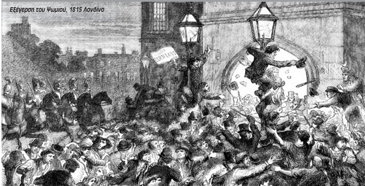
Εξέγερση του Ψωμιού, 1815 Λονδίνο