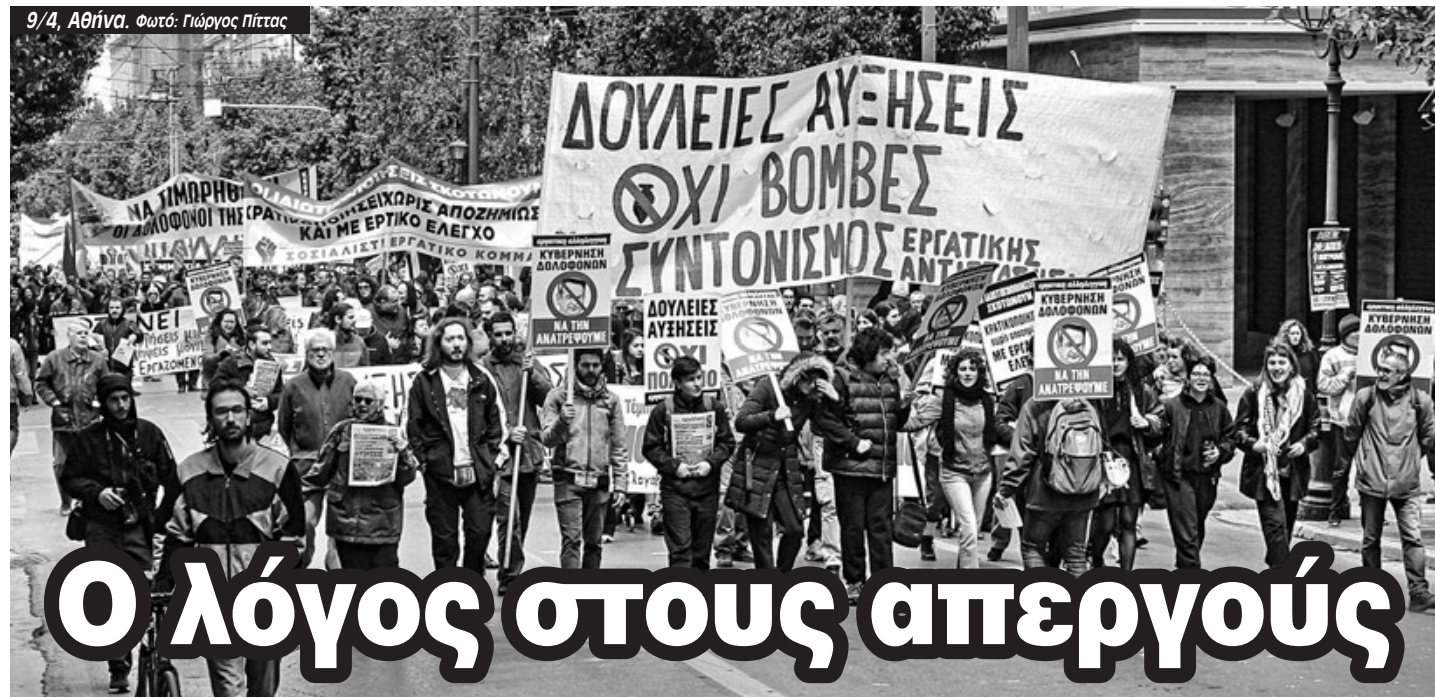
9/4, Αθήνα.