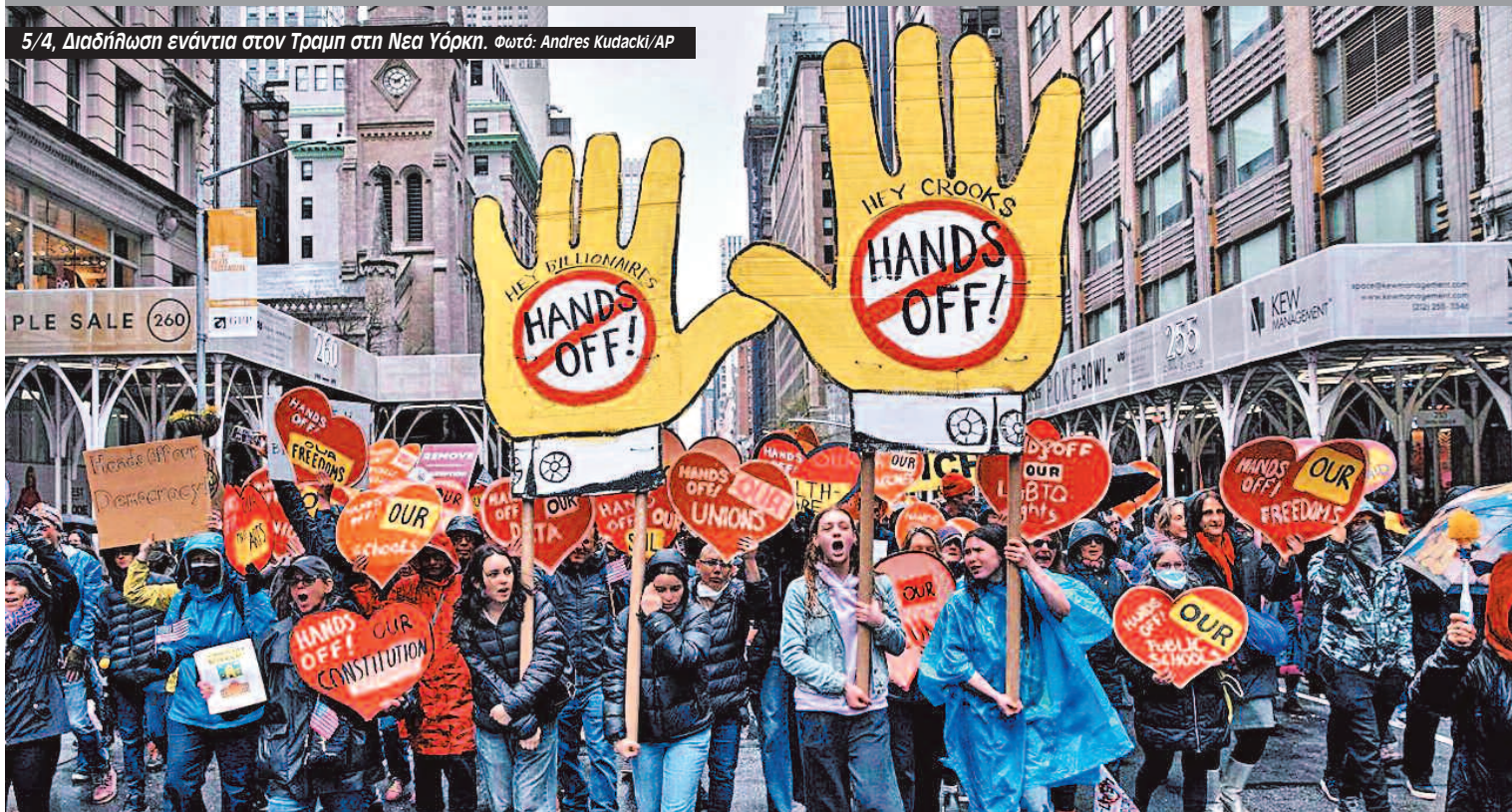
5/4, Διαδήλωση ενάντια στον Τραμπ στη Νέα Υόρκη.