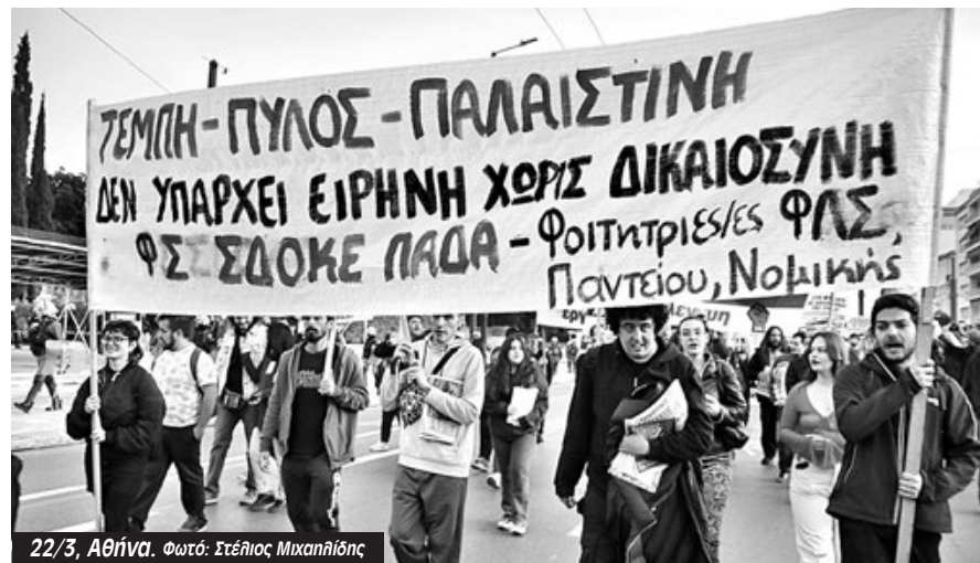
22/3, Αθήνα.

Τα ΕΑΑΚ πρέπει να μπουν με την πρόταση των συνελεύσεων και καταλήψεων. Δεν περιμένουμε τον Σεπτέμβρη. Όποια κυβέρνηση τόλμησε να περάσει τέτοιο νόμο, τσακίστηκε από το φοιτητικό κίνημα με τις καταλήψεις του, το '79, '90-91, '06-07. Έτσι μπορούμε και σήμερα να τους αποτελειώσουμε. Μαζί αναδεικνύουμε όλο το φάσμα των ανατροπών που διεκδικούμε. Το αίτημα της κρατικοποίησης, χωρίς αποζημίωση και με εργατικό έλεγχο, που πεισματικά αρνείται να θέσει το ΚΚΕ και η υπόλοιπη κοινοβουλευτική αριστερά, είναι κομβι-