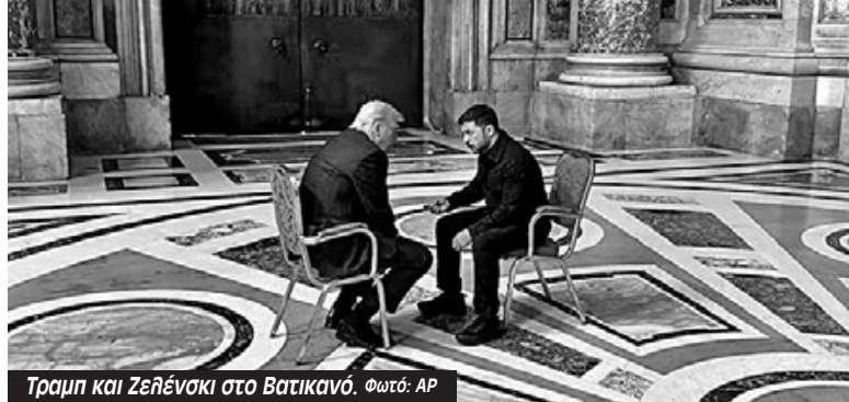
Τραμπ και Ζελένσκι στο Βατικανό.

Το βράδυ της περασμένης Τετάρτης 30 Απριλίου, οι ΗΠΑ και η Ουκρανία υπέγραψαν την πολυσυζητημένη συμφωνία για τις «σπάνιες γαίες». Το τι ακριβώς συμφώνησαν είναι ακόμα ασαφές. Δυο μόλις ημέρες πριν την τελική υπογραφή τα διεθνή ειδησεογραφικά πρακτορεία χαρακτήριζαν «θρίλερ» τις συνομιλίες –δίνοντας το καθενα από αυτά και μια διαφορετική εικόνα για τα σημεία της διαφωνίας.