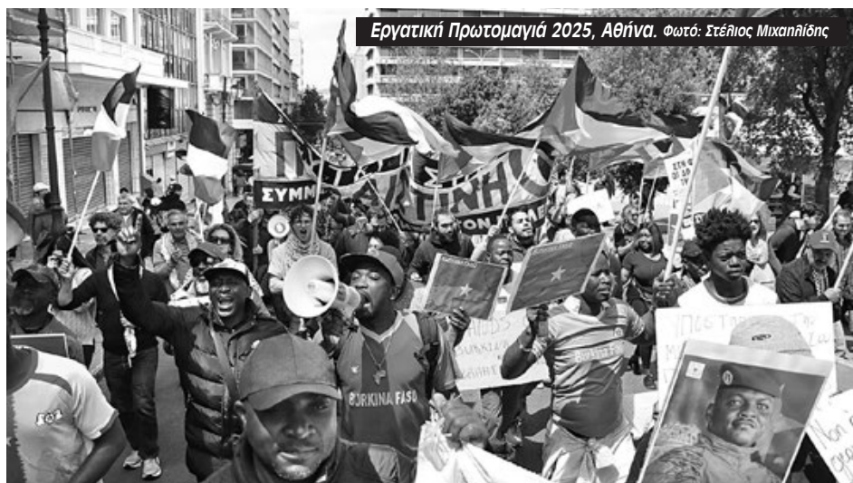
Εργατική Πρωτομαγιά 2025, Αθήνα.

Ξεχώρισε το δυναμικό μπλοκ των μεταναστευτικών κοινοτήτων από την Αφρική που διαδήλωσαν μαζί με