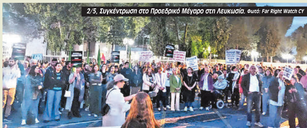
2/5, Συγκέντρωση στο Προεδρικό Μέγαρο στη Λευκωσία.

Όπως αναφέρεται στο ψήφισμα που υπογράφουν οι 12 οργανώσεις και εγκρίθηκε από τη συγκέντρωση έξω από το Προεδρικό: