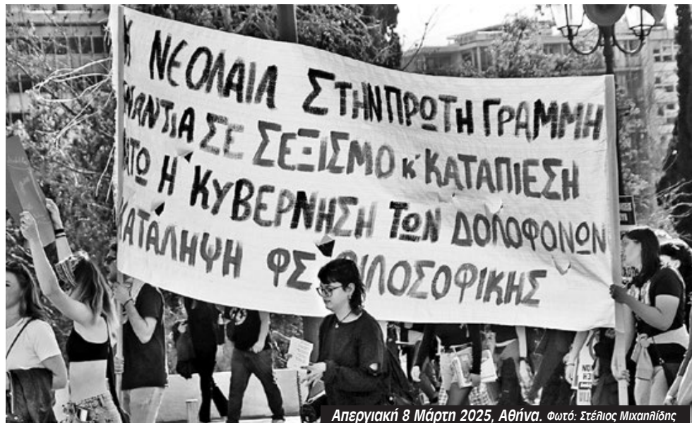
Απεργιακή 8 Μάρτ 2025, Αθήνα.

εκλογικά σε κοινή καταγραφή από τη στιγμή κιόλας που οι δυνάμεις της αντικαπιταλιστικής αριστεράς των σχολών στις περσινές εκλογές, παρόλα τα ξεχωριστά κατεβάσματα, αθροιστικά ήταν τρίτη δύναμη. Παράλληλα όμως, η παράδοση των ΕΑΑΚ ως ένας διακριτός αντικαπιταλιστικός πόλος μέσα στα πανεπιστήμια χρειάζεται να διατηρήθει και να συνεχιστεί. Είναι δεξιά στροφή το κλείσιμο των αγώνων και να προκρίνονται κοινοβουλευτικές συνεργασίες και λαϊκά μέτωπα. Χρειάζεται να βλέπουμε τον κόσμο σαν υποκείμενα ανατροπής και όχι σαν απλούς ψηφοφόρους. Και χρειάζονται συνδικαλιστικές και πολιτικές πρωτοβουλίες για τις μάχες του επόμενου διαστήματος. Το ζήτημα των διαγραφών έχει μείνει ακόμα ανοιχτό στις σχολές μας και χρειάζεται να τα σαρώσουμε όλα. Με κατεύθυνση ότι δεν υπάρχει περίπτωση να διαγραφεί κανένας φοιτητής, με την ανάλυση ότι οι διαγραφές αποτελούν επίθεση στα παιδιά της εργατικής τάξης, σε μία περίοδο που η κυβέρνηση έχει λεφτά να δώσει για πολεμικούς εξοπλισμούς αλλά δεν έχει για τα πανεπιστήμια. Το ζήτημα της πανεπιστημιακής αστυνομίας το οποίο επανέρχεται ξανά στη συζήτηση από τον Χρυσοχοϊδη είναι μια προσπάθεια να χτυπηθεί η αριστερά μέσα στα