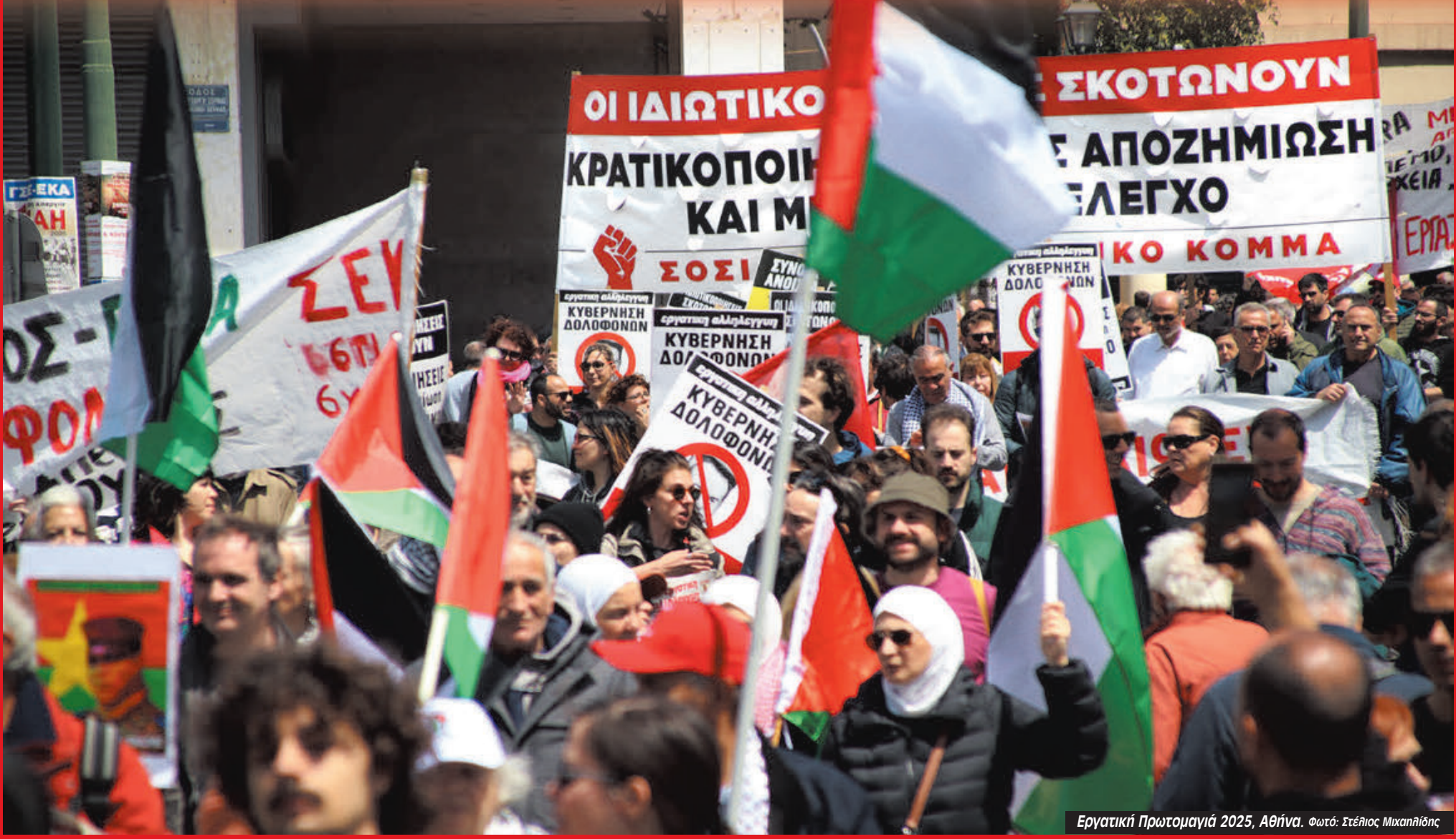
Εργατική Πρωτομαγιά 2025, Αθήνα.