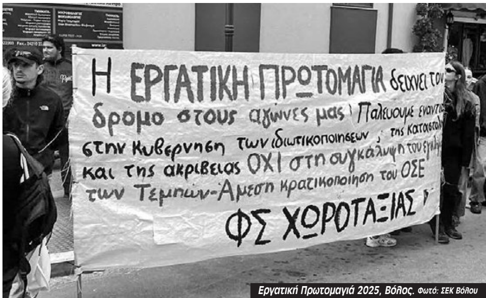
Εργατική Πρωτομαγιά 2025, Βόλος.