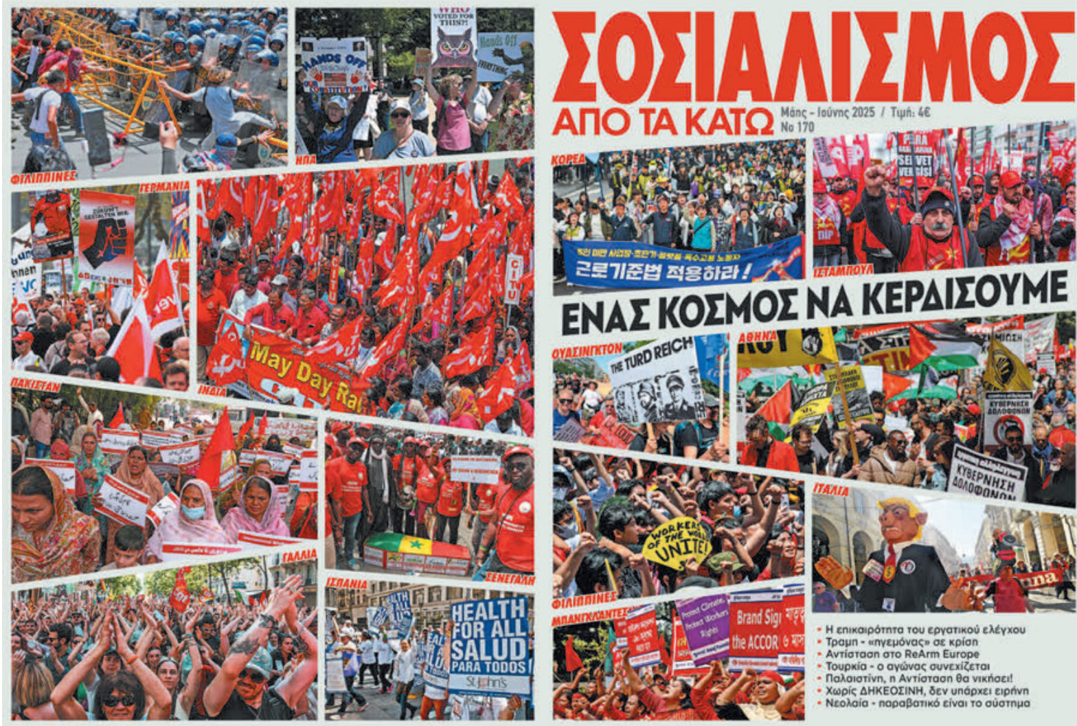
Κυκλοφορεί τις επόμενες μέρες νέο τεύχος του περιοδικού "Σοσιαλισμός από τα Κάτω"