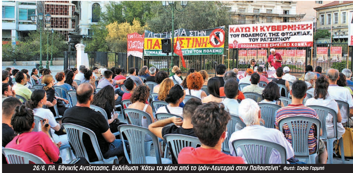
26/6, Πλ. Εθνικής Αντίστασης. Εκδήλωση 'Κάτω τα χέρια από το Ιράν-Λευτεριά στην Παλαιστίνη'.

την αστάθεια και αποτελεί το θεμέλιο για να καταλάβουμε τις εξελίξεις.