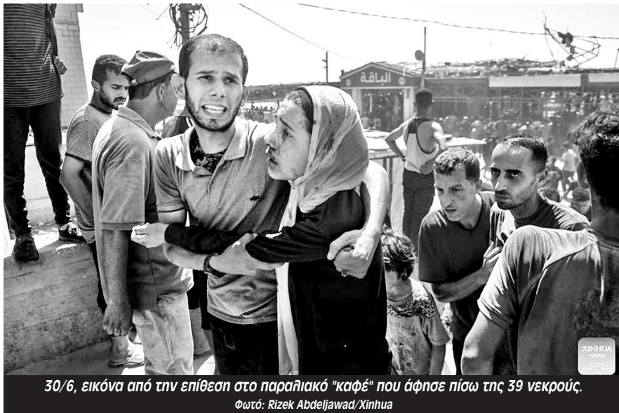
30/6, εικόνα από την επίθεση στο παραλιακό "καφέ" που άφησε πίσω της 39 νεκρούς.

Ανοίγουμε πυρ νωρίς το πρωί αν κάποιος προσπαθήσει να πιάσει σειρά στην ουρά, χτυπώντας από μερικές εκατοντάδες μέτρα μακριά και κάποιες φορές τους χτυπάμε απλώς από κοντά. Αλλά ο στρατός δεν αντιμετωπίζει κανέναν κίνδυνο. Δεν έχω ακούσει ούτε για μια περι-