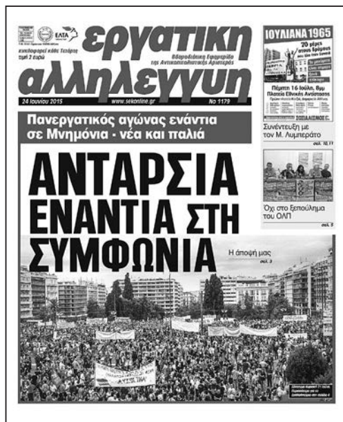
Εργατική Αλληλεγγυή #1179, 24 Ιούνη 2015