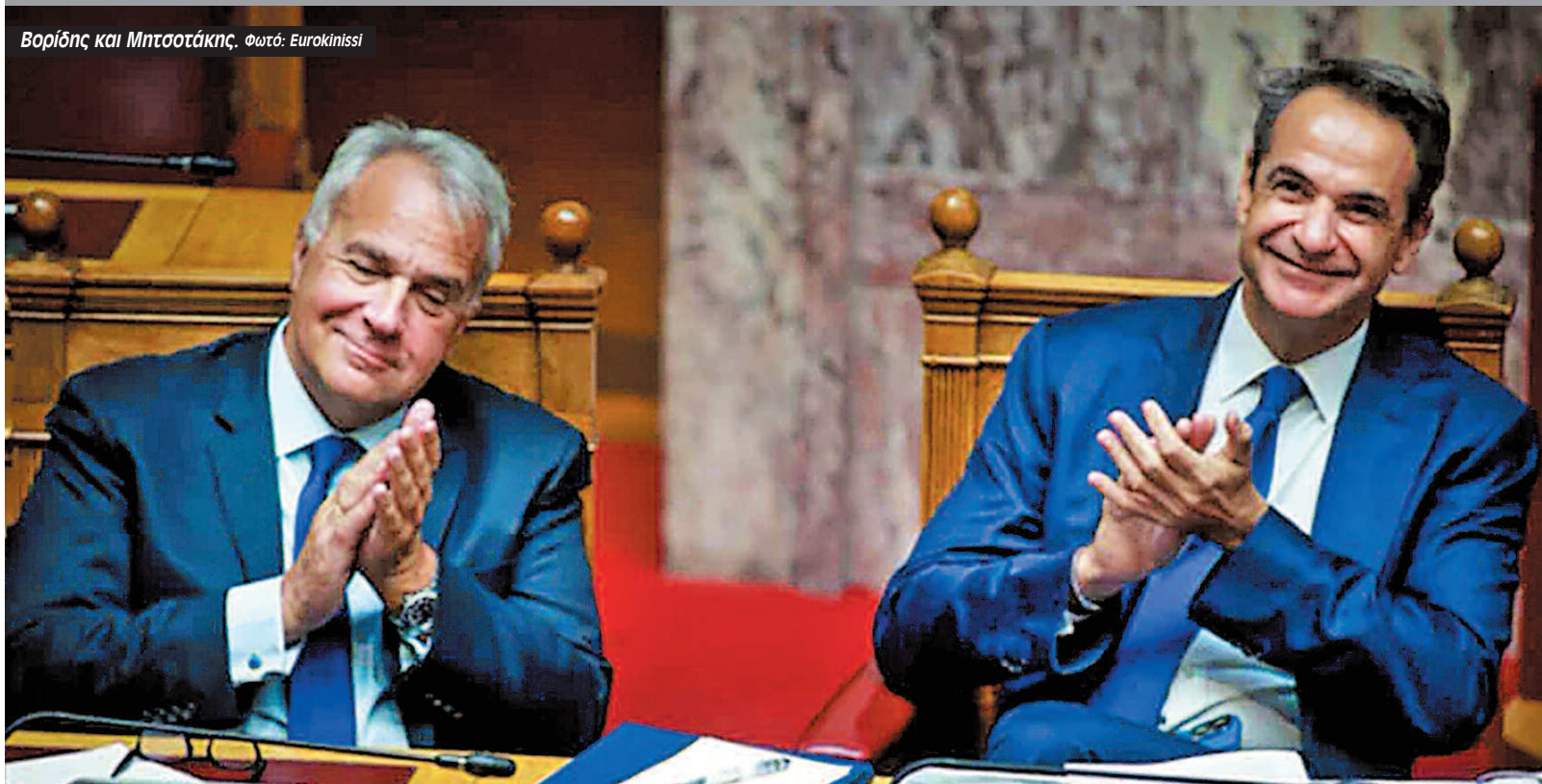
Βορίδης και Μητσοτάκης.