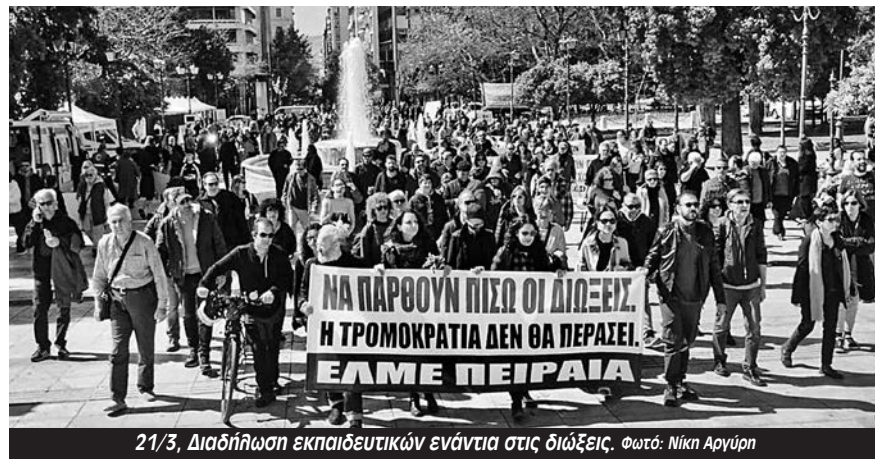
21/3, Διαδήλωση εκπαιδευτικών ενάντια στις διώξεις.

Στάση εργασίας της ΕΛΜΕ Πειραιά και κινητοποίηση στην ΠΔΕ Αττικής πραγματοποιήθηκε τη Δευτέρα 30/6 για τα πρώτα πειθαρχικά των εκπαιδευτικών Σπύρου Πουλή και Νίκου Τζιανάκη για τη συμμετοχή τους στην απεργία-αποχή από την Αξιολόγηση.