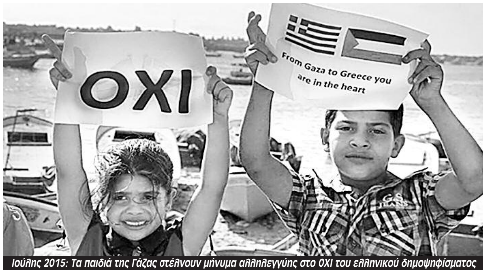
Ιούλης 2015: Τα παιδιά της Γάζας στέλνουν μήνυμα αλληλεγγύης στο ΟΧΙ του ελληνικού δημοψηφίσματος