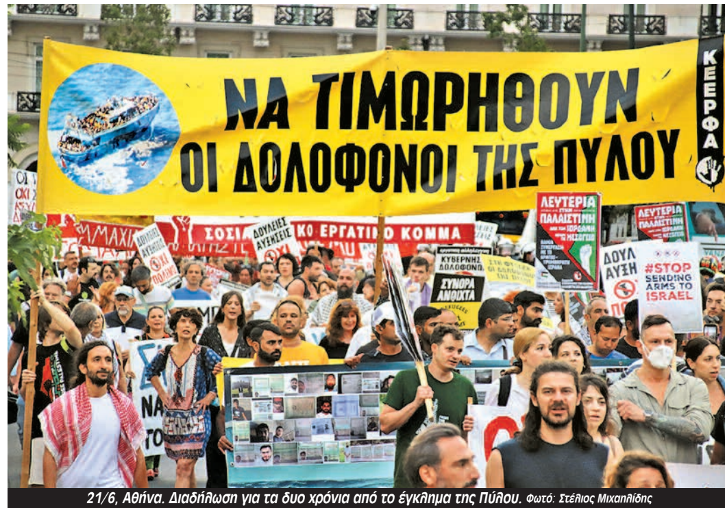
21/6, Αθήνα. Διαδήλωση για τα δύο χρόνια από το έγκλημα της Πύλου.

«Οι καλοί πρόσφυγες και μετανάστες είναι οι νεκροί πρόσφυγες και μετανάστες», ήταν με λίγα λόγια το δόγμα του Πλεύρη. Για όσους, δε, καταφέρνουν να γλυτώσουν από τον θάνατο στα σύνορα, το όνειρό του ήταν να έχουν μια ζωή «κόλαση». Ο πατέρας του, ο ανοιχτά δηλω-