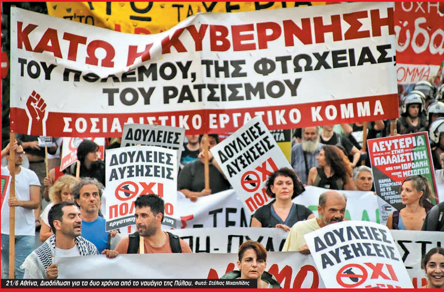
21/6 Αθήνα, Διαδήλωση για τα δυο χρόνια από το ναυάγιο της Πύλου.