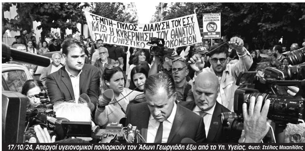
17/10/24, Απεργοί υγειονομικοί πολιορκούν τον Άδωνι Γεωργιάδη έξω από το Υπ. Υγείας.

Η εικόνα πανελλαδικά του ΕΣΥ είναι ζοφερή. Η έλλειψη προσωπικού, οι άδειες και τα ρεπό με το σταγονόμετρο, οι εφημερίες του τρό-