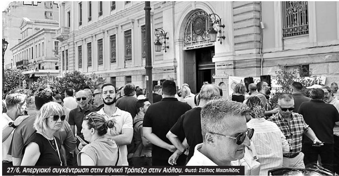
27/6, Απεργιακή συγκέντρωση στην Εθνική Τράπεζα στην Αιόλου.

Με δυο 24ωρες απεργίες την Παρασκευή 27/6 και τη Δευτέρα 30/6 συνέχισαν τις απεργιακές κινητοποιήσεις οι εργαζόμενοι της Εθνικής Τράπεζας διεκδικώντας την υπογραφή Συλλογικής Σύμβασης Εργασίας με πραγματικές αυξήσεις που θα περιλαμβάνει όλους τους εργαζόμενους της τράπεζας και προσλήψεις προσωπικού.