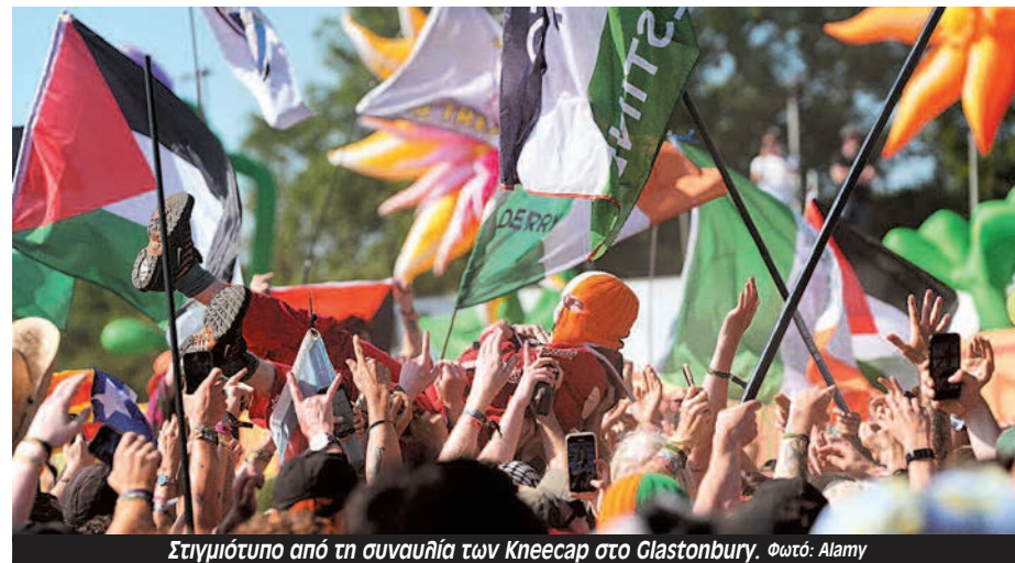
Στιγμιότυπο από τη συναυλία των Kneecap στο Glastonbury.