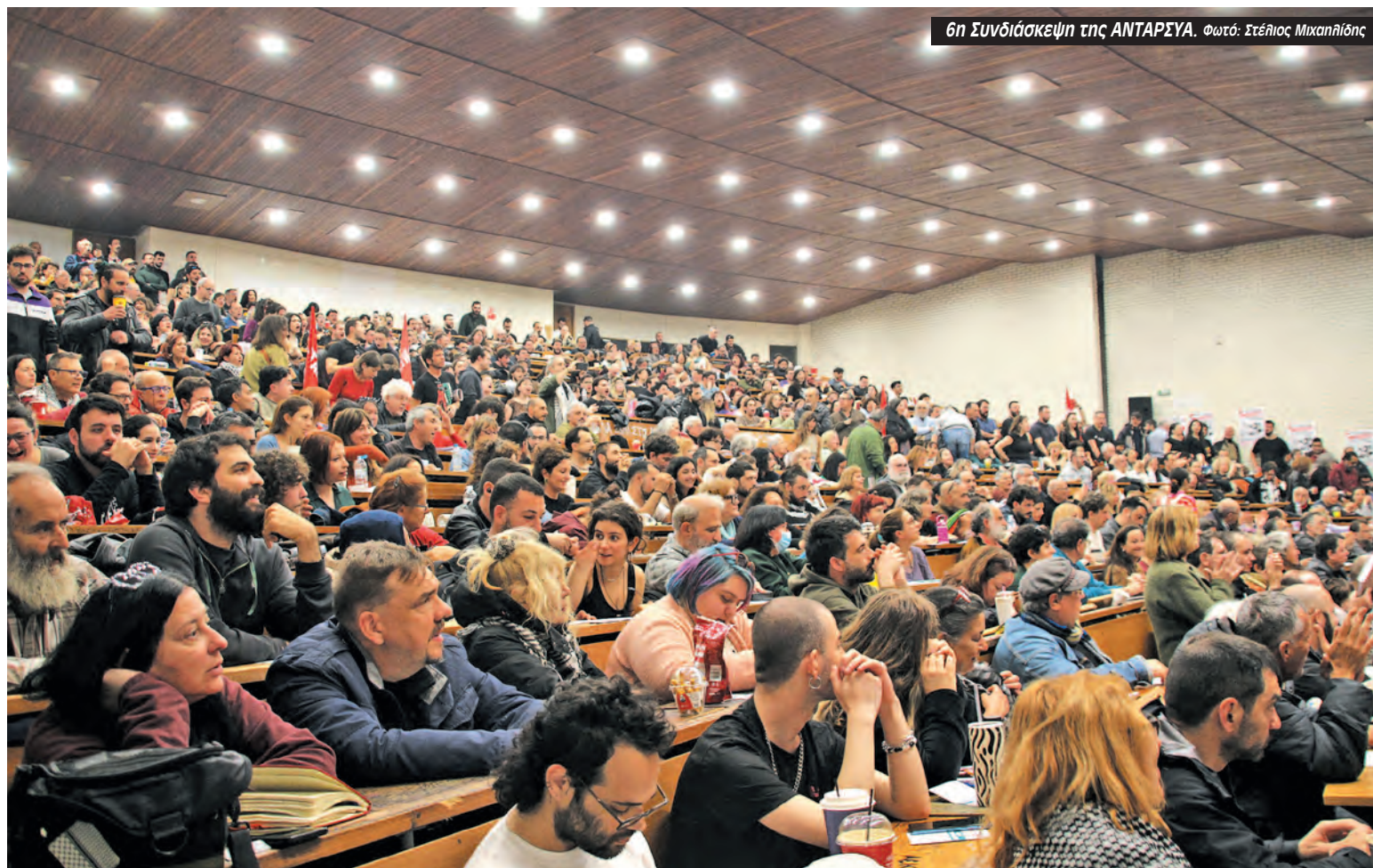
6η Συνδιάσκεψη της ANTAPEYA.

Όταν η υπόλοιπη Αριστερά μας έλεγε ότι τους διαφημίζετε, ότι θα μπουν στη Βουλή και θα φορέσουν γραβάτες ή ότι είναι πολιτικό το ζήτημα που μόλις βγει ο ΣΥΡΙΖΑ θα εξαφανιστούν, εμείς βγάλαμε τη γειτονιά στο δρόμο πολύ πριν τη δολοφονία Φύσσα. Και δυστυχώς δεν ήταν όλη η ANTAPEYA με αυτή τη γραμμή. Και αν τώρα στις 28 Μάρτη είχαμε πρωτοπορία τους Πακιστανούς, είναι γιατί στη Νίκαια που είναι το 10% του πληθυσμού, οργανώθηκαν από το 2009-10. Και το καταφέραμε με τους δικούς μας όρους. Και αν κάποιος πιστεύει ότι έτσι θα χάσει η ANTAPEYA και θα κερδίσουν οι ρεφορμιστές κάνουν λάθος. Γιατί η Ανταρσία στην Κοκκινιά μπορεί να κατεβάσει δημοτικό σχήμα εδώ και δέκα χρόνια στις εκλογές, να κερδίζει τον κόσμο του ΣΥΡΙΖΑ και να ξεπερνά το εμπόδιο του 3%».