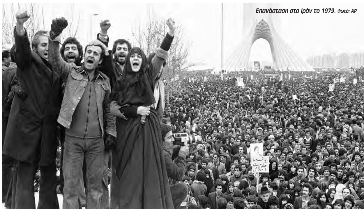
Επανάσταση στο Ιράν το 1979.

Ο καθηγητής Πολιτικών Επιστημών, Ρόμπερτ Άντονι Πέιπ , πρώην σύμβουλος του Λευκού Οίκου και του Τραμπ σε ζητήματα εθνικής και διεθνούς ασφαλείας και «γεράκι» δήλωσε χαρακτηριστικά: «Έχοντας αποτύχει οι βομβαρδισμοί (σσ του Ιούνη 2024) οι ΗΠΑ πήγαν σε διαπραγματεύσεις. Εκεί έκαναν ίσως το χειρότερο λάθος τους. Στις 27 Φεβρουαρίου ο Τραμπ είχε στο τραπέζι μια προσφορά από το Ιράν που ήταν μάλιστα καλύτερη από τη συμφωνία του 2015. Ο πρόεδρος Τραμπ θα μπορούσε να επιστρέψει και να δουλέψει αυτή τη συμφωνία. Αυτό που έκανε ήταν να πετάξει αυτή τη συμφωνία την οποία μάλιστα στήριζε και ο Χαμενεΐ. Και τι κάνανε αντί γι' αυτό; Προχώρησαν σε "αλλαγή καθεστώτος". Έτσι δίχως να έχουν πετύχει οι βομβαρδισμοί και η δολοφονία του Χαμενεΐ, πλέον οι Αμερικανοί ετοιμάζονται για το τρίτο και μοιραίο στάδιο, την χερσαία επίθεση, αυτό που αντιμετώπισαν οι ΗΠΑ στο Βιετνάμ. Όταν προσπαθείς να αποχωρήσεις αφού έχεις φτάσει στο τρίτο στάδιο συνήθως αυτό καταλήγει άσχημα...».