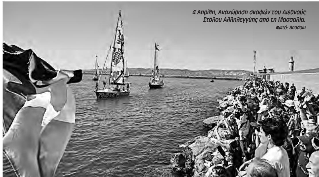
4 Απρίλη, Αναχώρηση σκαφών του Διεθνούς Στόλου Αλληλεγγύης από τη Μασσαλία.