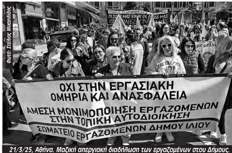
21/3/25, Αθήνα. Μαζική απεργιακή διαδήλωση των εργαζομένων του Δήμου.

γηση της «διάταξης Βορίδη», μας ενημέρωσε πως επεξεργάζονται μοντέλο 11μηνων συμβάσεων με ειδική μοριοδότηση για τους εργαζόμενους που ήδη εργάζονται! Στο προσχέδιο Νόμου του Υπουργείου Εσωτερικών περιγράφεται ένα μοντέλο υποδεέστερο ακόμη και από αυτό που ήδη εφαρμόζεται για τις Σχολικές Καθαρίστριες, το οποίο μεταξύ άλλων προβλέπει τα εξής: Οι εργαζόμενοι θα προσλαμβάνονται κατά προτεραιότητα μέσα από έναν ηλεκτρονικό γενικό κατάλογο υποψηφίων. Ο ηλεκτρονικός κατάλογος υποψηφίων δεν θα μπορεί να ισχύει για περισσότερο από δυο (2) χρόνια. Μετά θα καταρτίζεται νέος. Οι συμβάσεις θα είναι 8μηνες ή 11μηνες διάρκειας. Εκτός από τις συμβάσεις πλήρους απασχόλησης θα υπάρχουν και συμβάσεις μερικής απασχόλησης. Η μισθοδοσία των εργαζομένων θα εξαρτάται αποκλειστικά από τα VOUCHER Οι προσλήψεις δεν θα γίνονται πριν τον Νοέμβριο, εφόσον καταφέρουν να αναμορφωθούν οι προϋπολογισμοί των Δήμων και υπάρχουν οι ανάλογες πιστώσεις από τα VOUCHER».