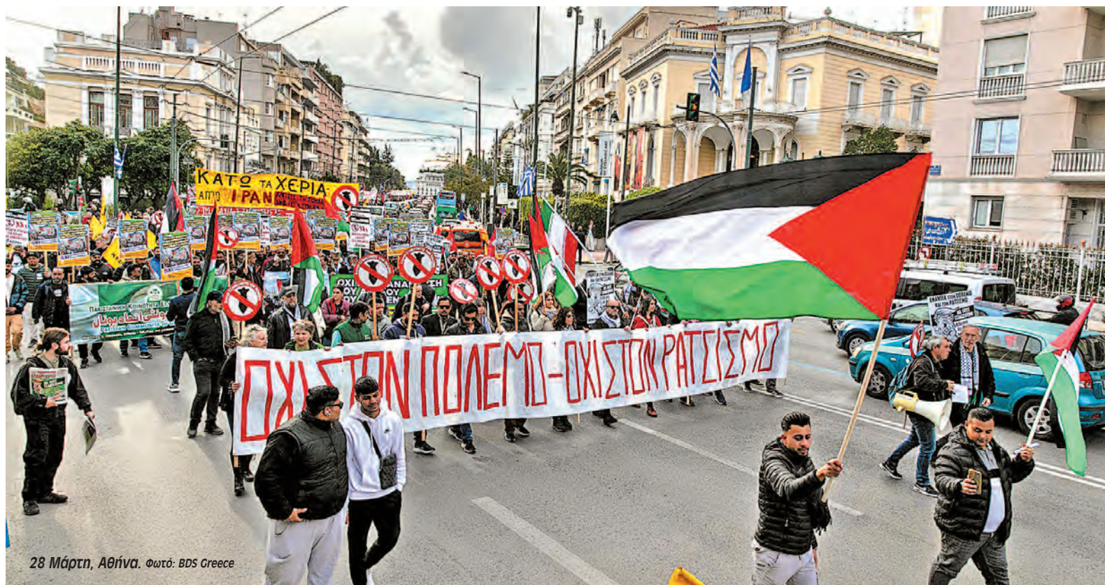
28 Μάρτη, Αθήνα.