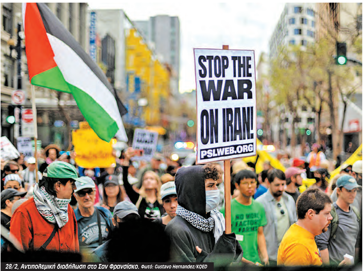
28/2. Αντιπολεμική διαδήλωση στο Σαν Φρανσίσκο.

Τέλος, εκεί που ο Τραμπ επιδίωκε «αλλαγή καθεστώτος» στο Ιράν, βρίσκεται ξαφνικά αντιμετώπος με μια «αλλαγή καθεστώτος» στις ίδιες τις ΗΠΑ.