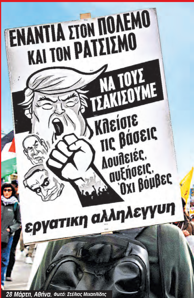
28 Μάρτη, Αθήνα. Φωτό: Στέλιος Μιχαηλίδης