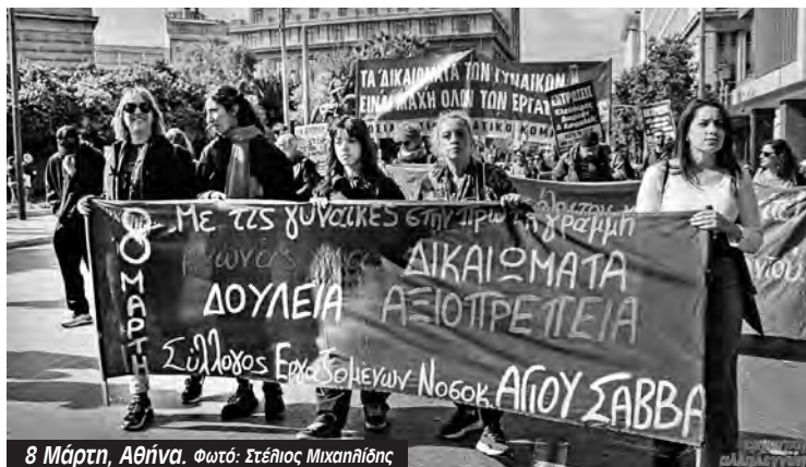
8 Μάρτη, Αθήνα.