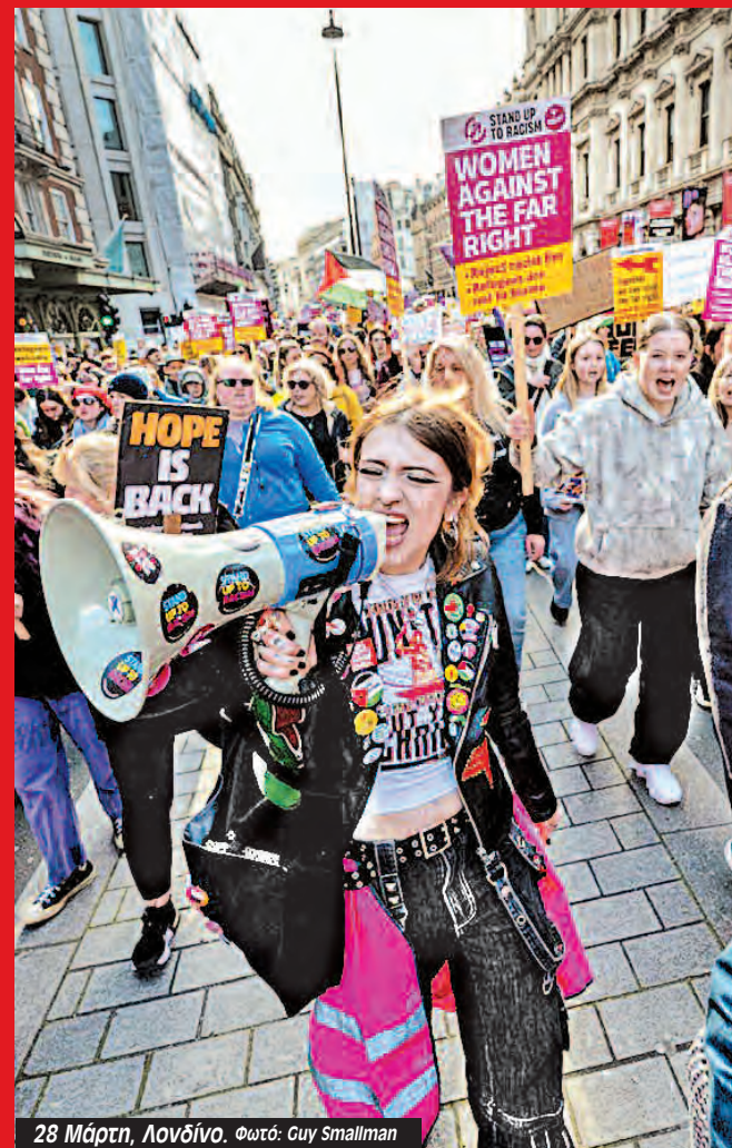
28 Μάρτη, Λονδίνο. Φωτό: Guy Smallman