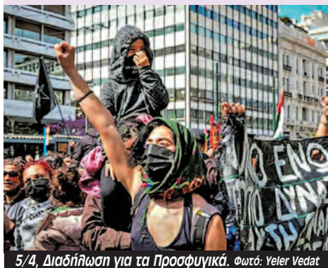
5/4, Διαδήλωση για τα Προσφυγικά.