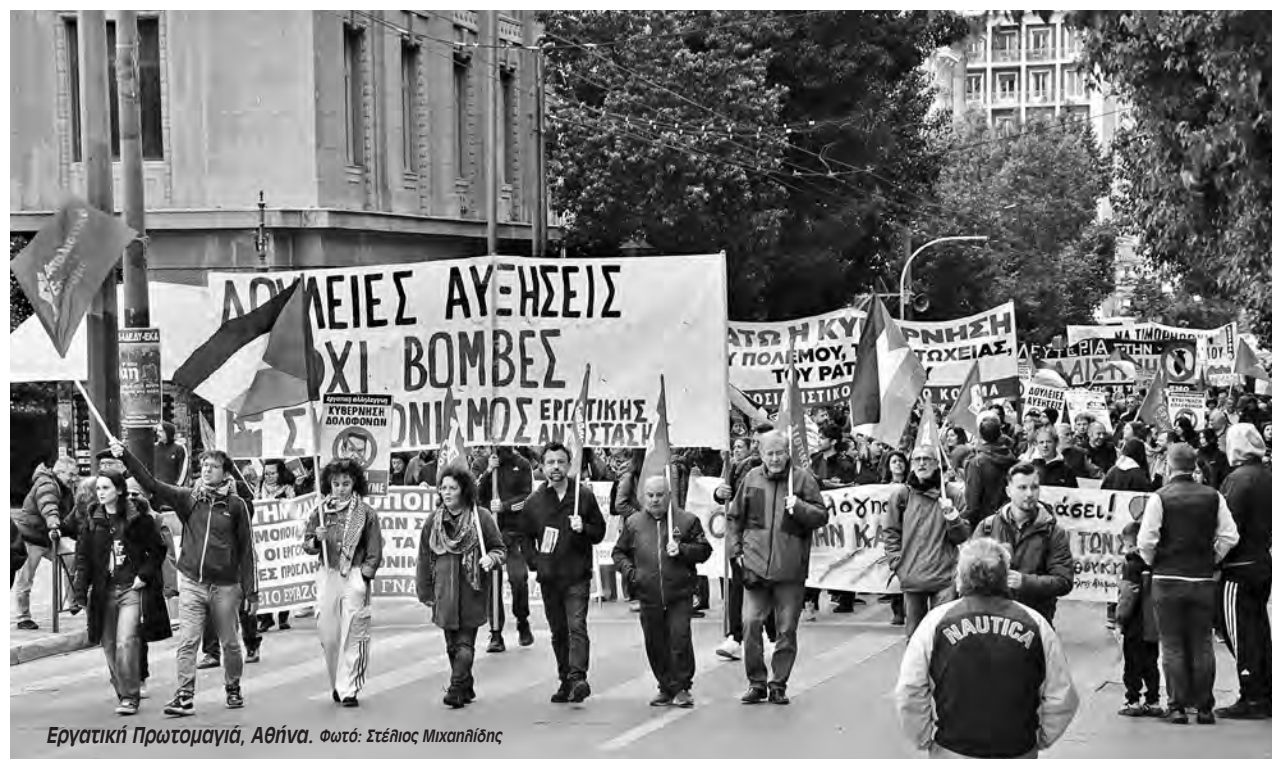
Εργατική Πρωτομαγιά, Αθήνα.