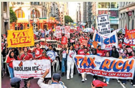
1η Μάη, Ν. Υόρκη.

Στην καρδιά του καπιταλισμού, στις ΗΠΑ, η άρχουσα τάξη είχε πάντα βαθύ μίσος για την Πρωτομαγιά. Της θύμιζε τις μεγάλες στιγμές του εργατικού κινήματος και το φόβο που προκαλούσε πάντα η πιθανότητα να συνδεθεί το εργατικό κίνημα στις ΗΠΑ με τις σοσιαλιστικές ιδέες και την επανάσταση. Κατάφεραν για πολλές δεκαετίες να την αποσυνδέσουν από τα συνδικάτα, αντικαθιστώντας την επίσημα με την αργία της Μέρας του Εργάτη, στις αρχές Σεπτεμβρίου.