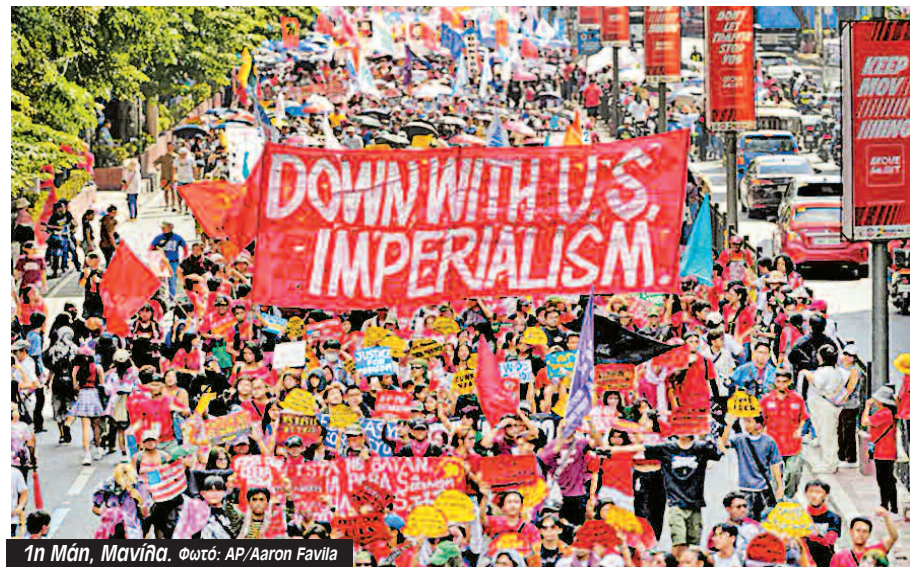
1η Μάη, Μανίλα.