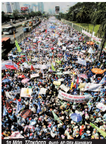
1η Μάη, Τζακάρτα.

Στην Νότια Κορέα, μετά από 63 χρόνια, φέτος αποκαταστάθηκε το όνομα “Μέρα του εργατικού κινήματος” και ξαναέγινε επίσημη αργία η Πρωτομαγιά. Η αλλαγή ήρθε σαν συνέχεια της νίκης απέναντι