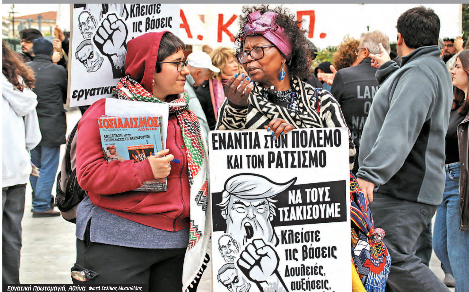
Εργατική Πρωτομαγιά, Αθήνα.