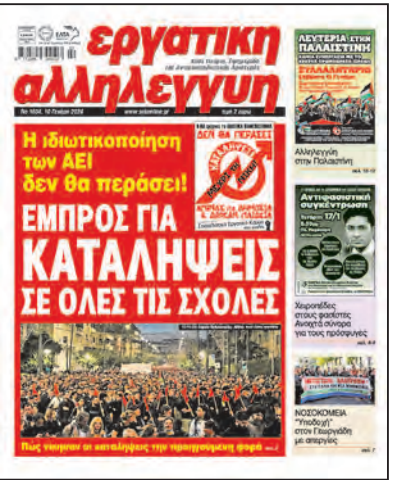
Πρωτοσέλιδο της Εργατικής Αλληλεγγύης τον Γενάρη του 2024

γηση σε όπισθη-στέγαση, περιορισμό της φοιτητικής συμμετοχής στην ανάδειξη των πανεπιστημιακών οργάνων, ιδιωτικά ΑΕΙ, χτύπημα στο άσολο. Στο μεταξύ ο Κοντογιαννόπουλος είχε ήδη δημοσιεύσει δυο υπουργικά διατάγματα για τα γυμνάσια και τα λύκεια που προέβλεπαν: επαναφορά της ποδιάς στα γυμνάσια, επαναφορά της καθημερινής προσεχής, του ομαδικού εκκλησιασμού και της έπαρσης της σημαίας, κατάρρευση των αδικαιολόγητων απουσιών κ.α.