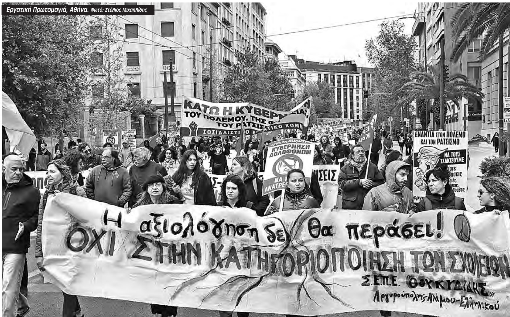
Εργατική Πρωτομαγιά, Αθήνα.