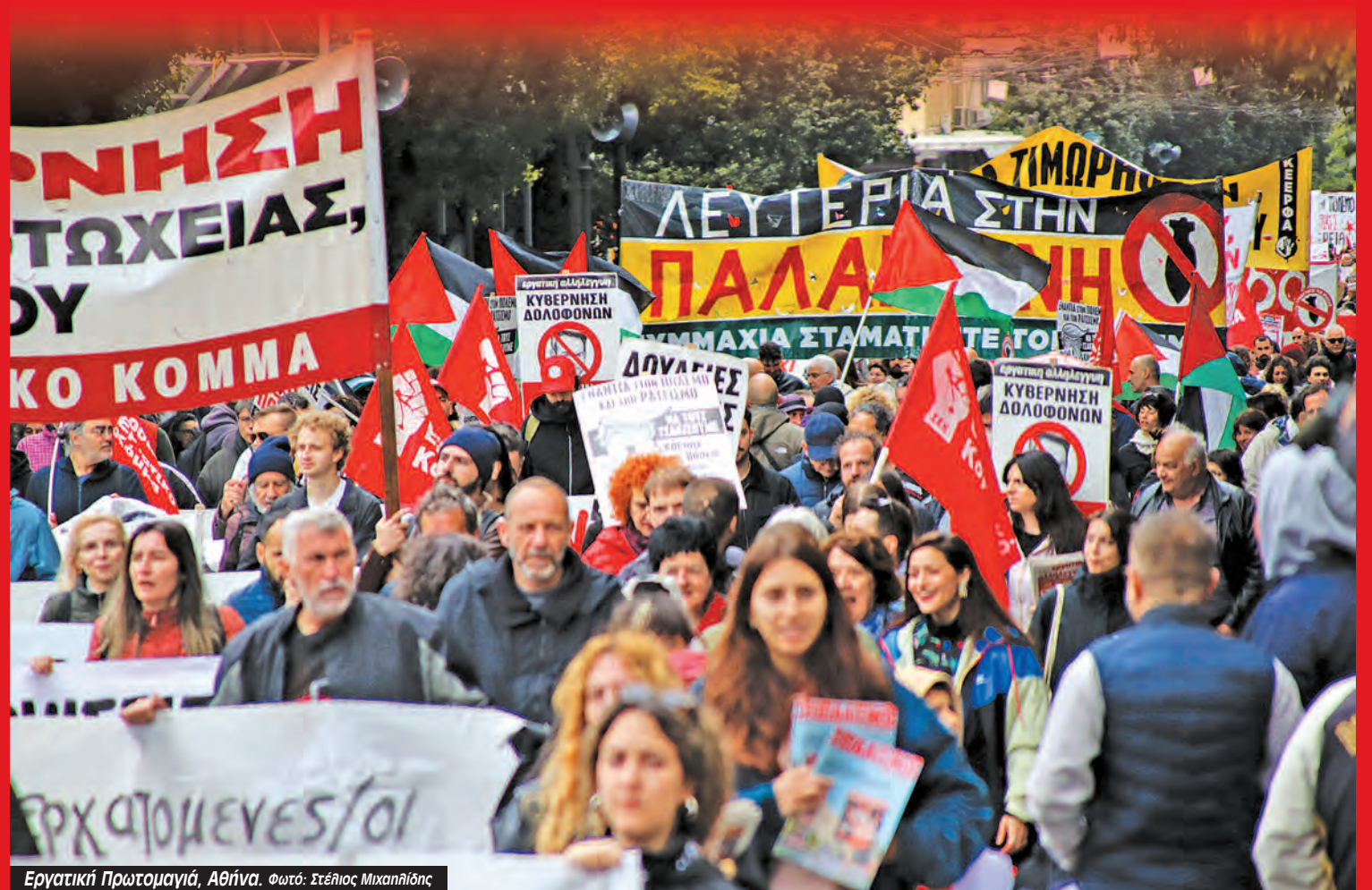
Εργατική Πρωτομαγιά, Αθήνα.