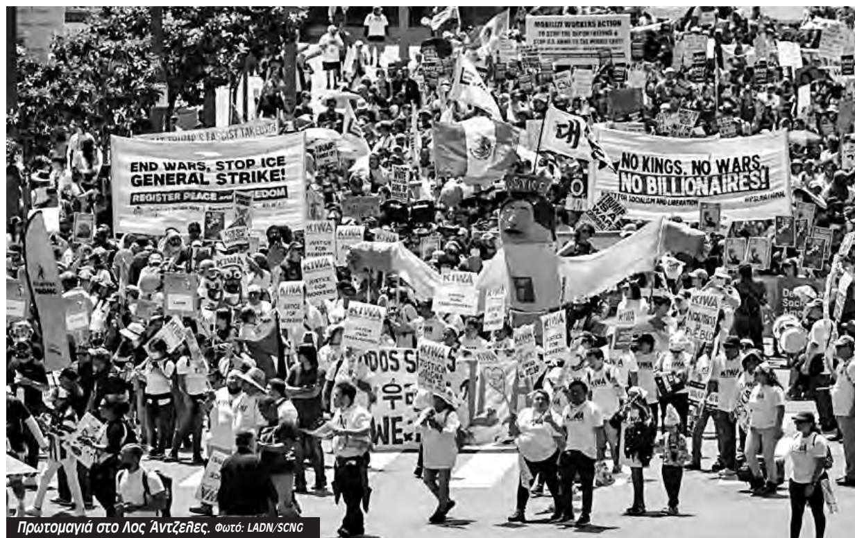
Πρωτομαγιά στο Λος Άντζελες.

Η φετινή Εργατική Πρωτομαγιά είναι αντιπολεμική. Η εκχειρία είναι εξαιρετικά εύθραυστη.