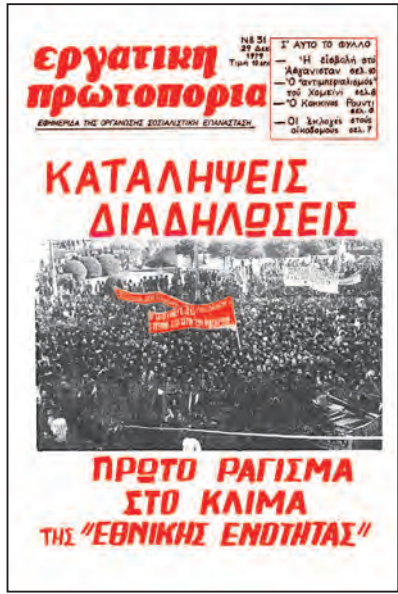
Πρωτοσέλιδο της Εργατικής Πρωτοπορίας τον Δεκέμβριο του 1979

και όχι στο να πέσει η Χούντα. Θεωρούσαν ότι η δικτατορία δεν μπορεί να ανατραπεί από το κίνημα της νεολαίας και των εργατών, αλλά χρειάζεται ένα σχέδιο «συντεταγμένης διαδοχής» με προοπτική εκλογές και ανοίγματα στα αστικά πολιτικά κόμματα με στόχο μια σταδιακή αποχουνοποίηση.