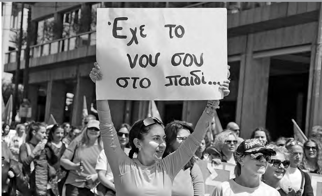
Οι απεργιοί των Δήμων δείχνουν τον δρόμο να παλέψουμε σε όλα τα μέτωπα. Αθήνα 24/4, Απεργιακή διαδήλωση των ΟΤΑ.