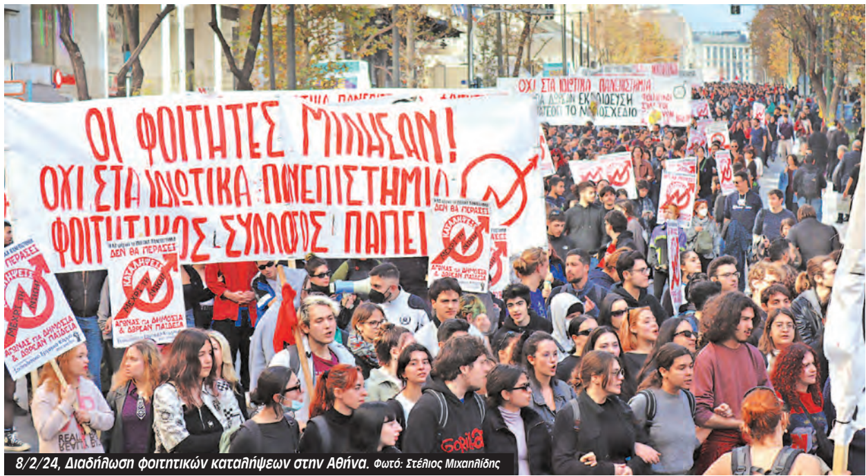
8/2/24, Διαδήλωση φοιτητικών καταλήψεων στην Αθήνα.

Αντίθετα, το Πολυτεχνείο άνοιξε το δρόμο για την κατάρρευση της Χούντας το 1974. Η Νέα Δημοκρατία που ήρθε στην εξουσία αντιμετώπιζε με άγρια καταστολή το ισχυρό φοιτητικό κίνημα στο οποίο κυριαρχούσε η Αριστερά. Το καλοκαίρι του 1978 επιχείρησε να βάλει να βάλει χέρι στα Πανεπιστήμια με τον Νόμο 815. Την πλειοψηφία στις σχολές είχαν η ΠΚΣ, η ΠΑΣΠ και ο Ρήγας Φεραίος, δυνάμεις που έωνε η κοινή γραμμή μιας «αλλαγής» που θα ερχόταν από τα κάτω στις επερχόμενες βουλευτικές εκλογές. Βασική γραμμή τους ήταν ότι «αφού ψηφίστηκε ο νόμος