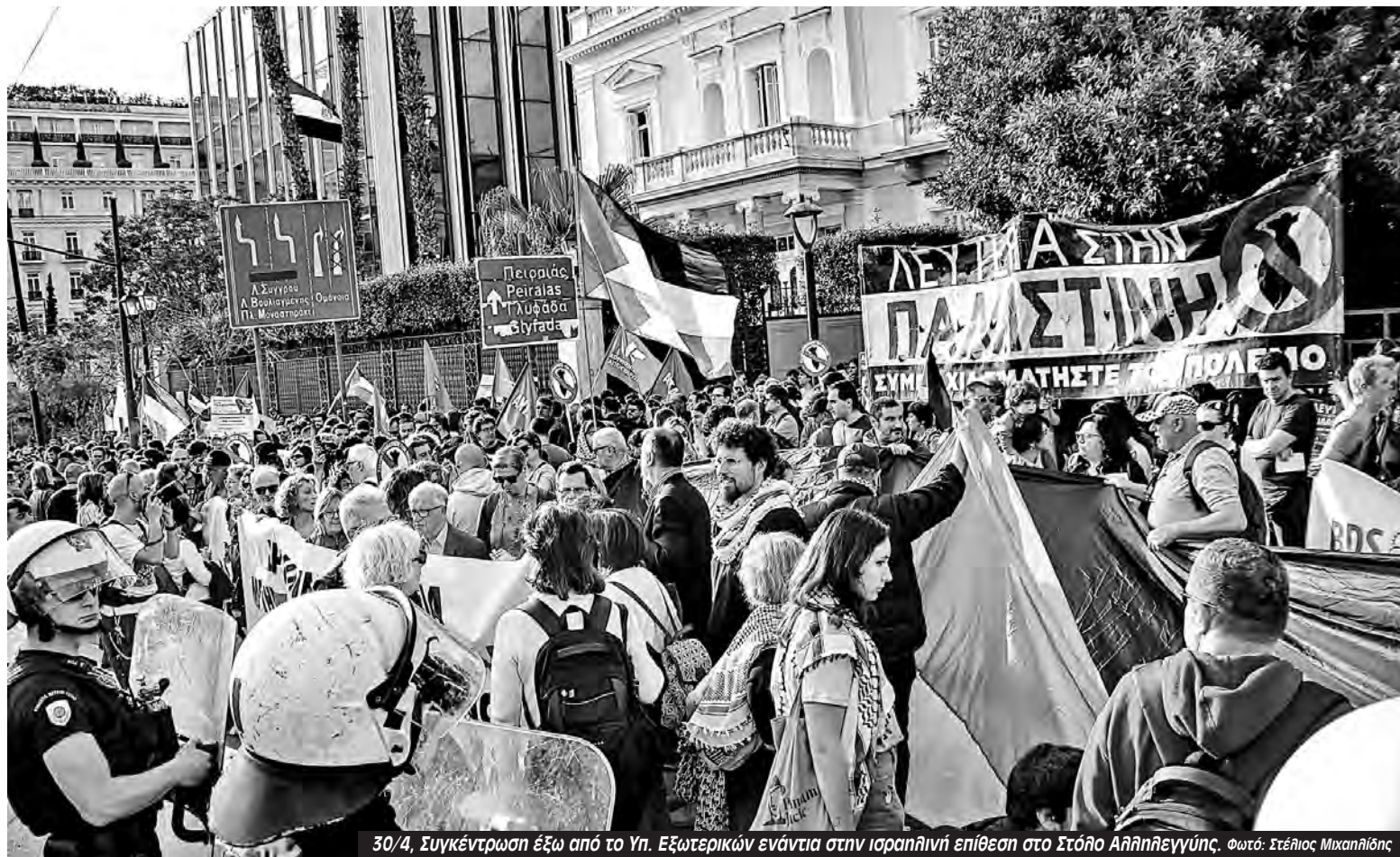
30/4, Συγκέντρωση έξω από το Υπ. Εξωτερικών ενάντια στην ισραηλινή επίθεση στο Στόλο Αλληλεγγύης.

«Πρόκειται για μια κατάφωρη πράξη θαλάσσιας πειρατείας, μια κλιμάκωση του σιωνιστικού σχεδίου για τη βίαιη μονοπώληση της Μεσογείου» καταγγέλει το Global Sumud Flotilla. «Η Ευρώπη συνεχίζει να επιβάλλει τα θαλάσσια σύνορά της εναντίον μεταναστών που διαφεύγουν από τον πόλεμο και την άδικη δίωξη, αλλά επέτρεψε μια παράνομη ξένη στρατιωτική επίθεση εναντίον των δικών της πολιτών. Η σιωπή των ευρωπαϊκών κυβερνήσεων απέναντι στην παράνομη επιχείρηση του Ισραήλ μιλάει από μόνη της. Οι Βρυξέλλες σιώπησαν. Η Ρώμη έμεινε σιωπηλή. Η Αθήνα, των οποίων τα παράκτια ύδατα συνορεύουν με τον τόπο αυτής της επίθεσης, έμεινε σιωπηλή. Η σιωπή αυ-