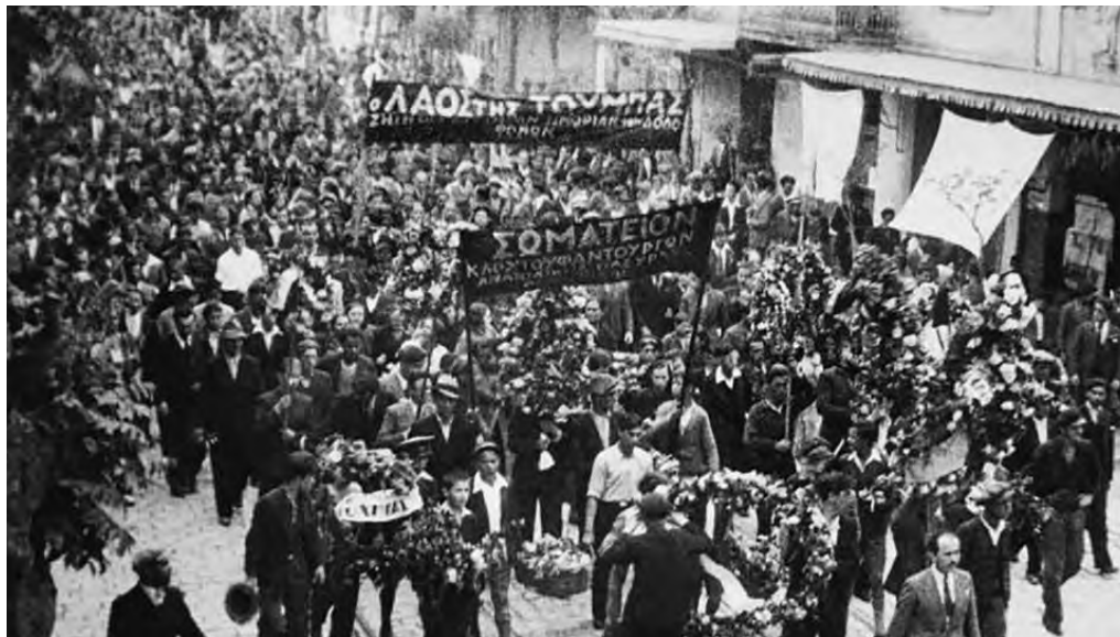
10 Μάη. Η κηδεία των νεκρών της απεργίας μετατρέπεται σε τεράστιο συλλαλητήριο. Πλήθος κόσμου πορεύεται στην Λεωφόρο Στρατού. Πανό γράφει «Ο λαός της Τούμπας ζητεί την [...] τιμωρίαν των δολοφόνων».

«Εχρεωκοπήσαμεν ως Κοινοβουλευτισμός, εξεπέσαμεν ως Συνέλευσις [...] Και έτι πλέον κ. Βουλευταί. Εχάσαμεν ίσως και τον ψυχικόν σύνδεσμον προς τον λαόν, τον οποίον ενετάλημεν να διακυβερνήσωμεν. Διότι, τι είδους ψυχικός σύνδεσμος είναι δυνατόν να διατηρηθή, όταν ο μεν λαός φωνάζει δεν θέλω να με κυβερνήση ο Μεταξάς, ημείς δε διαφορούμεντες προς την