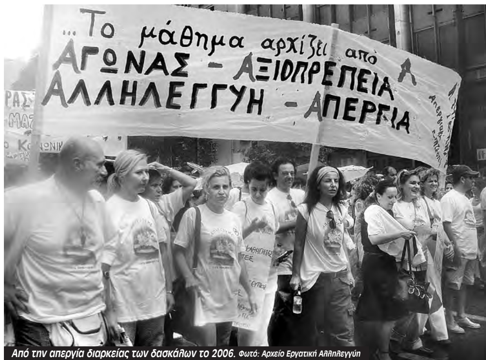
Από την απεργία διάρκειας των δασκάλων το 2006.