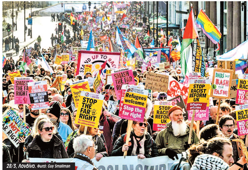
28/3, Λονδίνο.

Η απάντηση της βρετανικής άρχουσας τάξης ήταν ο νεοφιλελευθερισμός. Το χάσμα μεταξύ των Τόρις και των Εργατικών μειώθηκε ενώ αυξήθηκε το χάσμα ανάμεσα στους ψηφοφόρους και τα κόμματα. Η αίσθηση ότι οι άνθρω-