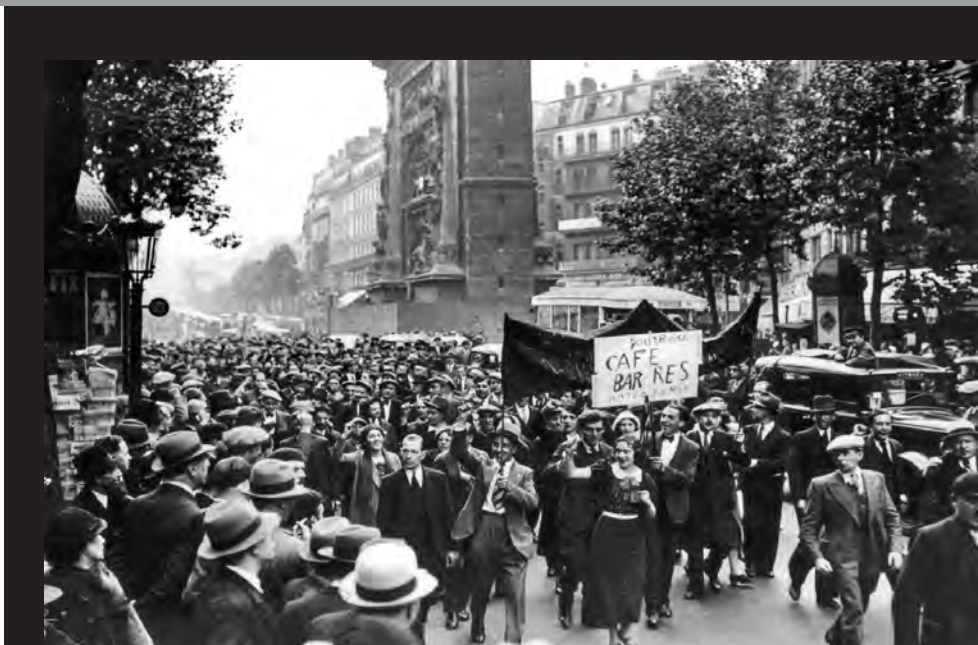
14/6/1936, Απεργία των εργαζόμενων στα καφέ του Παρισιού.

Η έκρηξη των απεργιών είχε απελευθερωθεί από τη νίκη του Λαϊκού Μετώπου στις εκλογές της 3ης Μάη. Η συνεργασία του Σοσιαλιστικού Κόμματος, του Γαλλικού Κομμουνιστικού Κόμματος (ΓΚΚ) και του κεντρικού Ριζοσπαστικού Κόμματος οδήγησε σε σχηματισμό αριστερής κυβέρνησης. Λίγους μήνες πιο πριν, όλοι μιλούσαν για τον κίνδυνο να κυριαρχήσει ο φασισμός στη Γαλλία. Το Φλεβάρη του 1934 οι ταραχές που οργάνωσε η ακροδεξιά, ανάμεσά τους φα-