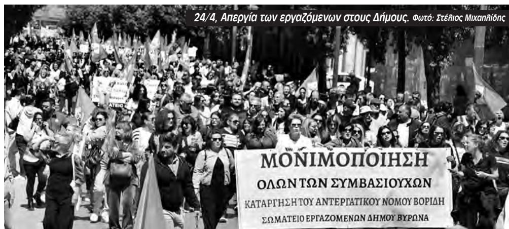
24/4, Απεργία των εργαζόμενων στους Δήμους.