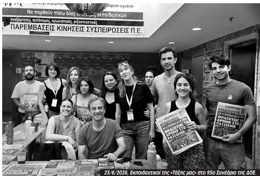
23/6/2026, Εκπαιδευτικοί της «Τάξης μας» στο 95ο Συνέδριο της ΔΟΕ.