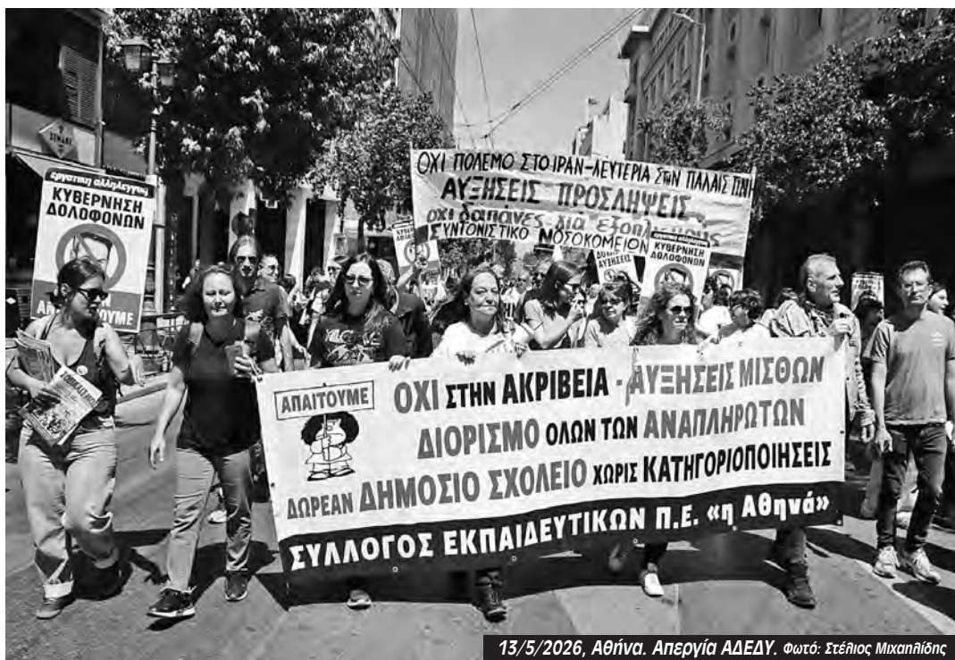
13/5/2026, Αθήνα. Απεργία ΑΔΕΔΥ.

Η 95η Γενική συνέλευση της ΔΟΕ γίνεται στην 20η επέτειο της ιστορικής, σχεδόν 2μηνιας απεργίας του κλάδου, το 2006. Εκείνη η απεργία θρυμμάτισε την εικόνα της ευμάρειας και της παντοδυναμίας του συστήματος. Εκδηλώθηκε σε μια περίοδο που ο αμερικάνικος ιμπεριαλισμός φαίνονταν ότι ξεπερνούσε οριστικά το «σύνδρομο του Βιετνάμ», θάβοντας στην άμμο της ερήμου τον στρατό του Σαντάμ και εγκαθιστώντας στην Βαγδάτη μια κατοχική κυβέρνηση ανδρείκελο. Στην Ελλάδα, ζούσαμε στη σκιά του οράματος του «εκσυγχρονισμού» του Σημίτη, της «ισχυρής Ελλάδας», της ένταξης στο ευρώ, της κατάκτησης του ευρωπαϊκού κυπέλλου ποδοσφαίρου και της μεγάλης κερδοσκοπίας των Ολυμπιακών Αγώνων της Αθήνας.