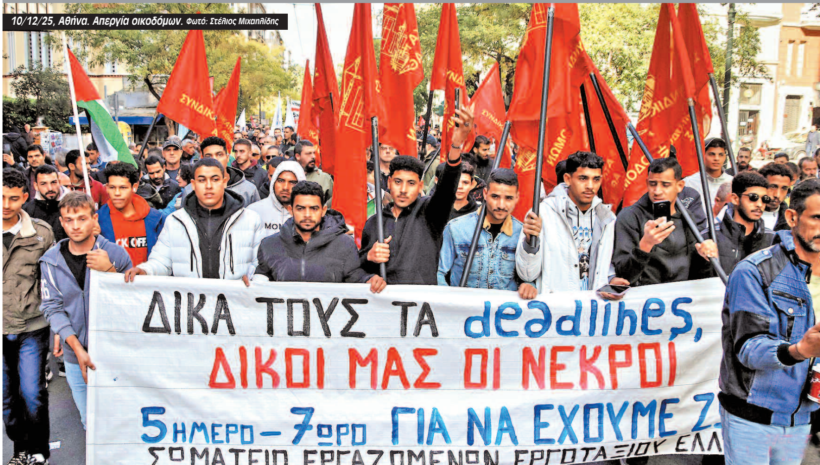
10/12/25, Αθήνα. Απεργία οικοδόμων.