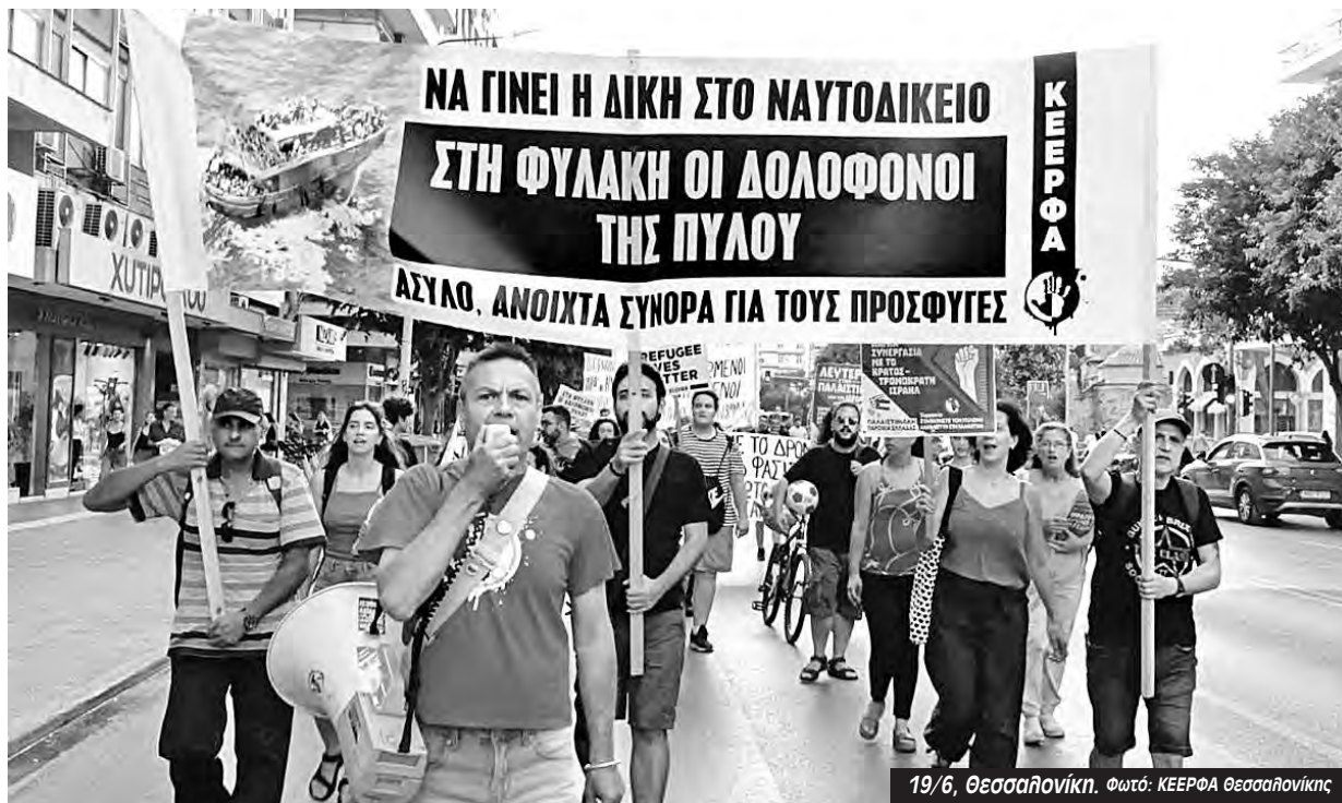
19/6, Θεσσαλονίκη.