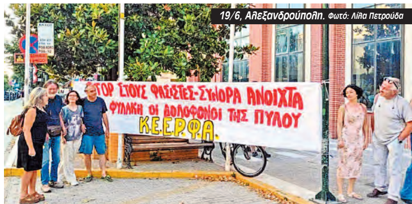
19/6, Αίγινα.