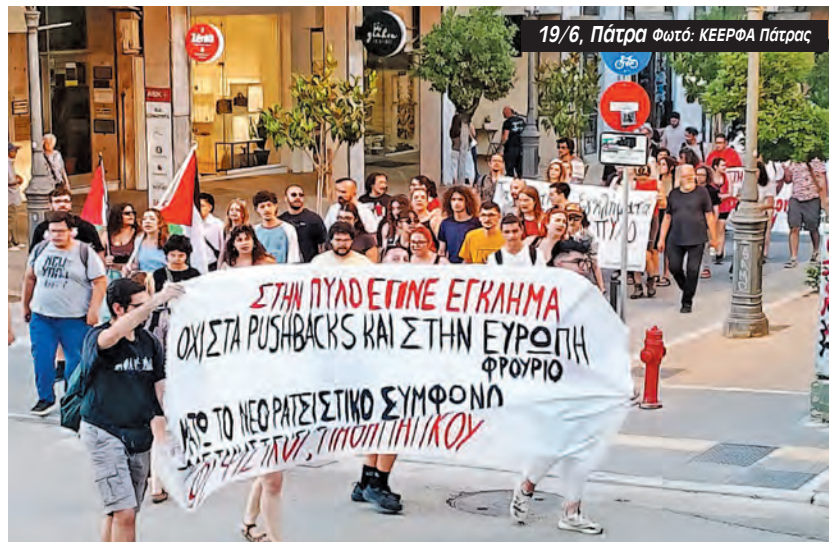
19/6, Πάτρα.