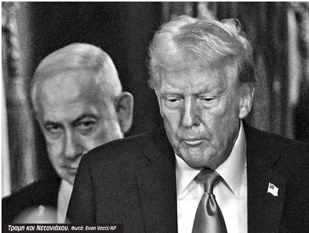
Τραμπ και Νετανιάχου.

Ο Τραμπ απαιτούσε από το Ιράν να εγκαταλείψει ολοκληρωτικά το πυρηνικό του πρόγραμμα, να διακόψει κάθε προσπάθεια εμπλουτισμού ουρανίου –παρόλο που όλοι οι διεθνείς επιθεωρητές επιβεβαίωναν ότι το Ιράν ούτε έχει, ούτε είχε κάνει κάποια προσπάθεια να παρασκευάσει εμπλουτισμένο ουράνιο κατάλληλο για πολεμική χρήση. Και απαιτούσε ακόμα από την Τεχεράνη να παραδώσει «εδώ και τώρα» στις ΗΠΑ το ήδη εμπλουτισμένο του ουράνιο –παρόλο που είναι σχεδόν βέβαιο ότι βρίσκεται θαμμένο βαθιά κάτω από την γη κάτω από τα ερείπια των πυρηνικών εγκαταστάσεων του Ιράν που οι ΗΠΑ και το Ισραήλ βομβάρδισαν στη διάρκεια της πρώτης τους επίθεσης, του 12ήμερου πολέμου του περασμένου Δεκέμβρη.