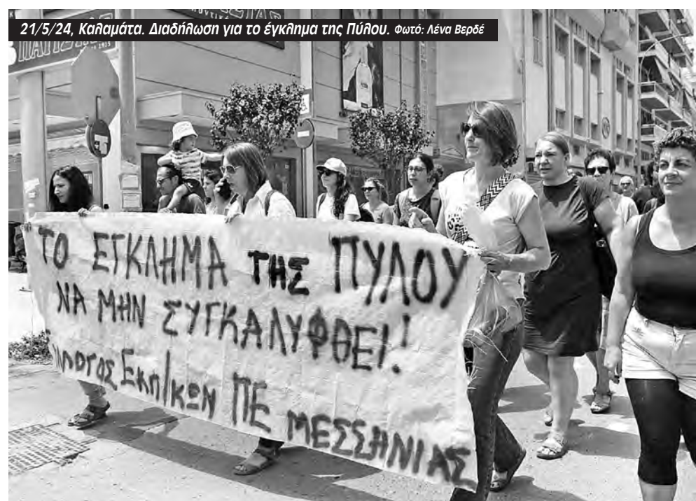
21/5/24, Καλαμάτα. Διαδήλωση για το έγκλημα της Πύλου.

«ο Θουκυδίδης», σύνεδρος στο 95ο Συνέδριο της ΔΟΕ