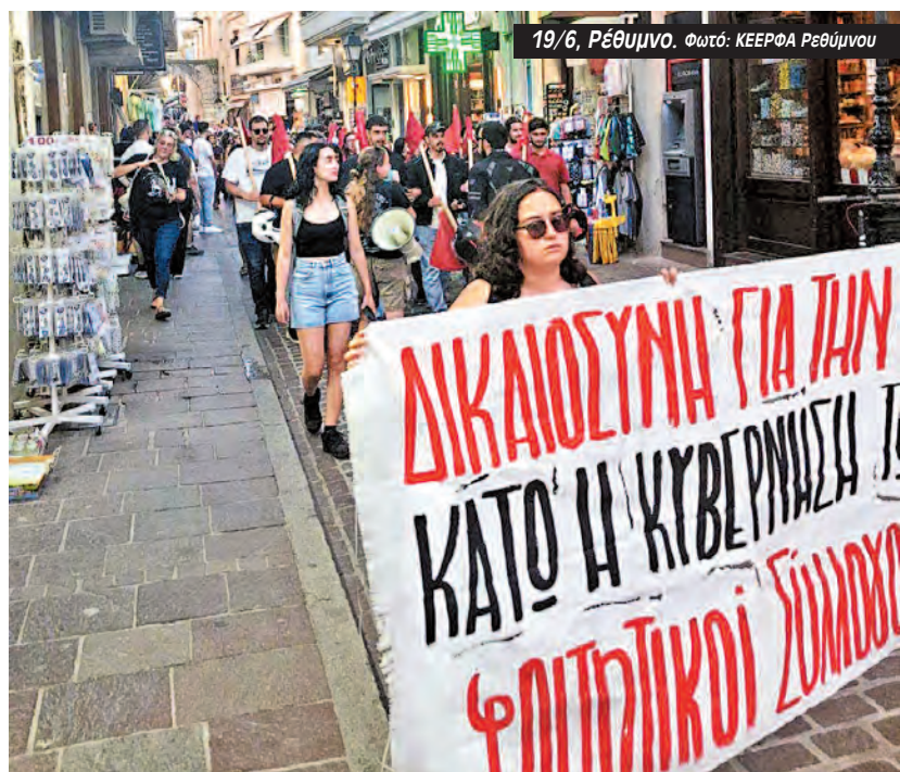
19/6, Ρέθυμνο.