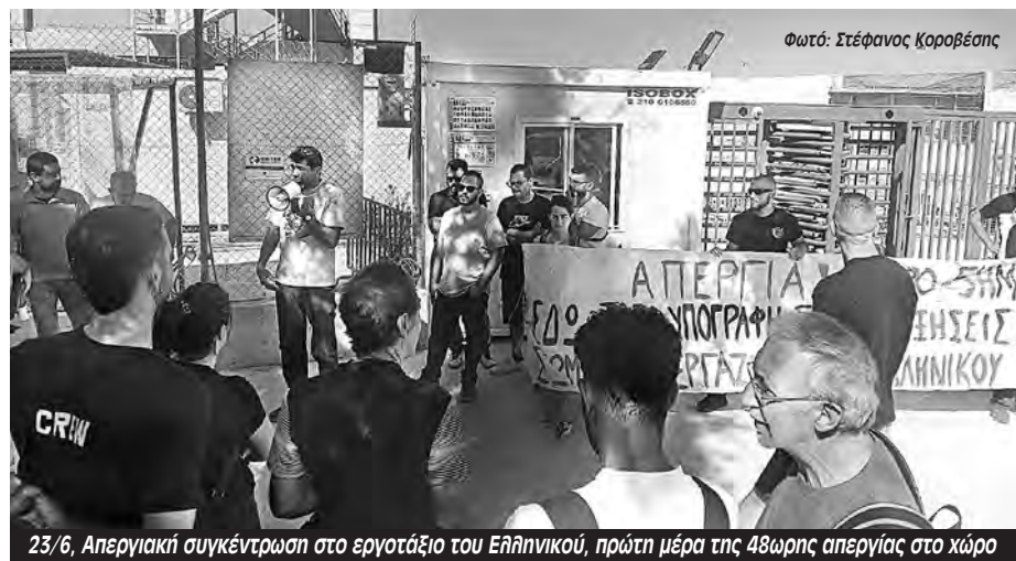
23/6, Απεργιακή συγκέντρωση στο εργοτάξιο του Ελληνικού, πρώτη μέρα της 48ωρης απεργίας στο χώρο

Ο πρόεδρος του σωματείου ανακοίνωσε γενικές συνελεύσεις το επόμενο διάστημα. Αν δε δουλέψει μαζί με τους μετανάστες το σωματείο και δεν μας εκπροσωπήσει δεν πρόκειται να προχωρήσουν τα