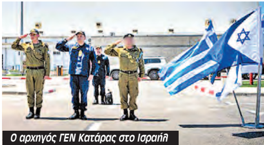
Ο αρχηγός ΓΕΝ Κατάρας στο Ισραήλ

Σε αυτό το πλαίσιο, το Ισραήλ απαγόρευσε την είσοδο και απέλασε την ελληνική αντιπροσωπεία συνδικαλιστών-ριών από μια σειρά σωματεία (ΠΕΝΕΝ, ΣΕΦΚ, ΠΕΔΕΚ, Σύλλογος Εργαζομένων Εθνικής Τράπεζας, Σωματείο Εργαζομένων στο Αττικό, ΣΩΜΑΤΕΙΟ εργαζομένων ICAP OUTSOURCING SOLUTIONS) ενώ ήταν καλεσμένοι της Γενικής Ομοσπονδίας Εργατικών Συνδικάτων της Παλαιστίνης