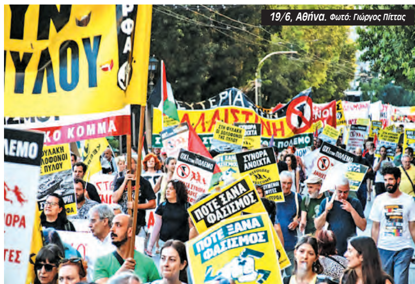
19/6, Αθήνα.