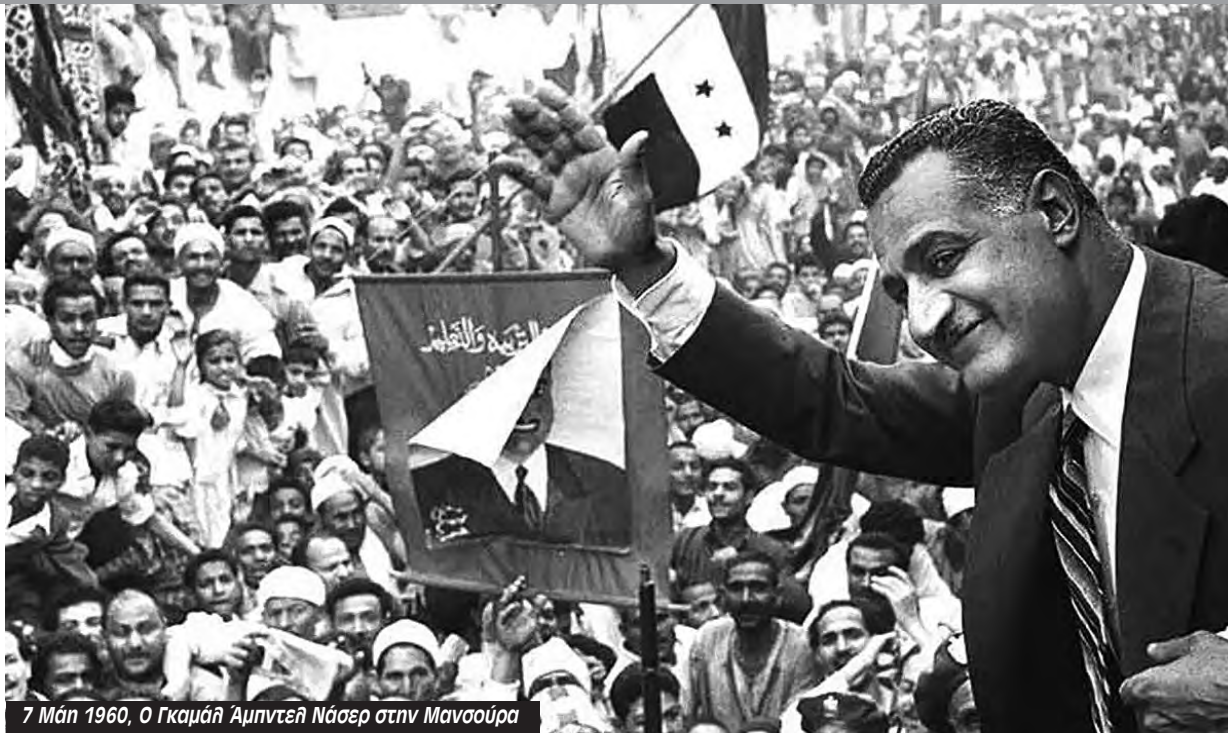
7 Μάη 1960, Ο Γκαμάλ Άμπντελ Νάσερ στην Μανσούρα

Στις 29 Οκτωβρίου οι ισραηλινές δυνάμεις εισέβαλαν στη χερσόνησο. Κι ενώ ο αιγυπτιακός στρατός ξεκινούσε να αντιμετωπίσει τους εισβολείς, η Βρετανία και η Γαλλία απαίτησαν την κατάπαυση του πυρός. Η επίθεση των Ισραηλινών αιφνιδίασε την αιγυπτιακή στρατιωτική ηγεσία. Ο Νάσερ πίστευε ότι θα κατευθύνονταν αρχικά προς την Αλεξάνδρεια. Η φρουρά στο Σινά είχε περιοριστεί σε 30.000 άνδρες, εκ των οποίων μόλις 10.000 ήταν μάχιμοι στρατιώτες πρώ-