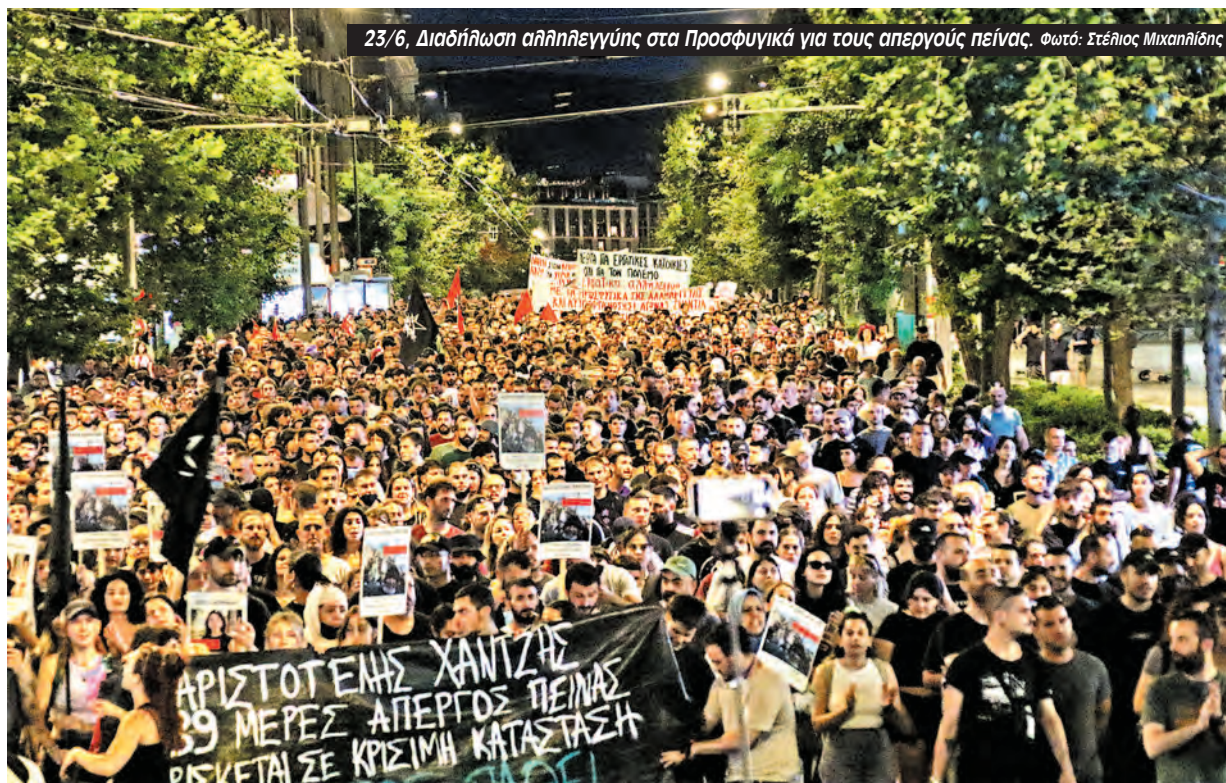
23/6, Διαδήλωση αλληλεγγύης στα Προσφυγικά για τους απεργούς πείνας.

Τα μέλη της Κοινότητας και οι απεργοί πείνας συζήτησαν κι αποφάσισαν να αντιμετωπίσουν την απόφαση αυτή ως μια σημαντική νίκη στη