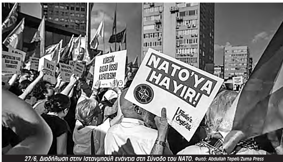
27/6, Διαδήλωση στην Ιστανμπούλ ενάντια στη Σύνοδο του ΝΑΤΟ.

συμμαχία με ΗΠΑ, ΝΑΤΟ και Ισραήλ, που αιματοκυλούν τη Μέση Ανατολή, στην Παλαιστίνη, στον Λίβανο και στο Ιράν».