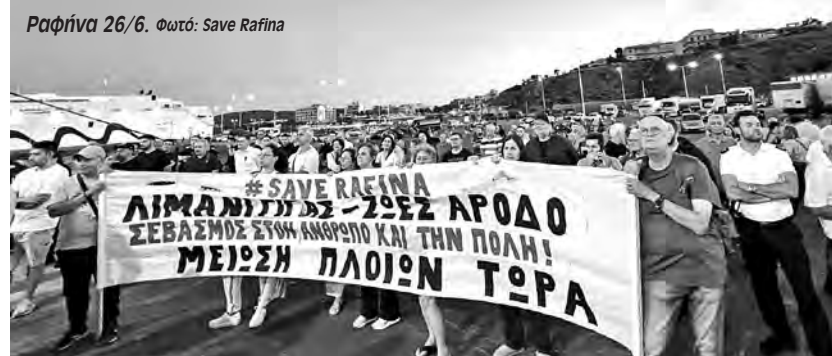
Ραφήνα 26/6.

Σε ανακοίνωσή της η κίνηση «Γη και Ελευθερία» καλώντας στην κινητοποίηση της περασμένης Παρασκευής κα-