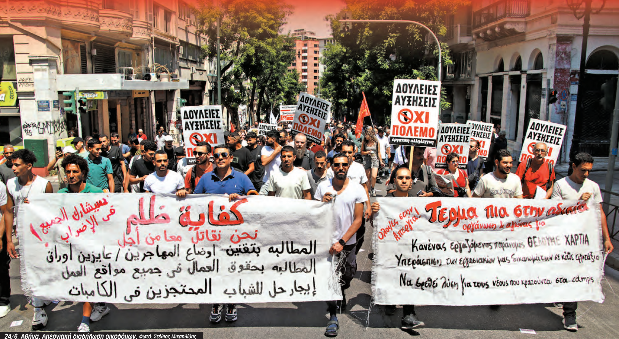
24/6, Αθήνα. Απεργιακή διαδήλωση οικοδόμων.