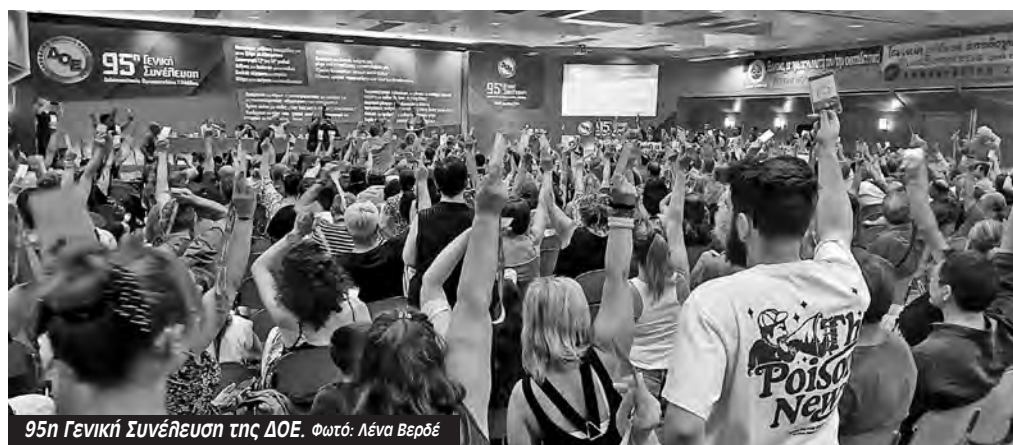
95η Γενική Συνέλευση της ΔΟΕ.

Σημαντικό ρόλο στην έκβαση του συνεδρίου έπαιξε η δουλειά των συνέδρων των Παρεμβάσεων- Κινήσεων Συσπειρώσεων και των εκπαιδευτικών του Δικτύου «η Τάξη μας». Οι τοποθετήσεις των συνέδρων, οι παρεμβάσεις δικωμένων εκπαιδευτικών, η συνεχής παρουσία και εξόρμηση, έδωσαν ώθηση στις ανατροπές του συνεδρίου. Το συνέδριο της ΔΟΕ δημιουργεί σημαντικό προηγούμενο για να κινηθεί σε αγωνιστική κατεύθυνση και η ΟΛΜΕ, ομοσπονδία των εκπαιδευτικών της Δευτεροβάθμιας εκπαίδευσης στο 22ο Συνέδριο της που ακολουθεί.