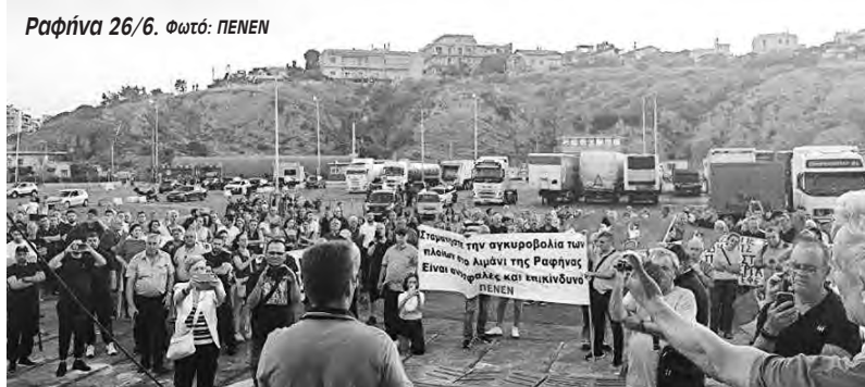
Ραφήνα 26/6.

Συγκεκριμένα, ενώ υπάρχουν μόνο πέντε θέσεις πρόσδεσης και το λιμεναρχείο επιτρέπει την ταυτόχρονη πρόσδεση τεσσάρων πλοίων, το λιμάνι της Ραφήνας μέσα στο καλοκαίρι εξυ-