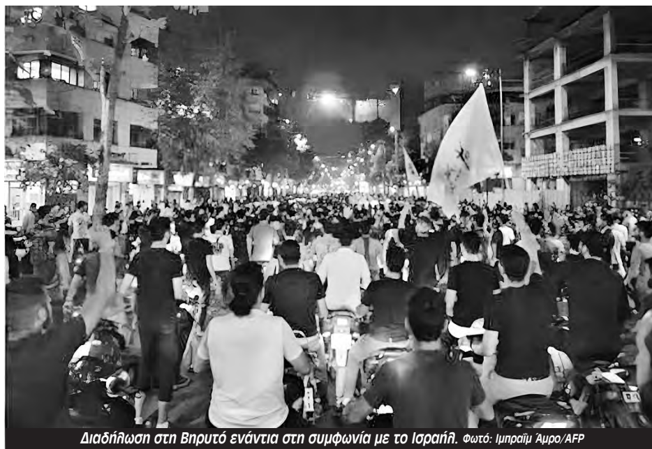
Διαδήλωση στη Βηρυτό ενάντια στη συμφωνία με το Ισραήλ.

αυτή την κατοχή -για άγνωστο πόσα χρόνια. «Μέχρι το Ισραήλ να τα προσαρτήσει τελικά», λένε κάποιοι.