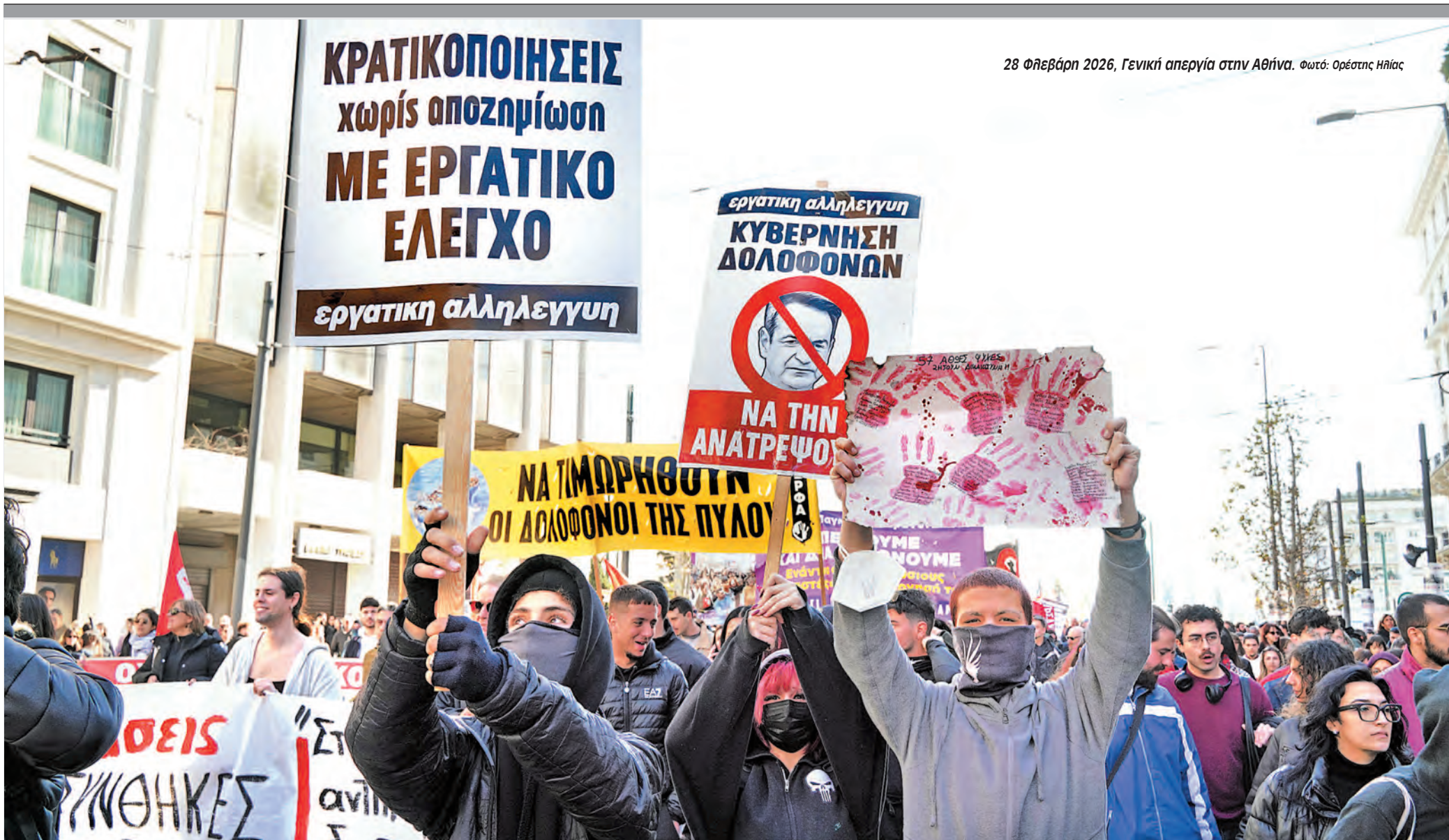
28 Φεβράρη 2026, Γενική απεργία στην Αθήνα.