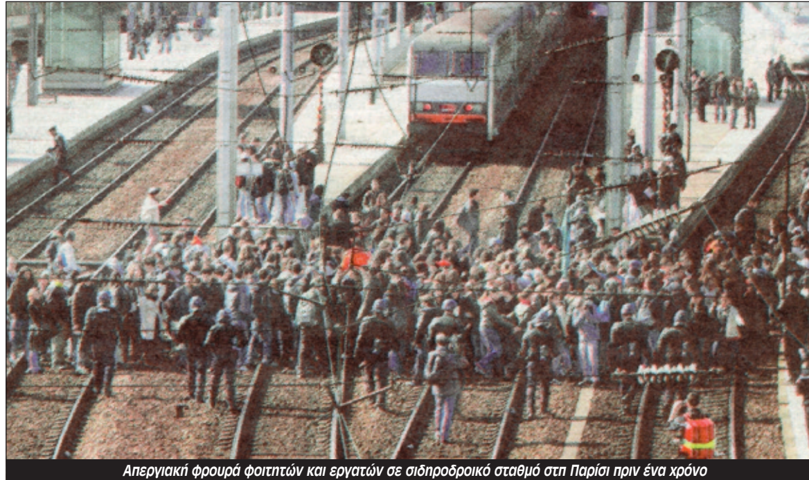
Απεργιακή φρουρά φοιτητών και εργατών σε σιδηροδρομικό σταθμό στη Παρίσι πριν ένα χρόνο

στην Γαλλία θα έχουν αποφασιστικές συνέπειες για το αν θα ξεπεραστεί αυτό το αδιέξοδο σε πανευρωπαϊκή κλίμακα. Οι απεργίες στο δημόσιο τομέα το 1995-1996 στην Γαλλία, ήταν η πρώτη μιας σειράς κοινωνικών εκρήξεων που προκάλεσαν οι απόπειρες να εφαρμοστούν νεοφιλελεύθερα μέτρα –με ξεχωριστές στιγμές τις απεργίες των εκπαιδευτικών ενάντια στην επίθεση στις συντάξεις τον Μάη-Ιούνιο του 2003 και τη φοιτητική εξέγερση τον Μάρτη-Απρίλη 2006 ενάντια στο Νόμο για τη Σύμβαση Πρώτης Απασχόλησης που πετσόκοβε τα δικαιώματα των νέων εργαζόμενων.