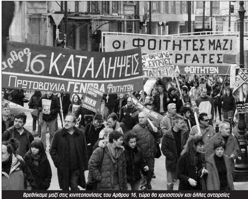
Βρεθήκαμε μαζί στις κινητοποιήσεις του Αρθρου 16, τώρα θα χρειαστούν και άλλες ανταρσίες

Η κυβέρνηση της ΝΔ μετά το χαστούκι που έφαγε από τις φοιτητικές καταλήψεις, που γκρέμισαν την «ναυαρχίδα» των μεταρρυθμίσεών της, βυθίστηκε στο σκάνδαλο των «δομημένων ομολόγων» ένα καραμπινάτο σκάνδαλο της «ελεύθερης αγοράς» και του κερδοσκοπικού καπιταλισμού. Ποιά απάντηση δίνει το ΠΑΣΟΚ για την περιουσία των Ταμείων; «Δημιουργούμε Εθνικό Κεφάλαιο Αλληλεγγύης, ένα «συλλογικό πορτοφόλι» που θα επενδύει στις αγορές με την στρατηγική και τακτική των διαχειριστών αμοιβαίων κεφαλαίων