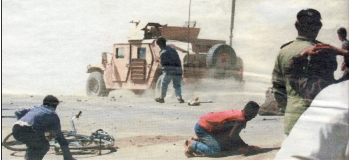
Νεαροί Αφγανοί πετροβολούν Αμερικανικό κομβόι που χτύπησε αμάχους

Η κυβέρνηση του Καραμανλή κάνει το παν για να φαίνεται έξω από αυτό το βρόμικο σκηνικό. Η ελληνική παρουσία στο Αφγανιστάν σπάνια αποκτάει δημοσιότητα. Παρουσιάζουν τους έλληνες στρατιώτες ως μια απλή "νοσοκομειακή μονάδα" και ένα "λόχο μηχανικού". Δεν πρόκειται όμως για "αστεία" εμπλοκή. Υπάρχουν περίπου 200 έλληνες στρατιώτες, αξιωματικοί και κομάντος οι οποίοι βρίσκονται ενταγμένοι στο συνολικό σχεδιασμό του ΝΑΤΟ. Ο λόχος μηχανικού έχει στη διάθεσή του 74 οχήματα, δύο αεροσκάφη C-130, τα οποία εκτελούν αερομεταφορές στο Καράτσι του Πακιστάν. Μπορεί οι έλληνες στρατιώτες να μην έχουν απομακρυνθεί από την πρωτεύουσα προς το παρόν, αλλά έχουν υποστεί ήδη δύο τραυματισμούς και μια ρουκέτα είχε εκραγεί πολύ κοντά στο στρατόπεδό τους. Η "Ελληνική Δύναμη Αφγανιστάν" κόστισε 24 εκατομμύρια ευρώ το 2006 και οι μετριοπαθείς εκτιμήσεις κάνουν λόγο για άλλα 12