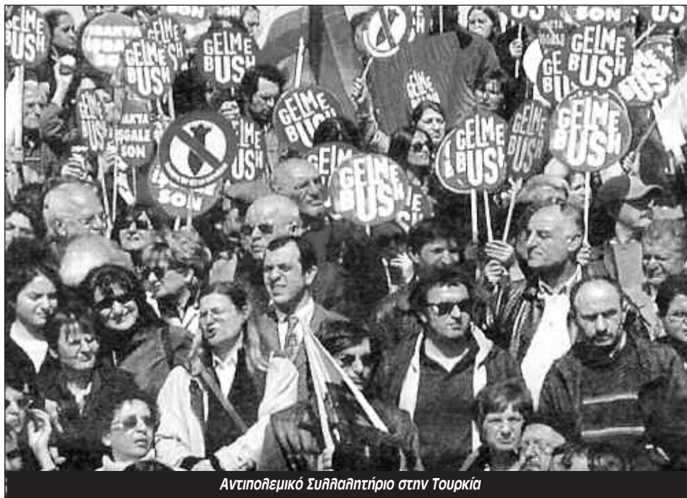
Αντιποθεμικό Συλλαλητήριο στην Τουρκία

Παρά τις μαζικές συγκεντρώσεις των “κεμαλιστών” η δύναμή τους είναι πολύ μικρότερη από ότι δείχνουν. Η διαδήλωση στην Σμύρνη πυροδοτήθηκε από τις συνταγματικές αλλαγές που προώθησε ο Ερντογκάν μετά την αποτυχία εκλογής νέου προέδρου από την Βουλή. Με βάση τις αλλαγές αυτές ο πρόεδρος θα εκλέγεται από εδώ και πέρα άμεσα από τον λαό. Οι “κεμαλιστές” διαμαρτύρονται για έναν και μόνο λόγο: γιατί ξέρουν ότι ο Ερντογκάν έχει την πλειοψηφία με το μέρος του. Κανένας δεν μπορεί να προβλέψει τι θα γίνει αν τολμήσουν να κατεβάσουν τα τανκς στους δρόμους. Ο κίνδυνος της “μπότας” είναι πολύ μικρότερος από ότι υποστηρίζουν οι σχολιαστές εδώ στην Ελλάδα.